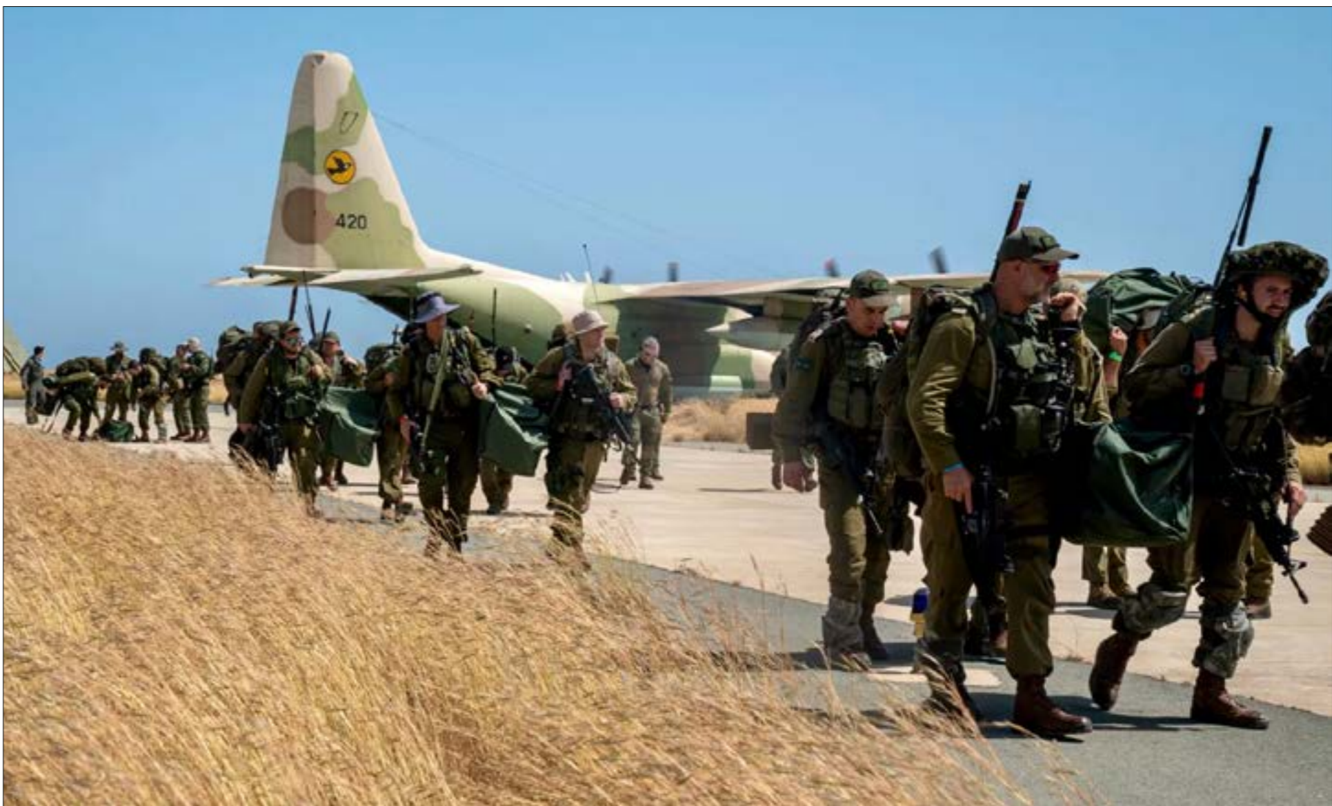
مناورات المدعو في قبرص العام 2022 (من اليمين)