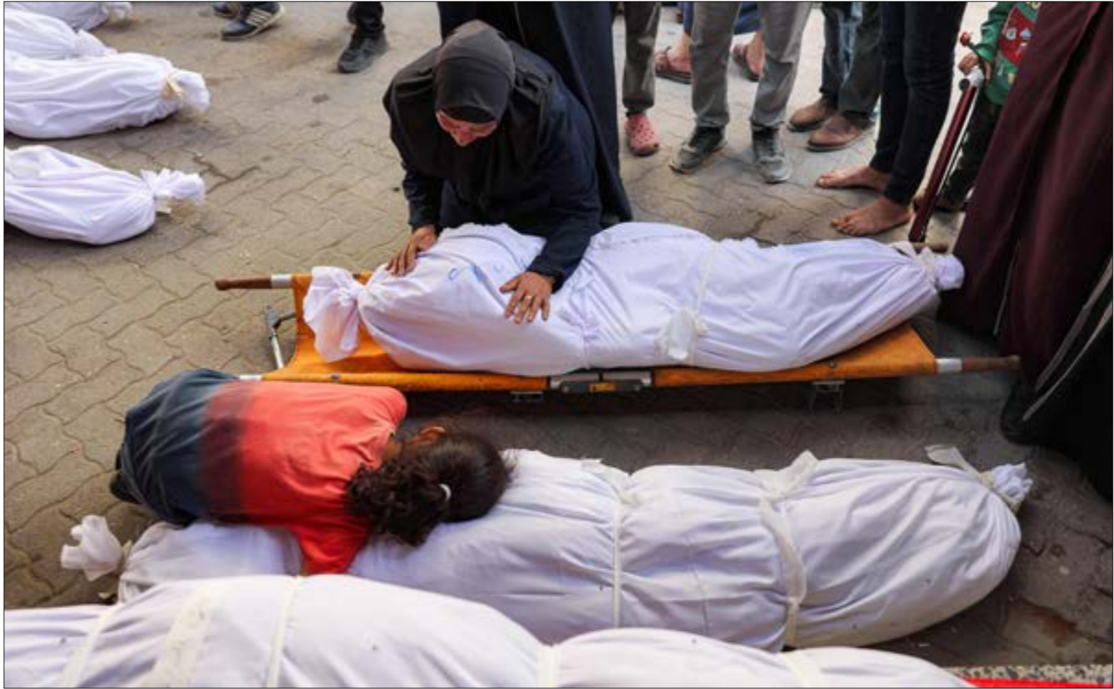
بيلاي أن إسرائيل تتخذ المسؤولة عن عمليات القتل والنهب القسري ضدّ الفلسطينيين (الف ب)