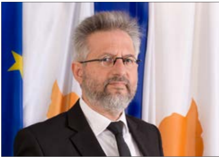
مدير الاستخبارات القبرصية تاسوس تزيونيس (من اليمين)

وزير خارجية قبرص تواصل مع بو حبيب، وترقب زيارة مدير المخابرات لبيروت قريباً