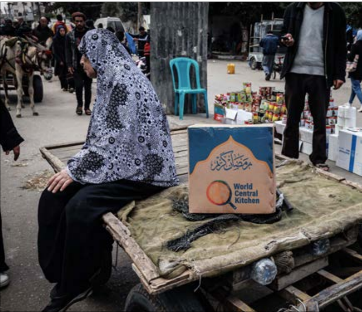
تستعد سفينة ثانية تحمل 240 طناً من المساعدات الغذائية للإبحار إلى القطاع

ويبدو أن الولايات المتحدة وإسرائيل بحاجة إلى تكريس هذه الفكرة وإنجاحها، لتكون بديلاً من «الأونروا»، ولكنها تحتاجان، لهذه الغاية، إلى العمل مع أطراف محلية لتأمين عمليات نقل المساعدات الغذائية. وفي هذا الجانب، نقلت «إسرائيل اليوم» عن مصدر سياسي إسرائيلي، قوله إنه «من خلال تأمين