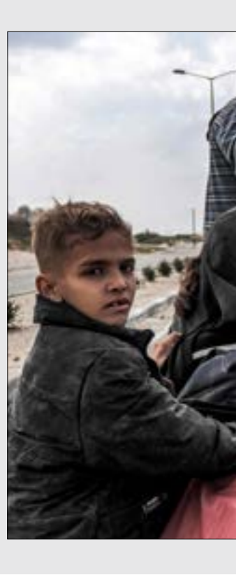
جند الاحتلال أنخذاً من نازحي مجمع الشفاء، دوماً بشرية

بندقيه «الغول» التي استخدمتها في قصص الضابط في وحدة شلأغ يتهبّسار هومان. المسؤول عن عملية اقتحام مستشفى الشفاء في مطلع تشرين الثاني الماضي. وأكدت الكتائب أنها كشفت هوية الضابط وتتبعته في أكثر من موقع عملياتي في القطاع، حتى تمكّنت من قتله كذلك، نشر «الإعلام الحربي لسرايا القدس»، مقطعاً مصوّراً أظهر مقاومي الوحدة المضادة للدروع، وهم يطلقون صاروخاً موجّهاً من طراز «ملوتكا» على تجمع لجنود الاحتلال شرق المحافظة الوسطى. ووُزعت «كتاب شهداء الأقصى» بدورها مقطعاً مصوّراً يُظهر تمكّن مقاوميه من قصف تحصنات العدو في مدينة غزّة بقذائف الهاون وصواريخ «107».