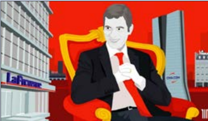
الوقت وحده كفيك بتظهر الخطوط التحريرية الجديدة لمنصات رودولف سعادة الإعلامية