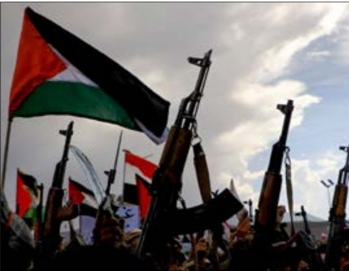
عقدت القيادة العسكرية، الانتقالي، رفضت الدعوات لفتح «انصار الله»

يجري إدخالها عبر الشركة تدفع أمالاً أخرى على الجانب الفلسطيني من المعبر. لا بل إن استعمار «هلا» للكارثة الإنسانية، جاء على حساب المورثيين