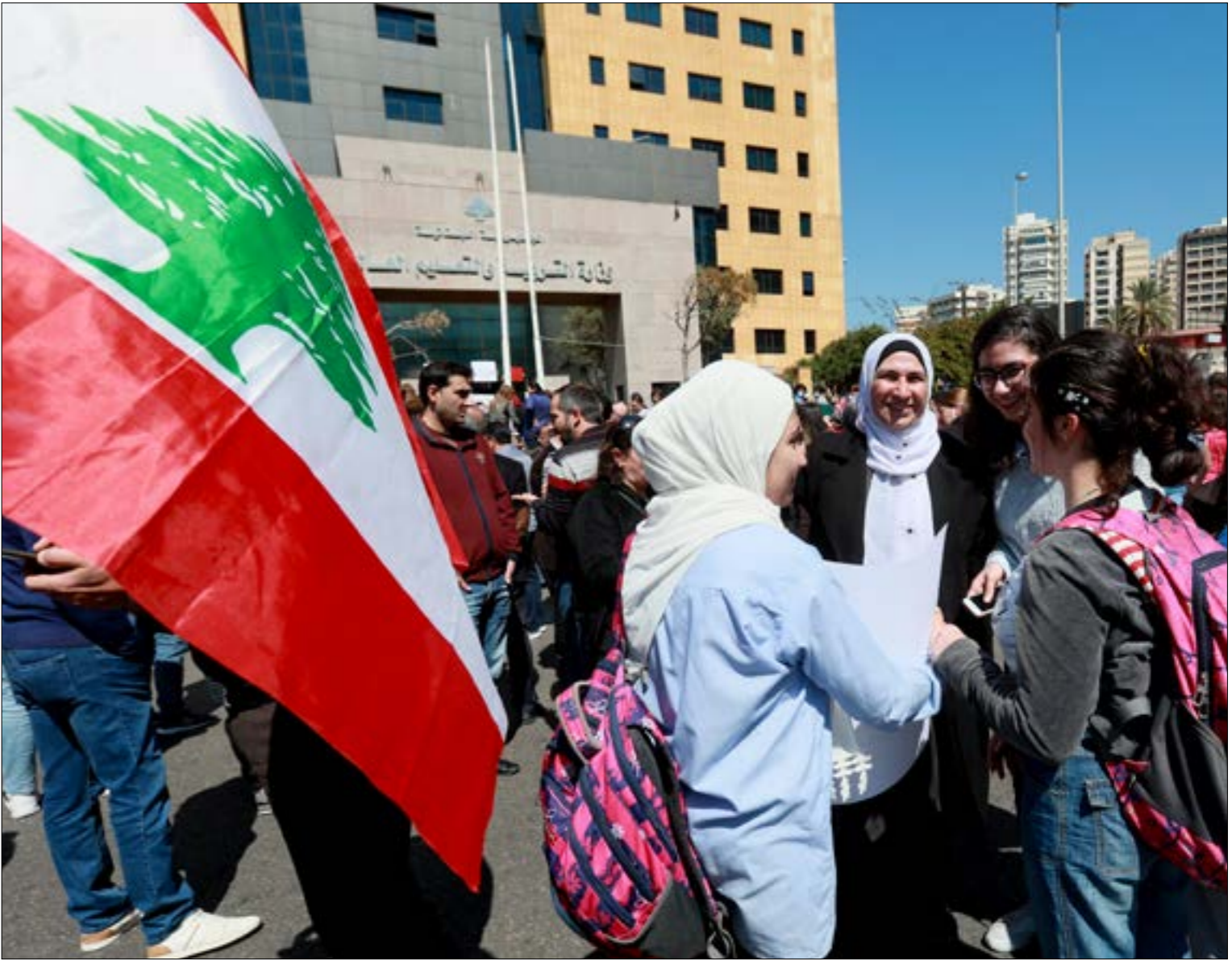
الضبط يصبح من دون حشوه مع اقتراب نهاية العام الدراسي (مروان بو حيدر)