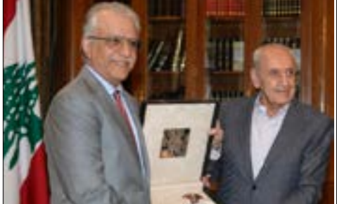
توقيع رئيس الاتحاد الآسيوي الى سوريا بعد زيارته عين التينة

بوصلة الاندية سنتجه بلا شك الى سوريا والعراق تماماً كما هو الحال في الماضي البعيد عندما شكّل الدوري اللبناني ملأذاً مثيراً للاهتمام لنجوم البلدين الذين تزكوا بصفات لا تنسى فيه. لكن الحال