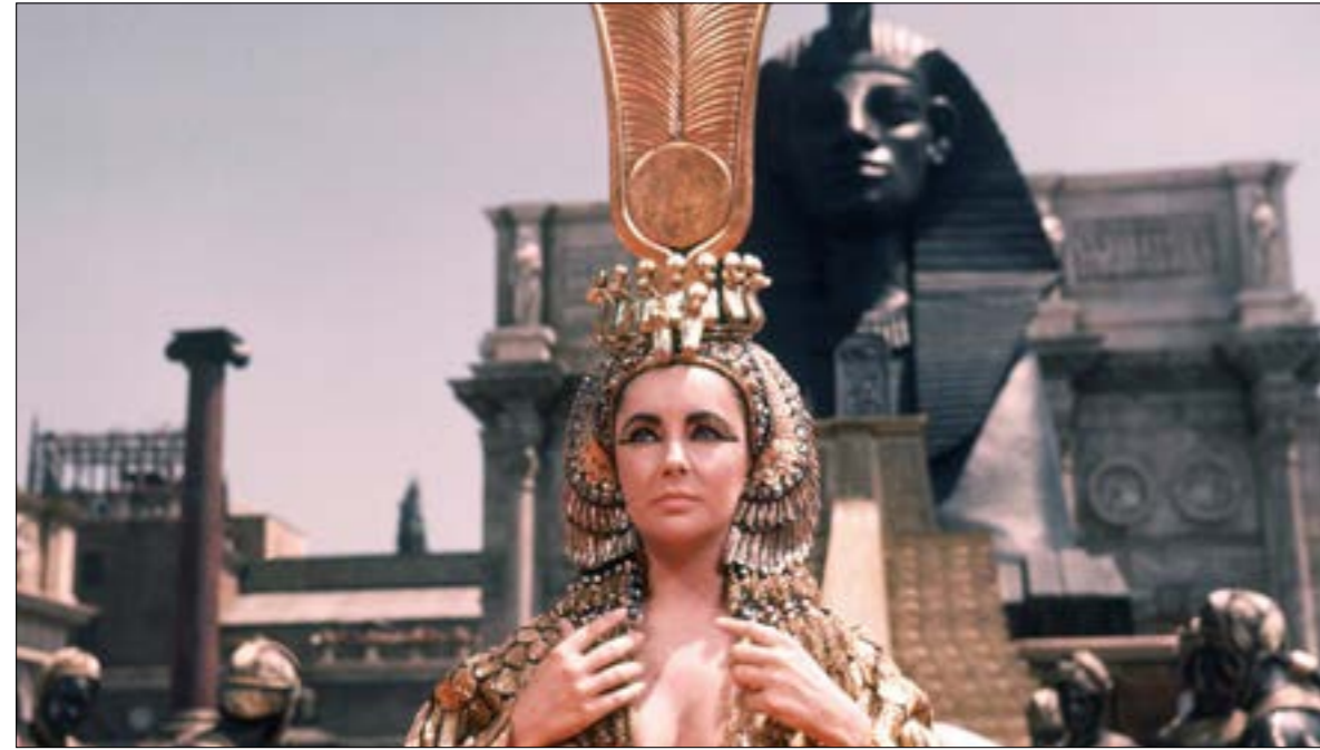
لا تسمع فرقة عندما تولت ممثلات بطولات تقديم شخصية كليوباترا. تمت فيمت البرازيل تايلور في عام 1963

لا جدال فيها، بما في ذلك النسب المقدوني اليوناني لسلالة والدها، وأن اليونانيّة كانت لغتها الأولى، أو في الملتبسات، بما في ذلك هوية والدها ولون بشرتها، وما إذا كانت بمتوتها انتحاراً. تتخلل المشاهد تعليقات من خبراء متخصصين ومؤلفي كتب وأبحاث عن كليوباترا مثل شيلي هالي، الأستاذة المتقاعدة في الدراسات الكلاسيكية والأفريقيّة ومستشارة المسلسل، وديبورا هيرد، الباحثة في علم آثار النوبة، وسالي أن اشتون المتخصصة في الدراسات عن كليوباترا، وإسلام عيسى (من أصل مصري ومؤلف كتاب «التأثير الهائم للإسكندريّة القديمة»)، وغيرهم. تعطي هذه التعليقات المحترفة قيمة ممتازة للعمل ككل، سواء في ما يتعلّق بالحقائق التي