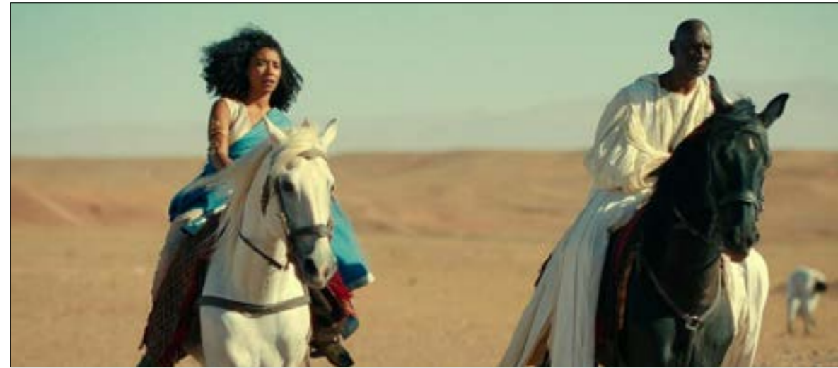
مشهد من «الملكة كليوباترا»

لروما من كونها عدواً. ومع كونها موضع شغف جسديّ لآثنين من أهم رجالات روما التاريخيين، لم تكن رخصه كما تصوّرها بعض المصادر التاريخيّة الرومانيّة، بل قائدة قوية وذكية وحازمة، تعرف ما تريد لنفسها، ولسلالتها الحاكمة، ولبلاد التي تحكمها، وتتصرف في إطار ثقافة سلالتها، وطبقتها وزمّنها.