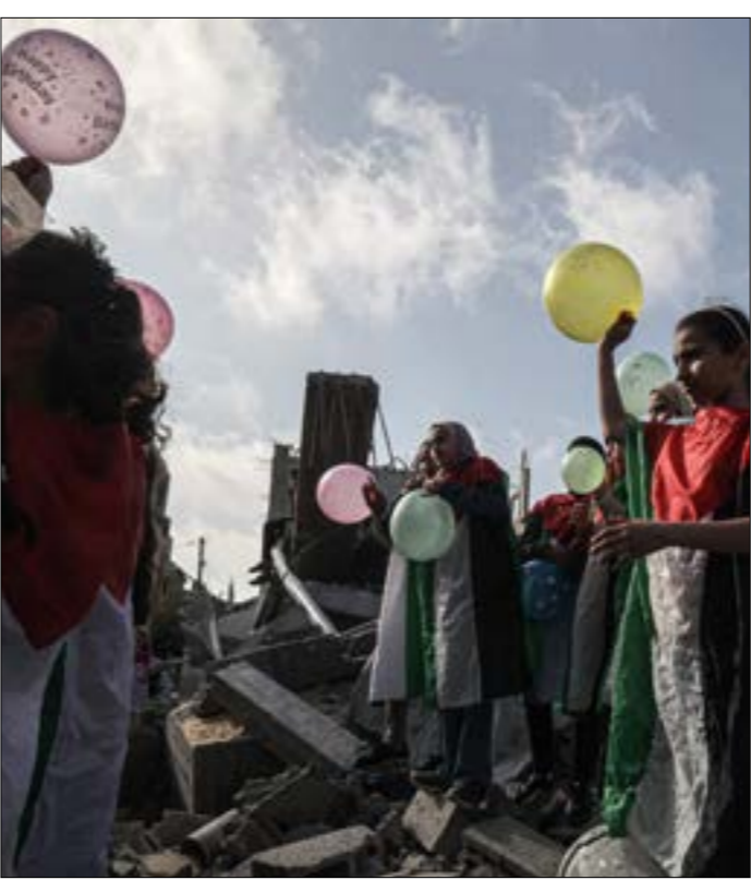
بارد العدو له يد، الجولة انطلاقاً من تقديرات معيّنة لمداهما الزمني وساحتها وإمكانية اختوائها

يُضاف إلى ما تقدّم أن قيادة العدو، في الأصل، بادرت إلى بدء الجولة انطلاقاً من تقديرات معيّنة لمداهما الزمني وساحتها وإمكانية اختوائها، إلّا أن المقاومة استطاعت فرض دينامية عملياتية معادية لما خطّط له إسرائيل، وهذا ما سيخضّر بالضرورة في حسابات الاحتلال لدى دراسته أيّ خيار عدواني مشابه لاحقاً. إذ يُتوقّع أن يكون أكثر حساسية وخطراً من أيّ مواجهة فصيل مع غزّة يمكن أن تمتدّ أكثر مما هو محسوب، وأن تندرج في مواجهة أكبر. ومع أن العدو وضع تحديد حركة «حماس» كإحدى أولوياته