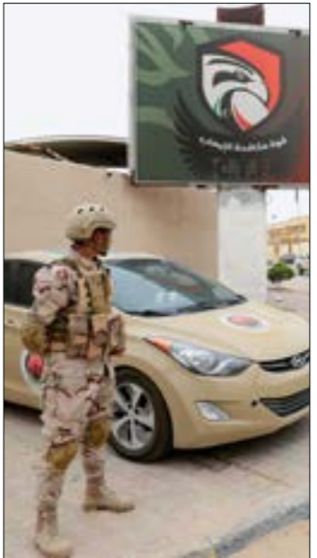
تمثّل الأزمة الراهنة في السودان تحدياً لحالة الأمن في ليبيا

عات وواشنطن، محدّداً، إلى سياستها الأثرية المتمثلة في إدامة الصراع نحو ليبيا، إنّما لشدّ أطراف الصراع نحو مواقف تفاوضية معيّنة، أو لتوظيف الأزمة في ملفّات إقليمية أخرى خدمة لمصالح واشنطن المباشرة. ويلاحظ هذا التحوّه، بالأساس، في تراجع مستوى الاهتمام الدبلوماسي الأميركي بمسار التسوية في ليبيا، وفق ما أظهره لقاء السفير الأميركي، ريتشارد نولان (7 مايو)، مع الرئيس التشادي الانتقالي، محمد ديبلي، وأيضاً ما شهدته القاهرة، في الوقت نفسه (8 أيار)، من زيارة لوفد رفيع المستوى من الكونغرس الأميركي برئاسة مايك تيرنر (مسؤول الاستخبارات)، بهدف تعزيز الإسهام المصري في ملفّات عمدة من بينها «استقرار الوضع في ليبيا»، ومن شأن انحصار أجندة الاهتمام الأميركي ليقترص على مسألة الاستقرار في ليبيا، وإعادة الأخيرة إلى المربع صفر، في وقت يتناكّد فيه وجود تاكل حادّ في مسار التسوية السياسية، والذي كان مقرراً الدفع به منتصف العام الجاري على الأقلّ. كذلك، فإن توسع صلة حفتر بالترتيبات الإقليمية الدولية، وتعاظم دوره المرتقب في خدمة أطراف دولية وإقليمية على نحو يتناقض مع مصالح الدولة الليبية، يثيران شكوكاً حقيقية في غمّة واشنطن في دفع الحل واستحقاقاته الانتخابية والدستورية.