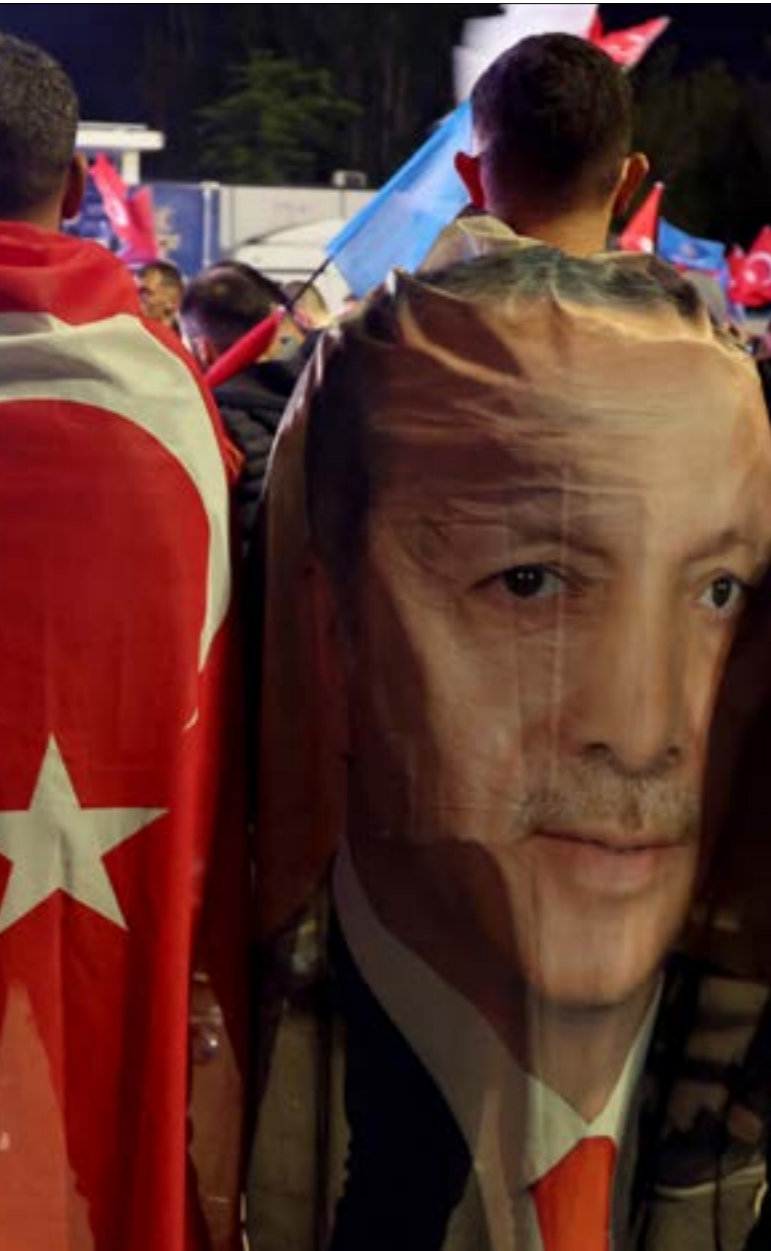
لم يكن متوقّعا ان يلاسن اردوغان عتبة ال750، فيما كانت التوقعات تشير إلى احتمال حصول كيليتشدار اوغلو على اقل من 745

بعد أن تمكّنت من تفكيك معظم الفصائل «الجهادية» التي كانت تصارعها في ادلب، وحلب، ابرزها دير حسان، كبيرة من «الجهاديين» غير السوريين إلى خارج سوريا، وسجن السوريين إلى خارج سوريا، وسجن هذه الحملة بعد عمل استمر نحو آخرين، سُنّت «هيئة تحرير الشام».