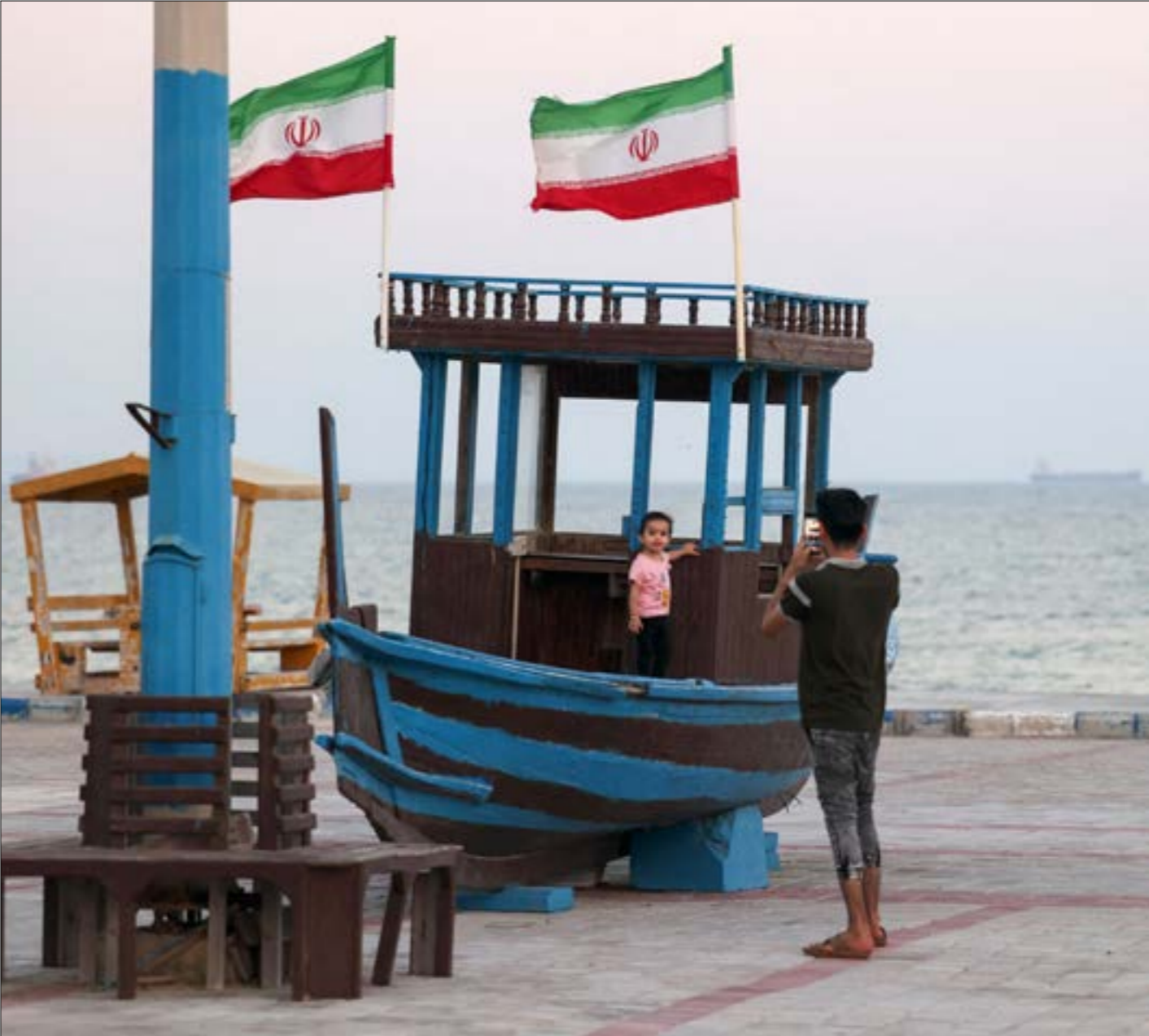
تصهّب بعض الأوساط السياسية والإعلامية في إيران إلى القول إلى زيارة السلطان تشكّل «أخر محاولة لجيا، الائتلاف النووي، (أ ف ب)

ويرافق سلطان عمان في زيارته، عدد من الوزراء المعنيين بالحقل الاقتصادي، حيث سجري التوقيع على اتفاقات ثنائية عديدة، لكن هذا الجانب لا يعدّ الأكثر أهمية في الزيارة، بل اندراجها، وفق ما يرى كثيرون، في إطار الدور الذي تضطلع به مسقط في تحياد الرسائل بين إيران وأميركا. إذ في غياب العلاقات الرسمية بين طهران وواشنطن، تولت عمان، منذ عهد طویل، نقل هذه الرسائل أو حتى استضافة المحادثات السرية التي جرت بين دبلوماسيين إيرانيين وأميركيين في وقت سابق، من مثل تلك التي سبقت باسهر المحادثات العلنية بين إيران ومجموعة «5+1»، والتي أفضت إلى