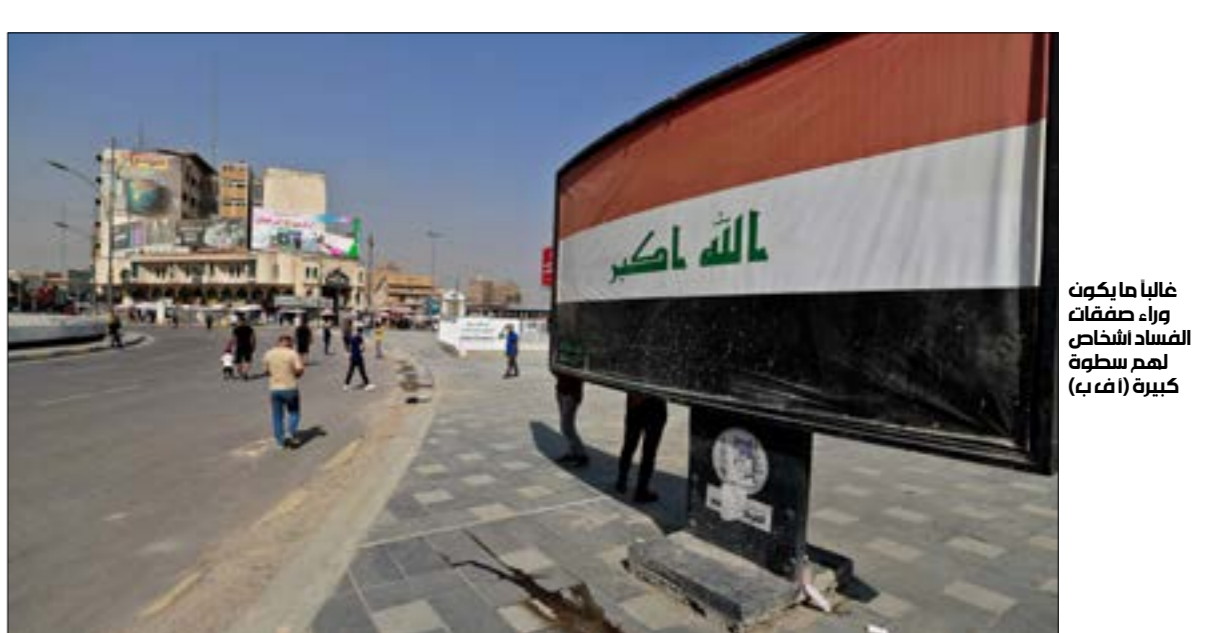
غالباً ما يكون وراء صفقات الفساد الأشخاص لهم سطوة كبيرة (ف.ب)

فيما يستعدّ رئيس حكومة تصريف الاعمال العراقية مصطفى الكاظمي، لتسليم المنصب إلى خلفه محمد شيام السوداني. تتفاعل فضيحة الفساد الكريه التي تكشّفت اخيرا وشملت اختلاس أكثر من 2.5 مليار دولار من امانات «الهيئة العامة للضرائب» المودعة في مصرف الراجديت. وعلى رغم استدعاء عدد من مسؤولي الهيئة إليه للتصيف. إلا ان خبراء يشكّون في ان تطه التحقيقات إلى نتيجة خاصة على صعيدإعادة الاموال المسروقة