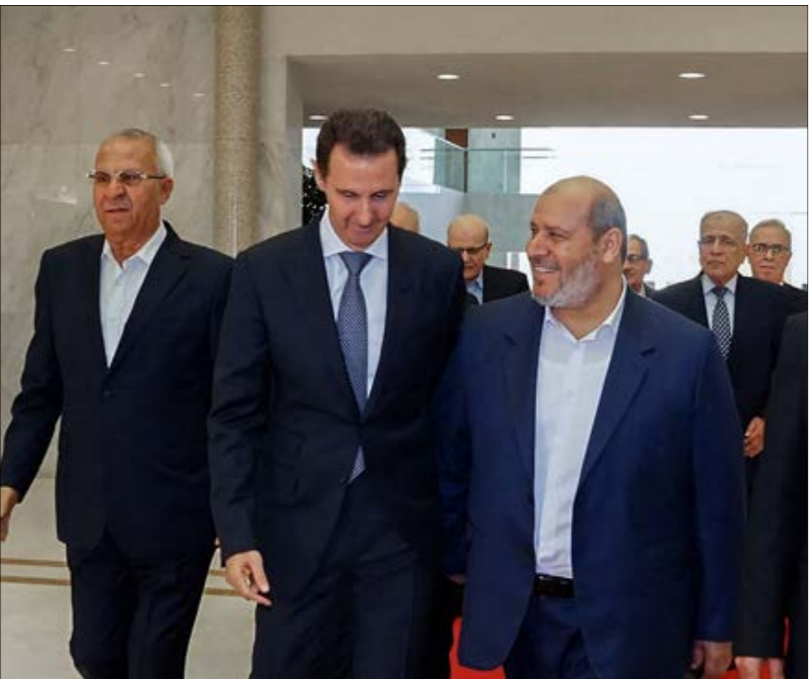
استمرت زيارة وفد «حماس»، لساعات عدّة، أجرى خلالها سلسلة لقاءات مع المسؤولين السوريين

وركزت رئاسة الجمهورية السورية، في جبهتها، أكدت «حماس»، في مؤتمر صحافي عقب اللقاء، «(أننا) اتفقتنا مع الرئيس الأسد على طي صفحة الماضي»، لينفتح بذلك الباب أمام عودة تمثّل الحركة في دمشق