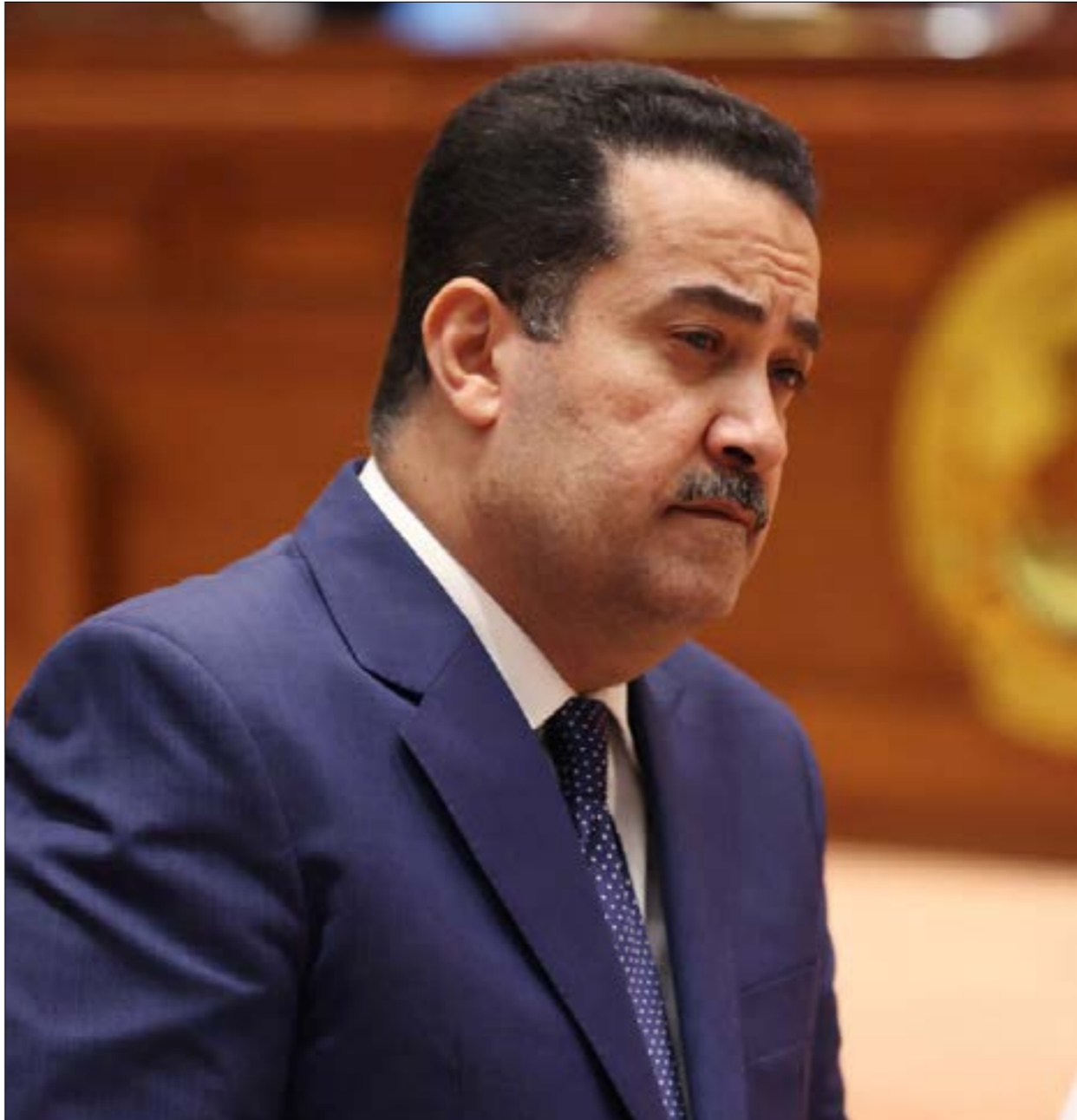
تسير مفاوضات لتشكيل الحكومة نحو إنجاز سهل وسريع

على رغم إعلان «تحالف إدارة الدولة» الذي يضمّ جميع القوى الفاعلة باستثناء «النّيار الصدري»، بعد اجتماع له أوّل من أمس، أنه سيطلب عقّد جلسة لمجلس النواب بعد غدٍ، للتصويت على الثقة بالحكومة. ما يعني عليها أن التشكيلة صارت جاهزة أو في