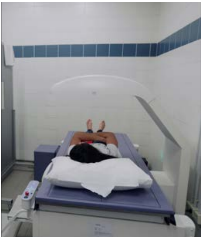
يقدم المركز الخدمات الصحية لحوالي 3500 مراجع شمرباً (صراثب بو حيدر)