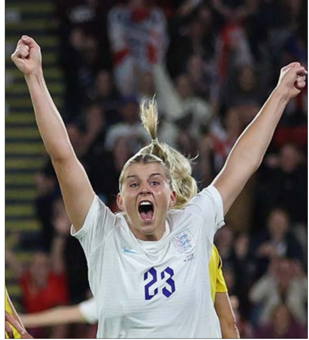
ارتفع مستوى الحضور الجماهيري عالمياً في مباريات كرة القدم للسيدات (الرياضة)

احتلت الأخبار الخاصة بكرة القدم للسيدات العناوين العريضة في الأعمار القريبة الماضية، وهو ما دفع الكثير من المستخدمين من اللعبة الشعبية الأولى في العالم إلى الدفع باتجاه إيجاد مساحة للنساء في أي شيء يخضع الكره هو أمر بدأ حديثاً على أعلى المستويات، والدليل ما أقدمت عليه مجلة «فرانس فوتبول» التي اشتهرت بمنح جائزة الكرة الذهبية للاعب الأفضل سنوياً عبر خلقها جائزة مماثلة للاعبة الأفضل قبل ثلاثة أعوام أي بعد 62 عاماً على تقديمها أول «بالون دور» للنجم الإنكليزي ستانلي ماتيويز. طبعاً الكل يحاول الاستفهام اليوم من الضجة الإعلامية المحيطة بكرة القدم للسيدات، وذلك انطلاقاً من المساواة التي نادت بها المجتمعات لدرجة وصلت فيها المطالبة بمنح نفس أجور الرجال للجنس اللطيف