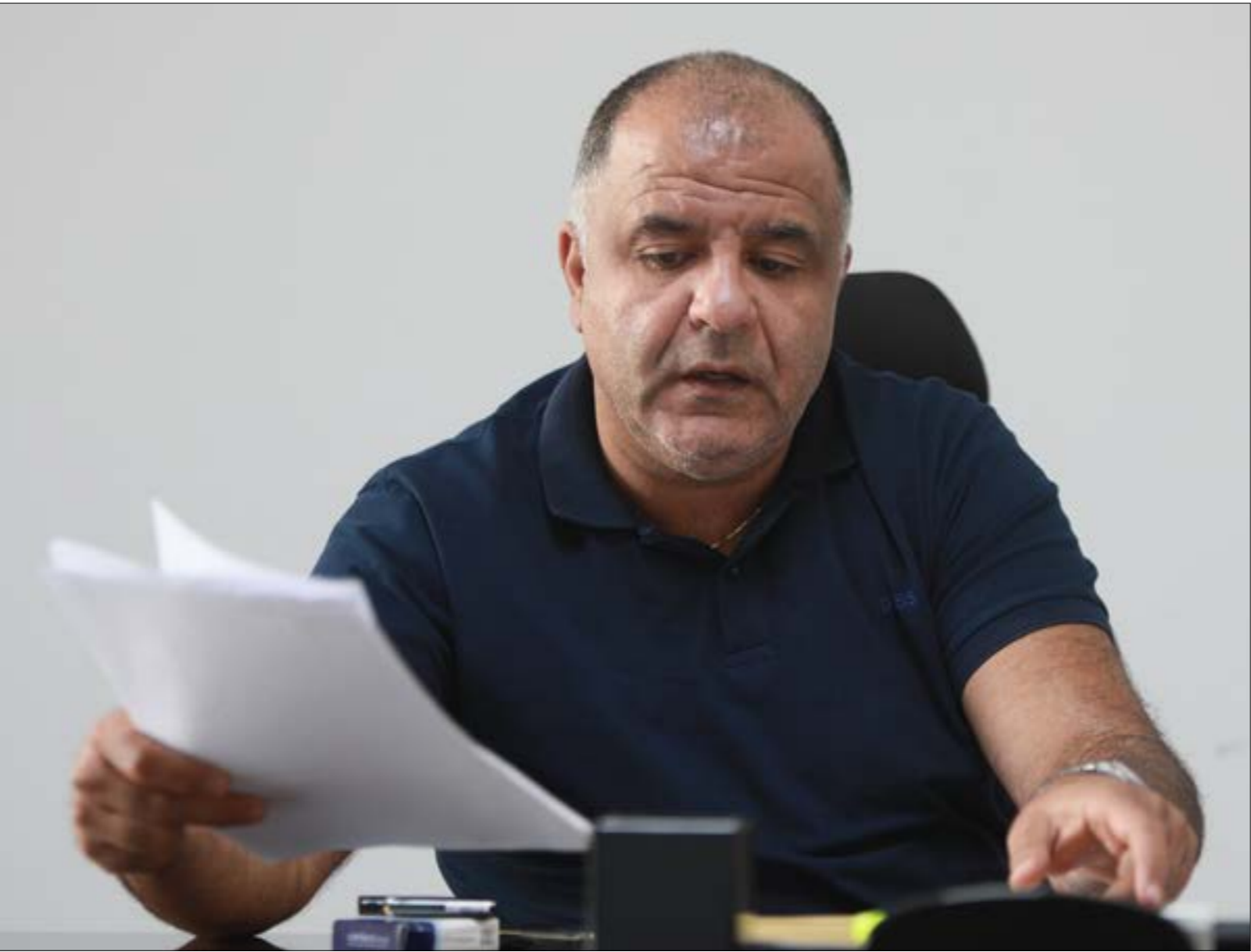
حداد: الصندوق مسوؤله عن تأخير الطبية لما يقارب 11 ألف مستفيد (صراثب بو حيدر)

الأساتذ 15% من السعر مباشرة فيما يتكفل الصندوق بالباقي، مصلحة بالاستمرار في هذه الصيغة، سواء بالنسبة إلى الأمراض العادية أو الأمراض المزمنة والمستعصية». والمشكلة الكبرى، كما يقول، تكمن في الأدوية السرطانية التي يغطي الصندوق تكلفتها بنسبة 100%، وفق تعرفه وزارة الصحة، «لكن ما حصل أن جزءاً كبيراً من هذه الأدوية بقي مدعوماً، في حين أن بعض الحاد في أسعار الدواء، فهناك دواء تضاعف سعره 15 مرة وآخر 25 مرة، و«لم تعد الصيدليات التي نبرم معها عقوداً، والتي تدفع بموجبها