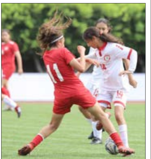
(الاتحاد اللبناني لكرة القدم)

ثقافة الجمهور وطبيعة تصرفاته تختلف تماماً في الملعب بالنظر إلى «الأجواء العائلية» التي تطبع المباريات غالباً ولأن النساء بطبعهن لا يقمن بأعمال جنونية على أرضية الميدان يمكن أن تستغفر الجمهور، كمحاولة خداع الحكم أو مهاجمته مثلاً أو ضرب الخصم عدماً بطريقة مؤذية، أو حتى التوجّه إلى الجمهور بطريقة تنير غيظه.