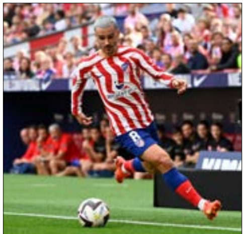
عاد غريزمان حقا 20 مليون يورو (اف 8)

تعاقد أتلتيكو مدريد الإسباني نهائياً مع المهاجم الفرنسي الدولي أنطوان غريزمان أمس الإثنين مقابل 20 مليون يورو، بعد عودته إلى صفوفه من مواطنه برشلونة. وقال نادي العاصمة في بيان «وقع غريزمان عقداً يربطه بنا لدينا حتى 30 حزيران/ يونيو 2026».