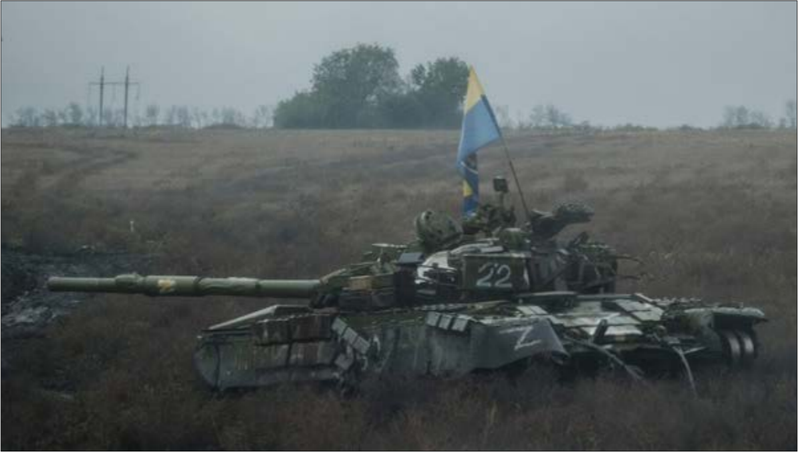
جاءت الضربة بعد ساعات على توجيه روسيا الأتباع رسمياً إلى أوكرانيا بالوقوف خلف تفجير جسر القرم

تغيير العملية العسكرية الخاصة أو إعلان حالة الحرب في بعض مناطق روسيا». وأشار إلى أن الرئيس الروسي قد يلتقي نظيره دميتري ميدفيديف، أن الضربات الصاروخية ليست إلا «الحلقة الأولى، وستكون هناك حلقات أخرى»، مشيراً، في تعليق عبر قناته مع إردوغان مقترح إجراء روسيا حواراً مع أربع دول غربية في تركيا. يأتي ذلك بعدما جرى تداول معلومات عن مقترح قُدّمته أنقرة إلى واشنطن، لإجراء مفاوضات بين