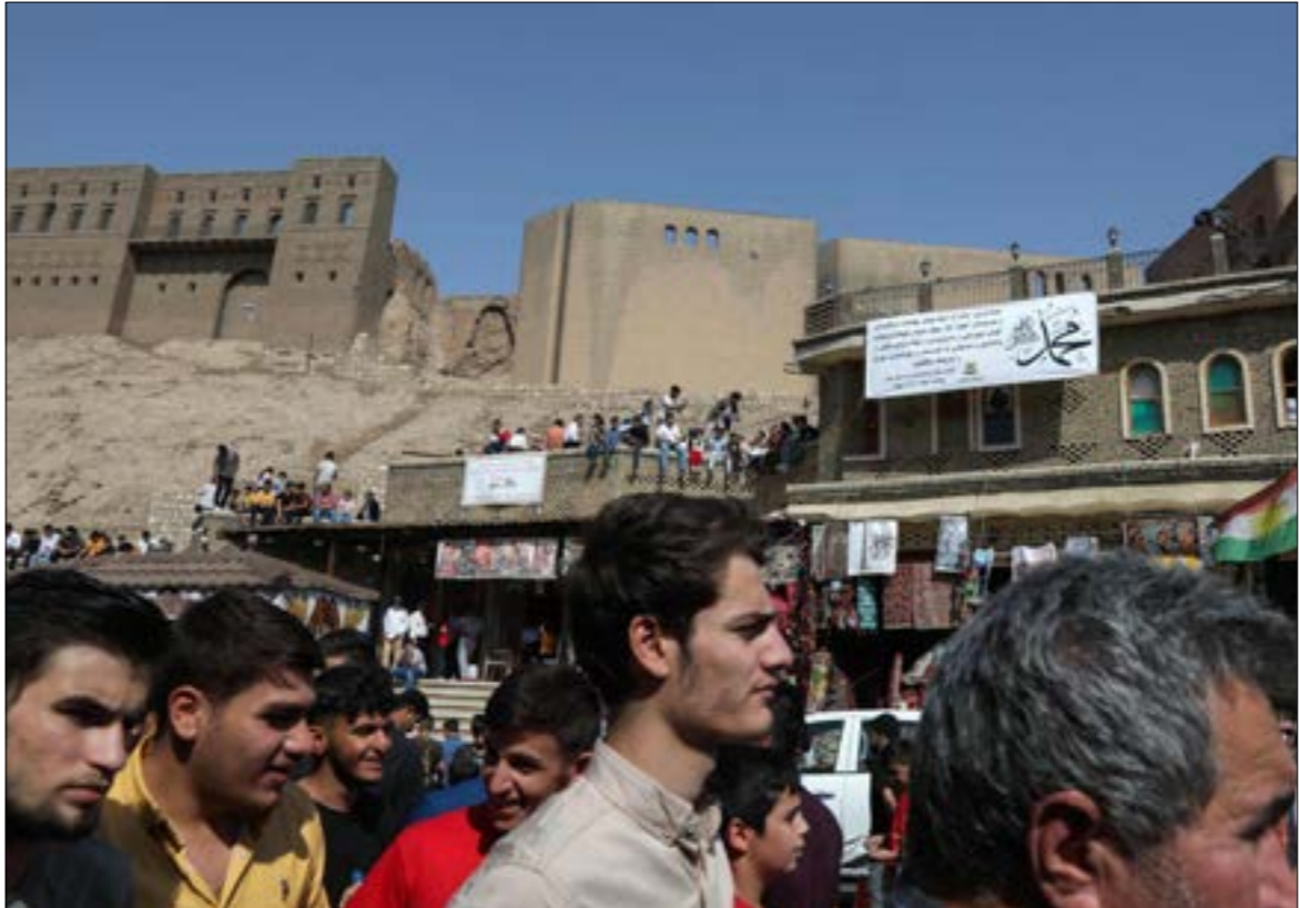
تظك عناصر الأزمة قائمة بعد عام على الانتخابات التي أفضت إلى نتيجة غير حاسمة

ولذا، تظلّ عناصر الأزمة قائمة بعد عام على الانتخابات التي أفضت إلى نتيجة غير حاسمة، بمعنى أنها لم تعطِ أيّ طرف غالبية كافية لتشكيل السلطة بفرده، وهو الوضع الطبيعي في العراق المشكّل من «مكوّنات» دينية وطائفية وعرقية متنوّعة. وحتى لو أُعيدت الانتخابات اليوم، فمن غير المرجح أن تعطي طرفاً واحداً مثل هذا التفويض، بل ربما تؤدي إلى مزيد من التشتّي، بالقياس