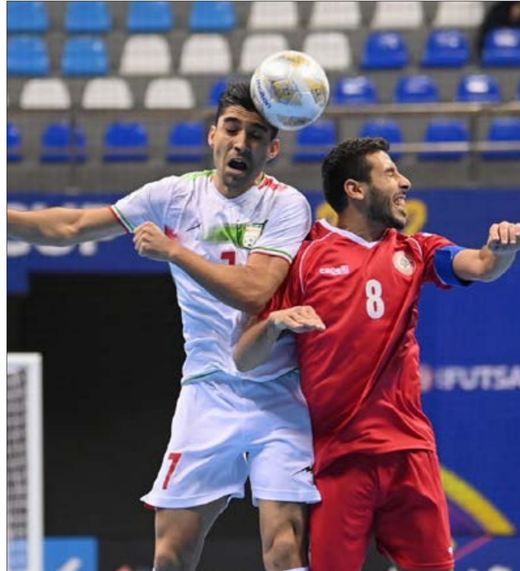
أول أسباب النكسة الآسيوية هو تراجع مستوى الدوري بشكل كبير

أسدك الستار على كأس آسيا لكرة القدم للصالات التي استضافتها الكويت وقازت بلقبها اليابان على حساب إيران. بطولة شهدت خيبة لبنانية قلّت نظيرها. تتخذ الباب على ضرورة إعادة دراسة وضع اللعبة المتراجعة سنة بعد أخرى حتى أصبح المنتخب مجرد جسر عبور للانتخابات المناهضة، التي تثار منه بكل قوتها اليوم بعدما كان قاهرًا للكثيرين منها في زمن مضى إلى غير رجعة بحسب المؤشرات