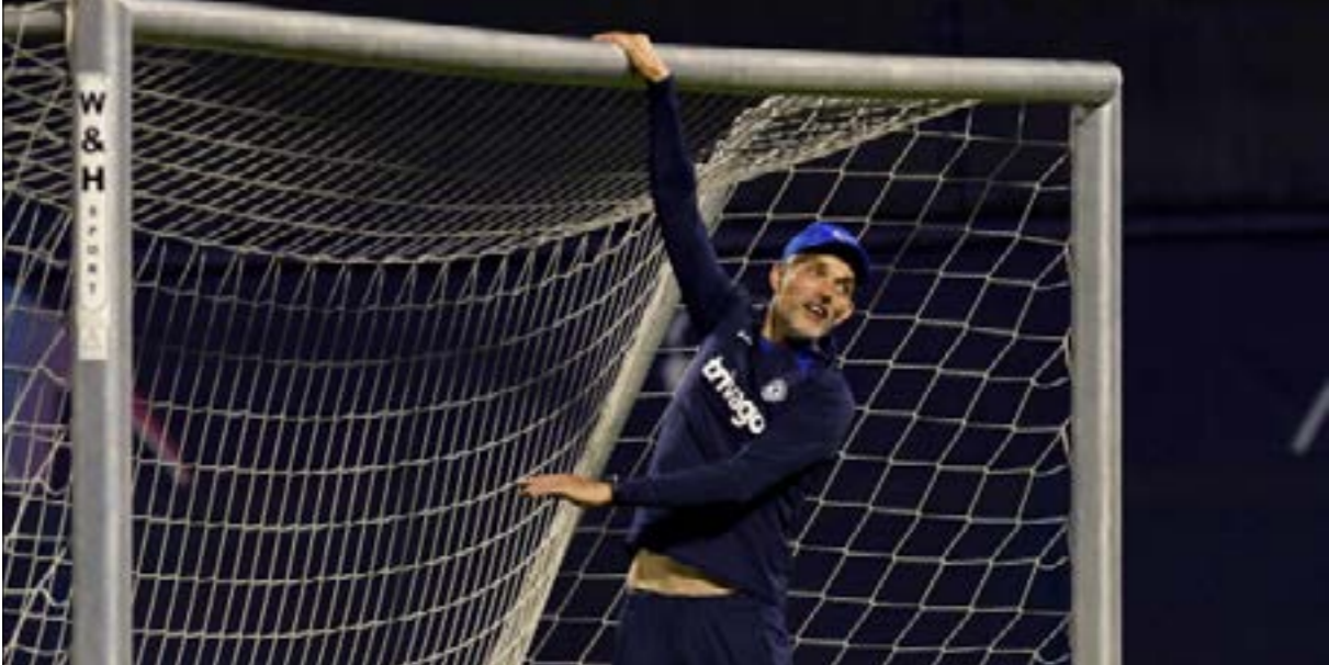
أفك توهيك قبل يومين

المدير الرياضي هو نفسه أحد ملاك النادي. كان بولي يرغب بالتعاقد مع كريستيانو رونالدو بعد لقاء وكيل أعماله خورخي مينديز في البرتغال، لكن مدرب تشيلسي أبدى معارضته للصفقة المحتملة. أتد بولي موقف مدربه الرئيسي في نهاية المطاف لكن العلاقة توترت أكثر بسبب انتقاد توهيل علناً لعدم تقديم تشيلسي في الانتقالات بعد الخسارة (0-4) أمام أرسنال. أشار الموقع أيضاً إلى وصف بولي مدرب فريقه توهيل علناً أمام شخص ذو نفوذ في الدوري الإنكليزي بأنه «كابوس» عندما يجب التعامل معه بشأن الصفقات. وبعد أن خسّر تشيلسي خارج أرضه أمام ليدز يونايتد في الدوري، توقف توهيل والملاك الجدد عن الحديث. من الأمور التي أسهمت في قرار الإارة الجديدة أيضاً، ملاحظة تراجع نشاط توهيل في تواصله مع اللاعبين وقلة لغته في التدريب مقارنة بالاشهر الأولى من تعيينه مدرباً لتشيلسي. أعاد البعض الأمر إلى مشكلات شخصية من بها المدرب الألماني خارج الملعب.