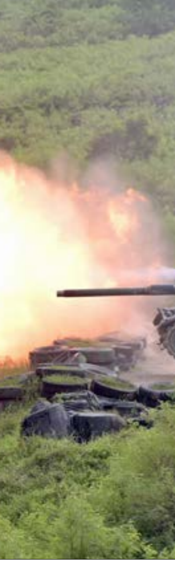
انعام صفقة تسليح جديدة لليونان، بقيمة 1,1 مليار دولار، الاربغية صونا (اف ب)

الوضع في سوريا إلى طبيعته ليست قريبة، يقول إردوغان إن على تركيا أن تتعاد ظروف بقاء اللاجئين، مضيفاً إن «المشكلة بدأت عندما فهم المواطن التركي أن السوريين لا يريدون العودة، وعندما بدأ الوضع الاقتصادي في الانهيار، والحكومة لم تأخذ على محمل الجدّ شكوى المواطنين». ويرى أنه «حتى لو اتّخذت الحكومة قراراً بترحيل السوريين، فإن تنفيذه ليس بهذه السهولة. إذ إنّ 90% من الأتراف على اقتناع بأن اللاجئين لن يعودوا إلى بلادهم، المعارضة تستفيد من شكوى الشارع التركي، أقا الحكومة فليست في وارد ترحيلهم ما لم تتغيّر السلطة القائمة في سوريا. كما أن هناك أكثر من 750 ألف طالب سوري في المدارس التركية، ومثلهم قد وُلدوا في البلاد، ونصف الأشخاص القادرين على العمل من اللاجئين السوريين يعملون، وهذا كلّه يقلّل من نسبة الذين يرغبون في العودة».