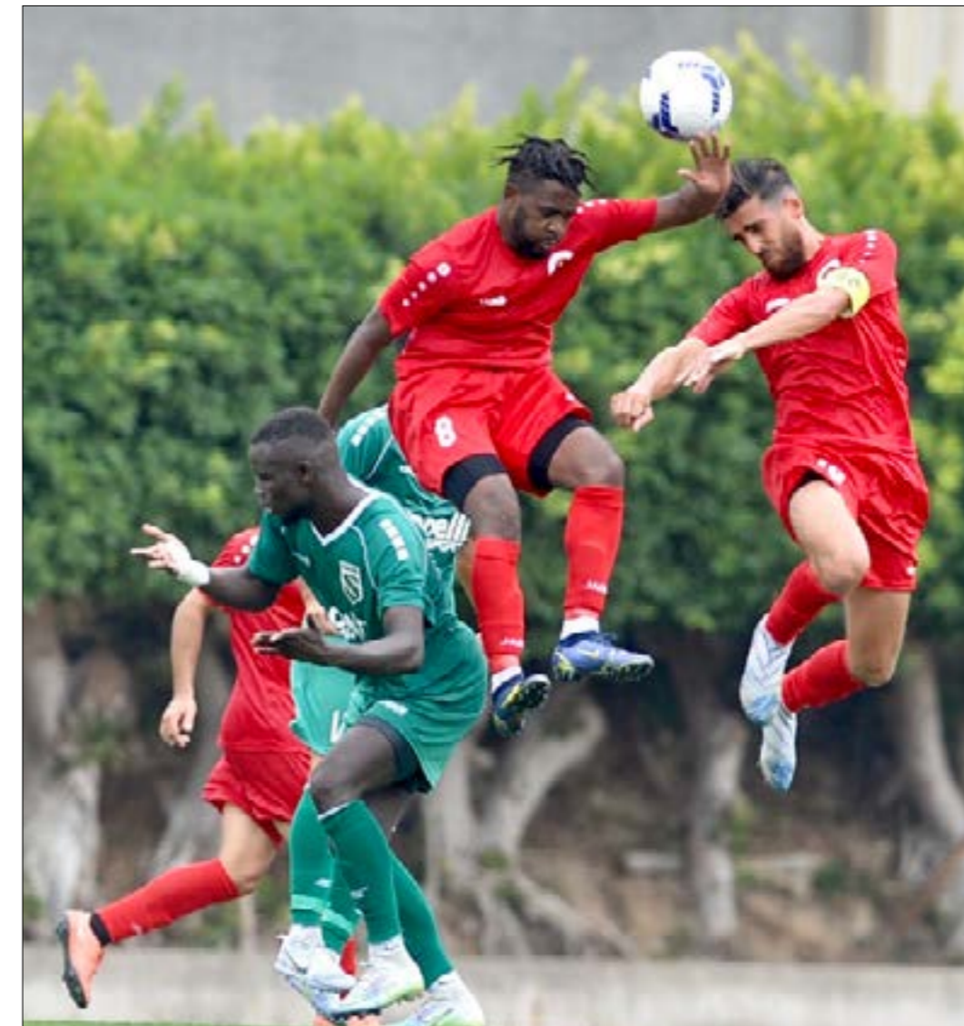
تفتتح الجولة الثانية من الدوري اللبناني اليوم بثلاث مباريات مثيرة للاهتمام (طلق سلمان)

البرج يملك كل المقومات ليكون منافساً أساسياً على اللقب، وهو يريد