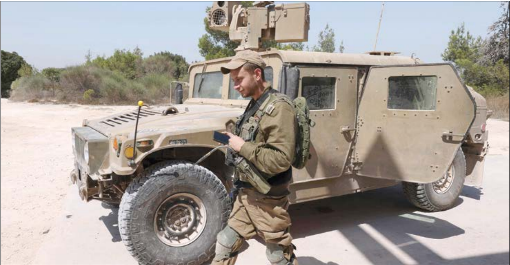
من طاوره يجريها جيش العدو على الحدود مع لبنان

وقال مصدر معني بالمفاوضات إن ما جرى عملياً هو حصول الأميركيين على موافقة إسرائيلية يمكن وصفها محل شكوك، لأن الجميع يتذكر ما الذي حل بوديدة رابين عندما قصد الرئيس السوري الراحل حافظ الأسد الرئيس الأميركي الأسبق بيل كلينتون واكتشف أن العدو تراجع ب«وديدة رابين». وقد روج الجانب