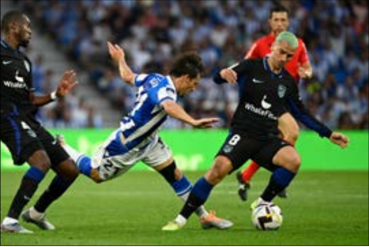
سكّن غريزمان هدفين في الدوري هذا الموسم

ظروف صعبة يُعاني منها النجم الفرنسي أنطوان غريزّمان مع نادي أتلتيكو مدريد الإسباني. اللاعب الذي عاد إلى فريقه السابق في العاصمة الإسبانية على سبيل الإعارة من برشلونة، لا يشارك كثيراً في المباريات وذلك بقرار فني وإداري، وهذا الأمر يمكن أن ينسحب على مباراة اليوم في دوري أبطال أوروبا أمام بورتو. ويبدو «غريزو» عالقاً بين برشلونة، الذي يمتد عقده معه حتى عام 2024 ونادي العاصمة مدريد المعار إلى صفوفه للموسم الثاني توالياً، وذلك بحسب ما يتعلق بينود عقده. وبحسب الصحافة الإسبانية، سيتم تنشيط خيار الشراء من قبل أتلتيكو مدريد، والبالغ 40 مليون يورو تلقائياً في حال خاض الفرنسي أكثر من 45 دقيقة في 50 في المئة (أو أكثر) من مبارياته خلال الموسم الحالي، لذا، ومن أجل عدم تفعيل هذا الخيار قرّر الأرجنتيني دينيغو سيميوني مدرب أتلتيكو ويطلب من الإدارة حدّ دقاتك المهاجم الدولي الفرنسي (108 مباريات دولية، 42 هدفاً) ب 27 دقيقة فقط من الإفرّاج المشروط لكل مباراة، لتجنب إجبار ناديه على دفع قيمة شراء غريزّمان، بفنم باهظ.