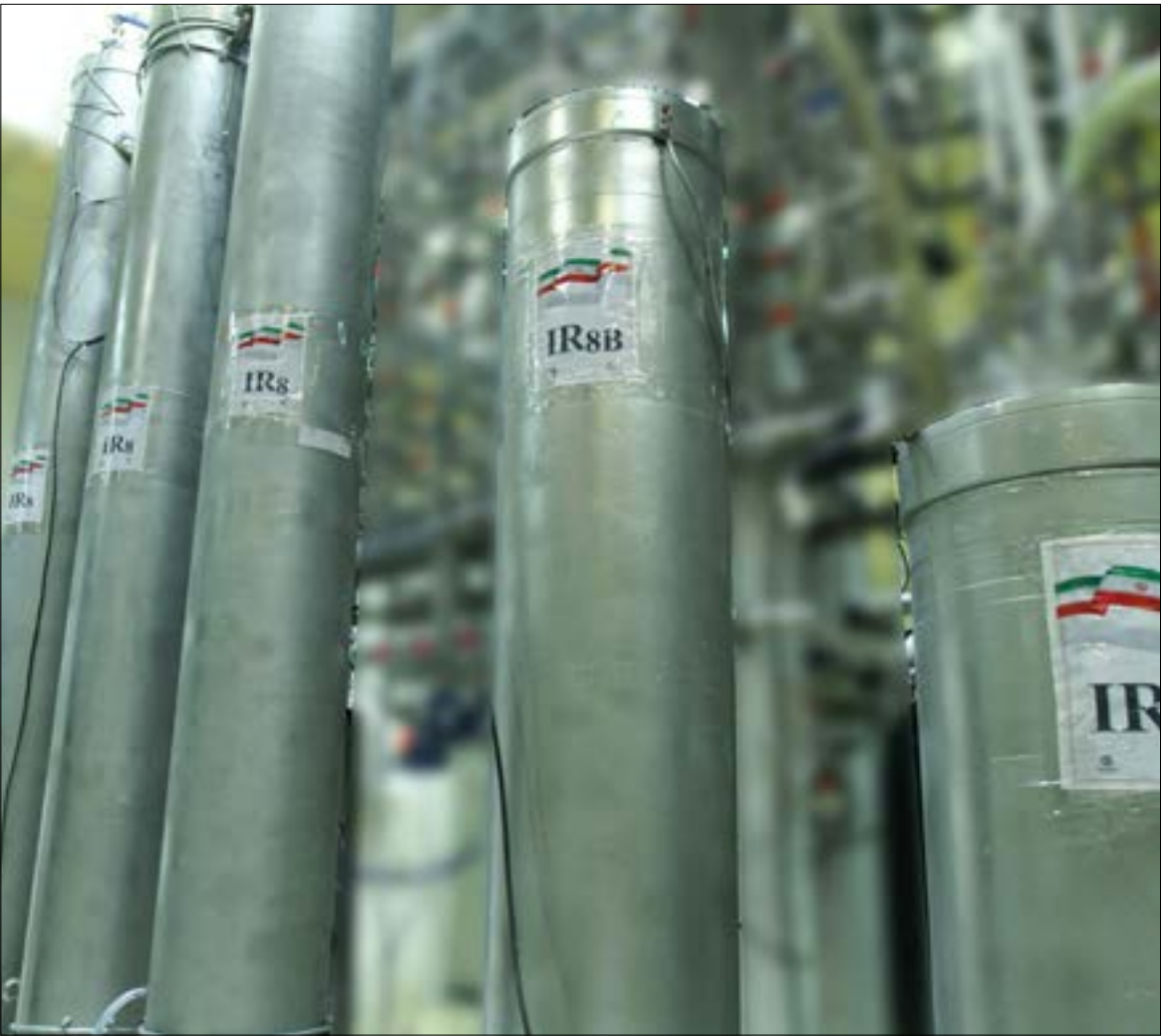
نقطة في اسرائيل من برك حدود قرة الكيان على مواجهة البرنامج النووي الإيراني

إيرانياً من دون الإعلان عنه؛ وهل ترغب طهران في تحصيل مزيد من الوقت كي تقترب أكثر من القدرة على إنتاج السلاح النووي؛ وهل تراجعت فعالية الضغوط الأميركية إلى الحدّ الذي باتت معه إيران تفاوض لأجل التفاوض؛ في محاولة الإجابة على