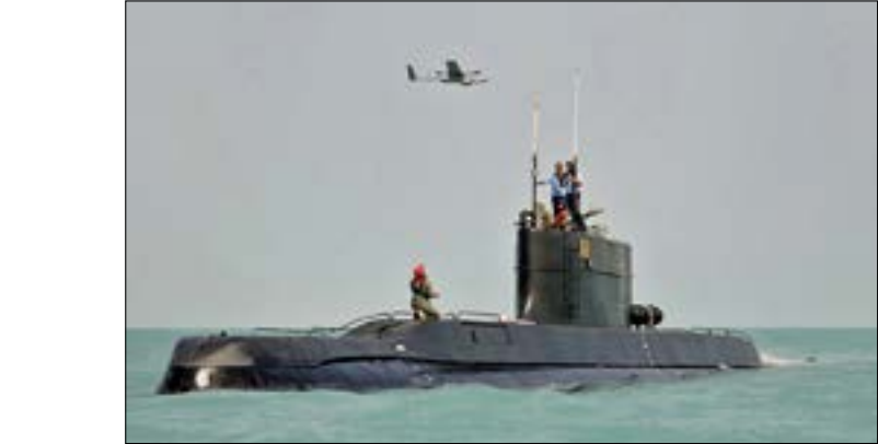
حذر الجنرال باقر، الولايات المتحدة من الاستمرار في تسير مسيراتها البحرية في مياه المنطقة

ساعة في شأن تقارير وجهات النظر، وإمكانية إبرام الاتفاق الآن»، مشيراً فيها أنّ «بوريل حليف للولايات المتحدة، وينسب أن سبب هذه الصفة جديدة باتت «في خطر» بعدما تصاعد الموقفان الأميركي والإيراني في الأيام الأخيرة، وأوضح انه «في لحظة العمل الشاملة المشتركة، على الأرجح أن أقول، هذا يكفي هذا كمنصق في ان اقول، لهذا يكفي هذا هو النص الأكثر توازناً الذي يمكنني عرضه مع مراعاة جميع الآراء»، لكن أقول إن تقتي تراجعت عمّا قبل 48