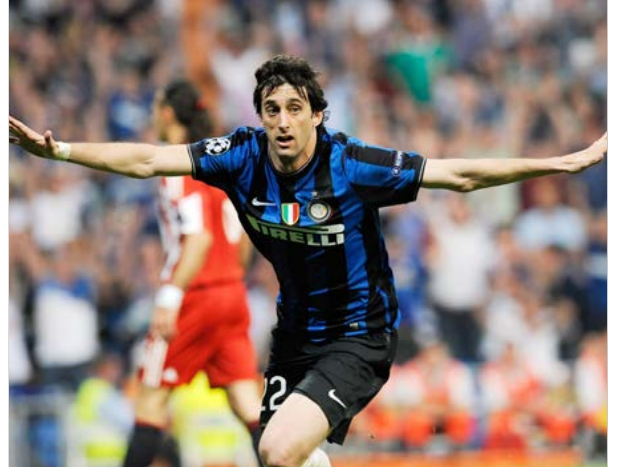
تعود المواجهة الأقوى والأهم بين إنتر وبايرن إلى عام 2010 عندما سحقها الأولك نماني أبطال بهدف ميلينو

هو السحر بحد ذاته تفرزه مسابقة دوري أبطال أوروبا لكرة القدم، تاركةً امسيات وذكريات لا تُنسى ترسمها عادةً الفرق الكبرى حتى لو كانت المواجهات في الأدوار المبكرة، وذلك تماماً كما هو حال الموقعة الضخمة التي ستجمع الليلة الساعة 22.00 بتوقيت بيروت العملاقين الإيطالي إنتر ميلانو والألماني بايرن ميونخ.