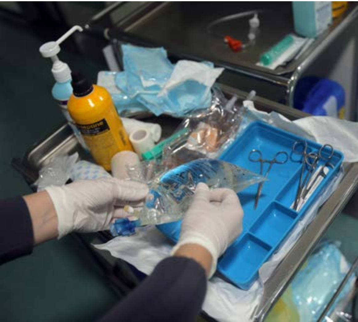
لم يك الموظفين والعاملون في المستشفيات الحكومية ما افرته لهم المراسيم

مع ذلك، ليس متوقفاً من الرد أن يكون إيجابياً، إذ تشير مصادر وزارة المالية أن «ضامين السلفة تتوقف على توفر الاعتمادات، ولذلك لا نستطيع صرف سلفة إن كانت المؤسسة العامة لا تملك اعتماداً، وبالتالي وزير المالية لا يمكنه صلاحية أن يصرف لها إزاء هذا الوضع، كانت الدعايات متفاوتة، فقد لجأت بعض المستشفيات إلى «الانتقاء» من بين المراسيم ما هو أخف كلفة، فاكثفت البعض بزيادة بدل الانتقال، فيما أعطى آخرون سلفة النصف راتب مدة محددة من دون الالتزام