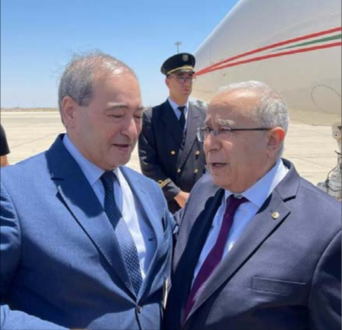
بدا لفتا تراجم التشويش على قمّة الجزائر بعد إعلان دمشق عدم رغبتها في المشاركة فيها

بعدم عودة دمشق إلى الجامعة العربية، حيث حرصت واشنطن على التاكيد للوفود العربية المشاركة جنيف، والذي عُقد على مدار يومين الأسبوع الماضي، في حديث إلى «الأخبار»، أن الوفد الأميركي أعدّ، قبل انعقاد اللقاء، ورقة أعمال مؤلّفة من سبعة بنود، بينها بند واضح يتعلّق مسارات أخرى يكون لموسكو حضور