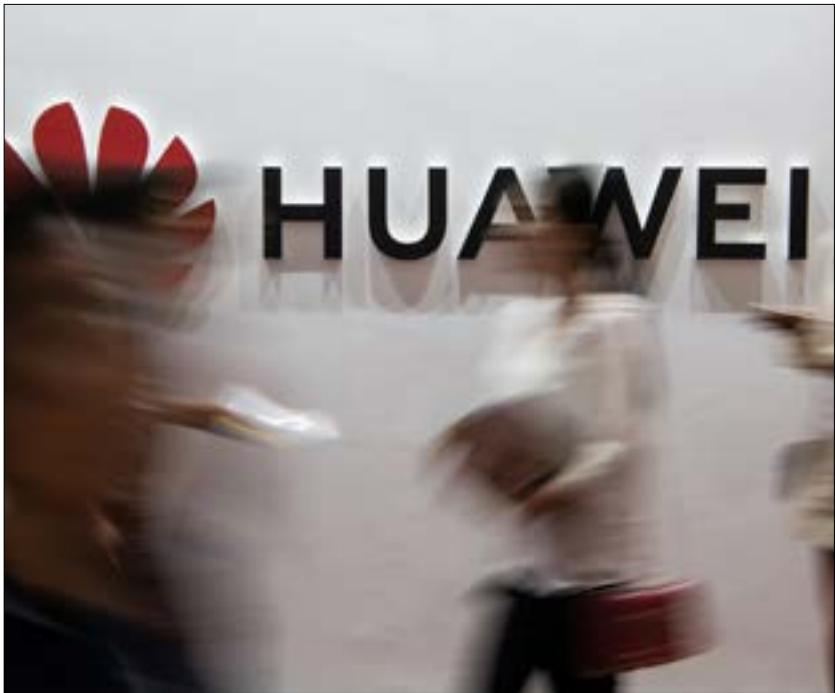
إجراءات والشظت ضد الشركة الصينية ليست جديدة، بل تعود إلى أكثر من عقد (ا ف ب)

هكذا، تحلّت «هواوي»، باعتبارها واحداً من أكبر مُصنعي معدّات الاتصالات في الصين، عبئاً ضخماً. ويورد موقع مجلة «ذا ديبولومات» الأميركي، حول هذا الموضوع، أنّ «اسم هواوي كان من بين الكلمات الطائنة التي كثير من الوثائق الأميركية، إلى جانب المصطلحات الشائعة، من مثل: الذكاء الاصطناعي، والإتكار، والتكنولوجيا، والحرب الباردة». ويلفت التقرير إلى أنّ «اتخاذ واشنطن