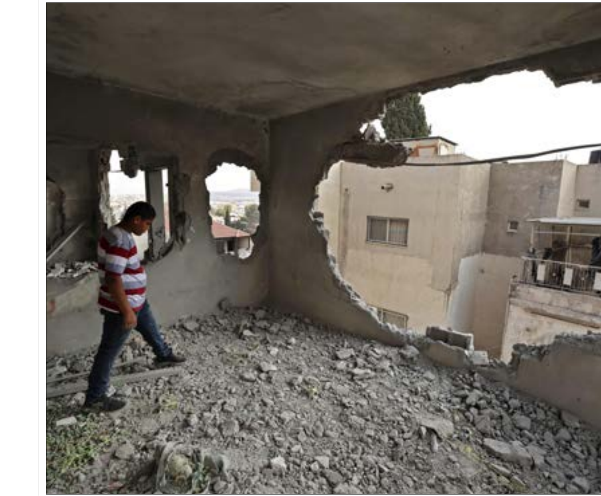
لنود العملية أقرب إلى محاولة لتعويض الفشل الإسرائيلي في ملاحقة واعتقال فحخي خازم

يُذكر أن تنظيم «داعش» كان قد ظهر للمرّة الأولى بشكل علني من خلال «جيش خالد بن الوليد»، في نيسان من عام 2016، وذلك إثر اندماج فصائل «لواء شهداء اليرموك» و«حركة المثنى الإسلامية» و«جيش الجهاد»، وبعد أن أعلن الفصيل الجديد بيغته لزعيم «داعش» الأسبق، أبو بكر البغدادي، سيطر على منطقة حوض اليرموك، وهي آخر المناطق التي استعادتها دمشق في الجنوب السوري عام 2018، وكانت شهدت قبل هذا التاريخ، اشتباكات مكثّرة مع «عناصر التسويات»، ولم يعلن عن أن ما يدور اليوم في جاسم، يُنبئ بمصالحة بين ما تبقى من الأمنية ومجموعات من المسلّحين، انتهت باتفاق بين الحكومة ولجنة مثلّت وجهاء المدينة الذين تعهّدوا بالتهبّذة، وعلى رغم التطوّرات الأخيرة، توكّد مصادر ميدانية