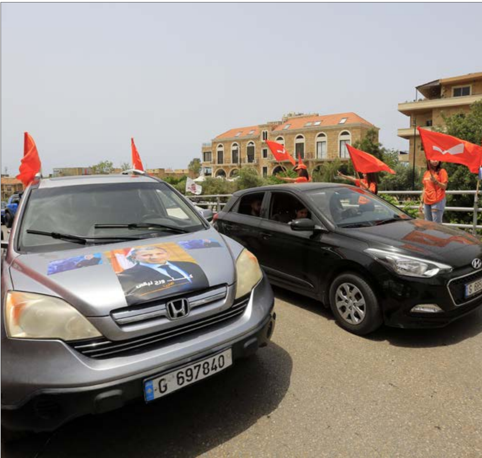
(مروان بو حيدر)

6 - في دائرة جبل لبنان الأولى (كسروان - جبيل) نال مرشحو التيار الوطني الحر 24684 صوتاً (سيمون أبي رميا - 6239، ندى البستاني - 11338، طوني كريدتي - 413، ربيع زغب - 367، وسيم سلامة - 1155، عماد عازار - 366، ووليد الخوري - 4149)، أي ما نسبته 13,55% من الناخبين الذين بلغ عددهم 182103، و20,28% من المقترعين الذين بلغ عددهم 121693. وحصدت لائحة التيار الوطني الحر مجتمعة 34192 صوتاً، أي ما نسبته 18,77% من الناخبين، و28,09% من المقترعين. 7 - في دائرة جبل لبنان الثانية (المتن الشمالي) حصل مرشحو