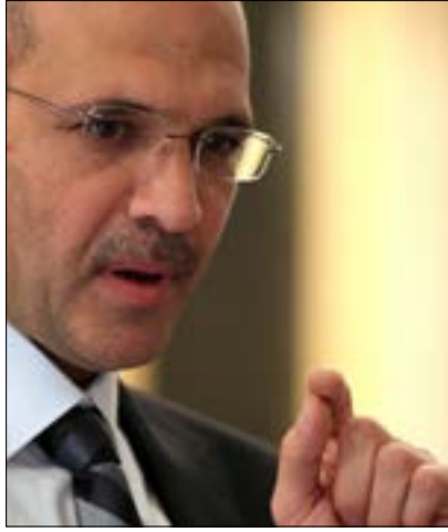
الوزير السابق حمد حسن المستند المتداول عن مسؤولية الوزير السابق حمد حسن بسبب الاتفاقية المتعلقة بفحوص الـ PCR