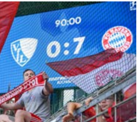
سخط بايرن 15 هدفاً في ثلاث مباريات

واصل بايرن ميونيخ حامل لقب بطولة الدوري الألماني لكرة القدم بدايته النارية للموسم الجديد رغم خسارة هدفه البولندي روبرت ليفاندوفسكي المنقول إلى برشلونة الإسباني بتحقيقه فوزه الثالث تواليًا والثاني بمرحان تهديفي وجاء على حساب مضيفه بوخوم (7-صفر) في المرحلة الثالثة من الدوري. وبعدهما استهل الموسم بفوز كاسخ خارج الديار على أندرخت فرانكفورت (1-6)، خرج بايرن منخصراً من ظهوره الأول على أرضه (2-صفر) على حساب فولفسبورغ، ثم استعرض مساء