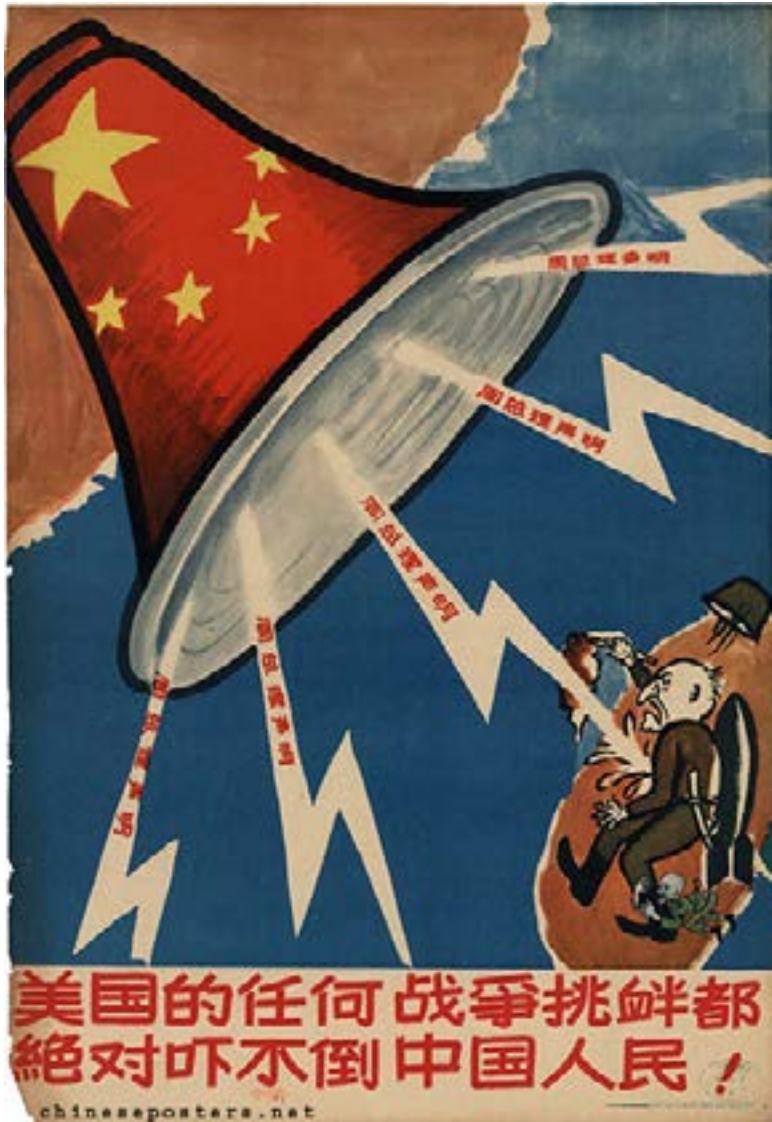
(ملصق صيني، 1958)

موقعه الطبقي المعادي للأفكار الشيوعية. عام 1895، وفي عن «قرن الإنذال»، احتلت اليابان تايوان، ولم تمنحّن Taiwan من استعادتها إلا عام 1945. وكانت اليابان قد احتلت أجزاء واسعة من الصين بين الحربين العالميتين. وخضع الصينيون حزب تحرير استمرت لسنوات طوال. وإبان الحرب العالمية الثانية، توحد الحزب الشيوعي وحزب الكومنتانغ من أجل دحر الاحتلال الياباني. إلا أن اليابان كانت تسعى للاحتفاظ ببعض المناطق منها. تايوان فوجهت بإصرار صيني على استرجاع كل الأراضي، ويومها لم يكن الحزب الشيوعي في الحكم، بل كانت الحكومة تخضع لحزب الكومنتانغ الذي