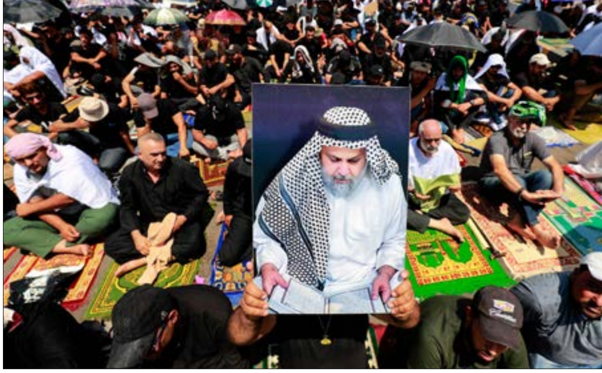
الوقت يلعب ضدّ الصدر. مع مرور الأيام من دون حصوله على أي مكسب

يتمثّل في مجموعة المستشارين المحيطين بزعيمه. وخُلفهم من الشيعة الذين كانوا في صفوف حزب «البعث». ولجأوا إلى الصدر بعد سقوط نظام صدام حسين. على رغم وجود آخرين من الذين