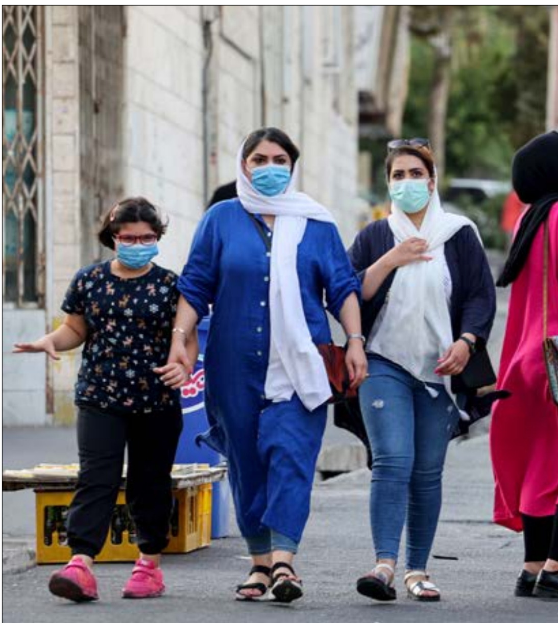
تكتف إسرائيل ضبوطها مع اقتراب الانتخابات النيابية وتعقد الوضع السياسي الداخلي (ف ب)

لطمانة تل ابيب إلى أنها لا تزال عند موقفها. غير أن المسؤولين الإسرائيليّين لم يفتنعوا بكلامها. بايدين. وعلى النقيض من تقارير وسائل الإعلام. لم توافق على إعطاء دعابة ضدّ الإدارة الأميركية على غرار ما يفعله نتنياهو حول الاتفاق النووي المحتمل مع إيران. في هذا الوقت. أعلن البيت الأبيض قولهم إن إدارة بايدين بذلت جهداً