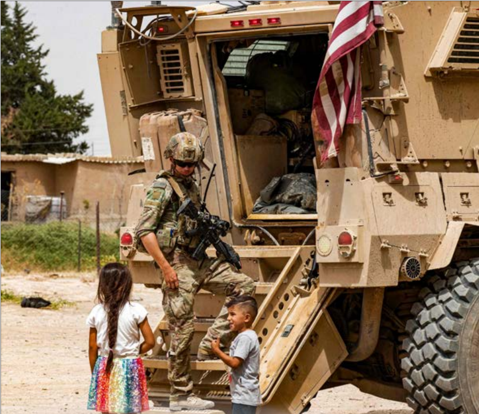
لقطع مولد زواضقة مدينة بين دهلص وانقرة من بينامرض وجود القوات الأمريكية في سوريا (أ ف ب)

إفساد اللعبة الأميركية في شرق الفرات، لا يتعاون مع واشنطن في حرب الفرات في حماية هبنة تحرير الشام. إردوغان أساء من واشنطن لأنها خاضت الحرب ضدّ داعش مع الأكراد وليس مع الجيش السوري الحر. كان إردوغان يريد