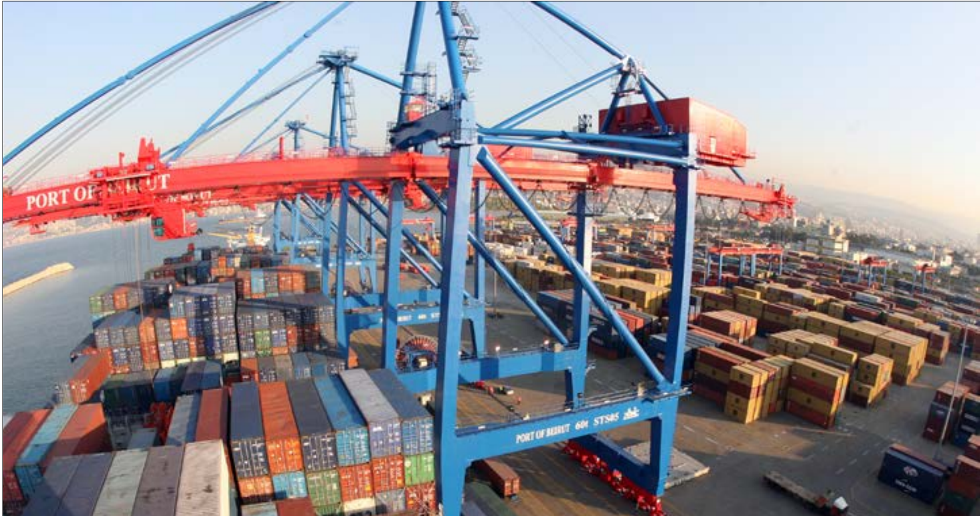
الاستيراد يتضاعف استباقيا لرفع الدولار الجمركي

بالمنطق نفسه الذي تدير فيه السلطة السياسية الدولة منذ الانهيار المالي والاقتصادي والاجتماعي، يتم فرض رفع الدولار الجمركي في غياب أي إصلاح أو خطة واضحة لضمان عدم تسريع التضخم. فبعدما قرر رئيس الحكومة نجيب ميقاتي، بالاتفاق مع وزير المال وغالبية الوزراء، تغطية زيادة الرسم الجمركي 13 مرة، الفى ميقاتي القرار في احضان استشاري من مجلس شورى الدولة صدر قبل ثلاثة اسابيع وتجاهله ميقاتي وقتها. يفني بان لا صلاحية للحكومة في التشريع المالي واحتساب الضريبة الجمركية