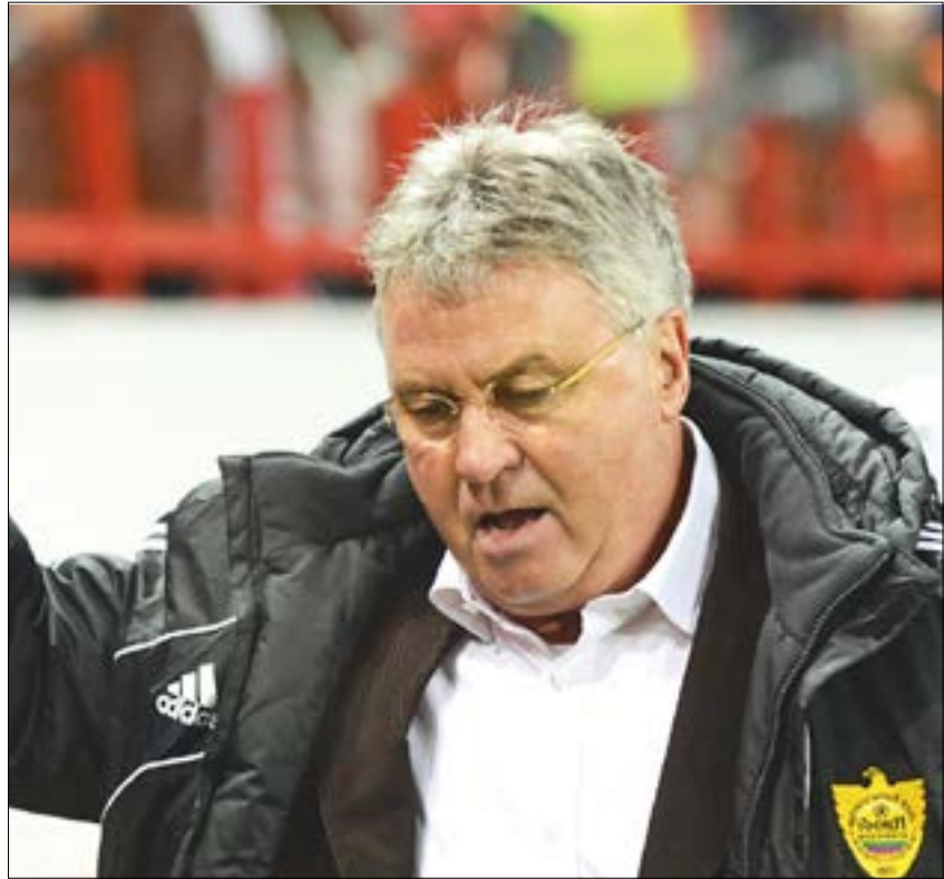
اعاد هيدينك أستراليا إلى كأس العالم بعد غياب 32 عاماً بقيادة إله المونديال ألمانيا 2006 (ويبي)

من الطاقة. لقد التقيت أناساً لطفاً جداً ومنفتحين جداً، وهذا ما أعجبني كثيراً». وسعود هيدينك من اعتراله التدريب لمساعدة أرنولد في هذه المباراة بسبب غياب مساعد الأخير الهولندي الآخر رينيه ميولنستين في تلك الفترة لتواجده في أوروبا من أجل متابعة منافسي أستراليا في المجموعة الرابعة المنتخبين الفرنسي حامل اللقب والدنماركي.