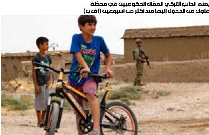
يعزم الجانب التركي العمال الحكوميت في مخطط علوك من الدوله اليها منذ أكثر من اسبوعين