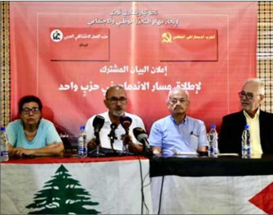
نحو تيار يساري ثوري