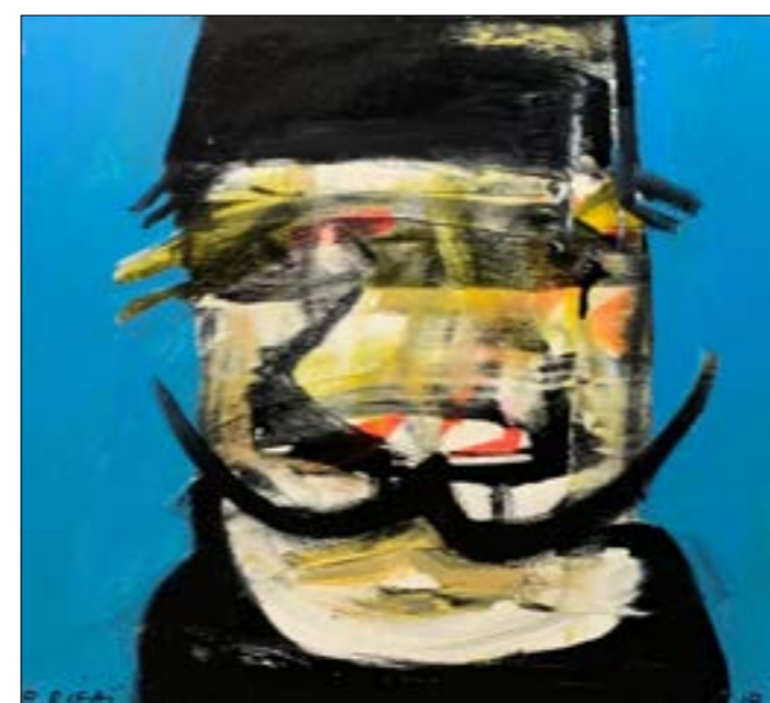
«درويش»، (أكريليك على كنافاس... 50 x 50 سنتم... 2018)

درويش مهّمّس ضاحك قريب من الكاريكاتور أكثر من اللوحة، لكن لديه لقطات جميلة. من هنا، يذكّرنا درويش الرفاعي بأعمال الكاريكاتور أكثر من بناءات اللوحة. إنّها لحظات متنوعة تختلف فيها الأشكال والوجوه من الشاريين، والطربوش والقفاب بلغة ساخرة فكاهية حيناً وممتعة أحياناً. كأنّها نوع من استكشاث متناغمة ومتسلسلة، لم يسقط عليها أنوار هؤلاء الاجتماعية وغير الاجتماعية. لا تغيب عنها أحياناً ملامح الحزن أو الفرح التي تذكّر بتشارلي شابلين في شخصية المتسكّع والمتشرّد التي أبدعها في