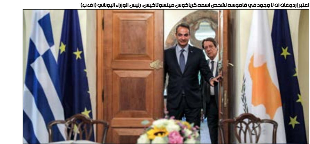
اعتر إردوغان أن ا وجود في قاموسه للشخص اسمه كريكوس مينسوتاكيس، رئيس الوزراء اليوناني

في محاوله لتخفيف الانتقادات الداخليه التي يواجهاها الأخير على صعيد الأداء الاقتصادي، علّم أن المساعدات «الجائنيه» لن تشكل سوى نسبة 20% من مشروع الدعم السعودي، المرتكز في الأساس على مبدأ الاستثمار مقابل الربح. وتُعدّ زيارة ابن سلمان واحده من بين ثلاث زيارات مرجه على جدول أعمال الرئاسة المصريه طوال ثلاثه أسابيع، وهي تشمل زيارة مرتقبه لرئيس الإمارات محمد بن زايد، وأخرى لأمير قطر تميم بن حمد، بهدف بحث تعاون اقتصادي بين البلدان الثلاثة، في ظلّ حاجة الاقتصاد المصري إلى مزيد من المبادرات الخليجيّه، مع الإشارة إلى أن بعض الاتفاقات التي ستوقّع بين القاهرة والدوحه جرى الاتفاق على صيغها وتفصيلها خلال زيارة رئيس «هيئه الاستثمار المصريه» لقطر قبل أسابيع، على أن هذا الدعم، خصوصاً منه السعودي والإماراتي، لن يكون مجانيّاً؛ إذ إن مصر تعهّدت بمسانده مواقف الرّمح الخليجين في ما يتخصّل بملفات عدّه على رأسها اليمن والقضيه الفلسطينيه، في مقابل إتقادها من أزمتهّا.