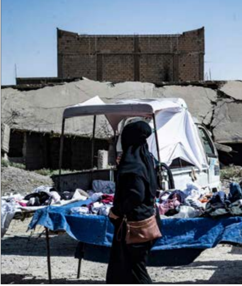
تُوكّد دهلغف امتلاكها معلومات دقيقة حول ارتباط

«الأخبار» وجود المئات من هؤلاء في سجون منتشرة في محيط أعزاز وقرى عفرين، وسط اتهامات للفصائل بإطلاق سراح عدد منهم لقاء مبالغ مالية كبيرة وصلت في بعض الأحيان إلى نحو 20 ألف دولار، وإيصالهم إلى البداية للانضمام إلى الجماعات الصغيرة المنتشرة هناك.