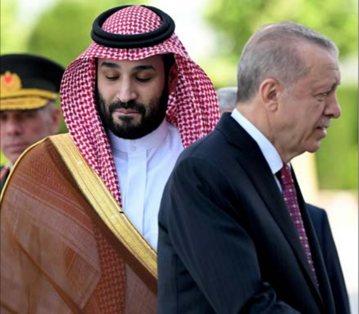
من المتوقع تركيا ان تحدّف الاستثمارات السعوديه على البلاد، بما يساهم في التناهل مع الأزمة الاقتصادية الخائفة

لم تكن زيارة محمد بن سلمان الاخيره للقاهرة اعتيادية؛ كونها تندرج ضمن جولة إقليمية أوسع تستحق زيارة الرئيس الأميركي، جو بايدن، لإسرائيل، فالسعودية مباشرته حيث يشارك في قفّه لـ«مجلس التعاون الخليجي» تجمع قادة الخليج ومصر والأردن ورئيس وزراء العراق. وحملت الزيارة دعماً اقتصادياً إضافياً تتعلّو عليه القاهرة بصورة كبيرة للخروج من مأزقها الاقتصادي الحالي؛ إذ إلى جانب مبلغ الخمسة مليارات دولار الذي أودع في البنك المركزي قبل شهرين دعماً للاقتصاد المصري،