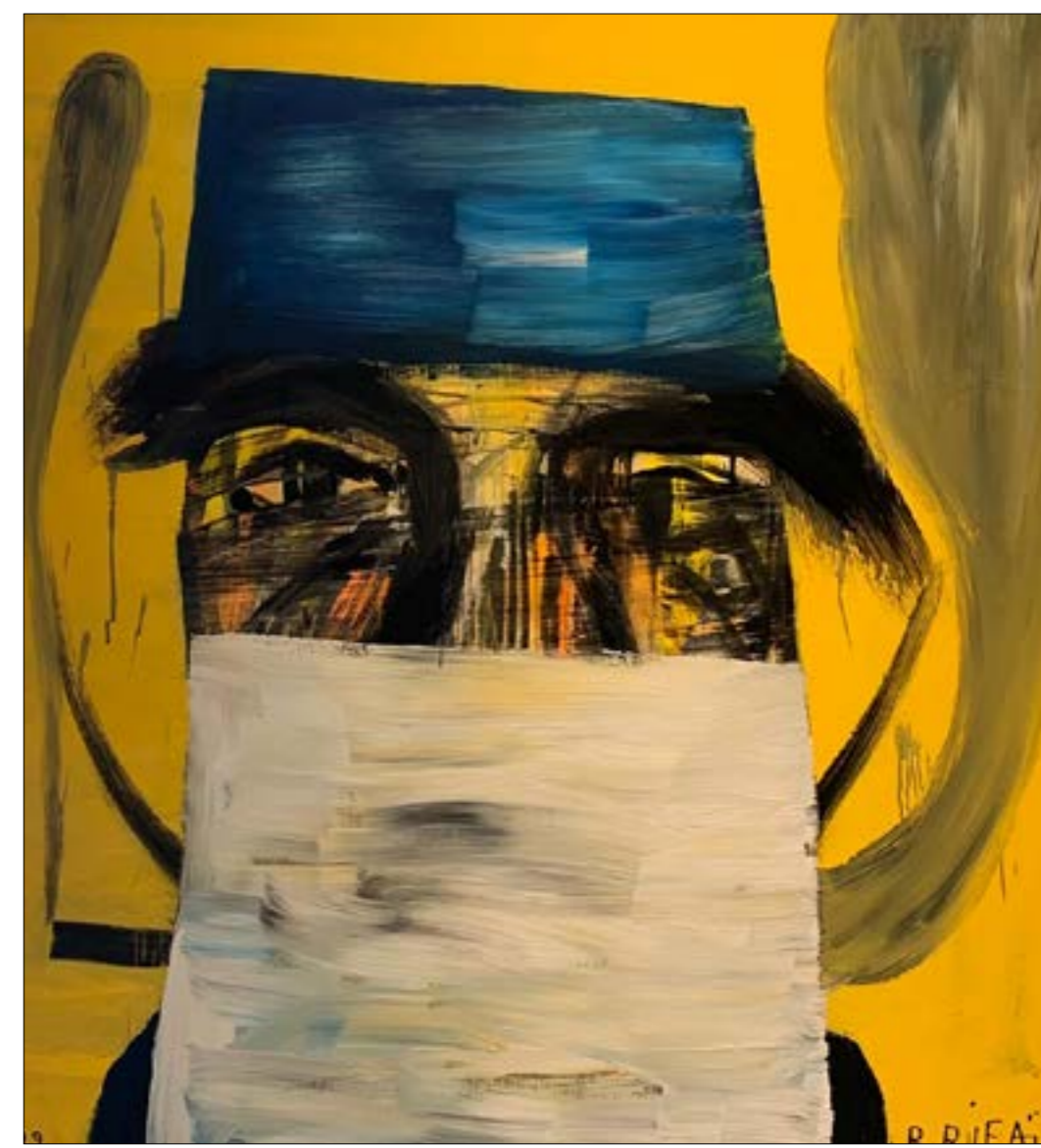
«درويش»، (أكريليك على كنافاس... 100 x 100 سنتم... 2020)