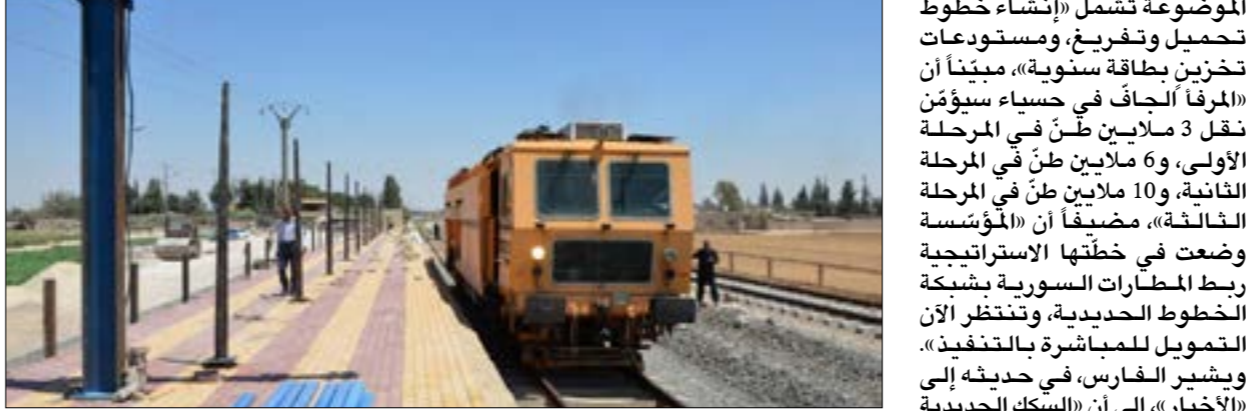
رئيسة، ووضعتها في الخدمة مباشرة (أف ب)

«الأخبار» وجود المئات من هؤلاء في سجون منتشرة في محيط أعزاز وقرى عفرين، وسط اتهامات للفصائل بإطلاق سراح عدد منهم لقاء مبالغ مالية كبيرة وصلت في بعض الأحيان إلى نحو 20 ألف دولار، وإيصالهم إلى البداية للانضمام إلى الجماعات الصغيرة المنتشرة هناك.