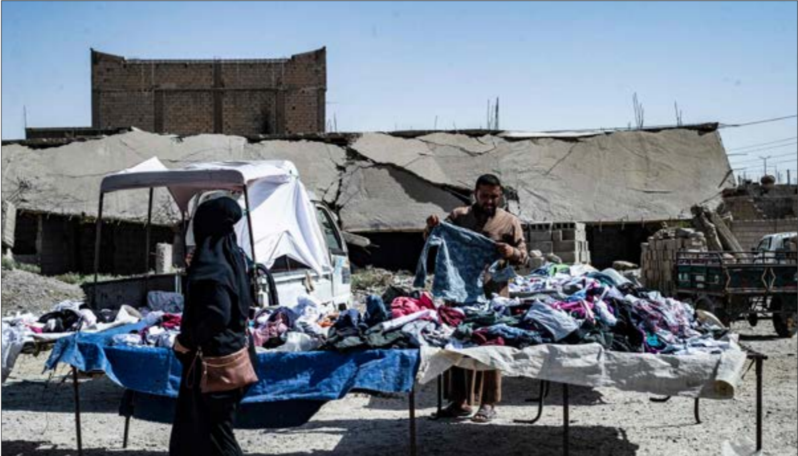
تُوكّد دهلغف امتلاكها معلومات دقيقة حول ارتباط

تتمركز تدريبها الأميركية في غير مراكز نقله وانتشاره، تكشف عن شبكة متداخلة من العلاقات والمصالح التي نسجها مسلّحوه، بالإضافة إلى تحفّضه في «ملاذات آمنة» عديدة تُوفّر له الحدّ الأدنى من الاستمرار