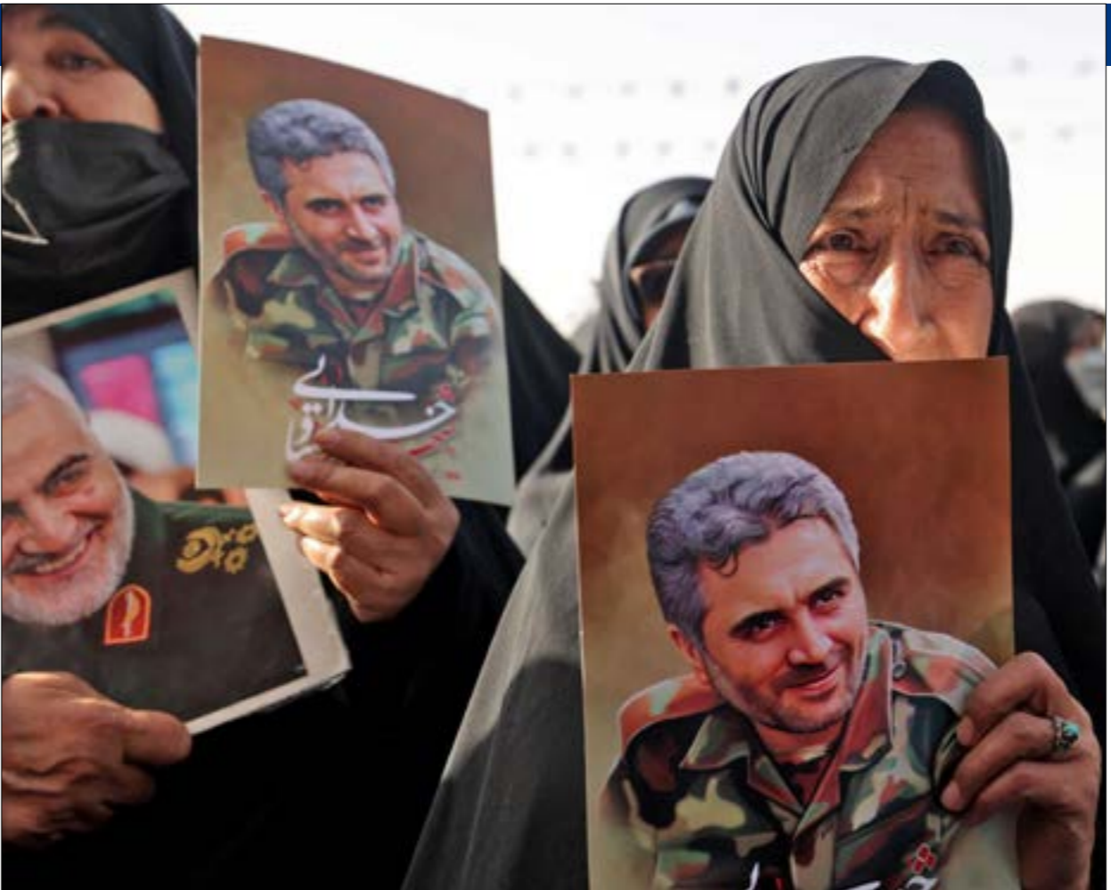
من تسليم العقيد في الحرس الثوري الإيراني حست صياد خدائي في طهران

في الأيام الأخيرة، اغتالت إسرائيل العقيد في الحرس الثوري، خدائي، الذي يبدو ممّا جرى الحديث عنه في الإعلام، أنه مسؤول في شؤون التكنولوجيا وتطوير في «قوة القدس»، وأنه عمل لسنوات طويلة في مسيرتين، ماذا كذبتم؟! العمليات التي حدثت في فلسطين بعد هذه الحادثة من أين وكيف وصلت معانها (في إشارة إلى معدّات وتجهيزات عسكرية). أنتم لستم على استعداد لغول الحقيقة صناعة الإعلام الإسرائيلي الموجه فقط، وبالمناسبة، فقد أطلقت وسائل الإعلام الإيرانية الرسمية على خدائي لقب «المدافع عن الحرم»، وهو اللقب الذي يُمنح للمستشارين العسكريين الإيرانيين الذين يستشهدون في سوريا بالتحديد. وبعد الاعتقال بيومين، وقع هجوم بطائرة مسيّرة على مجمع بارشين لتطوير الصواريخ والسيارات الإسرائيلية. وابتداءً من هذه الأحداث، التي لم تكن هي بداية الحرب المفضية تلك، بدأت المواجهة حول تكنولوجيا صناعة وتطوير ونقل ونشر المسيرات، تظلّ برأسها إلى العلن، حيث يراها العالم.