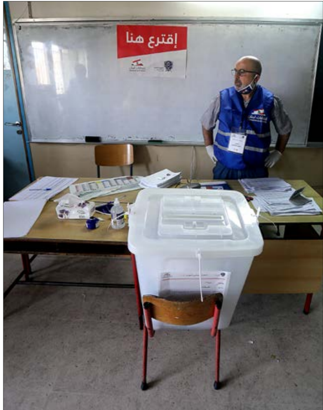
لم يحصل الموظفون على بدلات التعابم الانتخابية بعد (مزود) بوجدرا

وزعت الوزارات المعنية بالعملة الانتخابية الوعود مبيناً ويساراً قبل الانتخابات، فاجتمع وزير المالية مع رابطة التعليم الثانوي وقال: إن مستحقات الأساتذة المشاركين لن تتأخر. ووعدت وزارة الداخلية الموظفين المكلفين بدفع المستحقات على الشكل الآتي: رؤساء الأقسام 3,600,000 ليرة، الكتبة 3,400,000 ليرة وذلك عند تسليم صناديق الاقتراع بعد انتهاء العملية الانتخابية مباشرة في سرابات الإقصية، ولكن لم تتحوّل الوعود إلى حقائق، وبقيت في خانة الشراب مع تراجع الداخلية الأول قبل انطلاق العملية الانتخابية والقول إن المستحقات ستتاخر لأسبوع واحد حتى انتهاء عملية الفرز، وبدأت الأسابيع بالقوالي والليرة بالانهيار، ثم فجأة تحول النقاش من سرعة الدفع نحو مكان الدفع، وتمّ إلهاء الموظفين وتضليلهم بقنابل دخانية من نوع أن القبض سيكون من الشراي الذي تسلّموا منه التكليف، فأكلوا الطعم حسب إغادة مشارك في الانتخابات،