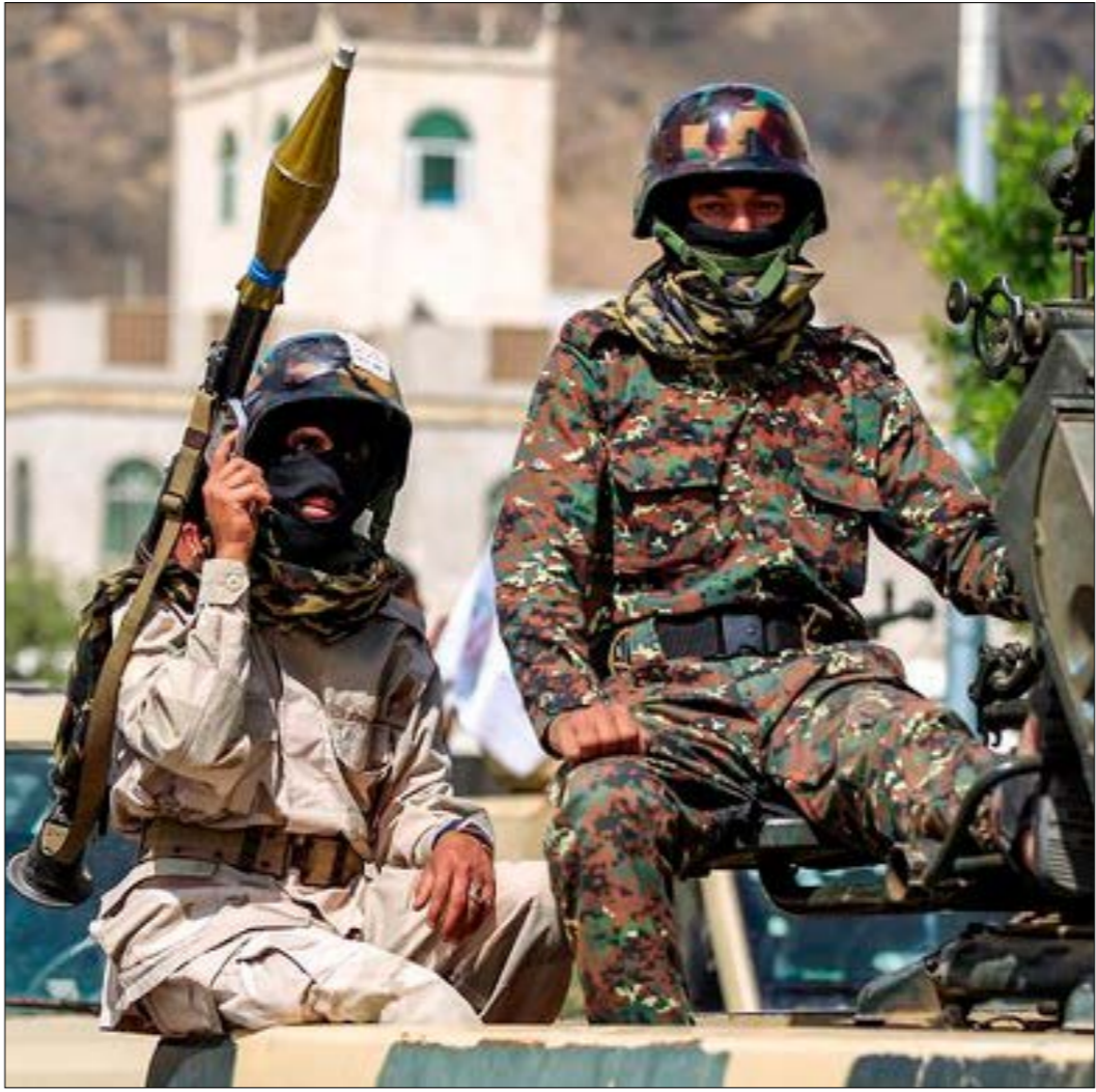
بدا لفتنا حجم التحالف بين اعضا، الرابسي، حول هوية الشخصية التي ستراش لجنة اعادة ترتيب الخريطة العسكرية والأمنية (الرابسي)

اخيرا وبعد شهرين من الانقلاب على عبد ربه منصور هادي، شكّلت الرياض و ابوظبي اللجنة التي ستؤكّل إليها مهمة إعادة الهيكلة العسكرية والأمنية، كجزء من مهام «المجلس الرئاسي». وعلمه رغم اتخاذ خطوة عملياتية في هذا الاتجاه، إلا أن ما يجري على الأرض يكاد يكون معاكساً لها، إذ إن الصلح على تفرخ المزيد من الميليشيات تحت اسم «اليمن السعيد» لا يزال سارياً. فيما يبدو الهدف الرئيس من تشكيل «اللجنة المشتركة» تحجيم قوات «المجلس الانتقالي» تمهيدا للإبلاغها. وأياً يكن، فالإكاد أن التحالف السعودي - الإماراتي غير مصنف بتشكيل قوة مركزية ذات إمكانيات نوعية، يمكن أن تتلب عليه يوماً ما