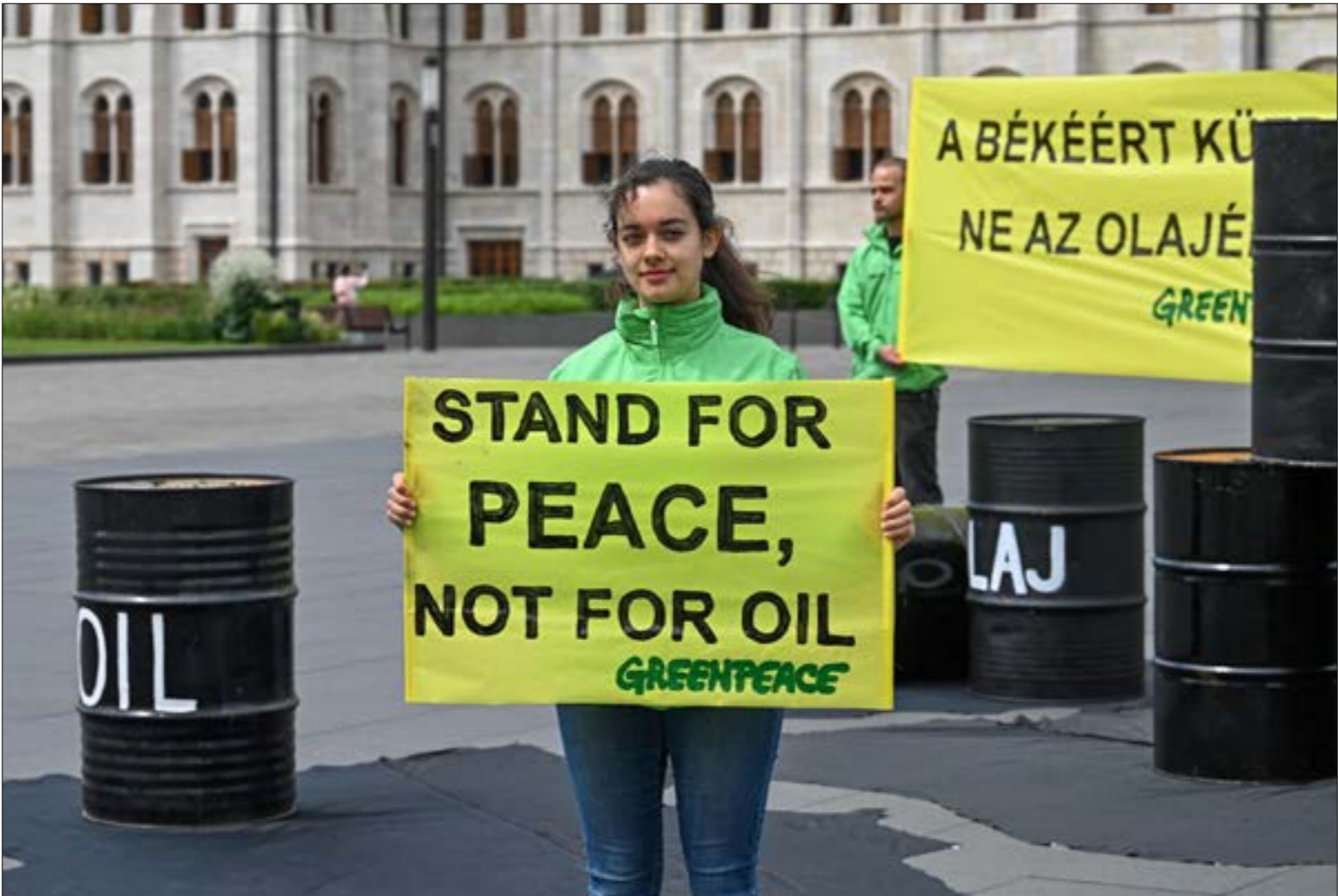
تسلّم الحرمة إعفاءات لاسترضاء هنغاريا، التي عارض رئيسها، أوربان فرض حظر على استيراد النفط الروسي

من واردات النفط من روسيا إلى الاتحاد الأوروبي مع نهاية العام»، وبحسب تصريحات لمسؤول في مكتب الرئيس الفرنسي، إيمانويل ماكرون، فإن بروكسل ستعمل على إيجاد حلول لاستكمال إغلاق الفرع الجنوبي من خطّ الأنابيب الروسي، والذي يخدم دول وسط القارة - التي لا موانئ لها: هنغاريا وسلوفاكيا والتشيك - «في أقرب وقت ممكن»، وسيخصّصن ذلك، في ما علم، منّ حطّ أنابيب بديل من كرواتيا نحو هنغاريا، وروسيا وغيرها، كما مستقبل زيمها شارل ميشيل، وتشمل الحرمة إعفاءات لاسترضاء أحد أهمّ موارد تمويل ما تسفّيه «اللة الحربية الروسية»، على أنّ الصيغة التي تمّ تينيها في النهاية من قبّل القادة الأوروبيين لغرض هذه الجولة من العقوبات، والوقت الذي استغرقوه لتدّلك، عكسا في الواقع انقسامات شديدة بين تيارات التشيك على تأجيل لمدة 18 شهراً