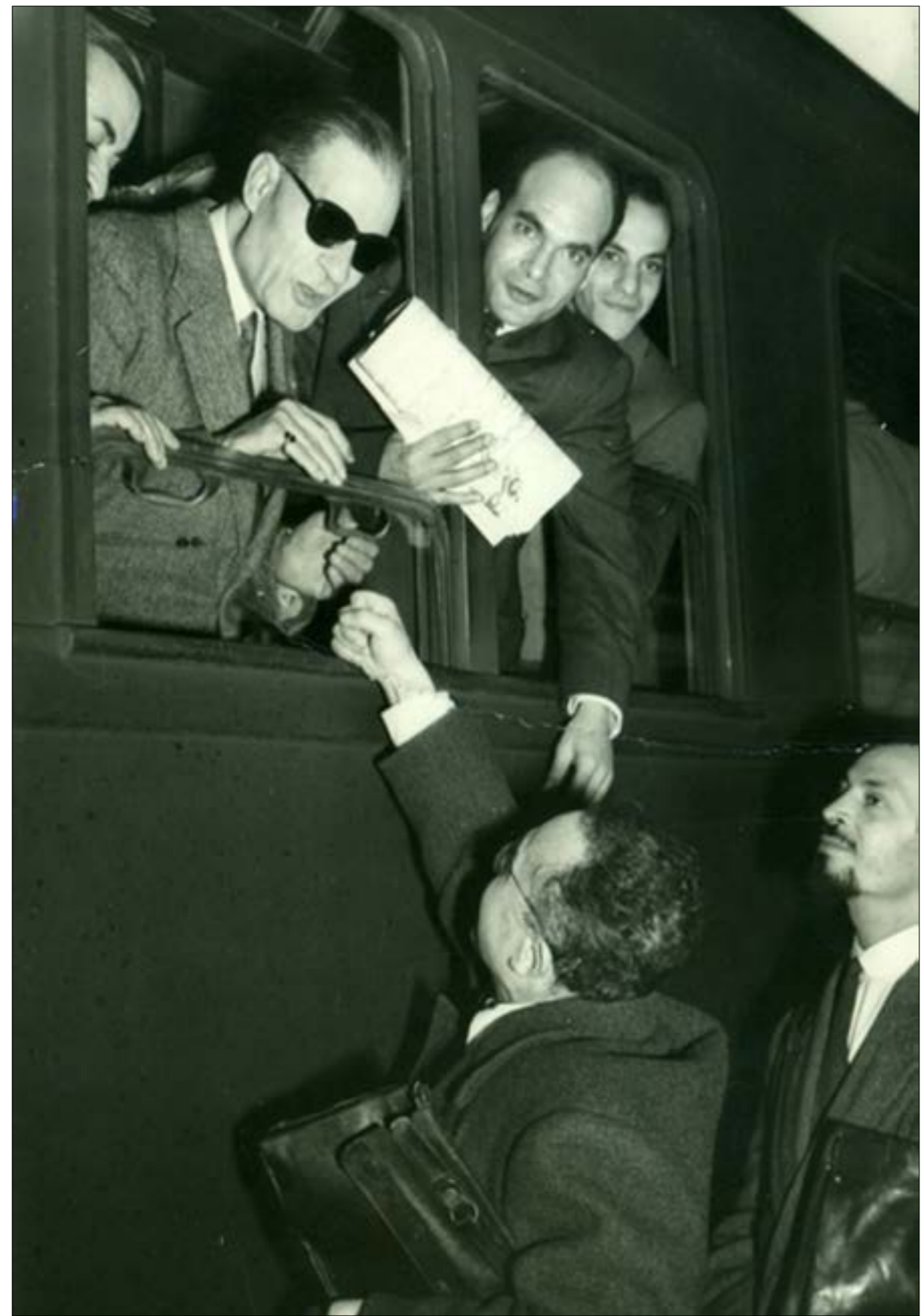
طه حسين في روما (الريف) مكتبة الاسكندرية

على أرض الواقع، والمحافظ لم يتم إخطارها حتى الآن يمكن أو تفاصيل إنشاء محور ياسر رزق». ومن دون رد واضح على سؤالنا حول مصير مقبرة طه حسين في الكوبري، لم يقدم عوض سوى إجابة واحدة: «كل ذلك شأنات لئد القلق وتقويض ثقة المواطنين»؛ الغريب أنّ تصريحات متحدث المحافظة التي تفصي إخطارها حتى الآن يمكن أو تفاصيل إنشاء «محور ياسر رزق»، ثاني بعد إصدار المحافظة نفسها بيانا عن تفاصيل ذلك المحور في عدم نيةسان (بريل) الماضي جاء فيه: «يبدأ المحور من التقاطع مع «محور سميرة موسى» الجديد، وينتهي ليلتقاطع مع «شارع صلاح سالم» والأوتوستراد. ويبدأ طوله عن 7 كلم تقريبا وعرض 5 حارات، كما سيتم من أنباء حول إزالة قبر «عميد الأدب العربي» لإنشاء المحور، مشيراً إلى أن «الأخبار التي تردت في هذا الشأن محض شائعات، لا وجود لها