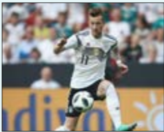
لم يلتحق قائد بروسيا دوتموند ماركو روس بصقوف المنتخب الألماني جراء تعرضه لوعكة صحية. وذلك قبل أربعة أيام من المباراة المنتظرة أمام إيطاليا بطة أوروبا في بولونيا ضمن الجولة الأولى من منافسات المجموعة الثالثة لدوري الأهم الأوروبية لكرة القدم.

يورو للمباراة الواحدة فيما يتقاضى حكّام الدرجة الأولى في فرنسا وألمانيا رواتب تزيد قليلاً عن دوري أبطال أوروبا إلى مستويات اعتماداً على خبرتهم، وبالتالي فإن كبار الحكّام يتقاضون راتباً يزيد عن 6600 يورو لكل مباراة إذا كانوا في فئة النخبة ويحصل الحكّام في كل مباراة، بينما يحصل حكّام أدنى درجة على قرابة 850 يورو لكل مباراة.