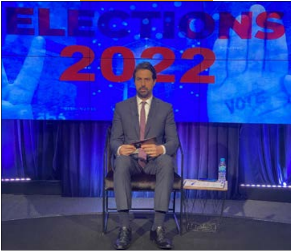
يقدم البير كوستانيات الحلقة الأخيرة من برنامج «30 رؤية لبنان»