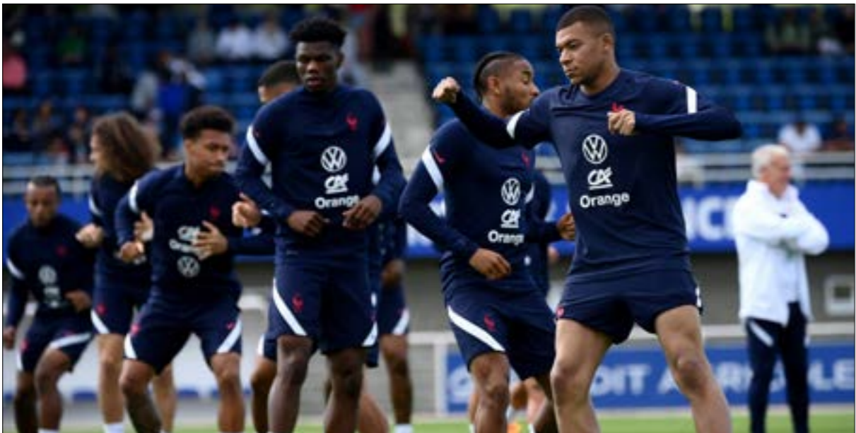
يصنع المنتخب الفرنسي للذمام عن لقبه

ينطلق اليوم الموسم الثالث من بطولة «دوري الأهم الأوروبية» لكرة القدم. البطولة حديثة العهد (تأسست عام 2018) بتنافس خلالها 55 منتخباً أوروبياً، يتم فرزهم حسب تصنيف الاتحاد الأوروبي لكرة القدم (12 منتخباً في المستوى الأول و12 في المستوى الثاني و15 في المستوى الثالث و16 في المستوى الرابع). وبحسب النظام تتنافس منتخبات المستوى الأول على اللقب، فيما يمنح دوري الأهم الأوروبية 4 مقاعد مؤهلة إلى بطولة أمم أوروبا المقبلة. وتم وضع روزنامة هذه البطولة لنحل مكان المباريات الدولية الودية، رغم الاعتراض الكبير من بعض المدربين واللاعبين نتيجة الإرهاق الكبير الذي يمكن أن يصيب اللاعبين الذين لم يقطع وقت طويل على إنهائهم للبطولات المحلية.