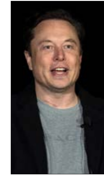
ارسل إيولت ماسك أجهزة نظام ستارلينك، إلى أوكرانيا