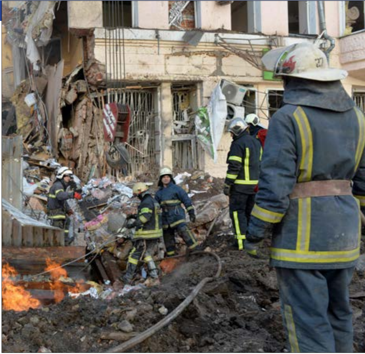
لم تستلمد موسكو اقتحام القوات الروسية مدناً أوكرانية كبرى (ف ر ب)

مع «ضمان أقصى حدّ من الأمن للسكّان»، الذين جدد أتهام القوات الأوكرانية والمجموعات الموالية لها باتخاذهم دروعاً بشرية. وفي حالة اتّخاذ قرار باقتحام تلك المدن، فإن الممرات الإنسانية هي التي ستكون في مامن فقط من النجران الروسية، بحسب ما يؤكّد الخبراء، وأشار المفوضيّة الأوروبية جوزيب بوريل، بيسكوف إلى أن الرئيس الروسي، فلاديمير بوتين، أمر منذ بداية العملية العسكرية، بعدم الاقتحام الفوري للمدن، بما فيها كييف، بسبب انتشار مجموعات المين المتطوّف في المناطق السكنية، الأمر