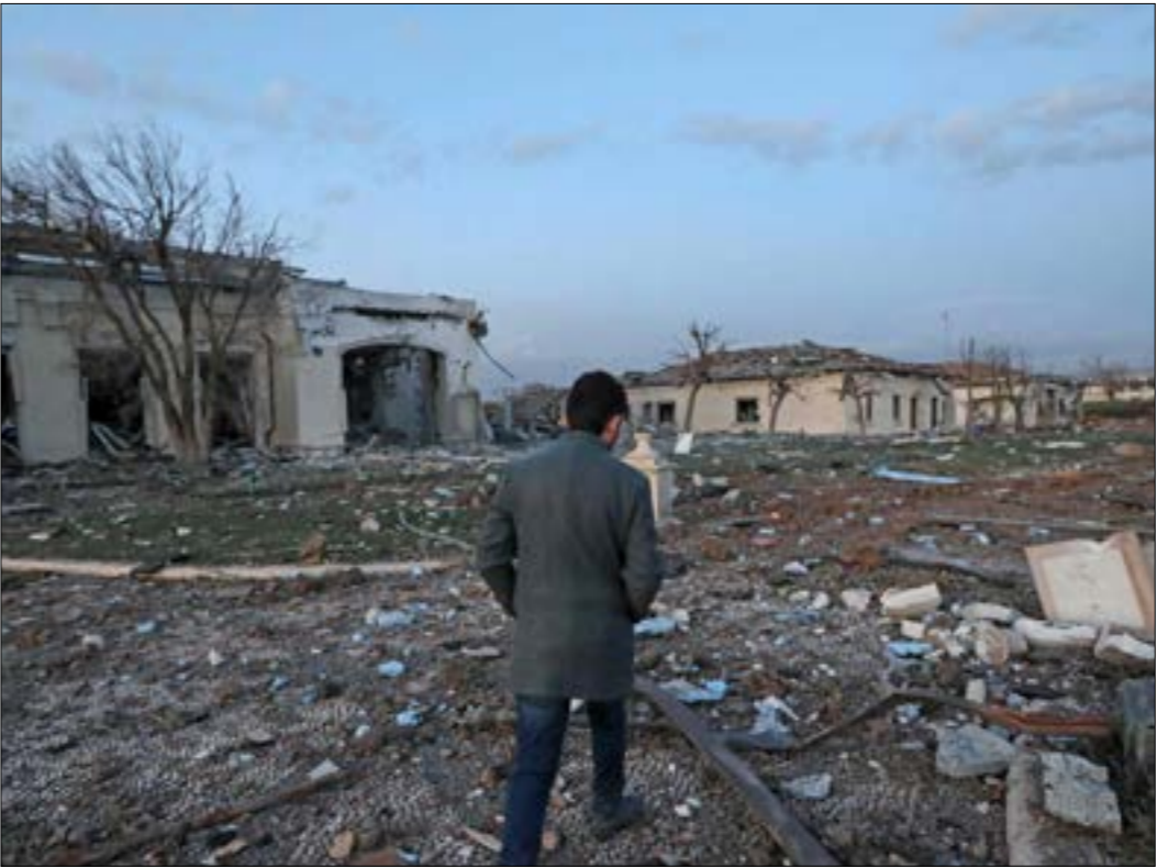
الهجوم الصاروخي على أربيل ليس إلا محطة في مسار

على أيّ حال، فإنّ ما ستُحضر على طاولة التخطيط والرّقار في تل أبيب، هو أنّ ثمة ارتقاءً إيرانيّاً في الرّد على الهجمات الإسرائيلية المتدرّجة في إطار استراتيجية «الموت بالف ضربة»، والتي كان العدو وضعها