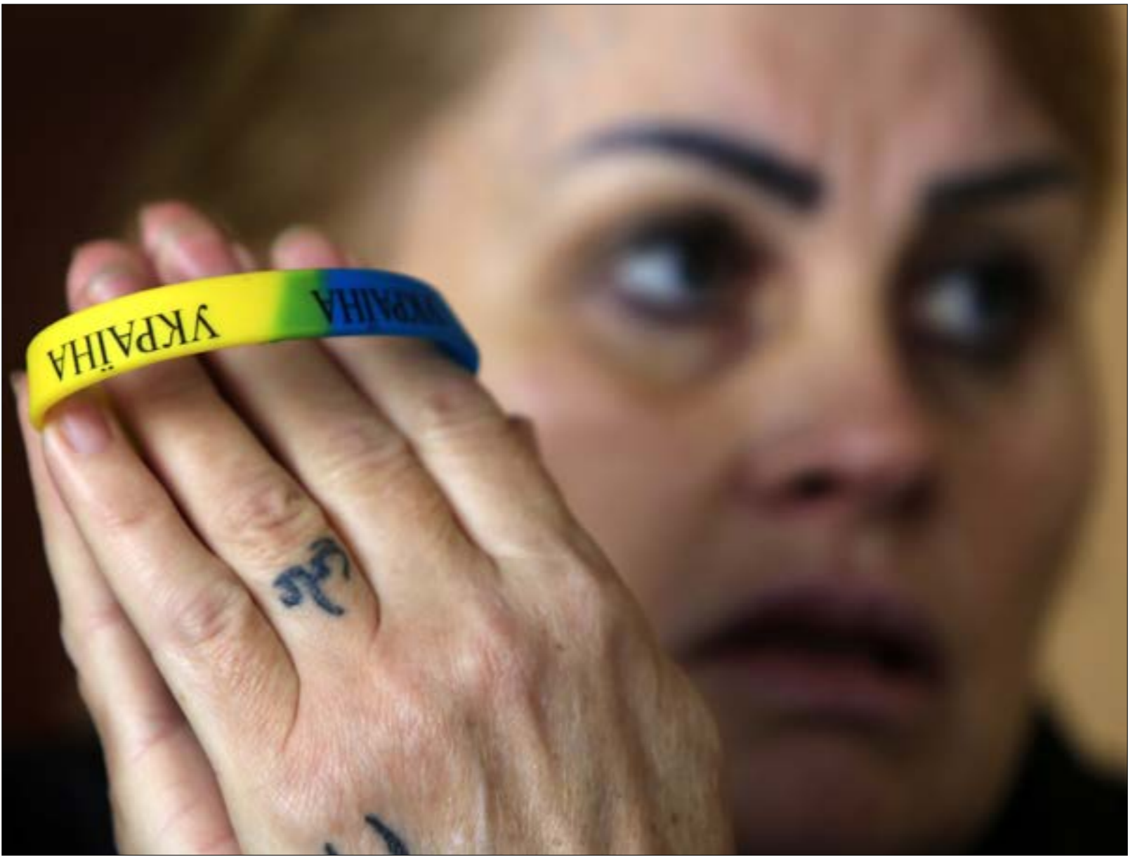
القلق على اهل بوخذ الأوكرانيات المنسحقات سياسياً (علي حشيشو)

وعلى رأسها الثقافتان الروسية والأوكرانية. آنذاك بدا الأمر عادياً، فالبرنامج كان صوت «جمعية متخزّجي جامعات ومعاهد الاتحاد السوفياتي في لبنان»، ومن أولوياتها وحدة الخَزيجين، وكانت الجمعية التي ولدت عام 1970 أصيبت بنكسات إثر انهيار الاتحاد السوفياتي، واتي البرنامج كإحدى ثمار انتعاشها بعد عام