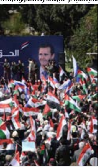
لا حصة المعلومات التي تحدّثت عنه فتح مكاتب استقطاب متطوعين في المدن التي تسيطر عليها الجولة السورية» (ف ر ب)

«الأخبار»، بأن عملية تسجيل أسماء الراغبين في القتال في أوكرانيا من عناصر الفصائل المسلّحة، مستمرة من قبّل قيادات هذه الفصائل، من دون أن تكون خفة توجيهاً واضحة من قبّل