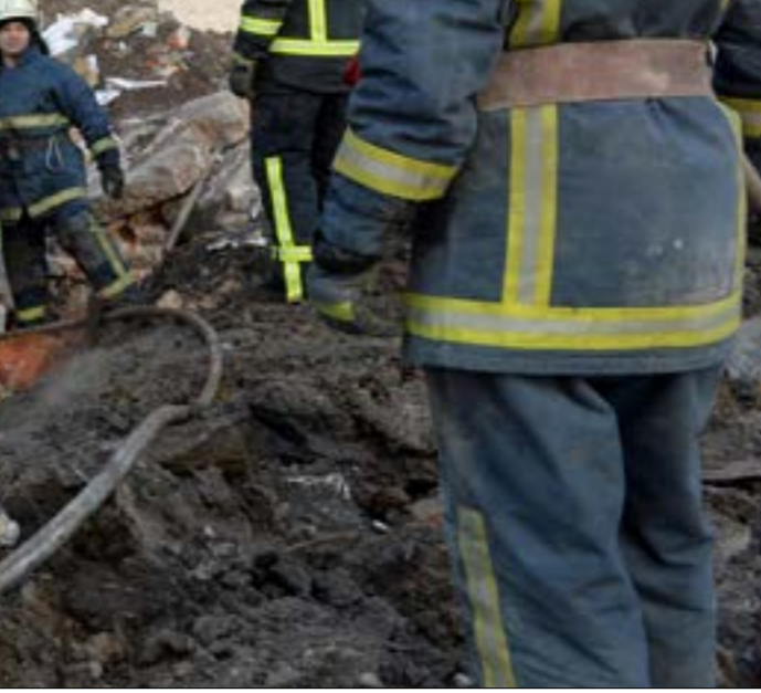
لم تستلمد موسكو اقتحام القوات الروسية مدناً أوكرانية كبرى

من جهته، لم يستبعد المتحدث باسم الكرملين، دميتري بيسكوف، اقتحام القوات الروسية مدناً أوكرانية كبرى،