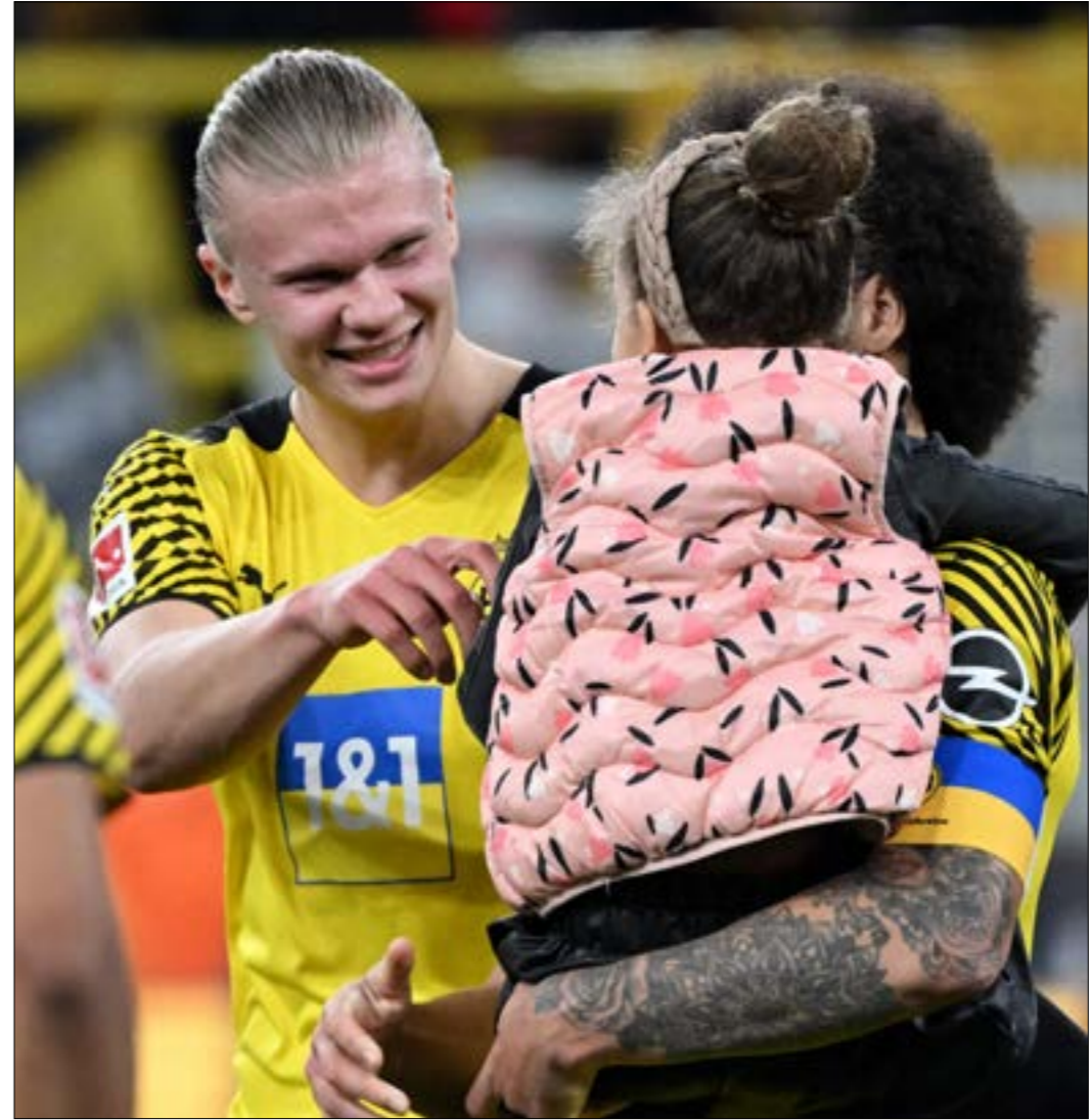
يقدم هالاند أداء استثنائياً مع دورتموند

سيصبح اللاعب إيرلينغ هالاند قادر على مغادرة نادي بروسيا دورتموند خلال الصيف المقبل مقابل دفع قيمة بنده الجزائي. العديد من الأندية ترغب في ضم الهداف النرويجي ما يحد بسوق صيفي تنافسي من الدرجة الأولى