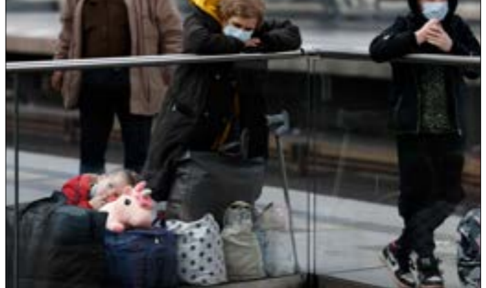
تجدّد الحديث في موسكو وكيفي مع تقدّم إيجابي على سبيل المفاوضات (ف ر ب)

مختلفة للغاية، لكنه أكد أن عملية التفاوض مستمرة. وتأتي الجولة، المرتقبة اليوم، في ظلّ تحدّ الحديث في موسكو وكيفي عن تقدّم إيجابي على مستوى المفاوضات، وفي هذا السياق، رجّحت وزارة الخارجية الروسية أن يتطوّر اتفاق التسوية المحتمل مع أوكرانيا، دعماً بقرار من مجلس الأمن. وأشارت الوزارة، في تصريحات خاصة لوكالة «سبوتنيك» إلى أنه «لا يوجد سبب لإرسال قوات