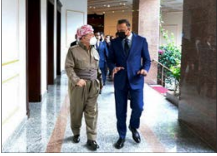
اطراف اقليمية ودولية تسعى لعرض حكومة موالية لها في المراف

الاستفراء بالحكم، بل وللمزيد من الهجوم على إيران، متحجّجاً بالهجوم الأخير الذي استهدف قواعد سريّة لـ«الموساد» الإسرائيلي في أربيل، وذلك بعد أن وجد هذا التحالف نفسه محشوراً إثر الاقتراب من اتّفاق على تشكيل الحكومة الجديدة، بما يخفّف من حدّة الأزمة السياسية في البلاد.