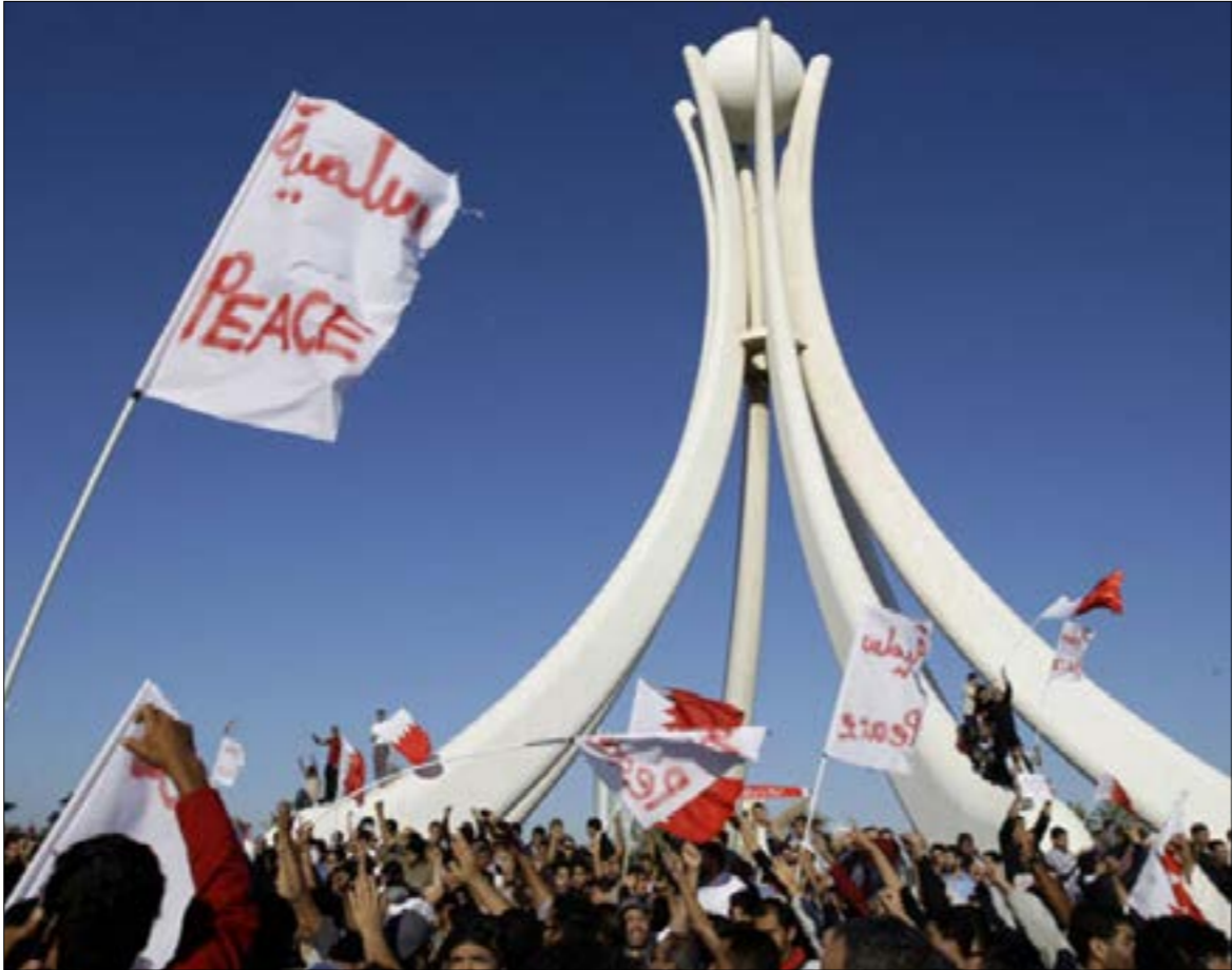
السلطة تريد إيجاد صفّ جديد لمعارضة مدخنة بمكث تحريكها ان تطهيرها

قد نجد بعض الإجابات في مرافعة الأمين العام لـ«جمعية الوفاق» للمعارضة، المعتقل الشيخ علي سلمان، وبالتحديد في الفصل الخامس المعنون «المناسبة»، والذي سرد فيه الشيخ سلمان كواليس لقاءاته مع الملك، ومحاواته «لفهائه» ونُصحـه بضرورة مناقشة ملفّات التازيم السياسي في البلاد، كالتجنيس السياسي والتمييز واحتكار السلطة والثروة، وبالتأكيد الأزمة الدستورية، ليردّ الملك عليه بالقول: «إن شاء الله يا علي كل ما تريد أن يكون سيكون». لكنّ الشيخ سلمان يخلص إلى أنّ «الحكم في البحرين يرفض ميذا الحوار السياسي المنفضى إلى حل الخلافات، وإن ادّعى خلاف ذلك، وتثبت الوقائع التاريخية والتجربة العملية أنّ الحكم حين يُقَبَل على حوار سياسي، يكون مدفوعاً إليه بفعل تآثيرات خارجية، وعند زوال أثرها، يتراجع عن الحوار بخلق أسباب