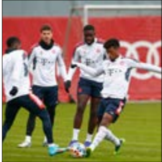
لعب إنتر دور المجموعات خلف ريال مدريد

يأمل بايرن ميونخ الألماني تجنب أي مفاجأة في أرض سالزبورغ النمساوي، ويدخل بايرن ميونخ حامل اللقب عام 2020، إلى مبارياته ضد سالزبورغ مرشحاً لوضع قدم في ربع النهائي. ورغم تشكيته مدججة بالنجوم، سيحؤول بايرن ميونخ على هدفه البولندي روبرت ليفاندوفسكي الذي سجل تسعة أهداف في ست مباريات في دور المجموعات، ويحتل المركز الثاني في ترتيب الهادفين خلف العاجي سيباستيان