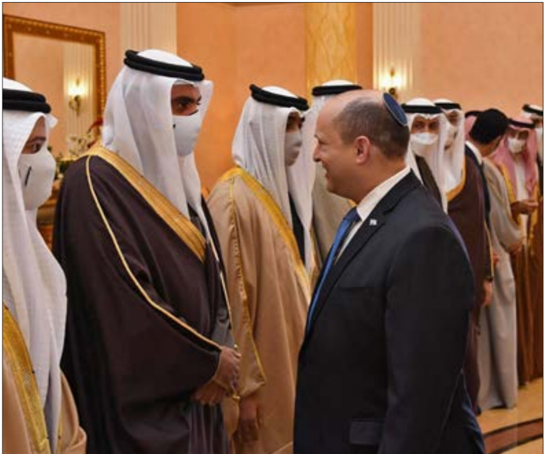
الحلالك الاسرائيلي صر طائر الوجود في يوميات النظام البحريني

الخامس الأميركي، علماً أنّ هذه الجالية تضمّ ما بين 36 و50 شخصاً فقط، جُلُّهم من أصحاب المناصب الذين يتخلّون أكثر من مقعد في مجلس الشورى، أو يشغلون مهامّ سفراء.