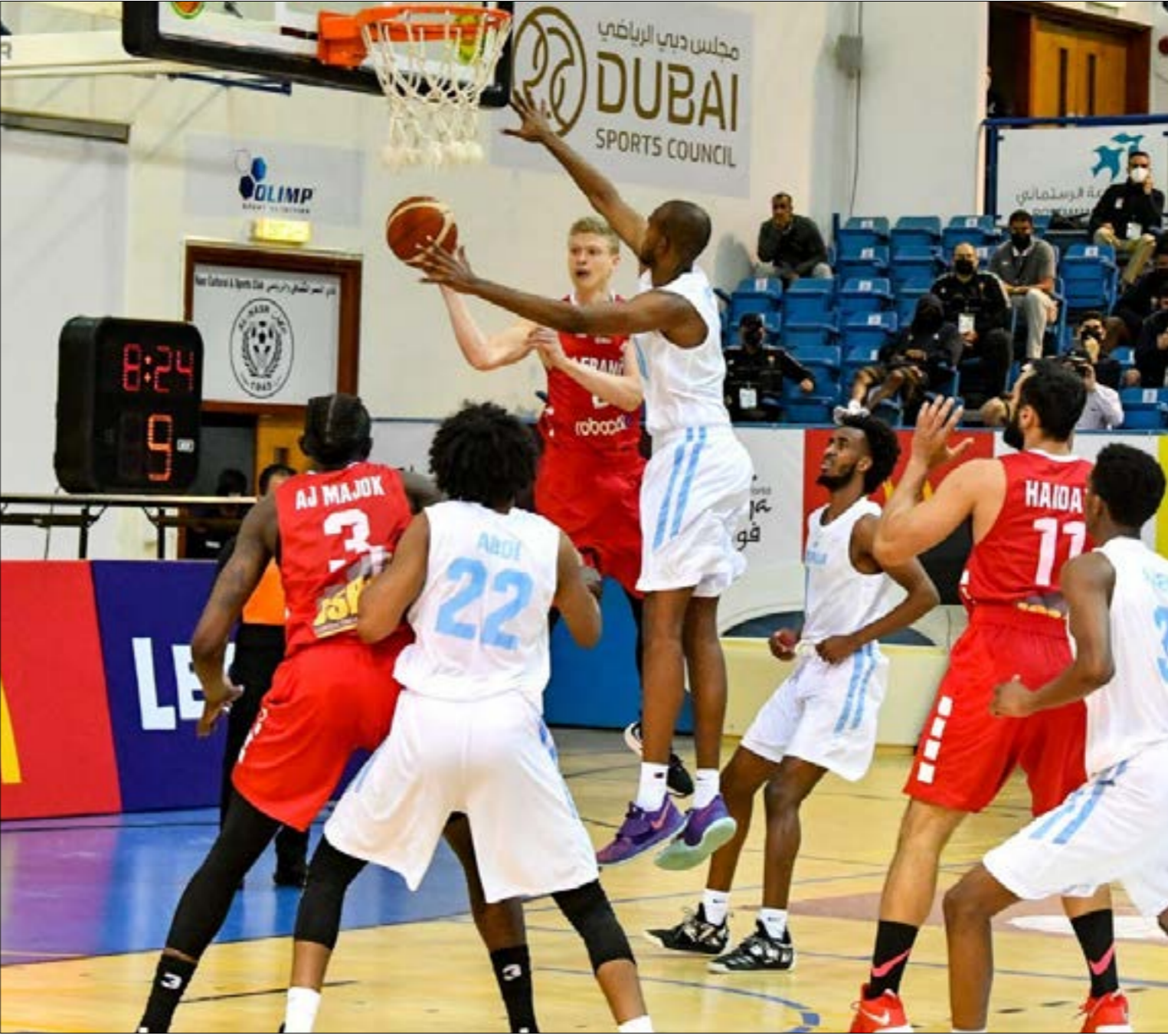
حقق المنتخب اللبناني 4 انتصارات متتالية في البطولة

وصل منتخب لبنان لكرة السلة إلى المحطة النهائية من بطولة العرب الرابعة والعشرين للمنتخبات التي تستضيفها دبي بالإمارات. نهائي لت يكون سهلاً للمنتخب اللبناني أمام نظيره التونسي القوي. (اليوم الساعة 16:00 بتوقيت بيروت). إلا أن حلم اللقب العربي الأول للمنتخبات سيعطي حاضراً كبيراً لرجال الأرز من أجل إنجاح المهمة بنجاح