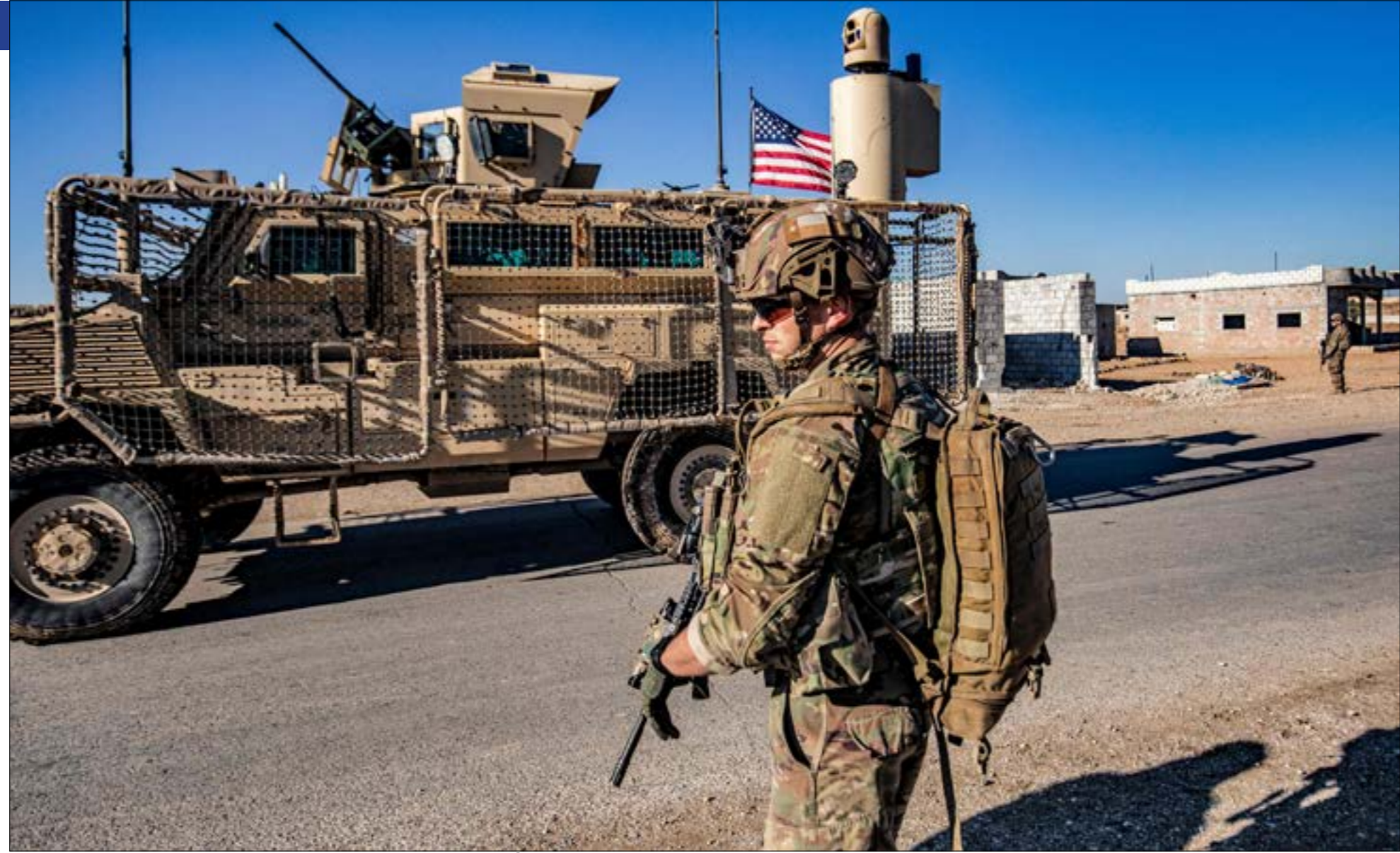
توقّفت المفاوضات بين روسيا، قسد، بعد انسحاب الأكراد مجدداً خلف الموقف الأميركي

مسؤولي «قسد» تتخذ منحى أكثر حدة خلال الأيام الماضية، حيث هاجمت الرئيسة المشتركة لـ«مجلس سوريا الديمقراطية» (مسد)، سوزيا الكردية فيها بكافة الوسائل، إنه أمر معروف للجميع، متابعاً أنه «يكتنّ على الأكراد أنفسهم، لإسما زراعهم السياسية المتمثلة بحزب الاتحاد الديمقراطي ومجلس سوريا الديمقراطية، أنّ يقفروا نهجهم». في المقابل، بدأت نبرة حديث