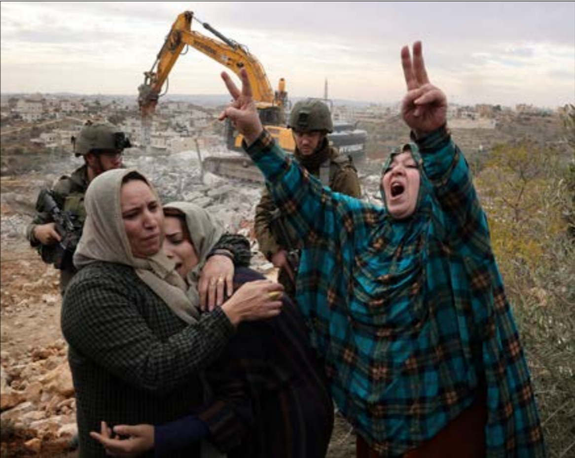
اعتبرت الفصائل الاجتماع «غطاء لجرائم الاحتلال بحقّ أبناء الشعب الفلسطيني»، (ف ب)

أصيب عامل في جيش الاحتلال برصاص قنّاص فلسطيني، عند حدود شمال قطاع غرّة. وبحسب بيان صادر عن المتحدّث باسم الجيش الإسرائيلي، فقد «أصيب المستوطن بجروح طفيفة»، نُقل على إثرها إلى مستشفى «برزيلاي» في مدينة عسقلان، فيما صدر قرار بوقف الأعمال الزراعية بالقرب من السياج الحدودي، بالتراري مع ذلك، أفادت مصادر محلّية فلسطينية بأن مدفعية الاحتلال قصفت نقاط رصد تابعة لعناصر الضبط الميداني على حدود القطاع، وفتحت نيران رشاشاتها في محيط منطقة «كيسوفيم» شمال شرق مدينة خانينوس جنوب غرّة، ما أدّى إلى إصابة 3 فلسطينيّين بجروح طفيفة.