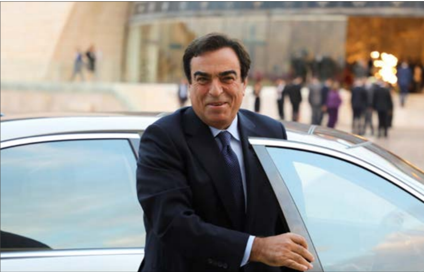
شكّلت قضية جورج فرداخي أبرز قضايا العام

آخر، سيطرت عليه القنوات «المهيمنة» التي باتت في خندق واحد متحدة ضد تيارين واضحين في البلد: «حزب الله» و«التيار الوطني الحر». هذه المشهدية تكاملت مع حركة دولية إقليمية، باتت تتحكّم بمفاصل الإعلام اللبناني وتوجّه بوصلته. أسهمت في تعزيز ذلك تحاليفات الأنهار الاقتصادي، وسعي هذا الإعلام لإيجاد سبيل لجمعه مالياً ولو على حساب المصلحة الوطنية، مع مرور البلاد في حوادث أمنية خطيرة، كادت أن تقترب من