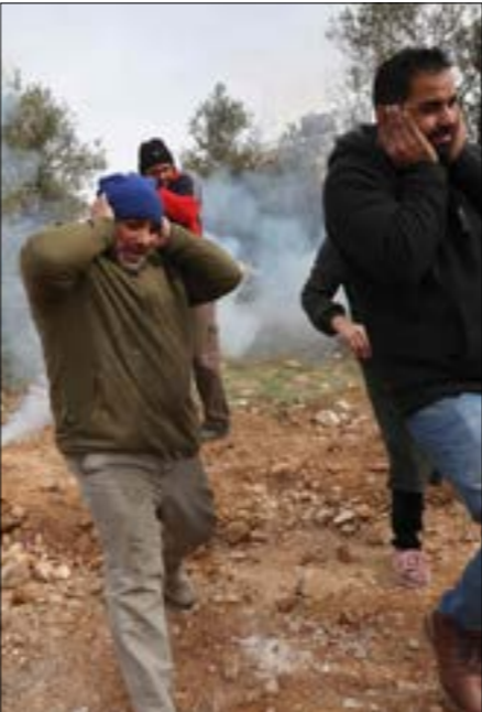
بالنسبة إلى إسرائيل فإن أي تحرك لإفناء السلطة يفضّه محكوماً بـ«لاغّين»، (ف ب)

الاحتلال لمنع التهديدات الأمنية عنه، خصوصا أن السلطة بلغت في إخلاصها لوظيفتها هذه، حدّا لم يدرّ في مخيلة الإسرائيليين أنفسهم في تسعينيات القرن الماضي، من دون أن يتأثّر أدائها هذا حتى بالإعلان عن التصديق عليها وإذلالها. ومن هنا، نجد السياسيون الإسرائيليون منذاً واسعاً لإطلاق المزادات في ما بينهم بخصوص رام الله، والتفنّن في محاصرتها، ليس من بوابة الفلسطينية ضعيفة على المستوطنين الشعبي والسياسي، ومازومة على المستوى الاقتصادي، فإن العمليات التي تنفّذ في الأراضي المحتلة يمكن أن تشكّل خطراً عليها نفسها، وتُدفع في اتجاه تعميق أزمتها. لكن بالنسبة إلى إسرائيل، فإن أيّ تحرك لإفناء السلطة وتكبيتها من البقاء، باعتبارها أهمّ وسيلة دفاعية عن الاحتلال في وجه المقاومين، يبقى محكوماً بـ«لاغّين» لا عطاءات عبر «المسيرة السياسية» والمفاوضات،