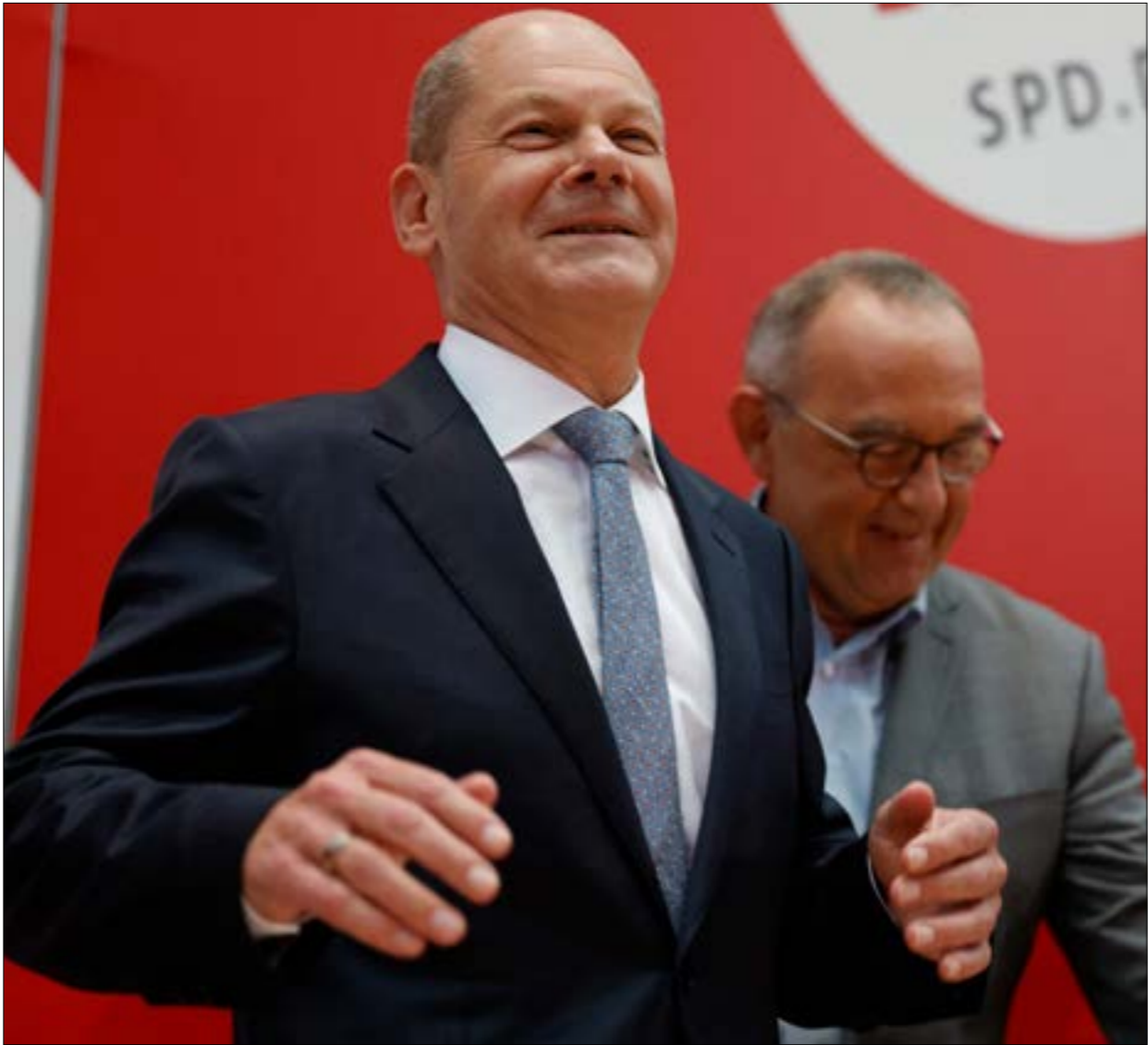
الوباء، شولز مرشد الحزب الاشتراكي الديمقراطي، يقف نفسه إلى على أنه، مستشار الصاخ

الأحزاب الأصغر إلى ائتلافات يمكنها عبور اختبار الثقة في البرلمان، وتشكيل حكومة جديدة بعد فشل كلّ منهما في الحصول على أغلبية كافية في جولة الانتخابات غير الحاسمة (26 أيلول الماضي)، وفيما لا يتوّعم انتهاء المحادثات بهذا الشأن قبل عدّة