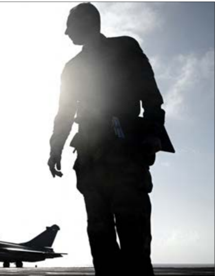
أنختت الجزائر قراراً بمنع تخليق الطائرات العسكرية الفرنسية في مجالها الجوي

من دون شك إلى إعادة النظر في هذه المقاربة. وفي الفترة الأخيرة، صعّدت السلطات الفرنسية من لهجتها ضدّ دول المغرب العربي غير المتعاونة معها في استعادة المهاجرين، إذ تفيد الأرقام بأن هناك أكثر من 7 آلاف قرار ترحيل يشمل جزائريين في فرنسا، في حين من تمّ ترحيلهم فعلاً لا يتجاوزون ثلاثين شخصاً. والواقع أن الحديث المتكرّر عن الهجرة في