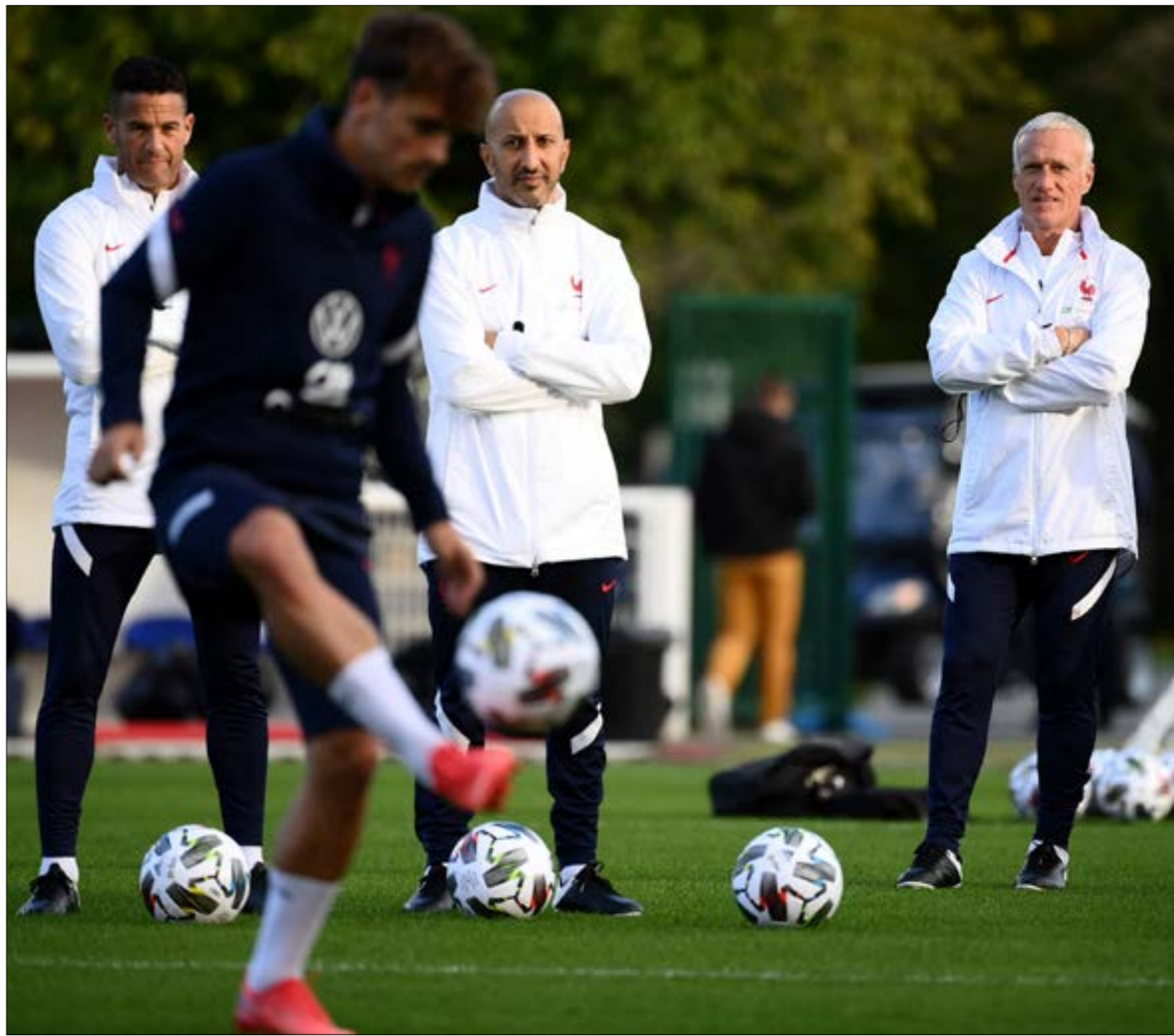
دوري الوبك الأوروبية