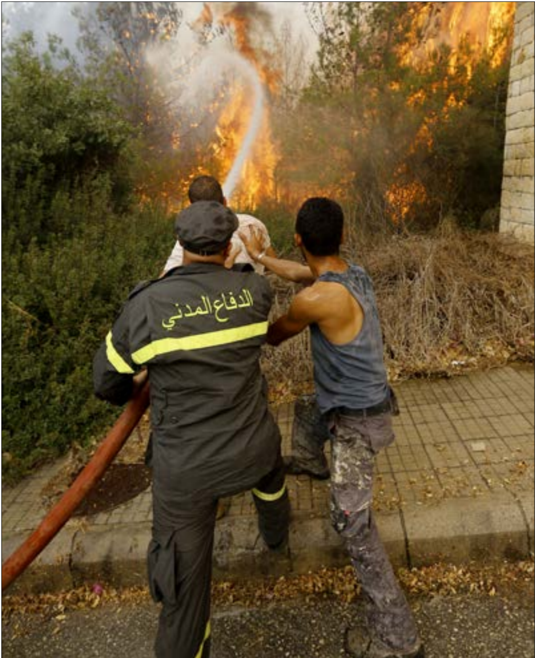
(الرشيف، مروان حطّط)

المهددة بالانقراض، و4 أنواع من الطيور المهدة بالانقراض، و7 أنواع من الطيور المعرضة للحظر، و15 نوعاً من الطيور المهددة نسجياً). ما يزيد من أعداد الحشرات التي تفتك بالغابات، صحبح أن الطيور تتمايز عن الزواحف بقدرتها على التحليق والهروب من الحرائق، إلا أن الخيران تدمّر موائلها ومصادر غذائها. ومعلوم أن تنوع النظام الغذائي للطيور (مثل الحريق والفاكهة والبذور والحشرات وغيرها)، يساهم في الحد من تدهور النظم الإيكولوجية للغابات. كما تقلل الطيور من الآثار المدمرة لمخاطر نشوب الحرائق والجفاف وتقليل قدرات الشجود الطبيعي.