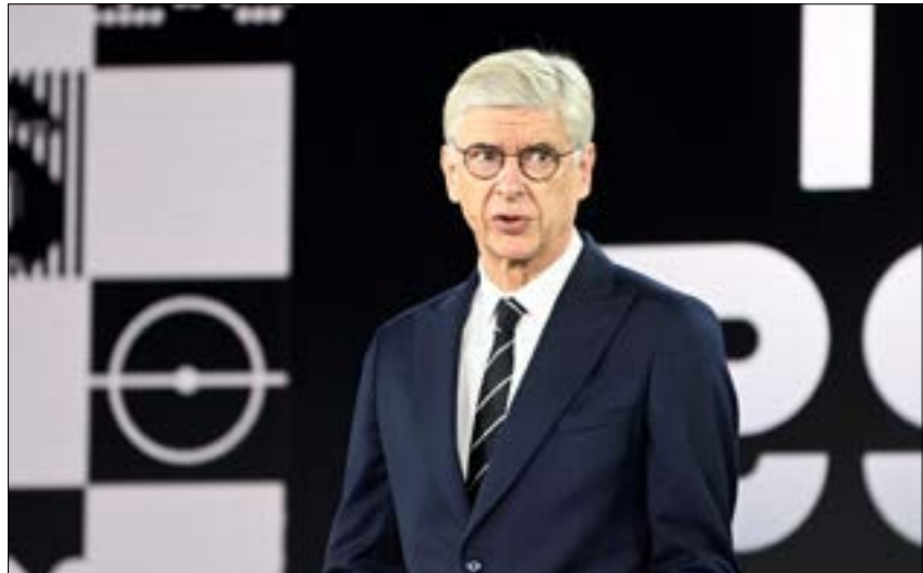
الفكرة اطلقتها الحبر ارسين فينغر (أضرب)

اللاعبين الدوليين، لأنهم بحسب رايه سيخوضون عدداً أقل من الرحلات الطويلة وسيستفيدون من «25 يوماً على الأقل» من الراحة بعد منافساتهم الصيفية مع منتخبات بلادهم. ومن المقرر أن يصدر فيفا تقريراً كاملاً في تشرين الثاني/نوفمبر قبل «قمة عالمية» بحلول نهاية العام. فيفا «دراسة جدوى» اقترحها الاتحاد السعودي للعبة، المقرب من رئيس الاتحاد السويسري، الإيطالي جاني إنفانتينو، خلال اجتماع الجمعية العمومية الـ71 في فيفا الذي عقد بتاريخ 21 أيار/مايو 2021.