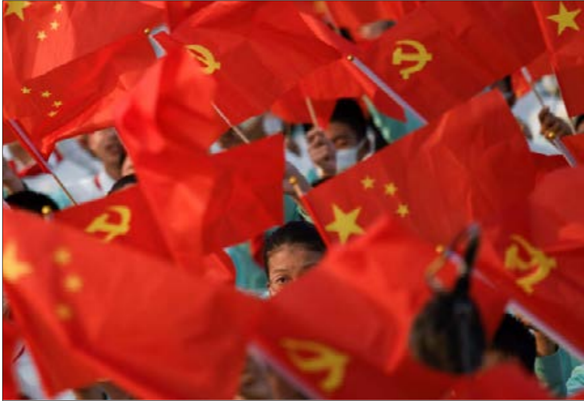
أعلن الرئيس الصيني أنّ بلاده سيُدّ «سورا فولاذيا» لصنّ أيّ عدوان أو تامر غربي عليها

للاقتراع. أمّا الإيرانيون فبدوا يدرسون جدباً خيار التاجيل، وما سيترتب عليه من تصعيد مرتقب، في حين لم تُعدّ «المرجعة الدينية» في النجف متحمّسة للاستحقاق كما كانت سابقاً.