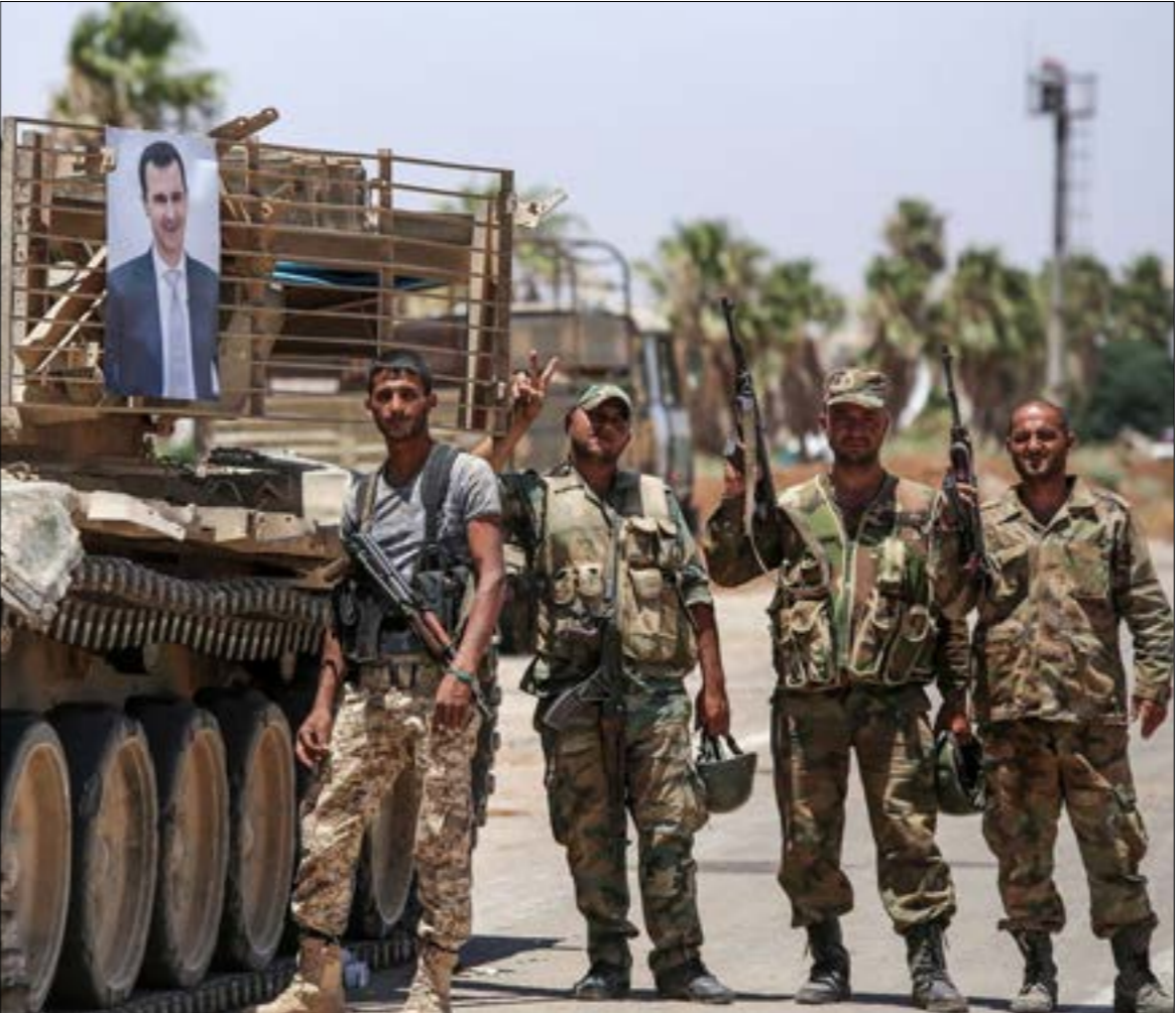
استقدم الجيش السوري تعزيزات إلى درعا وعمد إلى رفع سواتر ترابية في المدينة

الانتخابات الرئاسية في أيار الفائت، انعكاساً لما يجري في هذه المحافظة من تصعيد وعمليات تستهدف شخصيات حكومية سورية، أو عناصر تسوية، أو عسكريين في القوى الأمنية والشريعة، منذ سنتين تقريباً. وحصدت الاعتقالات التي يتركز أغلبها في ريف درعا الغربي على مقربة من الحدود الأردنية، خلال شهر حزيران فقط، 12 قتيلاً من مدنيين وعسكريين. وعلى الرغم من إنحياز الانتخبات في بعض مناطق المحافظة مركزز مدينة درعا وجزء من ريفها الأمن، إلا أن رفضاً تاماً