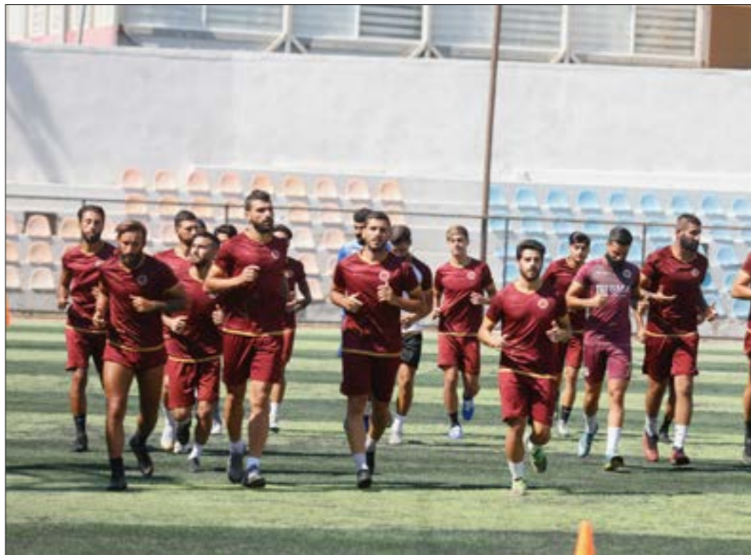
تدريب فريق النجمة حط لك مدرب محلي