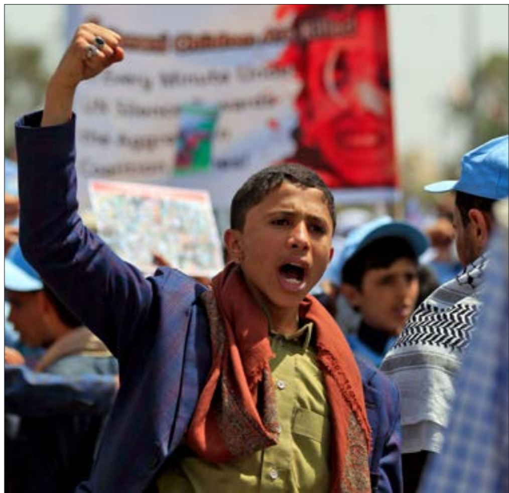
توعد الجنان اليمنی و اللجان الشعبية، بالاستمرار في العمليات حتى استعادة كامل محافظة البيضاء

قدر عال من التدريب. وجاء ذلك في وقت تُوعّد فيه الجيش واللجان بالاستمرار في العمليات حتى استعادة كامل محافظة البيضاء. مركز مديرية الزاهر إلى «حرصهما على حياة المواطنين وعدم تعريض المدينة للدمار»، موضحة أنّ قوات القاعدة في جزيرة العرب، خالد