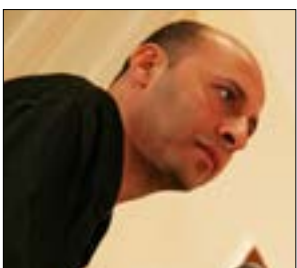
...CoolDrive جاز في الأشرافية

حوار مع منير شفيق: اليوم الخميس . الساعة السابعة مساءً - منصة «زوم» ومباشرة عبر صفحة «مركز دراسات الوحدة العربية» على فايسبوك. (الرابط متوافر على موقعنا - رابط النشاط: 2196919605)