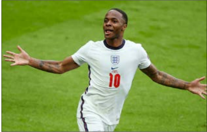
بات ستربلينج اهل لصبي سجله اهداف بلاده اللالة الاولى منذ غاري لينيك في مونديال 1986 (إف ب)