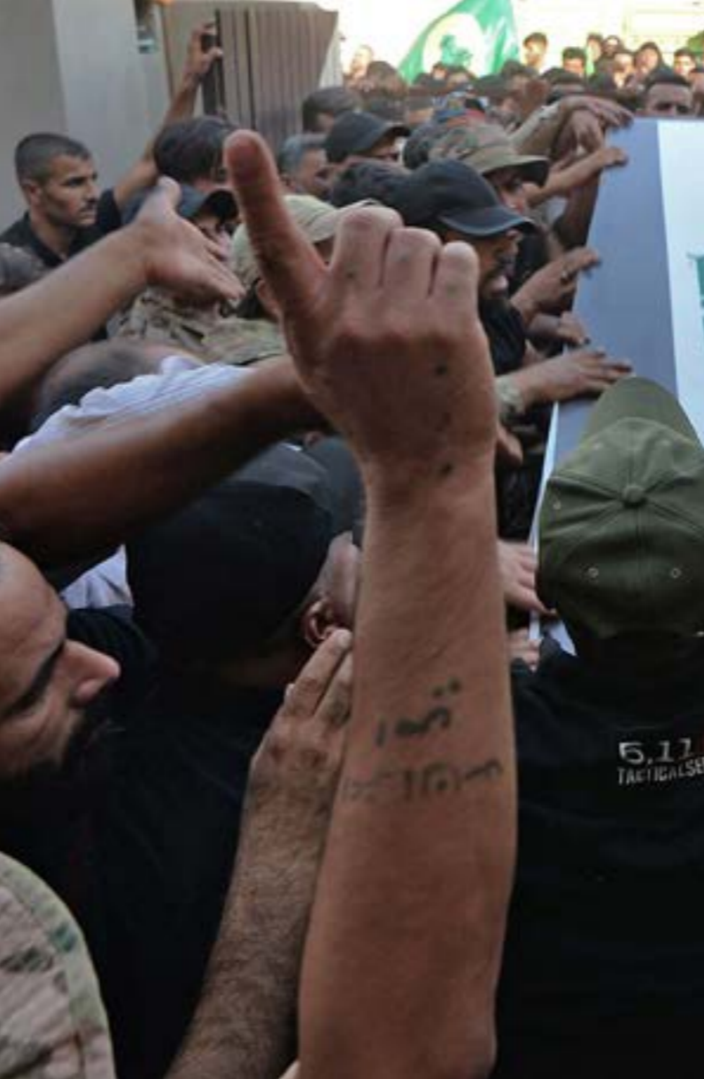
عاشت القوات الموجودة في القاعدة الأميركية في حقل العمر حالة من الرعب بعد القصف الذي استهدفها

هو المرز، المُعلن على الأقلّ، للغارات الأخيرة التي قالت وزارة الدفاع في واشنطن إنها استهدفت القواعد التي يستخدمها «الحشد» لإطلاق المِسْرات المتفجرة. وعليه، تُعتبر واشنطن ما يجري تصعيداً نوعياً للحملة ضدّها، وهي تبحت عن حلول له بالعلمي العسكري،