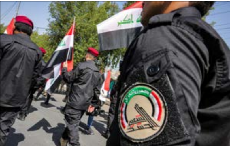
قال «البيان»، إنه استهدف القواعد التي يستخدمها «الحشد» لإطلاق المِسْرات المتفجرة

هو المرز، المُعلن على الأقلّ، للغارات الأخيرة التي قالت وزارة الدفاع في واشنطن إنها استهدفت القواعد التي يستخدمها «الحشد» لإطلاق المِسْرات المتفجرة. وعليه، تُعتبر واشنطن ما يجري تصعيداً نوعياً للحملة ضدّها، وهي تبحت عن حلول له بالعلمي العسكري،