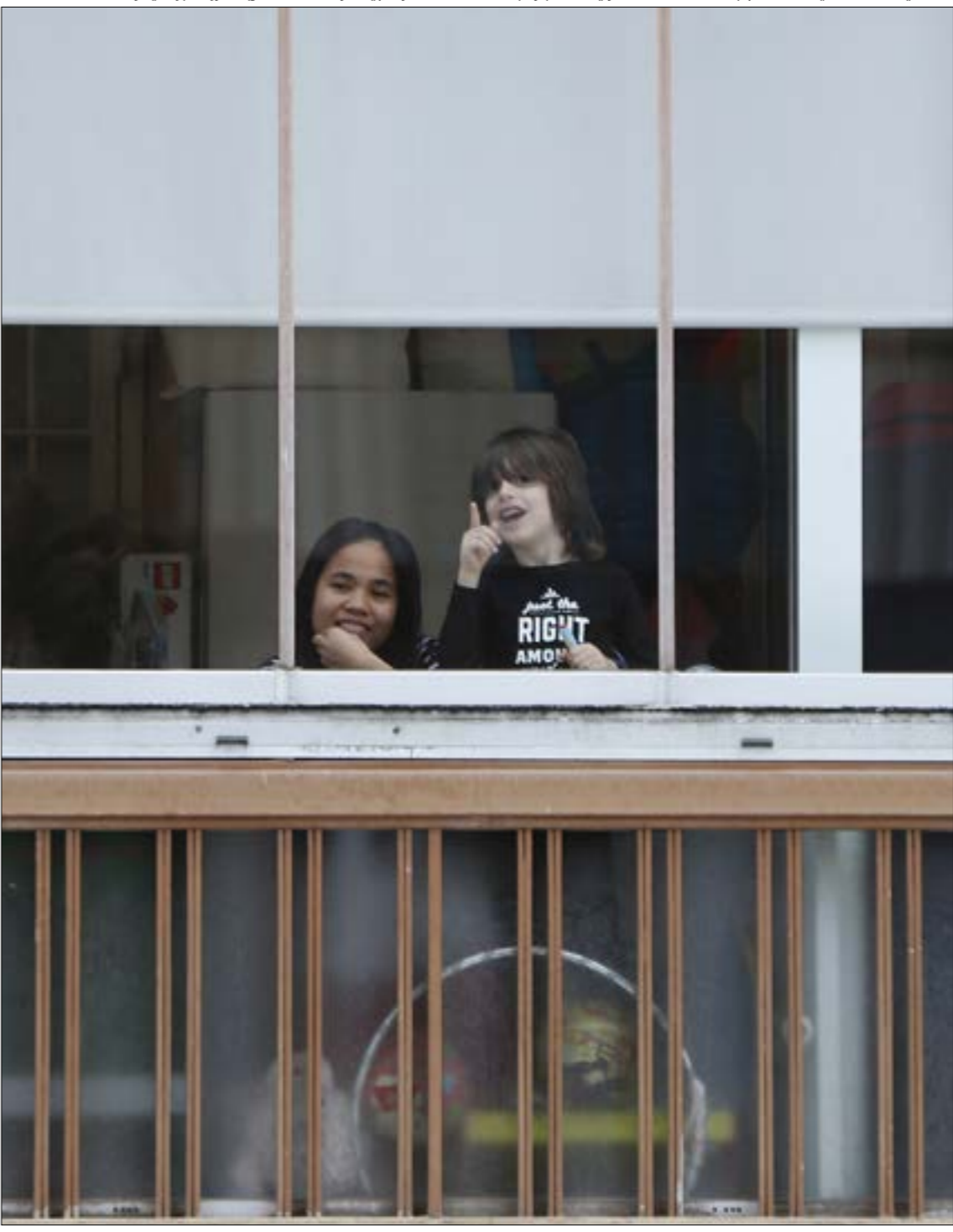
حتى نيسان الماضي، استقدم لبنان 600 عاملة منزلية مهاجرة بعدما كان هذا الرقم يناهز الـ 17 ألفاً شهرياً