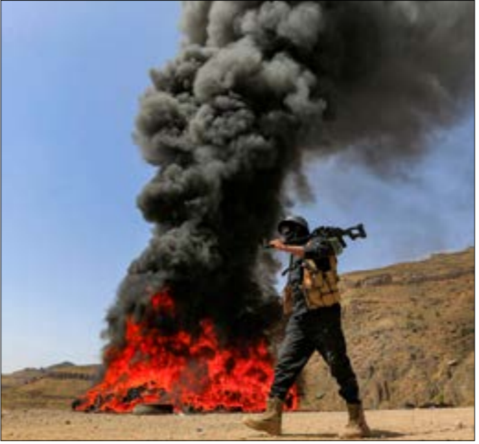
لغة مسلحين إقليمية دولية لإفحام حكومة صنعا بإفحام التصعيد العسكري عند تخوم مدينة مارب

أم الرفع الكامل للدعم عن غالبية المحروقات، إلى جانب التحريك المستمرّ لأسعار الكهرباء والمياه لتصبح معادلة للأسعار العالمية تقريباً، في حين تقوم الدولة - كما كل دول العالم - بصرف رواتب المواطنين بالعملة المحلية. وفي حين يعتبر مؤيدو «30 يونيو» أن ما جرى في ذلك الحين امتداد لـ«ثورة 25 يناير»، إلا أن من عارضوا الرئيس الإسلامي الراحل محمد مرسي، احتجاجاً على تحريك بسيط في الأسعار بعد أشهر من توليه منصبه، وعارضوا كذلك قرصناً بقيمة تُقلّ عن 6 مليارات دولار من «صندوق النقد الدولي»، هم أنفسهم من وافقوا وهلّلوا الإجراءات تفوق تلك الإجراءات بعشرات المرات، بما