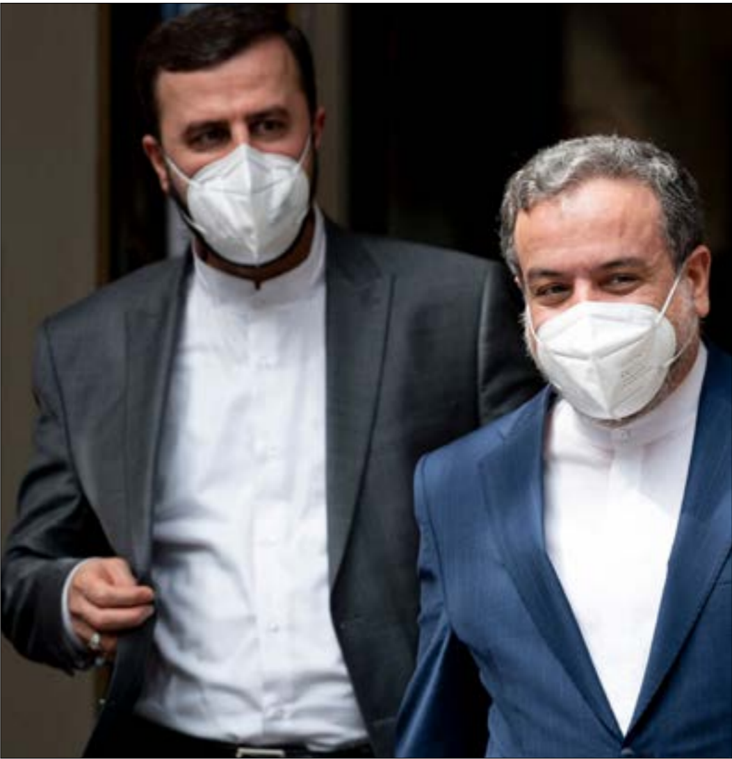
تعدّ مسالة رفع العقوبات من بين أبرز عناوين الخلاف في فيينا

جو بايدن والروسي فلاديمير بوتين، تُظهر صعوبة تخفيض التوترات الناجمة عن المنافسة الاستراتيجية بين الغرب وروسيا. «باريس8»، فإن تلك القفّة، التي اعتُبرت نصراً معنوياً بالنسبة إلى موسكو، لم تبعث أملاً كبيرة في واشنطن. بالنسبة إلى جو بايدن، فإن فكرة التأسيس لعلاقات جديدة مع روسيا غير موجودة أساساً. ما أрадته واشنطن بالفعل هو محاولة تحديد ما تُسفيه بحدود جديد خطوطاً حمراء والسعي إلى تهدئة التوترات». وبحسب الباحث الفرنسي، فإن تجميد التناقضات المتنامية بين موسكو وواشنطن للسماح للأميركيين بالتركيز على التحدي الصيني، هو مهفة شبه مستحيلة، أولاً بسبب الخوابيا الاستراتيجية لموسكو التي لا تحث عن تفاهات مع الأميركيين والغربيين بشكل عام. «الأهداف الرئيسية للطرفين متناقضة. الولايات المتحدة والغربيون قوى محافظة ومستفيدة جوهريا من النظام الدولي الذي جرى تشييده تدريجيا منذ 1945، وتريد إدامته على حاله. أما روسيا والصين، أو إيران، فهي قوى تحريرية، ومعاداة جذريا للوضع القائم وتعمل على تغييره»، وفقاً لمونغروني، الذي يعتقد، بناءً على ذلك، أن التقاطع