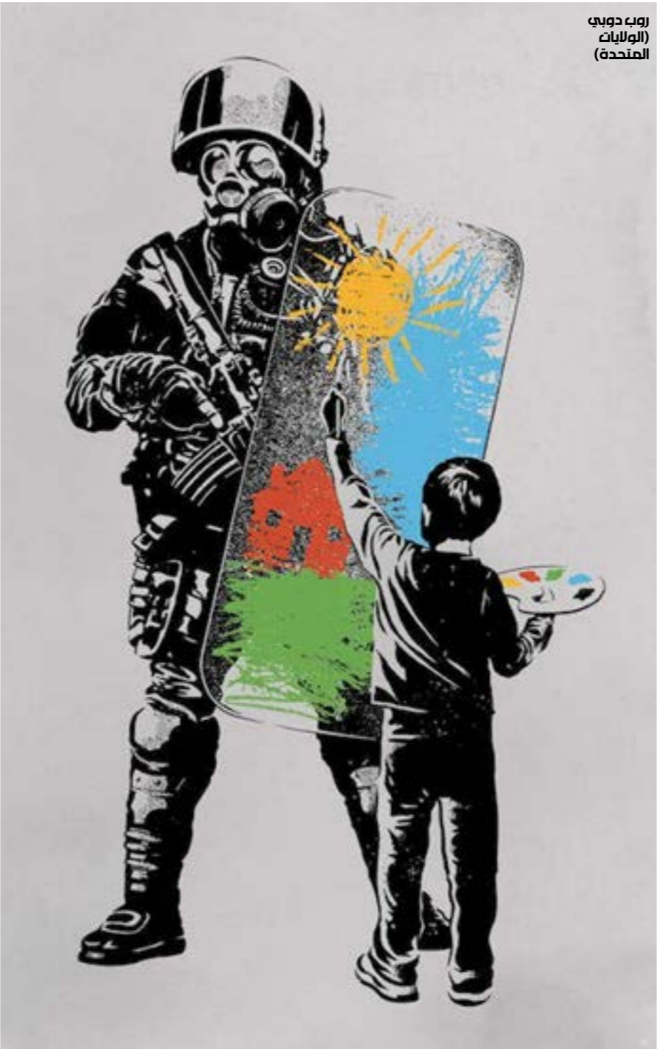
روب دوبيش (الولايات المتحدة)

أنّ الأميركيين لديهم من «المونة» ما يكفي عبر العصا أو الجزرة، كما عزّر ديفيد هيل، على الرئيس المكلف بتشكيل الحكومة لكي يخلق الأعداء لعدم التشكيل، وبالتالي تحمّل الرئيس ميشال عون وحزب الله مسؤولية التعطيل والانهايار، وهذا ما نشاهده من خلال وسائل الإعلام المدعومة اميركياً، والشخصيات التي تدور في الفلك السياسي الأميركي، والمواقع الإلكترونية التي تولد كالفطر والمدعومة من الأميركيين.