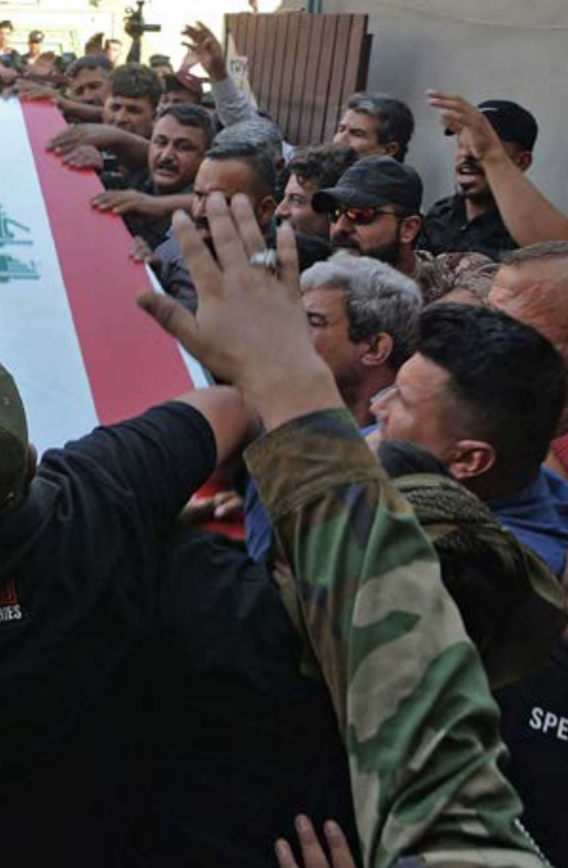
عاشت القوات الموجودة في القاعدة الأميركية في حقل العمر حالة من الرعب بعد القصف الذي استهدفها

القوى المناهضة لهم، ويُقرّون في الوقت نفسه بالعجز عن إيجاد علاج تقني له حتى الآن، خاصة أن المُستَرات التي يجري إطلاقها عادة في الليل، تحلق على ارتفاعات منخفضة، بحيث لا يمكن للإدارات الأميركية التقاطها، مثلما تلتقط الصواريخ والمقذوفات الأخرى، والتي تُعتبر الهجمات بها، التي كانت تُشنّ في السابق، مجرد عمليات تحرّش، مقارنةً بهجمات الأشهر القليلة الماضية التي استخدمت فيها المُستَرات، هذا