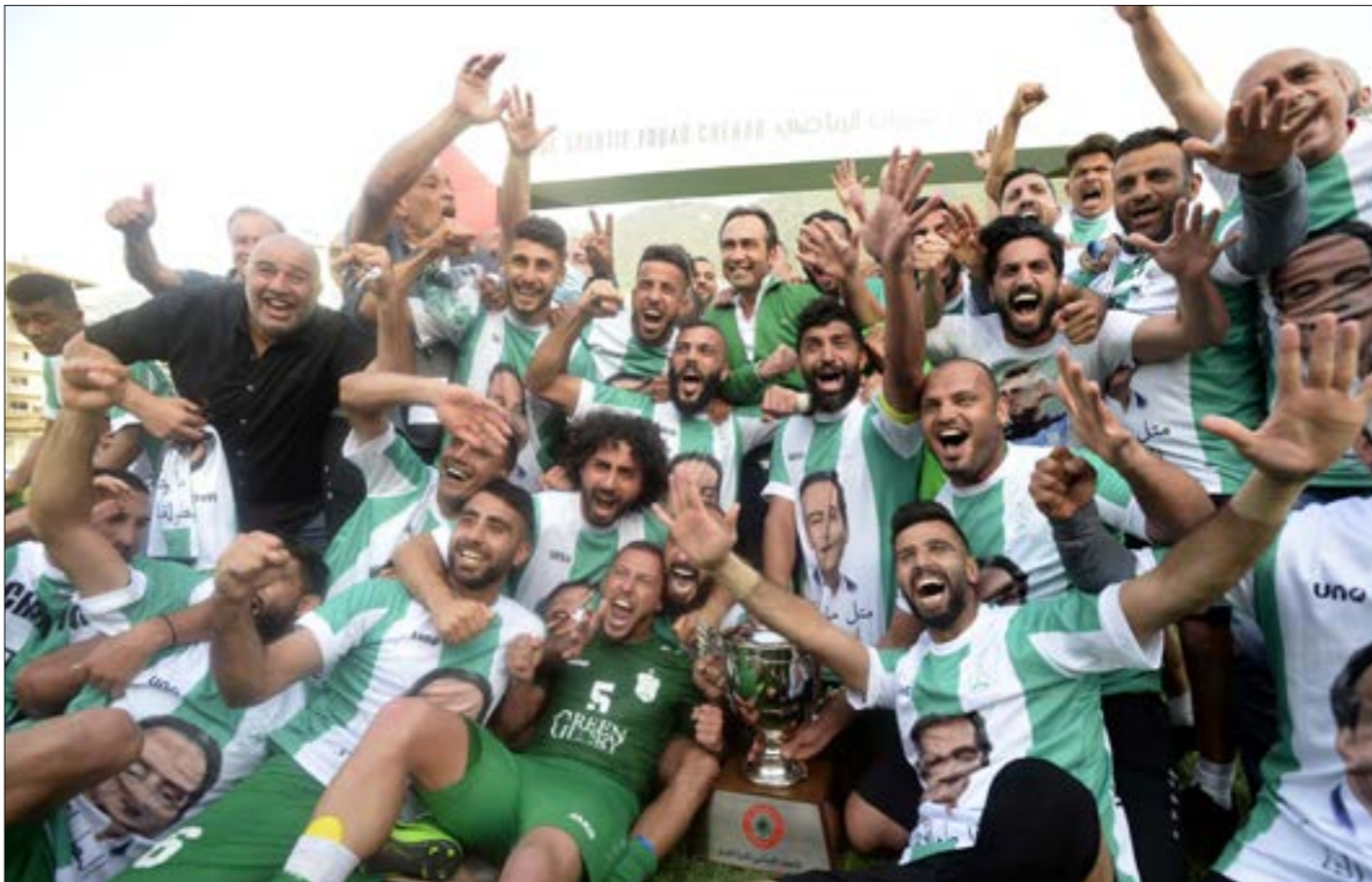
لاعب فريق الأنصار مع كأس الدوري الرابعة عشرة في تاريخ النادي

الأنصار بطل لبنان. عبارة مزّ وقت طويل على آخر مرة كُتبت فيها. لكن لاعبي الأنصار كتبوا عصر السبت مع إحرازهم لقب بطولة لبنان لكرة القدم بفوزهم على أخصامهم النجميين (1-2) على ملعب جونيه في ختام موسم 2020-2021. لحظة طال انتظارها لجمهور «الأخضر»، لكنها حانت وحقق الأنصار اللقب الـ14 في تاريخه