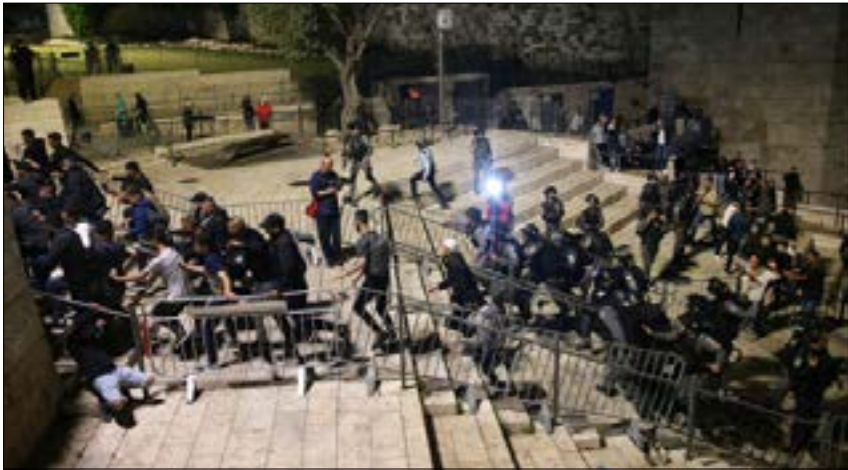
هناك إجماع لدى العدو على أن ما يجري مرتبط سببياً بمواجهات القدس ما يستدعي من إسرائيل نفسها معالجة الأسباب (الناظر)

وحدة استيطانية تعود إلى أهالي الشيخ جرّاح، مؤكداً أنه تمّ تسليم سجلات الملكة الرسمية، والعاخدة إلى وزارة الإنشاء والتعمير سابقاً، وكلّها تبيّن بعد البحث الدقيق والمطول إبرام عقود ناجر لعدد من الأهالي تمّ نشرها في الصحف الأردنية. وتخطّط سلطات الاحتلال لبناء 200 وحدة استيطانية فوق أراضي الشيخ جراح وبيوته، بما فيها نصّب تذكاري لأحد الروية الجيش، على أن يخدم هذا المخطّط رؤية العدو في تطويق البلدة القديمة، بتحقيق امتداد جغرافي استيطاني، وخلق الأحياء الفلسطينية وقطع تواصلها، وخلال مطلع العام الجاري، طرحت على طاوله حكومة الاحتلال ثلاثة مشاريع تهويدية للقدس، تقوم على مصادرة أحياء فلسطينية كاملة وتشريد سكانها، ومن تلك المشاريع كاملة مصادرة نحو 40% من أراضي الشيخ جرّاح، وطرد 500 مقدسي منه خلال شهرين، وبالفعل، صدر قرار ضدّ سبع عائلات بإخلاء منازلها قبل الشهر المقبل، وأخرى قبل اب/ أغسطس المقبل، وذلك لعجزها عن إثبات ملكتها نتيجة تلك الحكومة الأردنية والسلطة الفلسطينية في هذا الملف.