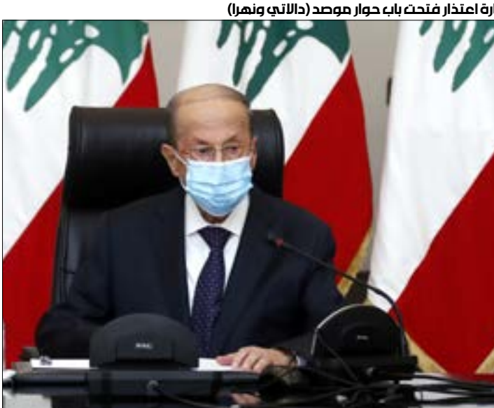
زيارة اعتذار فتحت باب حوار موصد (الناجي ونهرا)

وقد تطرّق الاجتماع بصورة خاصة إلى ضرورة إيجاد البات للتواصل الدائم بين الطرفين. ويجسب ما ورد في بيان الخارجية الروسية، أكد لإفرويف نهج روسيا الثابت في دعم سيادة لبنان ووحدته وحرمة أراضيهِ، كما شدّد على ضرورة معالجة القضايا الملحة المدرجة على جدول الأعمال الوطني من خلال حوار واسع يشمل ممثلي جميع الطوائف في المجتمع اللبناني في الأطر القانونية حصراً، ومن دون تدخل أجنبي. وفي الوقت نفسه، تم التأكيد على مهمة تأليف حكومة جديدة برئاسة سعد الحريري في اقرب وقت ممكن، بحيث تكون قادرة على ضمان خروج لبنان من الأزمة الراهنة في الموضوع السوري،