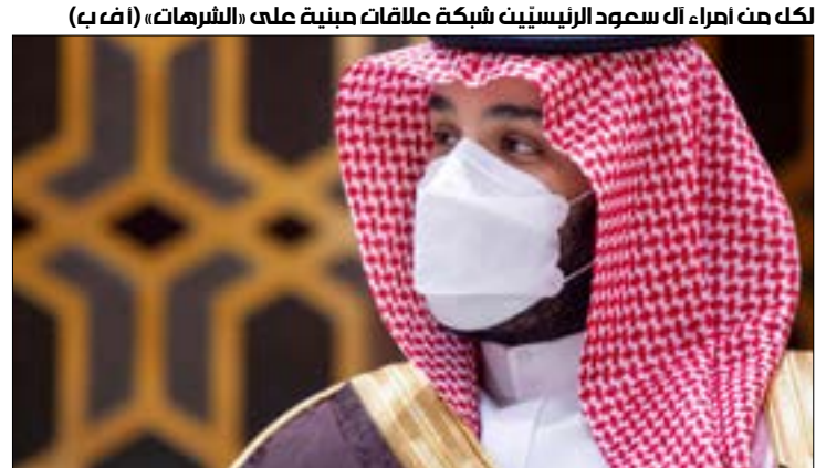
لكلّ من اراء، اك سعود الرشيدت شبكة علاقات مبنية على «الشهرات»

الحية أن «الحوار مخصّص لمنظّمة التحريي، أعلن الشهر الماضي، عضو «للجنة المركزية لفتح»، جبريل الرجوب، إن اجتماعات القاهرة ستبحث «إتمام التوافقات الوطنية على البات تسهيل عمل لجنة الانتخابات المركزية في كل من الضفة وغزة بمتابعة مصرية»، الأمر