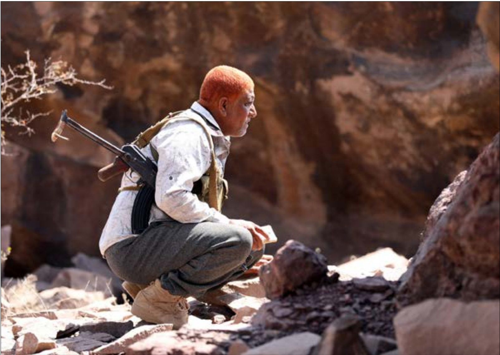
لم تكت المناطق التي تمكّدت فيها قوات هادي في ريف تمرز الحرب جبهات قتال في وقت سابق

كذلك، استشعرت ميليشيات طارق صالح، نجل شقيق الرئيس السابق، في نطاق الساحل الغربي للقتال مع ميليشيات "الحشد الشعبي". ووفقاً لمصادر مطلعة، فقد فشلت توجيهات صادرة عن نائب هادي، الجنرال علي محسن الأحمر، في توحيد جبهات غربي تعز مع جبهات الساحل الغربي، حيث رفضت "الوية العملاقة" الموجودة في أطراف منطقة الكدحة جميع مساعي "الإصلاح" وعروضه، ووجهت بصدّ أيّ تقدّم له باتجاه مناطق سيطرتها.