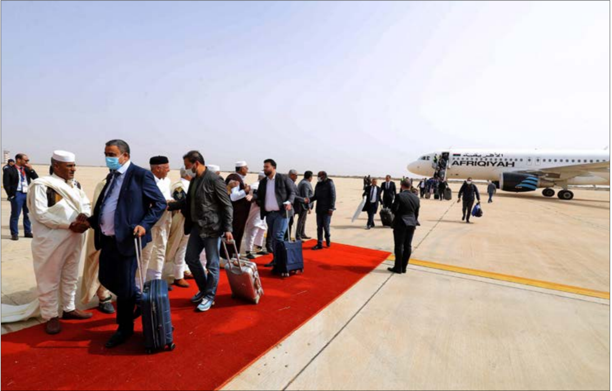
وصل 132 نائبا من مختلف انحاء ليبيا إلى سرت على متن رحلات جوية (أف ب)

في فتح الطريق الساحلي، ما أدى إلى وصول النواب جواً إلى سرت، وسط إجراءات أمنية غير مسبوقة لتأمين إقامتهم وتنقّلاتهم، خوفاً من الانفلات الأمني الذي يسيطر على البلاد. واستخدمت قوات اللواء المتقاعد خليفة حفتر طائراتها لتأمين المدينة جواً، في وقت حضرت فيه القوّات على الأرض بالتنسيق مع اللجنة العسكرية «5+5» التي تشارك في إجراءات تأمين النواب. ويتنظر، في جلسة اليوم، أن يتحدّث