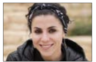
«المعضلة الاجتماعية»: عن إدمان النت وأثره

* غداً الأربعاء - س: 17:00 - تطبيق «زوم» (رمز النشاط: 87698992034) وصفحة «مؤسسة عبد الحميد شومان» على فائس بوك.