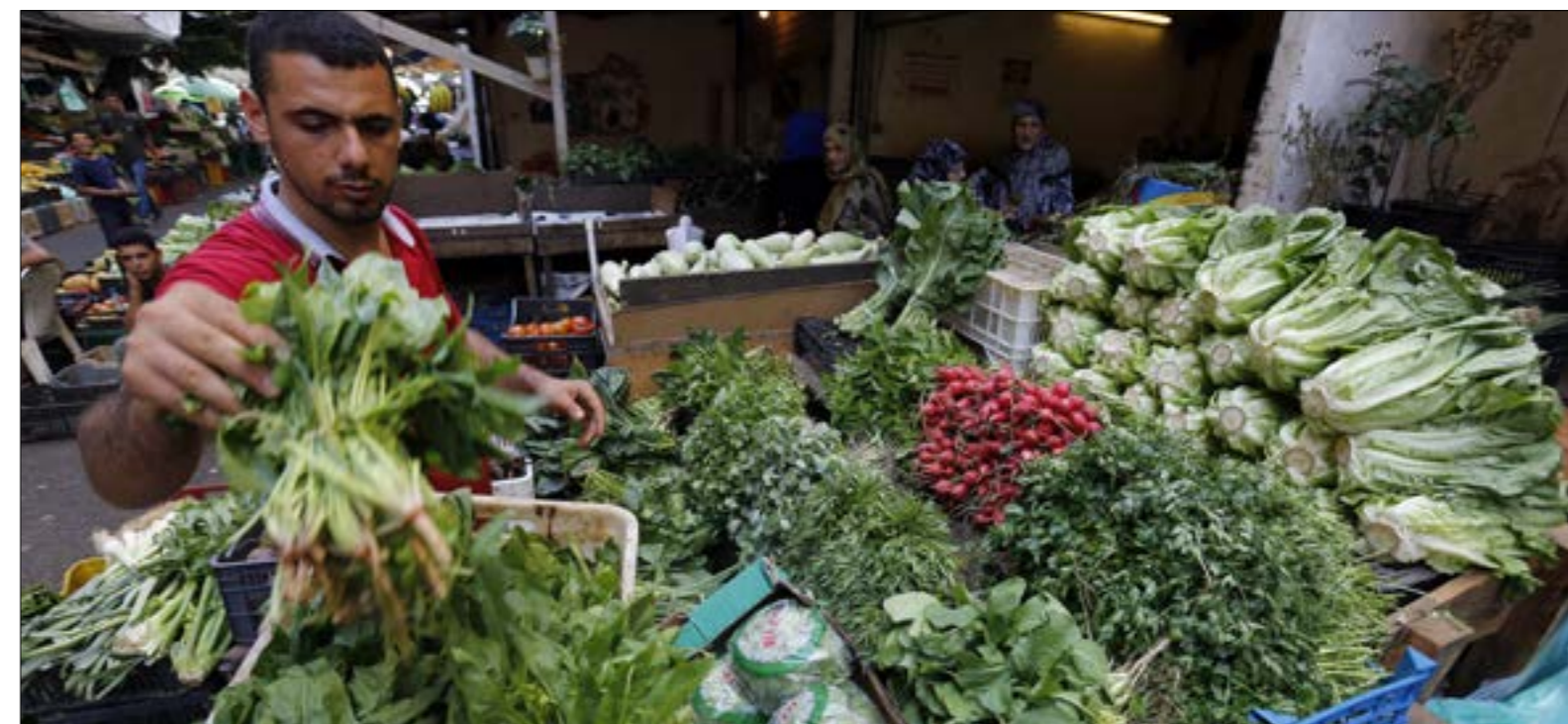
مقارنة مع بقية السلع والخدمات، لم ترتفع بشكل كبير الخدمات المرتبطة بالصحة والسكن والتعليم حتى الآن، ومعها لا تزال هيئة نفاذ الاحتياطات بالعملة الأجنبية (موانع طحطح)