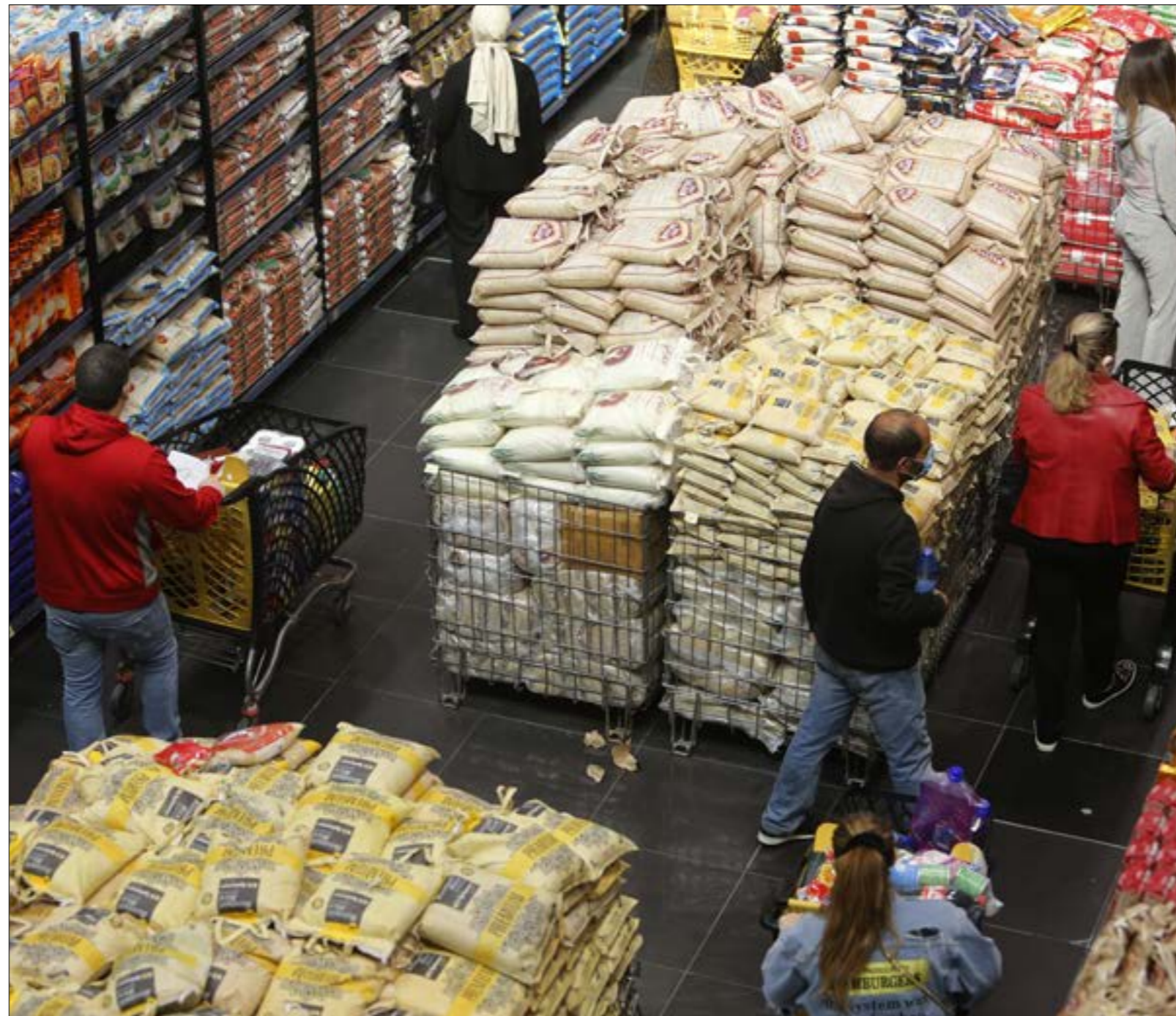
مصرف لبنان يرشد الدعم عبر تأخير الموافقة على الاستيراد (موانع يو حيدر)