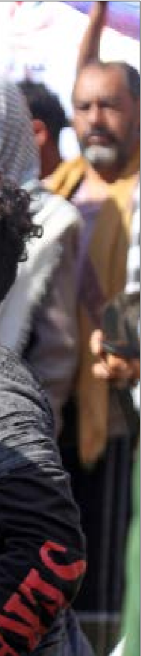
لا يبدو واضحاً ما إذا كانت الإدارة الأميركية سترطب المسالك الداخلية السعودية بملفّ اليمن

ومن هنا، يُتوقّع أن تعمل الإدارة الأميركية، قبل فتح باب المفاوضات، على لملمة أوراق القوة لديها ولدى حلفائها، لفرض ما عجزت عنه في الميدان العسكري. وما يُعزّز ذلك التوقع هو ازدياد الانزعاج الأميركي من العمليات اليمنية ضدّ المطارات والمنشآت الحيوية السعودية، وأيضاً اقتراب الجيش و«اللجان الشعبية» من تحرير مدينة مارب (شرقاً)، وفي