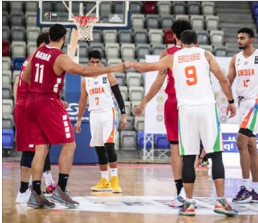
ينتظر لبنان مجموعته باربعة انتصارات