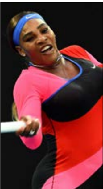
بالت سيرينا على بعد فوزيت من تحريف رقم قياس في البطولات الكبرى (ف ب)

ردت بقوة فكسرت إرسال الرومانية وعادلت النتيجة (3-3)، وكوّنت الأمل ذاته للمرة السادسة في اللقاء لتتقدم (3-4)، وتحسم لاحقاً المجموعة والمباراة لمصلحتها. وقالت سيرينا: «بدون تأكيد هي أفضل مباراة خضتها في هذه البطولة»، وتابعت: «من الواضح أنه كان يجب أن أرفع من مستواي أمام المصنفة ثالثة عالمياً، لذا كنت أعرف فعلته وأنا متحمسة». وضربت سيرينا موعداً في الدور نصف النهائي مع اليابانية ناومي أوساكا، المصنفة ثالثة، الخائفة بسهولة على التأهولة هسيبه سو-وي (2-6) و(2-6). ولم تجد اليابانية أي صعوبة في سحق منافستها المصنفة 71 عالمياً. وصنعت أوساكا الفارق بينها وبين سو-وي بفضل حسنهما للخطأ المهمة (أنقذت 3 محاولات لكسر إرسالها من أصل 3)، إضافة إلى الرئيسية.