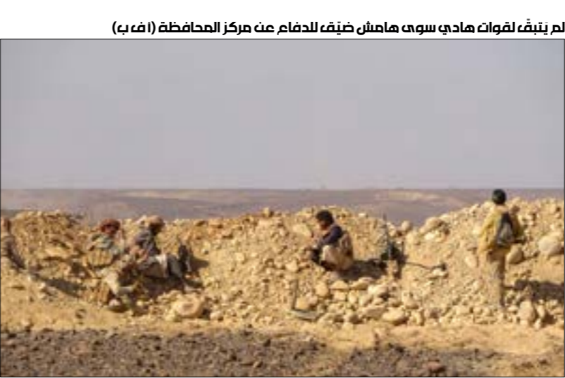
لم يتبقّ لقوات هادي سوى هامش ضيق للدفاع عن مركز المحافظة

في مختلف الجهات المحيطة بالطلعة الحمراء، التي يتوقّع مراقبون سقوطها بشكل كلي مع جميع المناطق المحيطة بها خلال الساعات المقبلة. وبحسب هؤلاء، فإن مدينة مارب سقطت رمزياً، في ظلّ سيطرة قوات صنعاء على معظم المناطق المطلّة عليها من الجانبين الغربي والشرقي، فيما لم يتبقّ لقوات هادي سوى هامش ضيق للدفاع عن مركز