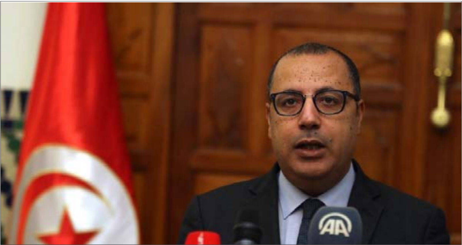
ادخل رئيس الحكومة التونسية تعديلاً جديداً قال بموجب خمسة وزراء، (من اليمين)

بين الرئاسة والحكومة. وتضمّن الكتاب، وفق رئاسة الجمهورية، «تذكيراً بجملة من المبادئ المتعلقة بضرورة أن تكون السلطة السياسية في تونس معبّرة عن الإرادة الحقيقية للشعب»، وأكد الرئيس التونسي، في كتابه الذي جاء ردّاً على رسالة من المشيشي يطالب فيها بتحديد أسماء الوزراء الذين يعترض عليهم وتحديد موعد أداء اليمين الدستورية، أن «اليمين لا تقاس بمقاييس الإجراءات الشكلية أو الجوهرية، بل بالالتزام بما ورد في نصّ القسم وبالآثار التي ستترتّب عليه».