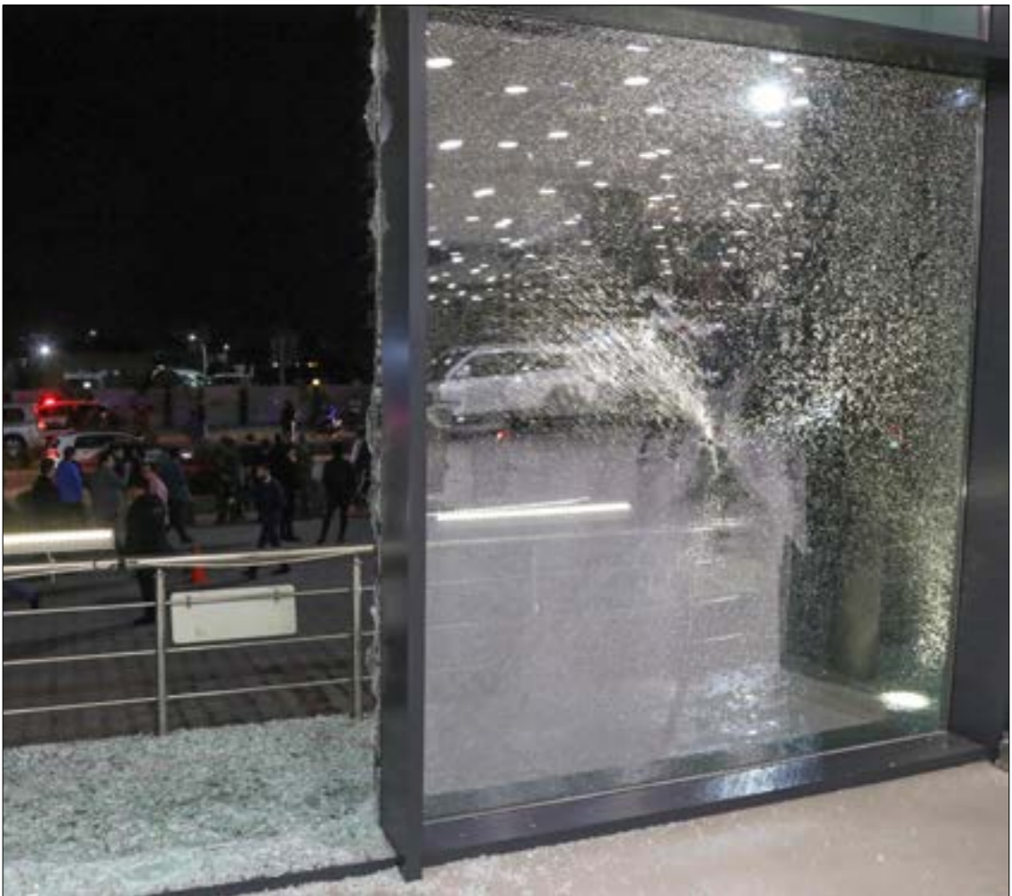
جاء الهجوم بعد شهرين من الهدوء النسبي

إلى أن «الحكومة تبذل جهوداً كبيرة من أجل تهذيب الأوضاع في المنطقة، وإبعاد البلاد عن آفة صراعات»، ووصف الرئيس العراقي، برهم صالح، بدوره، الهجوم بـ«التصعيد الخطير والعمل الإرهابي الإجرامي»، في موقف مساقٍ لأربيل، التي دانت على لسان رئيس حكومتها مسرور بارزاني، (الديمقراطي الكردستاني بزعامة مسعود بارزاني) المسؤوليّة عنه لـ«مجموعة ضالّة خارجة عن القانون