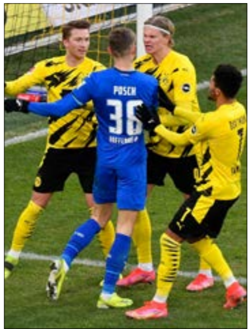
شهد أداء بوروسيا دورتموند نجاحا كبيرا أخيراً

رابطة الأندية الأوروبية، يُعتبر أحد الداعمين الرئيسيين لنظام كلاب في صفوف يوفنتوس الإيطالي، عندما يحلّ فريقه ضيفاً على بورتو في ذهاب الدور ثمن النهائي من دوري أبطال أوروبا لكرة القدم اليوم الأربعاء (الساعة 22:00 بتوقيت بيروت، وفي ذات التوقيت تلعب مباراة ثانية تجمع بوروسيا دورتموند مع إشبيلية. منعه تماماً، أعرب أنييلي (45 عاماً) عن دعمه لتوسيع دوري أبطال أوروبا وعلى أرض الملعب، لا يزال يوفنتوس يحاول إيجاد أسلوبه بقيادة المدرب الجديد أندريا بيرلو، إلا أنّ فريق السيدة العجوز يتوق إلى المجد الأوروبي بعد أن خسر خمس مباريات نهائية في دوري أبطال منذ لقبه الأخير عام 1996. أما خارج المستطيل الأخضر، فإن رئيس النادي أندريا أنييلي هو إحدى الشخصيات البارزة وراء خطة إصلاح المنافسة القارية الأسمى. أنييلي الذي يراس أيضاً هذا وهيمن فريق السيدة العجوز