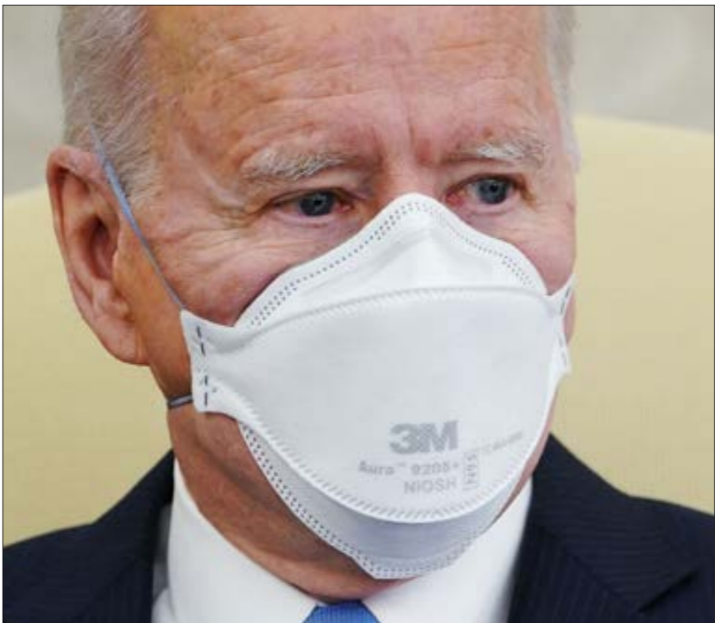
قام بايدن بحملته بناءً على فكرة أنه مؤهل أكثر من غيره لمعالجة قضية السلاح

بدا البيت الأبيض المدافعين عن مراقبة الأسلحة