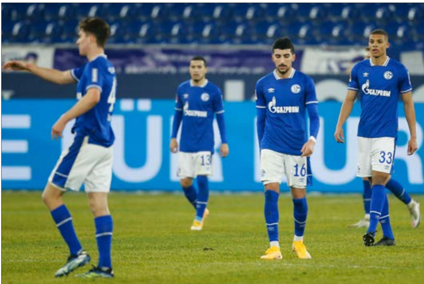
بثلك الفريق، المركز الأخير ينسم نقاط جاء من 6 تعادلات وانتصار وحيد (ف ب)

يصانح نادي شالكه الألماني المزميت هذا الموسم. ناقوس الخطر يُقرَعُ منذ فترة ولا مؤشّر إلى النجاة رغم استخدام الإدارة اساليب عديدة. ولكن دون جدوه. نتائج كارثية يحصّها الفريق، قد تؤدي إلى هبوطه في نهاية المطاف إلى الدرجة الثانية ما لم يتدارك الأمور في الوقت المناسب. شالكه يصارع الزمن. فهل يتفادى المصير الأسود؟