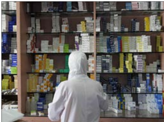
مع منع التوريد بسبب العقوبات انتشرت الادوية الاجنبية المهربة