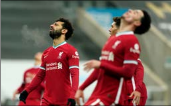
لا يزال ليفربول في صدارة الدوري، لكنه فشل في الفوز في مبارياته الثلاث الأخيرة للمرة الأولى منذ عام 2018 (أف ب)

مُح الألماني يورغن كلوب مدرب فريق ليفربول الإنكليزي الي أنه لا يتوقع أن يبرم النادي صفقات في سوق الانتقالات الشتوية الحالية رغم الإصابات التي يعانيها، وذلك بسبب التداعيات المالية لجائحة فيروس كورونا المستجد. من المتوقع أن يغيب المدافع الهولندي فيرجل فان دايك وجو غوميز حتى نهاية الموسم، فيما يشكل غياب الكاميروني جويل ماتيب المصاب حالياً معضلة لكلوب في مركز قلب الدفاع. شعر لاعب خط الوسط البرازيلي فابينيو هذا المركز في غالبية مباريات بطل إنكلترا هذا الموسم، فيما تحتم على كلوب الاستعانة بخدمات الياعين رايس