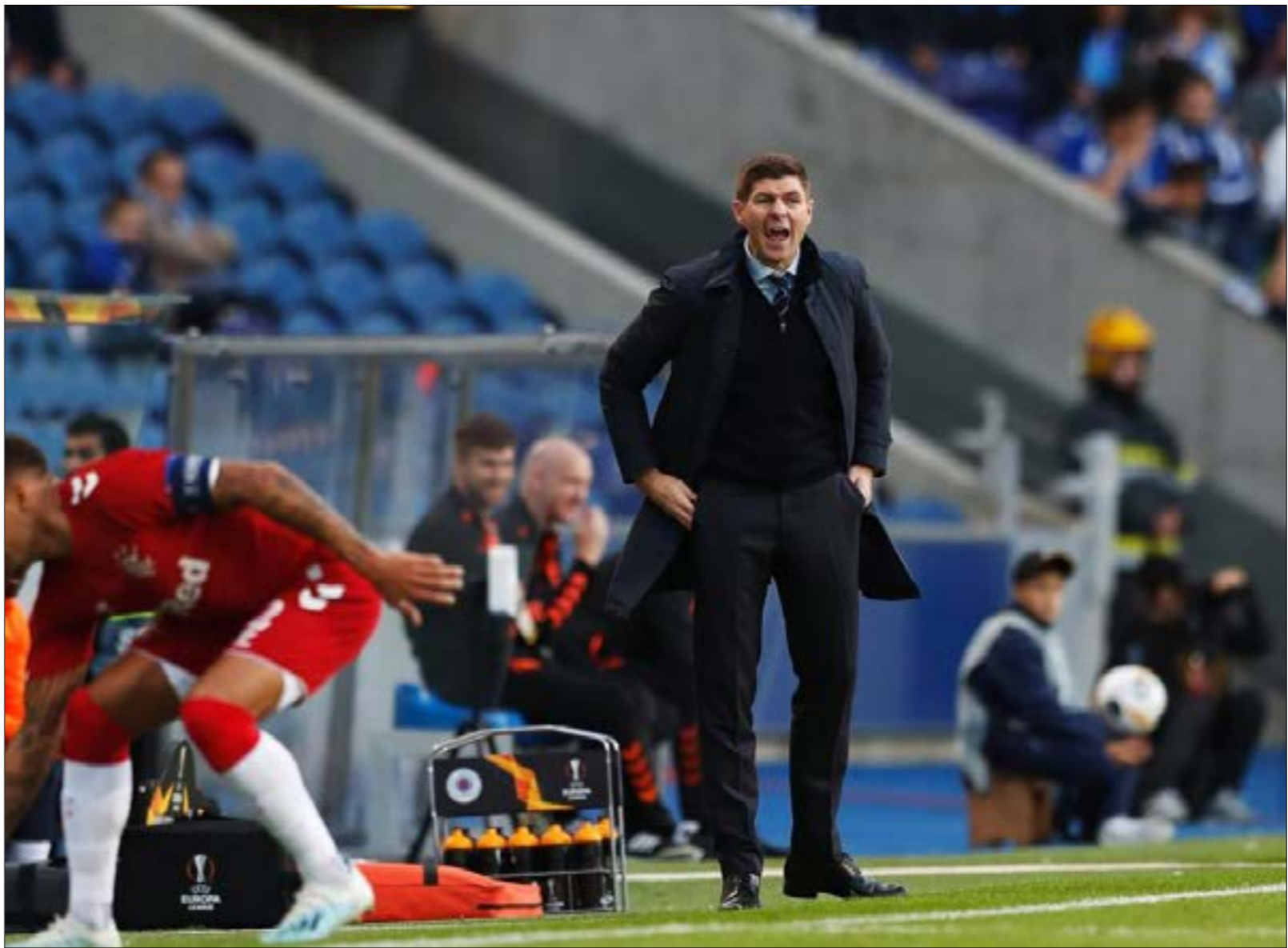
تخّم جيرارد نفسه مجدداً من طينة الكبار

الدوري المحلي والدوري الأوروبي 'يوروبا ليغ'، كما أثبت أنه من بين المدربين المميزين، والذي قد يصبح مدرباً لفريق ليفربول الإنكليزي في المستقبل خلفاً للألماني يورغن كلوب. بدأ رينجرز موسمه الحالي بشكل مختلف عن الفريق الذي تعهّد بشدة خلال النصف الثاني من الموسم الماضي، تحديداً بعد العطلة الشتوية، حينها، خسر رينجرز بعض المباريات بشكل صادم، والتي أدت إلى خروج الفريق من كأس اسكتلندا على يد فريق هارتس الذي انتهى به الأمر بالهبوط إلى دوري الدرجة الثانية في البطولة المحلية.