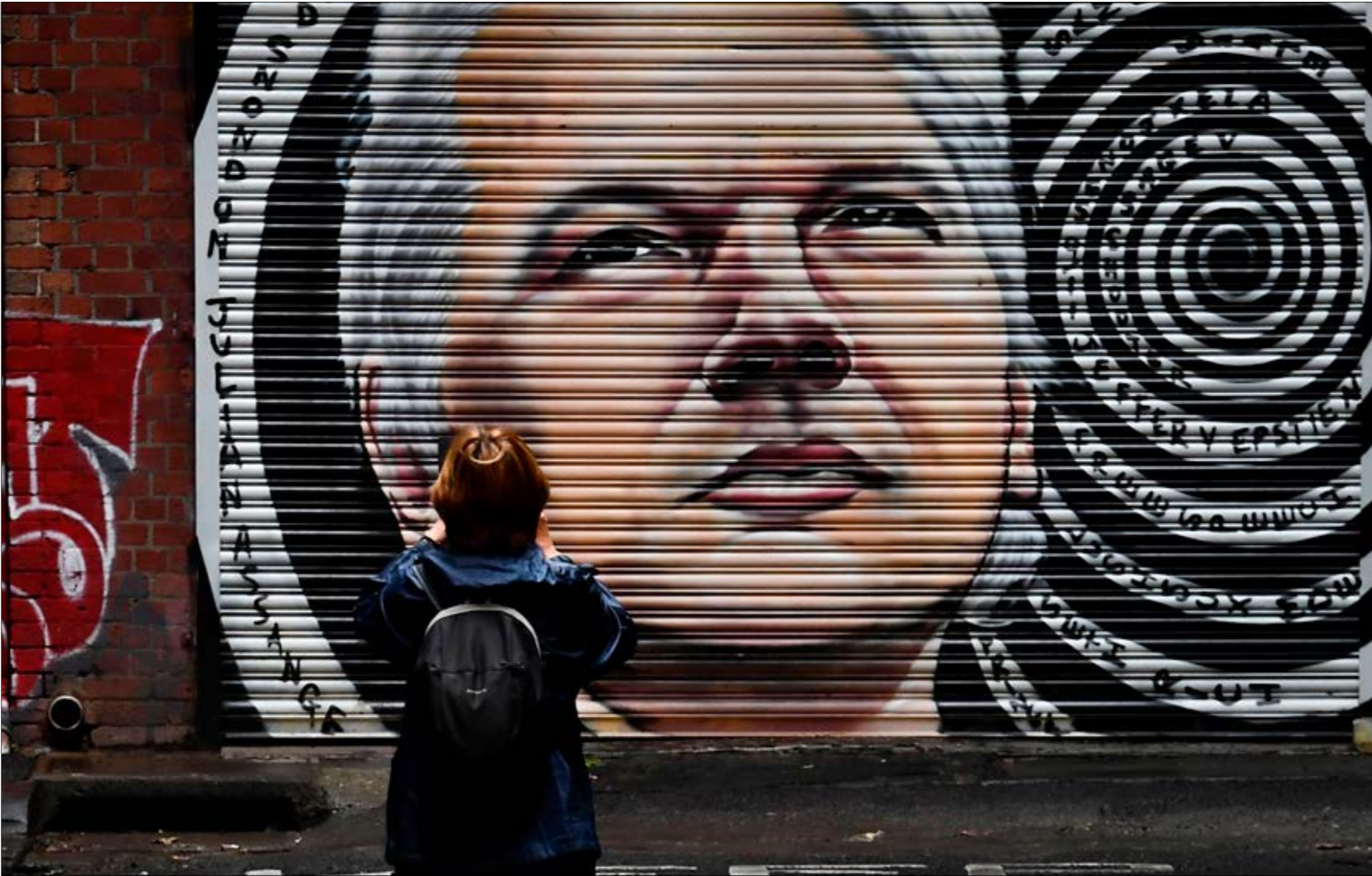
أعرب العديد من المتضامنين مع اسانج عن شعور بخيبة امل عميقة

وذكرت بارايسر أنّ اسانج لديه «شبهات دعم ضخمة» لمساعدته على الاختفاء تحت الأرض، فور إطلاق سراحه، مستشهدة فرصة للتقدم باستئناف، ويخشى مؤسس «ويكيليكس» على حياته من محاولات اغتيال أو اختطاف قد تقوم بها الأجهزة الاستخباراتية الاميركية، بعدما أفضى ملايين الصفحات من وثائق رسمية أميركية كشفت طرائق عمل الاميراطورية المسريفة بالدماء والمؤامرات والاعتداء على حقوق الإنسان. ولذلك، كان قد التجأ إلى مقرّ سفارة الإكوادور في لندن، حيث بقي محاصراً لسنوات، حتى نيسان/ أبريل من العام الماضي، عندما طرد من السفارة واعتقله