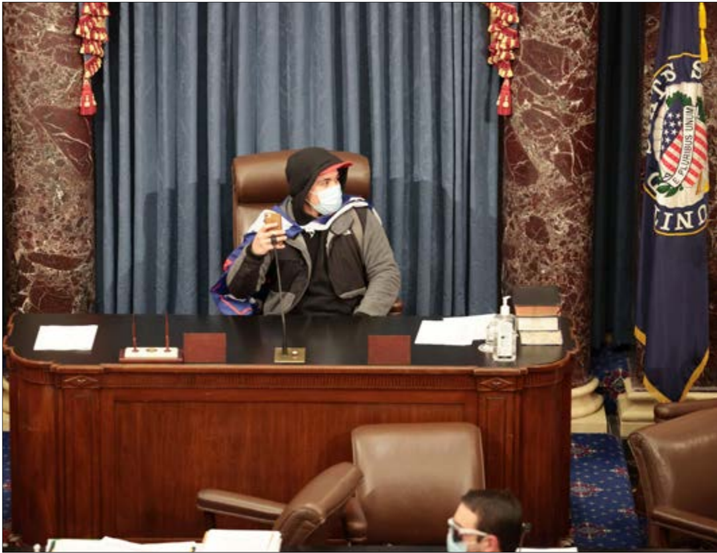
سيكون نائبة الرئيس اميركا، كامالا هاريس، الكلمة الفصحة في مجلس الشيوخ

مَرز ناخبو جورجيا، الولاية الجنوبية الجمهورية تقليدياً، «رسالة مدوِّية»، على حدّ تعبير الرئيس الأميركي المنتخب، جو بايدن. رسالة أسهم في إيصالها الرئيس المنصرف، دونالد ترامب، الذي كُتِب حزبه الجمهوري هزيمة تكراه في انتخابات إعادة المقعدي مجلس الشيوخ في الولاية الحمراء، والتي اختارت، والحال هذه، الحزب الأزرق، حتّى في الانتخابات الرئاسية. بهذه النتيجة المفاجئة، احكم الديموقراطيون سيطرتهم، إلى جانب البيت الأبيض، على الكونغرس بمجلسيه، أي السلطتين