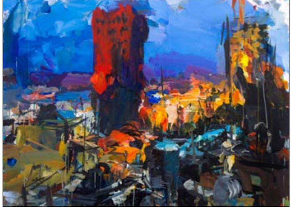
«جبرم» (أكريليك على كانفاس - 130x180 سنتم - 2019)

الصلاحية، إنها رموز من التجارب التي عاشت في زمن مضى». بأخذنا المعرض إلى فلسطين ما قبل النكبة وما بعدها: لإفقات سكن القطران، وإعلان لشركة حمضيات بافا، حقبة يد تذكارية من عرق اللؤلؤ نُحِتت عليها قبة الصخرة، وثائق واصفاد وصور وأحزمة تعود إلى الشرطة الفلسطينية التي أسستها بربرطانيا في القدس كشرطة استعمارية بداية عشرينيات القرن الماضي. هناك محطة أساسية أيضاً في تركيبها العثمانية، بتقاليدها الدينية والثقافية والاجتماعية التي تظهر في عصا وقبعات الدراويش الصوفيين والشبحات وقوارير مياه مقدسة وعمامات الشيوخ، وبعض