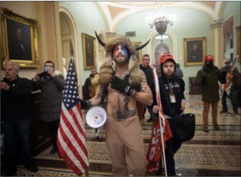
تحويل الكابيتول، إلى ساحة اشباح بين مساعدي ترامب، والشرطة

ولكن أحداث يوم الأربعاء كشفت عن جانب آخر، وهو أنّ الحزب الذي مكّن ترامب من التصعد، ثمّ خاف منه، أصبح محطّماً ومنقسماً إلى درجة أنّ الديموقراطيين خسروا مقعدى مجلس الشيوخ في جورجيا. «إنّه الجنى البرقائلي الذي ظلّ خارج القفص لمدة أربع سنوات والذي عمل على منح الجمهوريين كل أمنية، وهو فقد أوضِح منذ شهر، إنّه كان مستعداً لإحداث مذبحة في النظام السياسي الذي رفعه إلى اقوى منصب، إذا قرّن التحلي عنه»، وفقاً لجوليان بورجر في صحيفة «ذا غارديان» البريطانية،