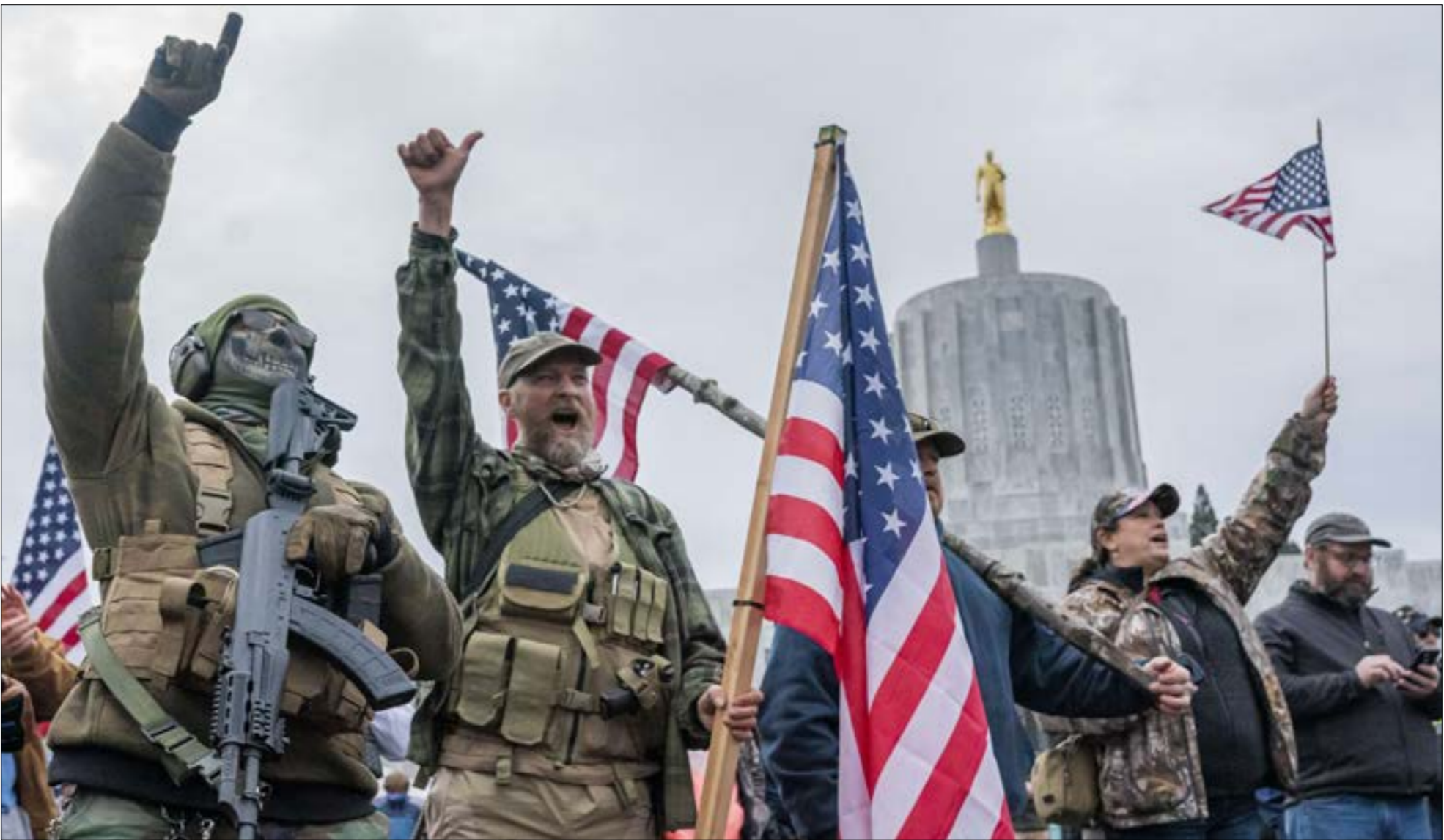
حزب ترامب اصوات 74 مليون ناخب على رغم سلوكه المشبّه والعنفي