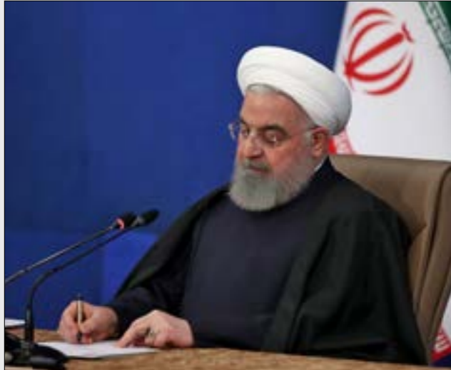
جاء كلام روحاني فيه وقت ادرجت فيه والسنط مسؤوليت إيرانييت على الشافنة السوداء