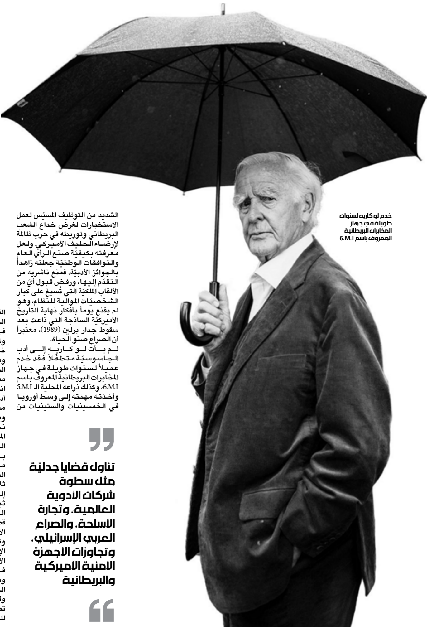
خدم لو كاريه لسنوات طويلة في جهاز المخابرات البريطانية المعروف باسم 6.M.I

الشديد من التوظيف المتسلسل لعمل الاستخبارات لغرض خداع الشعب البريطاني وتوريطة في حرب ظالمة لإرضاء الحليف الأميركي. ولعل معرفته بكيفية صنع الرأي العام والتوافقات الوطنية جعلته زاهاً بالجوائز الأدبية، فمُنح ناشريه من التقدير إليها، ورفض قبول أيّ من الألقاب المكتبة التي تُسبغ على كبار الشخصيات الموالية للنظام، وهو لم يقنع يوماً بأفكار نهاية التاريخ الأميركية الساذجة التي ذاعت بعد سقوط جدار برلين (1989)، معتبراً أن الصراع صنو الحياة. لم يسات لو كاريه إلى أدب الجاسوسية متطفاً، فقد خدم عميلاً لسنوات طويلة في جهاز المخابرات البريطانية المعروف باسم 6.M.I، وكذلك زراعته المحلية الـ S.M.I وأخذته مهنته إلى وسط أوروبا في الخمسينيات والستينيات من