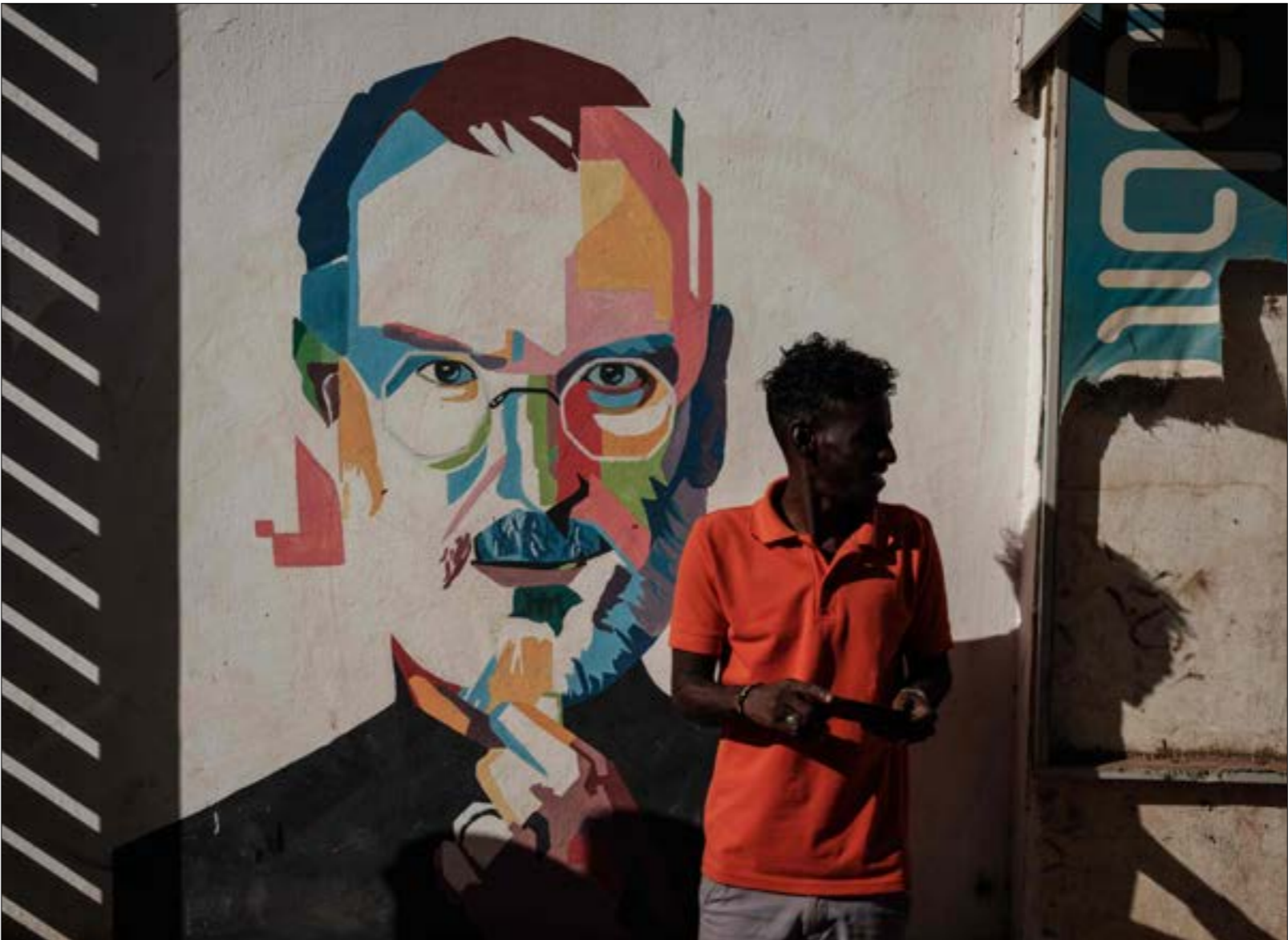
راه محدودك أن رفع اسم السودان يساهم في إصلاح الاقتصاد وجذب الاستثمارات

اتفاق ينض على دفع السودان 335 مليون دولار تعويضات لعائلات ضحايا الهجمات التي ارتكبتها تنظيم «القاعدة» في عام 1998 واستهدفت سفارتي الولايات المتحدة في كينيا وتنزانيا، وأيضاً الهجوم الذي نفّذه التنظيم عام 2000 واستهدف المدرسة الأميركية «يو إس إس كول» قبالة اليمن. وكان من ضمن المتطلبات تعاون الخرطوم في مجال «مكافحة الإرهاب»، وزيادة الحريات الدينية، وتعزيز القدرة على إدخال المساعدات الإنسانية، ورفع التعويضات عن هجمات قتل الولايات المتحدة إن الخرطوم لها صلة بها. وفي شباط/ فبراير، تمّ التوصل إلى اتفاق على الدفع لعائلات 17 من البحارة الأميركيين