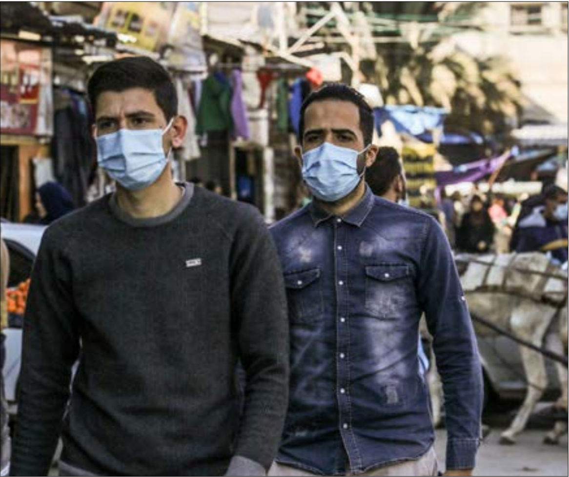
رفضت 'حماس' ربط قضية الأسرى بالوضع الإنساني في قطاع غزة (أ ف ب)

عندما سُئل الرئيس الأميركي السابق، باراك أوباما، عن رأيه في الأسماء التي تُطعّم بها الرئيس المنتخب، جو بايدن، حكومته القادمة، قال: 'أنا أرى فريقاً متكامل، ولدي شخصياً كل الثقة به'. لم يكن أوباما يُعامل نائبه السابق بقدر ما كان يقرّ بحقيقة الأشياء: حكومة بايدن 'أوبامية' حتى أكثر من حكومة أوباما نفسه. وهو ما يجعل هذا الأخير ملكاً متوّجاً في واشنطن. سيكون الرئيس المقبل مضطراً، بحكم تقدّم سنّه (78 عاماً)، إلى الاستعانة بخبرة رئيسه السابق، جيك سوليفان، مستشار العمل القومي الخليل (44 عاماً)، فقد عمل مديراً لتخطيط السياسات في الإدارة السابقة، مكتبه مجدداً وزيراً للزراعة. وحتى الوجه الشاب الجديد، جيك سوليفان، مستشار الأمن القومي المقبل (44 عاماً)، فقد عمل مديراً لتخطيط السياسات في الإدارة السابقة، ومستشاراً للأمن القومي لبايدين. للحقيقة، لم يحظّ أوباما، طوال عهده، بفريق متكامل من الموالين، كما هي حال حكومة نائبه. ففي أيامه الأولى في البيت الأبيض، انتشر اتباع هيلاري كلينتون - التي تولّت بنفسها منصب الخارجية - في كل مكان، وكانت كلمتها مسموعة أحياناً قبل كلمة الرئيس، الذي أدرك شيئاً فسينبأ أصول اللعبة وشرع في زرع موالين له تدريجياً من دون إثارة حروب مع هيلاري، سديد هولاء دفّة الإمبراطورية أربع سنوات مقبلة، ما ستكون له انعكاسات كبيرة على توجهات أميركا وسياساتها داخليا وخارجيا.