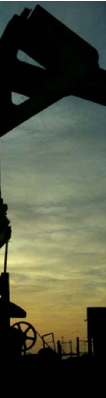
منصات نفطية في الخليج

شركات الطاقة الكبرى نفسها أصبحت، في السنوات الماضية، تضع «عداداً» لنقطة الذروة وتقديراً لوعدها؛ البعض كان يقول 2030 والبعض الآخر 2035 أو 2040. ولكن هذا كان قبل «كوفيد» - حدث غير الوباء أعماط الاستهلاك والحياة بشكلٍ سرّع، عمّدة سنوات، «عداد» ذروة النفط، حتّى أنّ