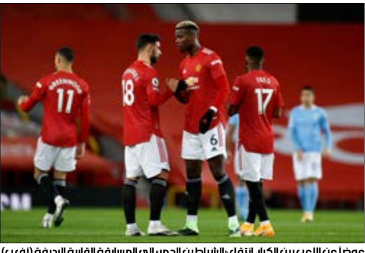
عضوات الصع بين الكبار، انتقل الشباطين الحمر، إلى المسابقة القارية الرصبة

سيكون مانشستر يونايتد الإنكليزي الذي أقصي في اليوم الأخير من دور المجموعات لمسابقة دوري الأبطال، أمام اختصار صعب في دور الـ32 للدوري الأوروبي «يوروبا ليغ» إذ أوقعتة القرعة التي سُحبت أمس الإثنين في مقر الاتحاد القاري في نيون، بمواجهة متصدر الدوري الإسباني ريال سوسيداد. وكان يونايتد يمني النفس بإكمال مشواره القاري في دوري الأبطال، والفرصة كانت كبيرة أمامه لتحقيق ذلك بما أنه كان بحاجة إلى نقطة من مباراته الأخيرتين، إلا أن فريق المدرب النروجي أولي غونار سولسكاير سقط على أرضه أمام باريس سان جرمان الفرنسي 3-1 ثم على ملعب لايبزيغ الألماني 3-2 بعد أن كان متخلفاً بثلاثية نظيفة.