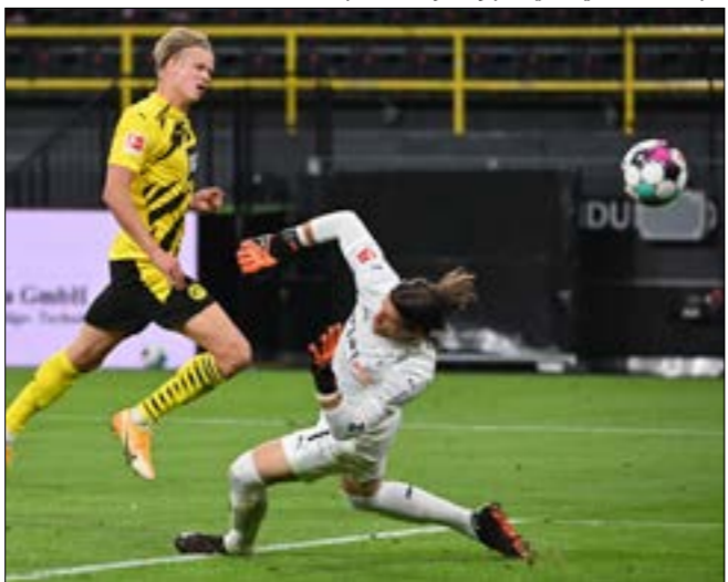
سكّ هالاند لثنائية في المباراة الأولى

وأشهاد مدرب دورتموند السويسري لوسيان فاخر بنجمه الواعدين، وقال: «صحيح أن لدينا الكثير من المواهب الشابة الراضة، إنهم يمتعون بذكاء كبير في