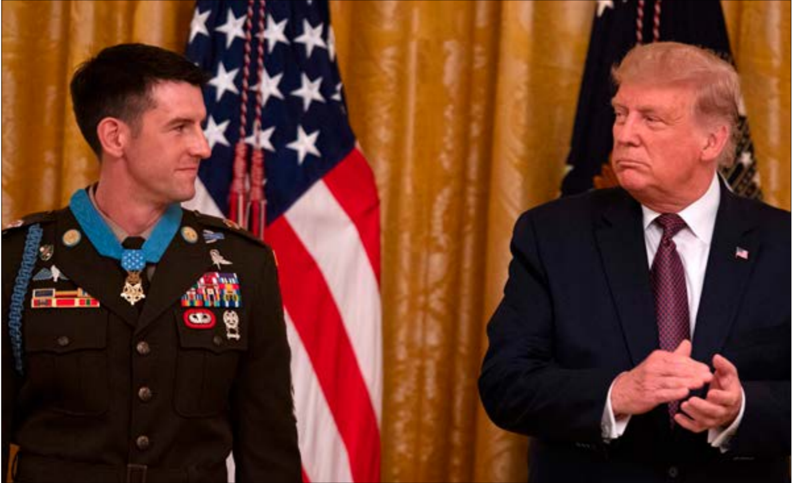
لظالما أكد ترامب ان «الانسحاب من العراق لن يكون مجانيًا»

المواجهة. أما بغداد، فلا تزال تتعمش بـ«الحوار الاستراتيجي»، وترفض «أيّ تشويش عليه»، على رغم أنها تدرك أن هدفه تنظيم وجود قوات الاحتمال ليس إلا، والمقصود هنا خفض عديدها ورسم حدود مهامها، بعدما كانت عدلت على «ضبط» انتشارها على طول الخطرة العراقية في أعقاب اغتيال الشهيدين قاسم سليماني