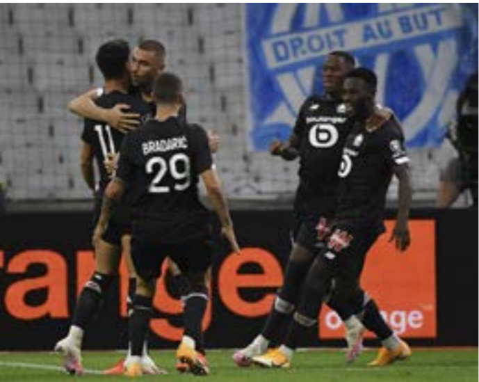
تصاده ليل هم مارسيليا الأسبوع الماضي

نارية السبت، وطالب مدرب ليل كريستوف غالثيه لاعبيه بالفاعلية أمام المرمرى واستغلال الفرص التي دفعوا ثمنها غاليلياً أمام مارسيليا. في الجهة الأخرى تتجه الأتظار غداً السبت إلى ملعب «جوفروا غيشار» الذي يحتضن قمة المتصدرين سانت إتيان وروين برصيد 10 نقاط. والفريقان هما الوحيدان إلى جانب ليل لم يعموا بالخسارة حتى الآن في الدوري، فسانت إتيان ضرب بقوة في بداية الموسم بثلاثة انتصارات متتالية قبل أن يسقط في فخ التعادل أمام نانت، فيما استهل رين موسمه بتعادل مع ليل، قبل أن يحقق الفوز ثلاث مرات متتالية. ويدرك الفريقان أهمية النقاط الثلاث التي ستقي إضافياً خصوصاً سانت إتيان الذي فُوط بفوز في المتناول على ضيفه نانت الأحد عندما تقدم بهدف قبل أن تستقل شبكه مثلهما آخرهما في الدقيقة 85.