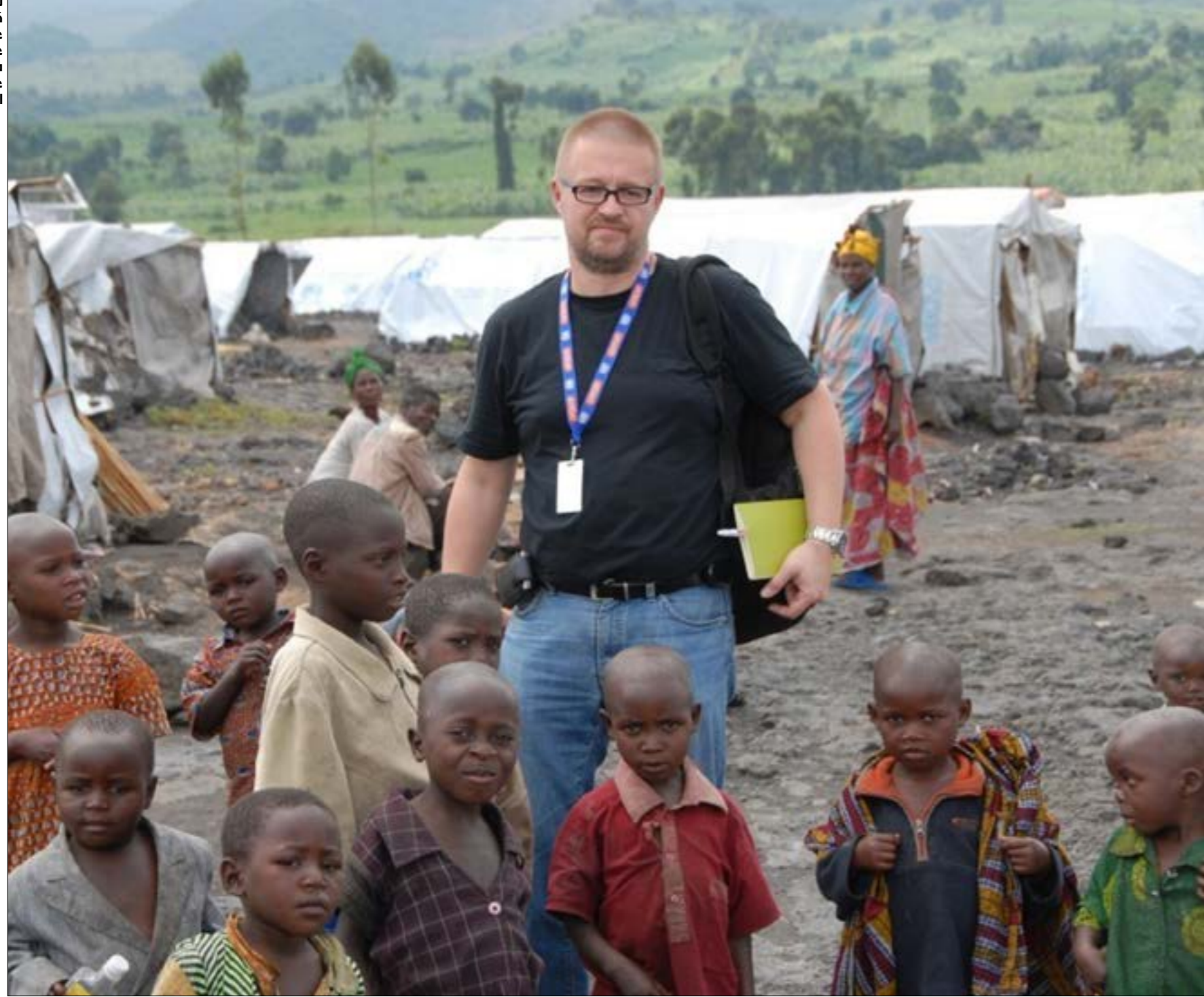
نشر فليتشيك كتباً مرجعية عدة لا غنى عنها من أجل فهم طرائف عمك الإمبريالية الأمريكية