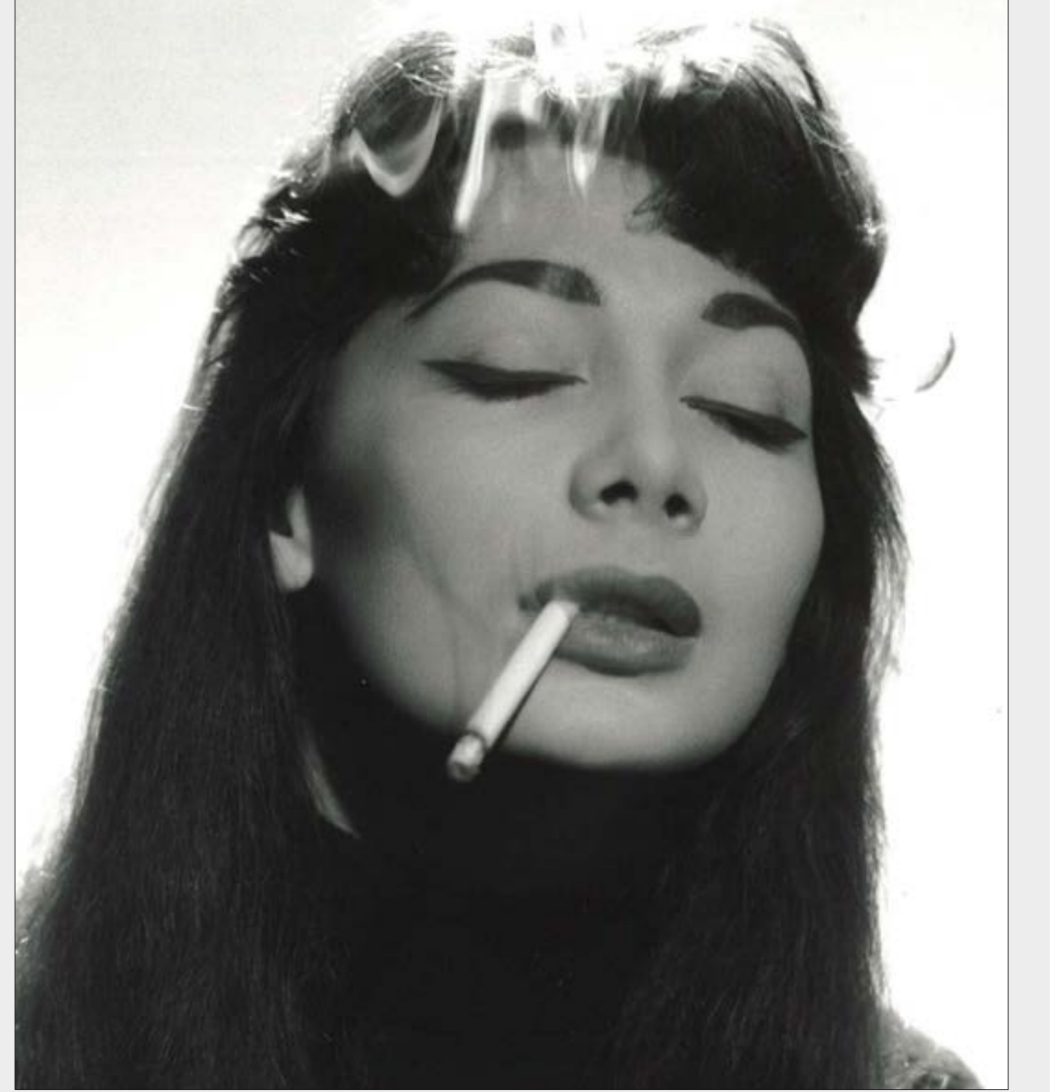
فستانها اسود دائما وادائها تطليبي وبداها كانتا تقودان الأغنية لحنا ونصا

وُلدت جوليت غريكو في عام 1927 في كنف عائلة برجوازية، لأب من جزيرة كورسيكا وأم فرنسية. ترك والدها العائلة وأبخلت عليها أمها بالحد الأدنى من العطف. عاشت عند جدتها لأشهر. والدتها التي تحمل جوليت اسمها، ولو كانت فاشلة في دورها كأم، فقد كانت مناضلة في المقاومة التي نشأت إثر الاحتلال النازي لفرنسا، وأشركت معها