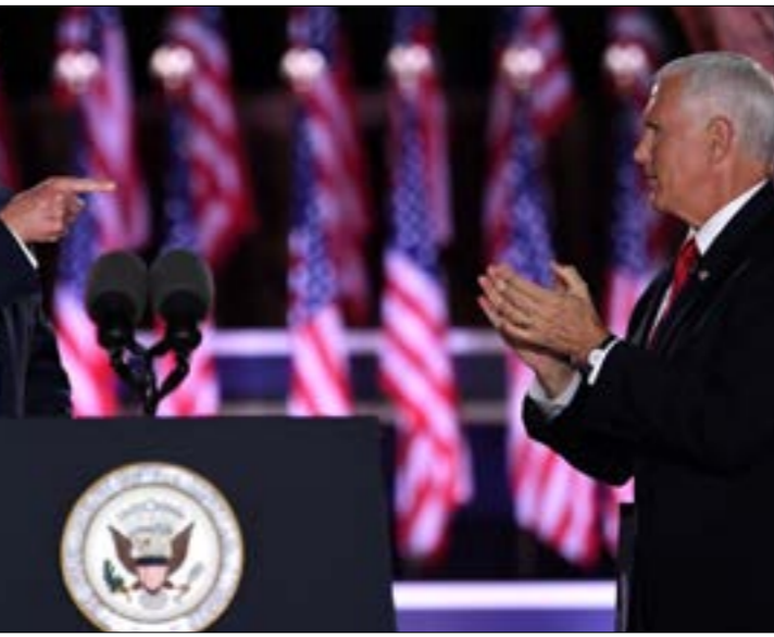
يعتمد ترامب على بنس الحشد لتأييد اليمن المسيحي

فجر اليوم (العاشرة والنصف مساءً بتوقيت واشنطن)، سبّقي الرئيس الأميركي، دونالد ترامب، خطابه في ختام مؤتمر الحزب الجمهوري، ليعلن قبوله حمل البطاقة الحزبية نحو ولاية رئاسية ثانية. خطابات يُتوقع أن لا يحدد فيه الرئيس عن الخط الذي اعتمد طوال الأيام الماضية، ليكمل من حيث انتهى وزير خارجيته، مايك بومبيو، ومن بعده نائبه، مايك بنس، ولينقح ناخبيه مجدّداً بنجاعة سياسة