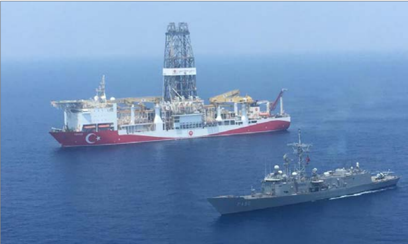
السيطرة الاسترائيجيّة على المتوسط بحجة ضمان احترام القانون كانت من مركزات الهيمنة الغربية على بلدان ضفتيه

القوى غير الغربية التي ذكرنا، والتي تعتبر أن هذا النظام راغى مصالح أطرافه الغربية المسيطرة على حساب مصالح وسيادة «الأخرين»، بلدان