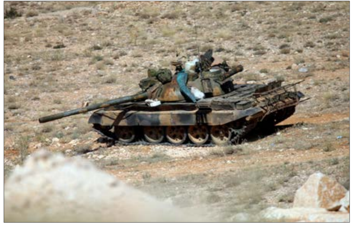
كلام نصر الله عن ضرورة انهاء ملف جرد عرسال كان بمثابة امر مهمّة لبدء انهاء «النصرة»، وهيلم

جمعة». وإثر ذلك، «قامت مجموعة الرعيان بالتخيران. طبعاً ساعدنا الجيش لاحقاً في مجموعة من المهام العسكرية في محيط عرسال، ودخلت مجموعات من المقاومين مع 298 كلم مربعاً، أي من جرد حام - معريون - الطفيل، حتى وادي الرعيان في عرسال وآخر جرد يونين، وكان الهجوم أيضاً بالاتجاه السوري بنفس العرض، وصولاً