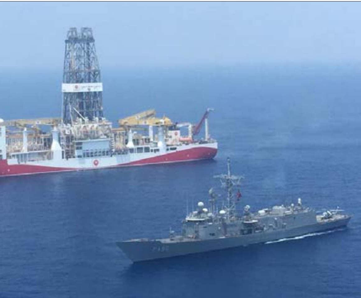
السيطرة الاسترائيجيّة على المتوسط بحجة ضمان احترام القانون كانت من مركزات الهيمنة الغربية على بلدان ضفتيه (أ ف ب)

وروسيا بالقوى الساعية إلى إعادة النظر بأسس وقواعد النظام الدولي الذي سيّده الغرب، أي نظام الهيمنة الغربية. يصح هذا الوصف أيضاً على