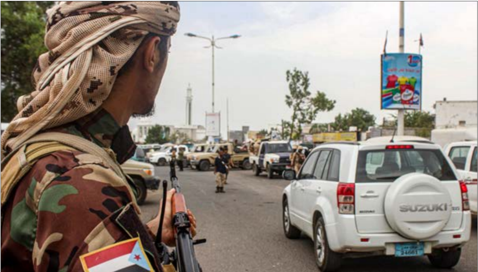
يعزو، «الانتقالي»، انسحابه إلى عدة أسباب، من بينها استمرار التصعيد العسكري

إزاء ذلك، يربط مراقبون بين قرار «الانتقالي» والأحداث الأخيرة في محافظة تعن، حيث استطاع حزب