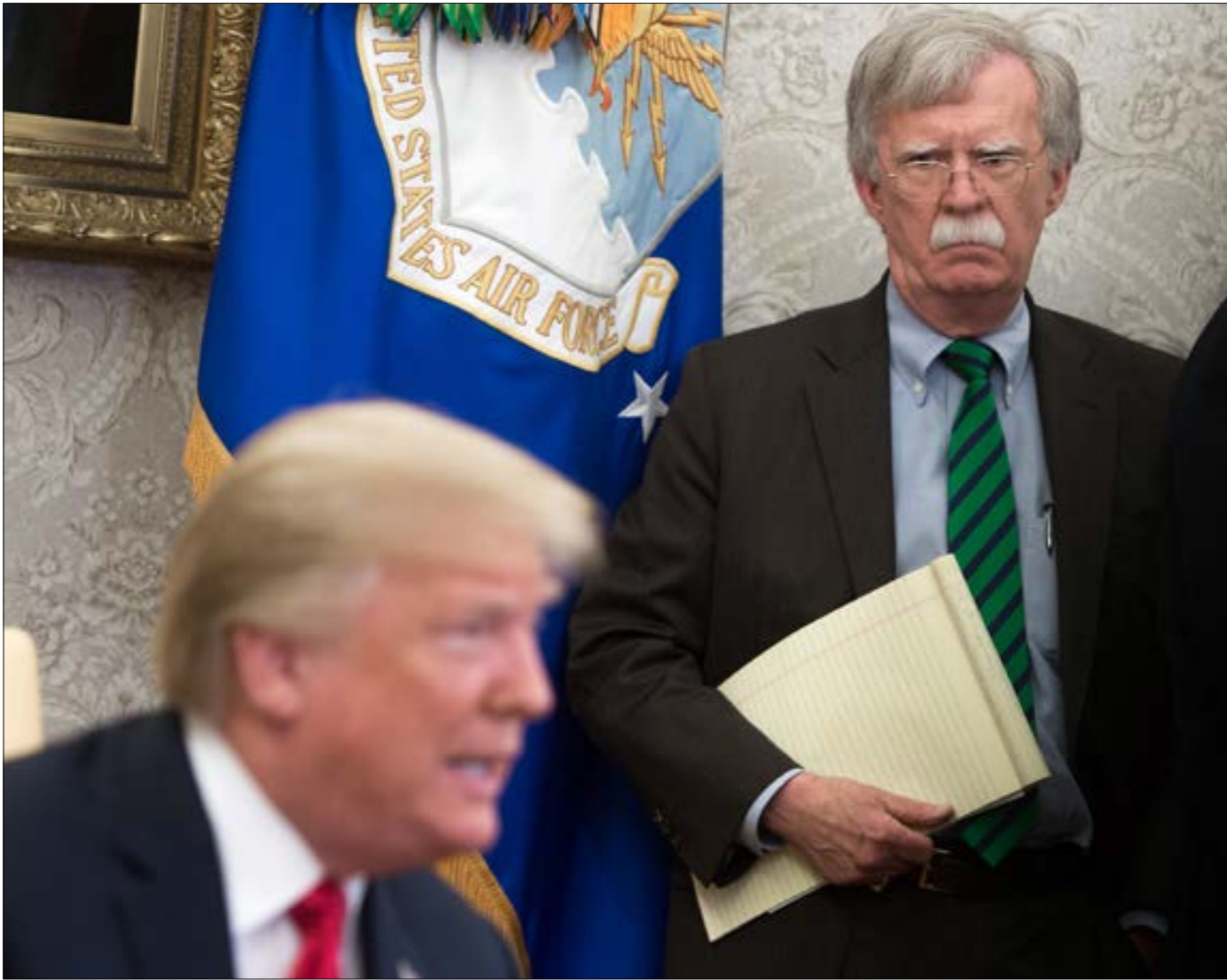
دفع بولتون إلى تسوية سياسته الخارجية قبل تبوّئه منصب المستشار

بإنضمام جون كيلي إلى البيت الأبيض، كبيرا للموظفين، ومساعبه لضبط فوضى رئاسة ترامب، خشي بولتون خسارة امتحان زيارته للمكتب البيضاوي. زيارات كانت تهدف أولاً إلى تسويق نفسه مرشحاً دائماً لمنصبي وزير الخارجية ومستشار الأمن القومي، وثانياً للدفع بسياسته الخارجية، ولا سيما تلك الخاصة بإيران. اعتقد، وفق ما يوفّق في كتابه «الغرفة التي شهدت الأحداث»، بأنه «لن يسمح لخطة الإيرانية بأن تذبل»، وهو ما دفعه إلى نشر تصوّره للحل في «ناشونال ريفيو» في نهاية آب/ أغسطس 2017. ويعدّما تّدّد ظريف بـ«الخطة» بوصفها «فشلاً كبيراً لواشنطن»، علّم بولتون بأنه «على الطريق الصحيح». سرعان ما سمعت أصداة الخطة في البيت