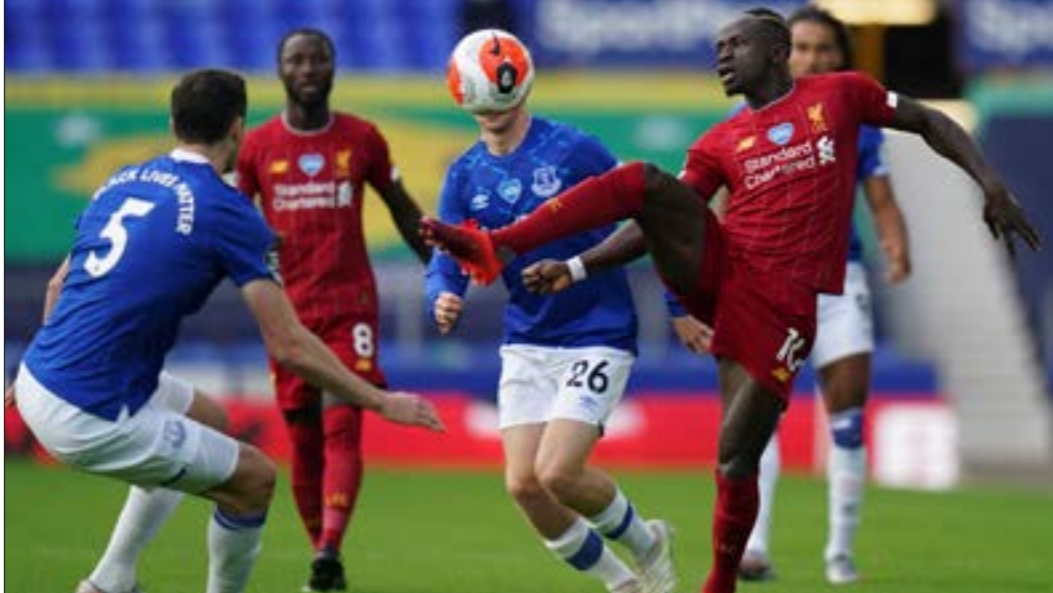
تعاقد ليفربول في مباراته الاولى مع ايفرتون

من الممكن من المباريات». ويستمر الصراع الشرس على المقاعد المؤهلة إلى دوري الإبطال، ورغم أن ليستر سيتي يحتل المركز الثالث، إلا أنه ليس في أمان بعد، ولا سيما إذا ما نظر إلى المباريات المتبقية له حتى نهاية الموسم، مقارنة بالفرق التي تنافس على المركزين الثالث والرابع، وفي مبارياته الثماني الأخيرة، سواجيه ليستر المتبعد بثلاث نقاط عن تشلسي الرابع كلا من ايفرتون، أرسنال، شيفيلد ومانشستر يونايتد، ويفتتح المرحلة الـ31 اليوم