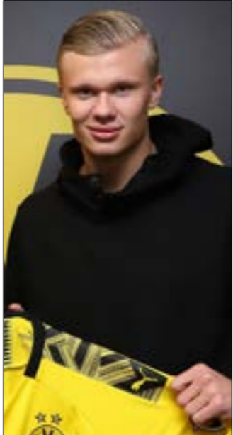
رض هالاند العرض المالي