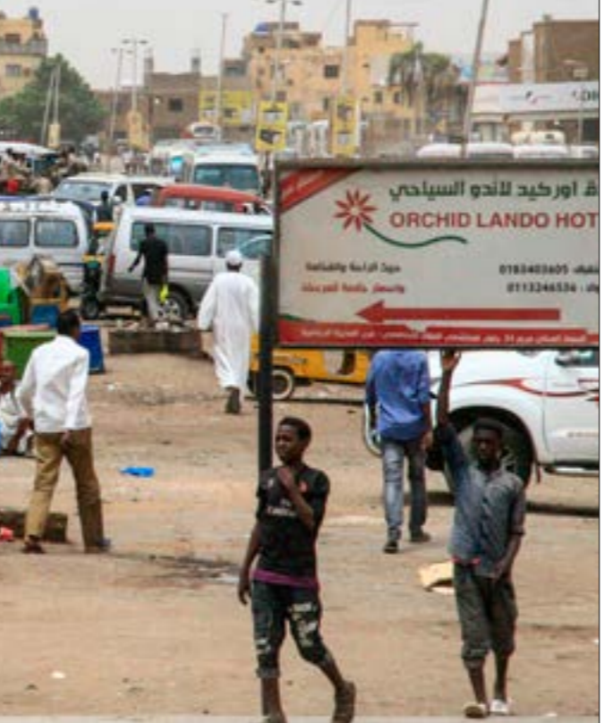
نسبة نجاح الإضراب وصلت إلى 80 بالمئة في يومه الأول (أ ف ب)

وفي ظل فشل «العسكري» داخلياً مضربين في مواجهة الإضراب، يتجه إلى تسسيس المرحلة الانتقالية في ضوء صراع المحاور، وهو ما بدأ جلياً في حديث نائب رئيس المجلس، محمد