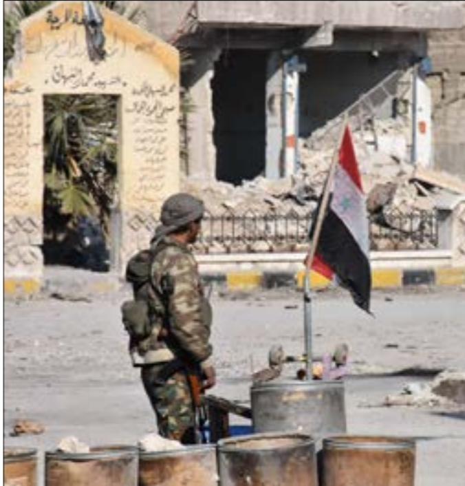
توضر تساؤلات عن إمكان وضع القطاع العسكري على لوائح الإصلاحات الإدارية