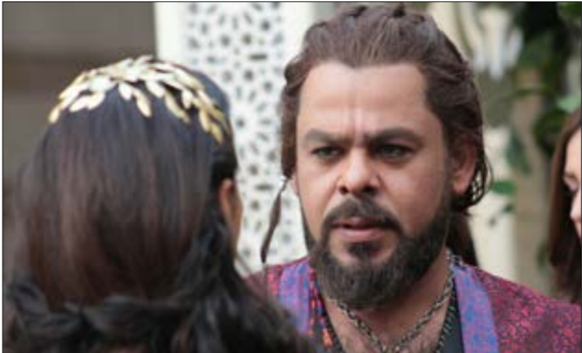
منظر راحة في العمل