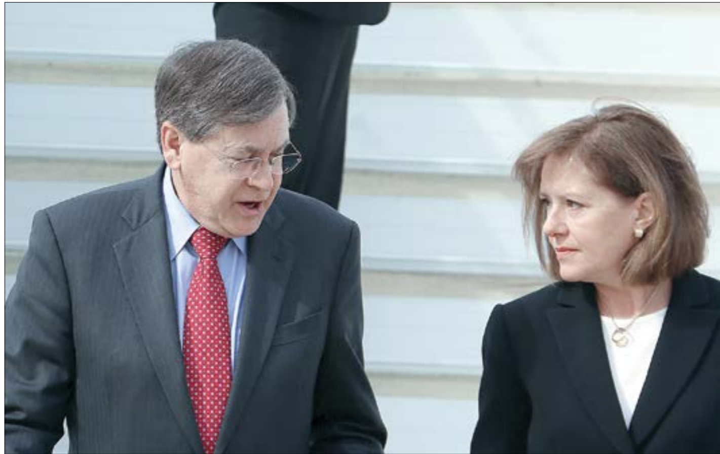
ساترفيلد أكد انه مستمر في مهمته ويسعدو بإجابة جديدة بشأن الهدة الزمنية

قبل نحو اسبوعين، أتى ساترفيلد حاملاً أجواء «إيجابية». هكذا قيل يومها. لكن المعلومات كانت تؤكد خلاف ذلك، إذ «لا إتفاق بشأن نقاط الخلاف الأساسية، وأبرزها رفض العدو للتلازم في ترسيم الحدود بين البر والبحر، واقتراحه تبادل الأراضي، والخلاف على النقاط التي سيتمّ الإطلاق منها للترسيم.