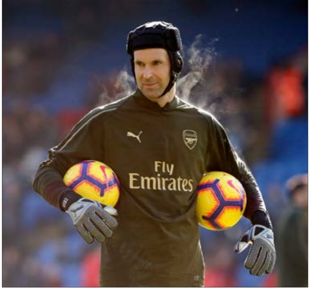
لعب بيتر لارساك وتشيلسي

حسبته قصة لعب اليوم نهائي الدوري الأوروبي لكرة القدم بين نادبي تشيلسي وأرسنال الإنكليزيين، على ملعب باكو الأولمبي. بعدما عن أهمية اللقاء للفريقين، كونه ثاني النهائيات الأوروبية أهمية للفريق بعد دوري أبطال أوروبا. ويعيداً عن أهميته لمدربي الفريقين أيضاً، كونه اللقب الأول لهما مع فريقيهما في إنكلترا. تحمل هذه المباراة أهمية خاصة لحارس أرسنال الحالي وتشيلسي السابق التشيكي بيتر تشيك، كونها المباراة الأخيرة له كلاعب كرة قدم.