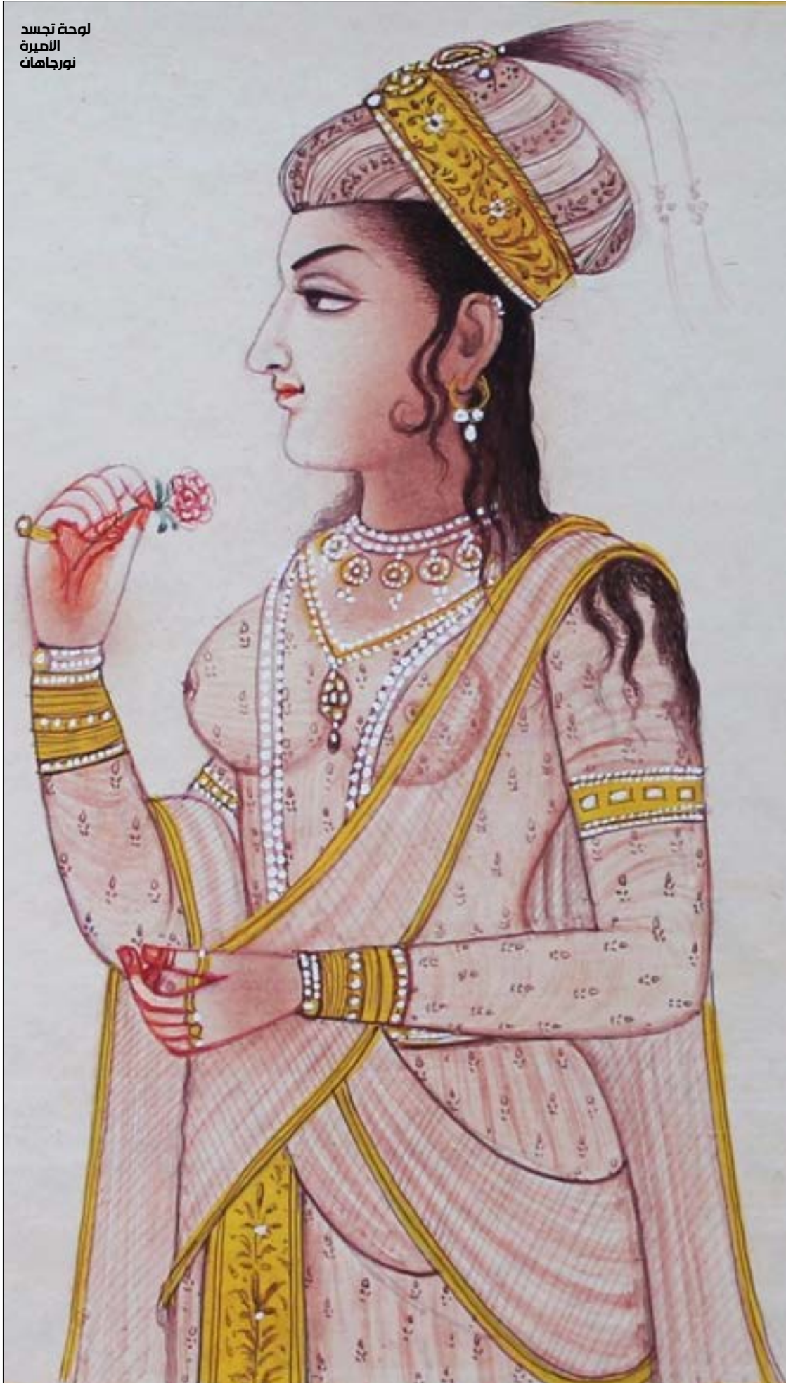
لوحة تجسد الأميرة نورجاهان

* فاطمة المرينسي (1940 - 2015) - مقتطفات من كتاب «شهرزاد ترحل إلى الغرب». المركز الثقافي العربي - 2002. ترجمة فاطمة الزهراء أزرويل