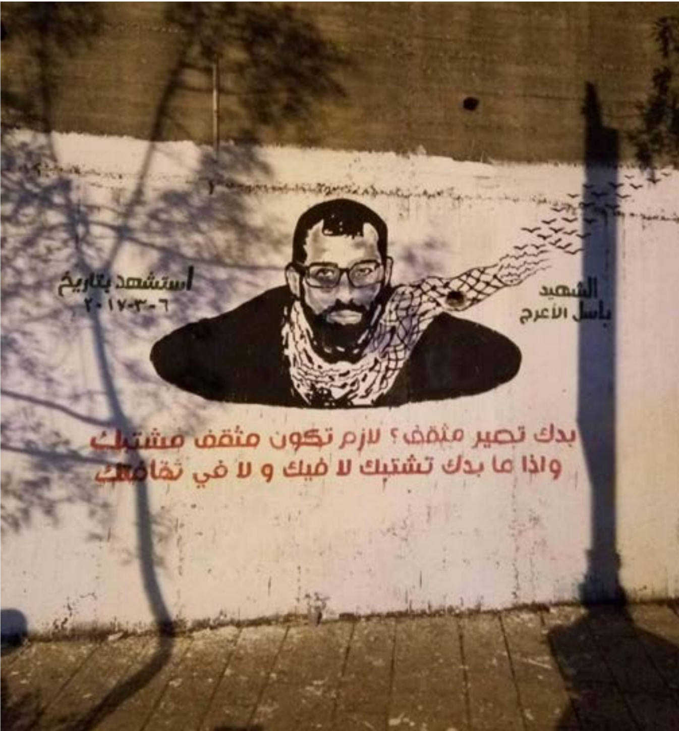
جدارية تخليدا للشهيد باسل الأعرج في الناصرة