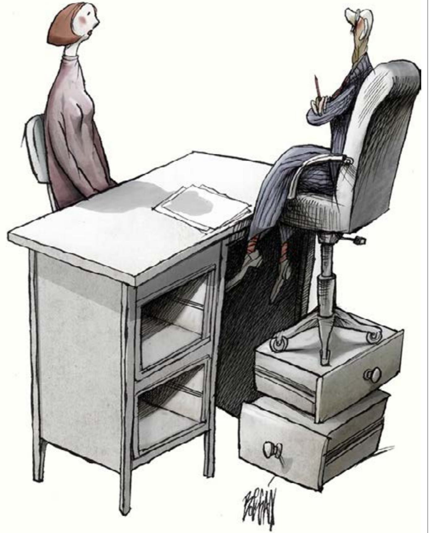
بولغيات - المكسك

تشغيل الأمهات»، وهو الفارق في نسبة الأمهات العاملات اللواتي لديهن أطفال دون السادسة من عمرهم مع بقية الأمهات. إذ أن هذا الفارق ارتفع خلال الفترة الممتدة بين عامي 2005 و2015 بنسبة 38%. وفي سياق متصل، يشير التقرير إلى أنّ 25% فقط من المديرين الذين لديهم أطفال دون سن السادسة من النساء إلى ذلك، لا تزال نسبة النساء في المناصب العليا متدنّية، وهو وضع لم يطرأ عليه تغيير يذكر في السنوات الثلاثين الفائتة، إذ أنّ أقلّ من ثلث المديرين نساء «وإن كنّ على الأغلب أفضل