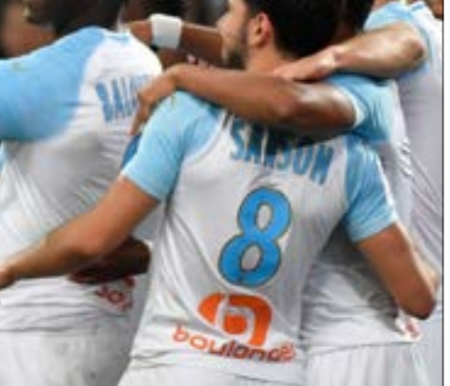
كان احتفالك بالبرونيلق لافنا

إدارة صفحتهم الخاصة، إلا أنّ هذا الأمر تغَيّر اليوم بعدما اختار الكثير من اللاعبين التحكم في حساباتهم بأنفسهم، لينتج منها محتوى أكثر عفوية وتفاعلاً مع الجمهور. أصبح اللاعبون يشاركون تفاصيل حياتهم اليومية وصورهم مع ملايين المتابعين، إلا أنّ هذا الأمر لا يعني أنّ صفحاتهم مخصصة لإطلاع المعجبين على الجانب الآخر إليه، توجه نحو أحد المصورين وأخذ منه هاتفه المحمول الذي تركه معه، وقام بتصوير احتفاله مع زملائه وحفله على خاصة «السوورّي» في حسابه الخاص على الانستغرام. لفظة طريفة من النجم الإيطالي تظهر كيفية تحوّل مواقع التواصل الاجتماعي إلى جزءٍ لا يتجزأ من حياة اللاعبين. ليس بالوتيلي أول لاعب كرة قدم يسجل هدفاً ويصوّر فيديو مباشرةً من الملعب وينشره على حسابه الخاص، إذ سبق أن التقط فرانشيسكو توتي، قائد روما السابق، صورة له وهو يحتفل بعد تسجيله أمام لاتسيو في الدوري عام 2015. اللافت في هذا الأمر هو حرص لاعبي كرة القدم في السنوات الأخيرة على الاهتمام بالطريقة التي يظهرون بها على مواقع التواصل الاجتماعي، بعدما حظمت الأخيرة الجدران والحواجز بينهم وبين جماهيرهم. باتت المنافسة بين لاعبي كرة القدم لا تقتصر على ما يفعلونه مع أنديةهم فحسب، بل ووصل الأمر إلى حساباتهم على مواقع التواصل الاجتماعي، التي أصبحت مقياساً لاشهرة التي تجلّي ذلك في حالة لاعب نادي غلطة سراي التركي سردار عزيز