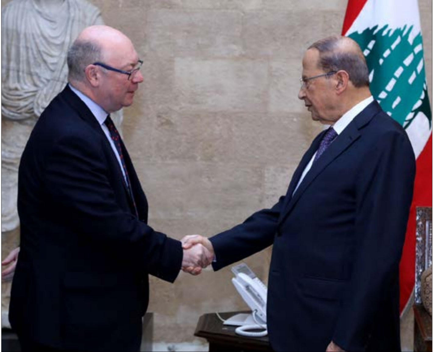
الرئيس عون مستقبلا وزير الدولة البريطاني لشؤون الشرق الأوسط اليستر بيرت في بيروت بعدا امس

رفيق الحريري، ومن ثمّ العدوان الإسرائيلي في تموز 2006، وفشلوا في ذلك، يجاولون اليوم في عهد الرئيس الأميركي دونالد ترامب رفع