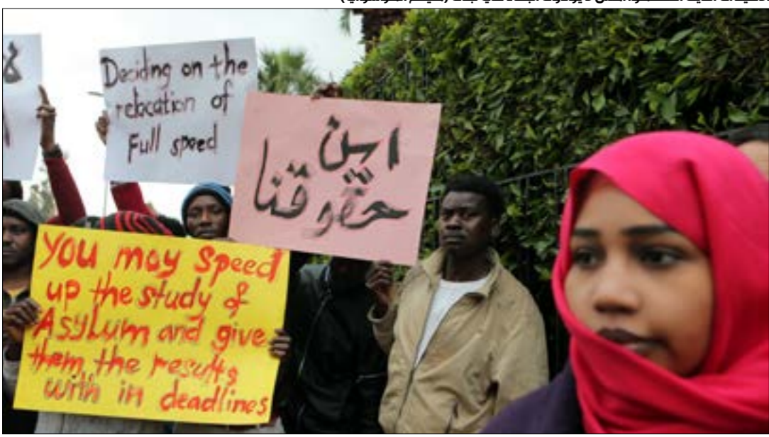
الكلمات الذين اعتصموا أمس لا يوجدون الفياء في لبنان (هيلم الموسوي)

أخرى لربما نال الجنسية. هم يعرفون أن لا جنس في لبنان، فضلاً عن لا لجوء، ولهذا يظنون أنّ المفوضيّة الدائمة تكذب عليهم. يتوخّه مهذب، حاملاً لافتته، إلى وزير الخارجية جبران باسيل: «نحرف لبنان تماماً، ولكنّ الغرب أن المفوضيّة أخيراً رفَعوا لافتاتهم، أمام مقرّ مفوضيّة الأمم المتّحدة لشؤون اللاجئين في بيروت، وفيها بعض مطالبهم: إعادة التوطين، فتح الملفات المغلقة، لا للاعتقالات التعسّفة... ولافتات أخرى بالإنكليزيّة «حتى يسمع العالم كله». دول العالم «العظمى» التي شاركت بجعلهم لاجئين، بفعل سياسات عدم وجود إقامة وانتظار البث في ملفّ لجوئهم، أن تلقي القوى الأمنيّة القبض عليه. أكثرهم عاش هذه التجربة. حكايات ما يتعرضون له من إذلال كثيرة. بعضهم، والأّن مع تقشي نبرة «الغريب» بات لإخراجهم من السجن. كون لديهم مَلفات لم يبتّ بها بعد، ثم يعودون لممارسة الانتظار بالخفاء... إلى أن يُلقى القبض عليهم مُجنّداً. هذه هي دورة حياتهم هنا. أكثر من معتصم، أمس كانوا يحملون أطفالهم. بعضهم يحصل على مساعدات معيشيّة قليلة من «المفوضيّة» المتدوّرة، فيما بعضهم الآخر لا يحصل على شيء، فكيف يعيش هؤلاء؟ بالمناسبة، اللاجئون السوريّون في لبنان هم من أكثر اللاجئين «سلميّة»، نادراً ما تسمع عن ارتكابهم جرائم سرقة، مثلاً، أو أيّ