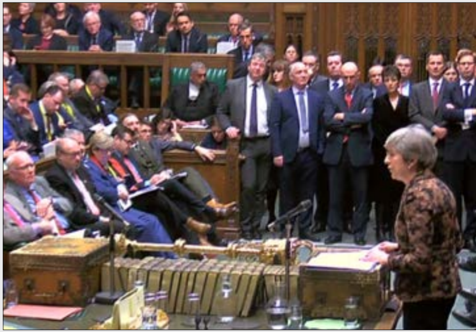
الصفحات الفنية لحظة ماى ائت من خارج ملعب السياسة

ازدادت أزمة حكومة «المحافظين» البريطانية تصعيداً بعدما بدأوا واضحاً أنه الأوروبيين غير عازمين على إتخاذ خطط رئيسة الوزراء تيريزا ماي، فخرجت اليها كرات النار، في الوقت ذاته الذي يقف فيه الجيش على أهبة الاستعداد للتعامل مع فوضه محتلمه، وبينما تنسايء الشركات الكبرى على تفصيل خطتها للفرز من الاسئمة التي بدأت تفرق، يستمر طاقم هذه السفينة من النخبة السياسية في جدل بيزنطي عنيء، واصطفافات قبائلية محضة