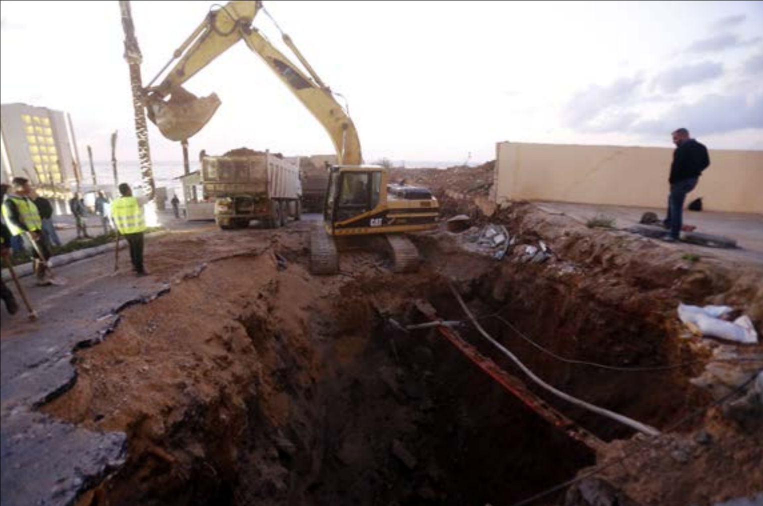
بعد شهر، لا يزال التحقيق مفتوحاً من دون موقوفين أو مهملين أو نتيجة فعلية