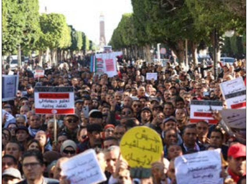
بمجرد الجانب الحكومي حتى الآن خفض نسبة الضرائب على الرواتب (الأخبار)