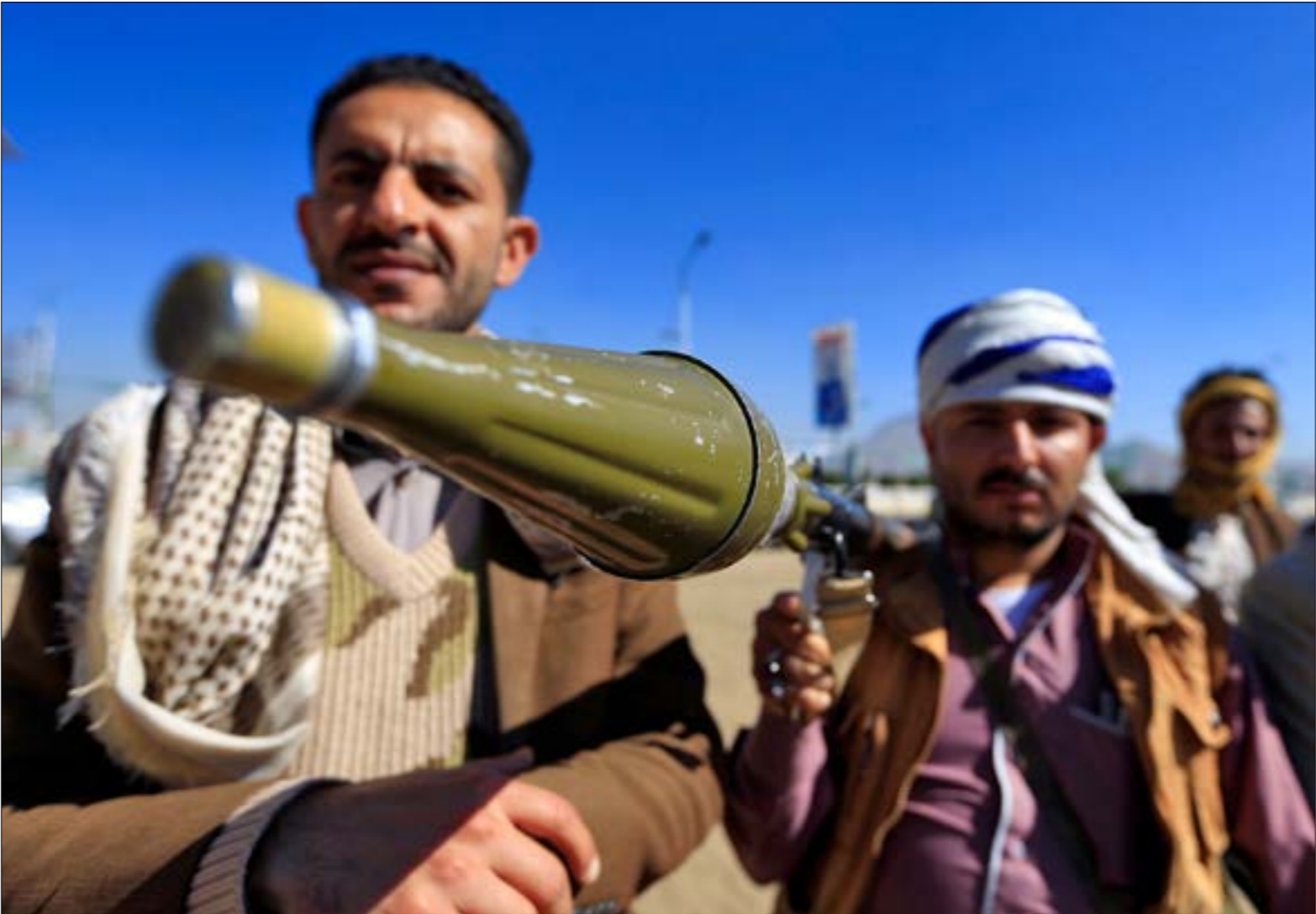
خلك وقمة داعمة للجيش واللجان الشعبية أمس في صنعاء (أ ف ب)

ومن المفيد التذكير، هنا، بأن وفد الرياض حضر إلى السويد خالي الوفاض على المستوى السياسي، وحتى على المستوى الإداري، ولم يصطحب معه أي ملفات أو وثائق أو مستندات أو صور، وسعى إلى المعاطلة وكسب الوقت إلى أن جاءه الاتصال من الرياض، وبعد الإعلان عن الاتفاق، انهال على الوفد سيل