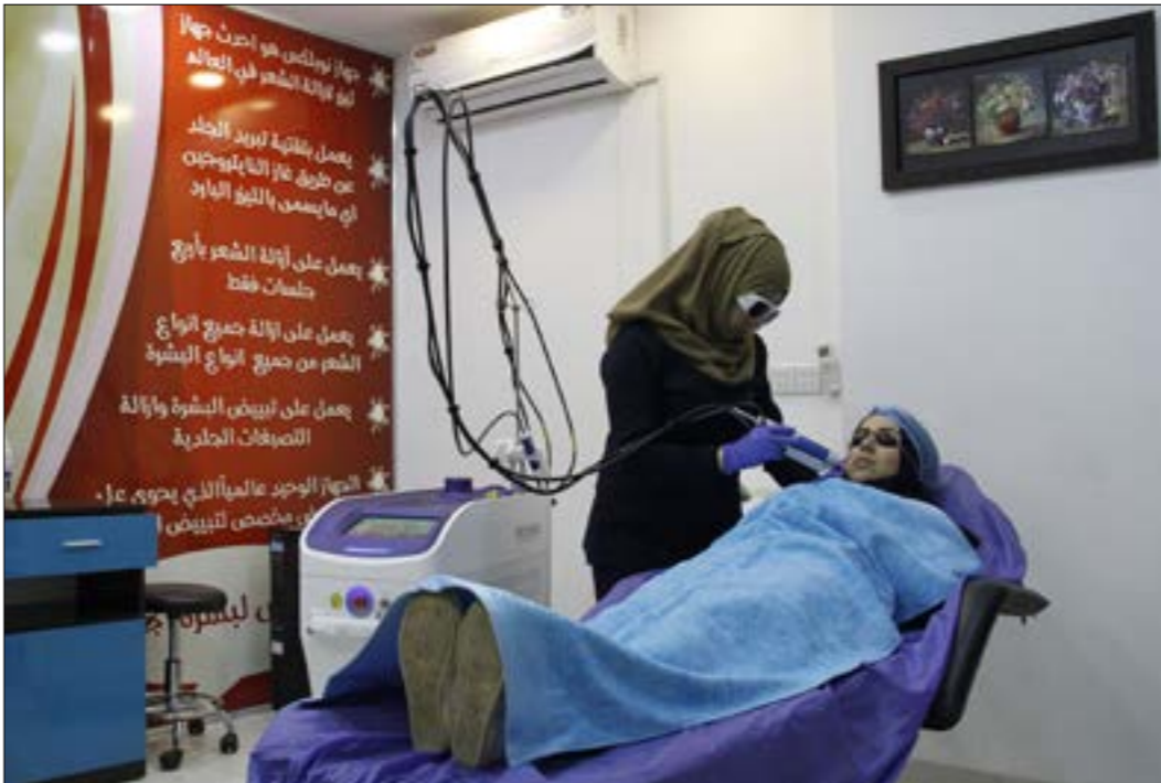
أعد افتتاح مراكز التحميلة في مدينة الموصل بعد عام على تحريرها من داعش

مرة جديدة، أجهل التصويت على ما تبقى من حقائق شاعرة في حكومة عادل عبد المهدي، في ظل استمرار الخلافات بين الكتلة السياسية، تأجيل جاء ليكبح رغبة عبد المهدي في إتمام وزارته في اسرع وقت ممكن. وليزيد المضاعفات السلبية للتأخير على صورة رئيس الوزراء وبرنامجه