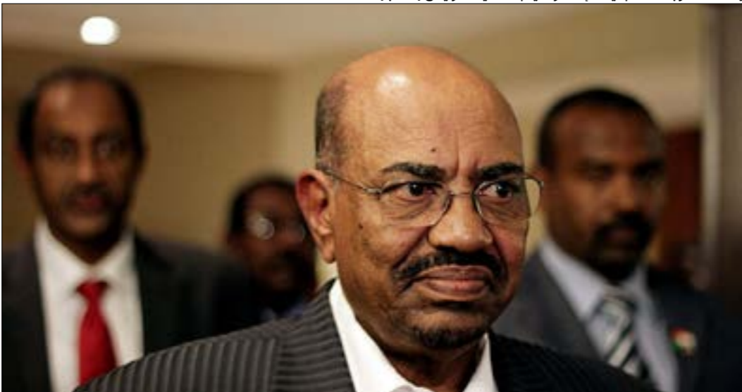
بسمه الحزب الحاكم، أيضا، إلى توسيع صلاحيات الرئيس