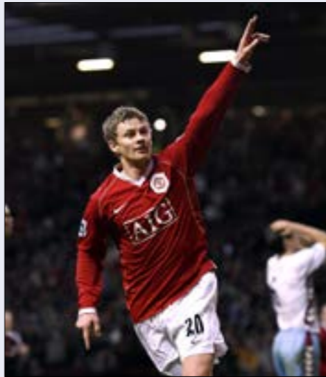
مباراة سولسكاير الأولى ستكون ضد كارديف

أعلن نادي مانشستر يونايتد الإنكليزي لكرة القدم تعيين لاعبه الترويجي السابق أولي غونار سولسكاير مديراً مؤقتاً له حتى نهاية الموسم الحالي، غداة إقالة البرتغالي جوزيه مورينيو على خلفية النتائج السيئة. ونقل بيان للنادي عن المهاجم السابق الذي كان يتولى حتى الآن تدريب نادي مولده الترويجي لكرة القدم، قوله: «مانشستر يونايتد هو في قلبي والعودة بهذا الدور أمر رائع. أتطلع قديماً للعمل مع التشكيلة الموهوبة التي لدينا، الجهاز الفني، وكل من في النادي». وسيعاون المدير الفني الجديد البالغ 45 عاماً، مايك فيلان، كمدرّب للفريق الأول. إضافة إلى القائد السابق للفريق مايكل كاريك وكيران ماكينا. ونقل البيان عن نائب رئيس مجلس الإدارة التنفيذي إيد ويدورد قوله: «أولي هو أسطورة في النادي ويتمتع بخبرة هائلة. أكان على أرض الملعب أو في المهام التدريبية». وأضاف «تاريخه في مانشستر يونايتد يعني أنه يعيش ويتنفس ثقافة المكان هنا، وكل من في النادي مسرور بعودته وعودة مايك فيلان (أحد أبرز مساعدي المدرب الأسطوري السابق اليكس فيرغوسون). نحن واثقون من أنهم سيوحان اللاعبين والمشجعين مع دخولنا النصف الثاني من الموسم، وكان قرار تعيين سولسكاير متوقعاً إلى حد كبير بعدما نشر نادي «الشبابية الحمر» عن طريق الخطأ على موقعه الإلكتروني ليل الثلاثاء، الأربعاء، شريطاً مصوراً مع تعليق «سولسكاير يصبح مدربنا الموقت». وعرض النادي في الشريط أبرز محطة في مسيرة المهاجم السابق مع الفريق، أي تسجيله هدف الفوز على بايرن ميونخ الألماني (1-2) في وقتي بدل الضائع من المباراة النهائية لدوري أبطال