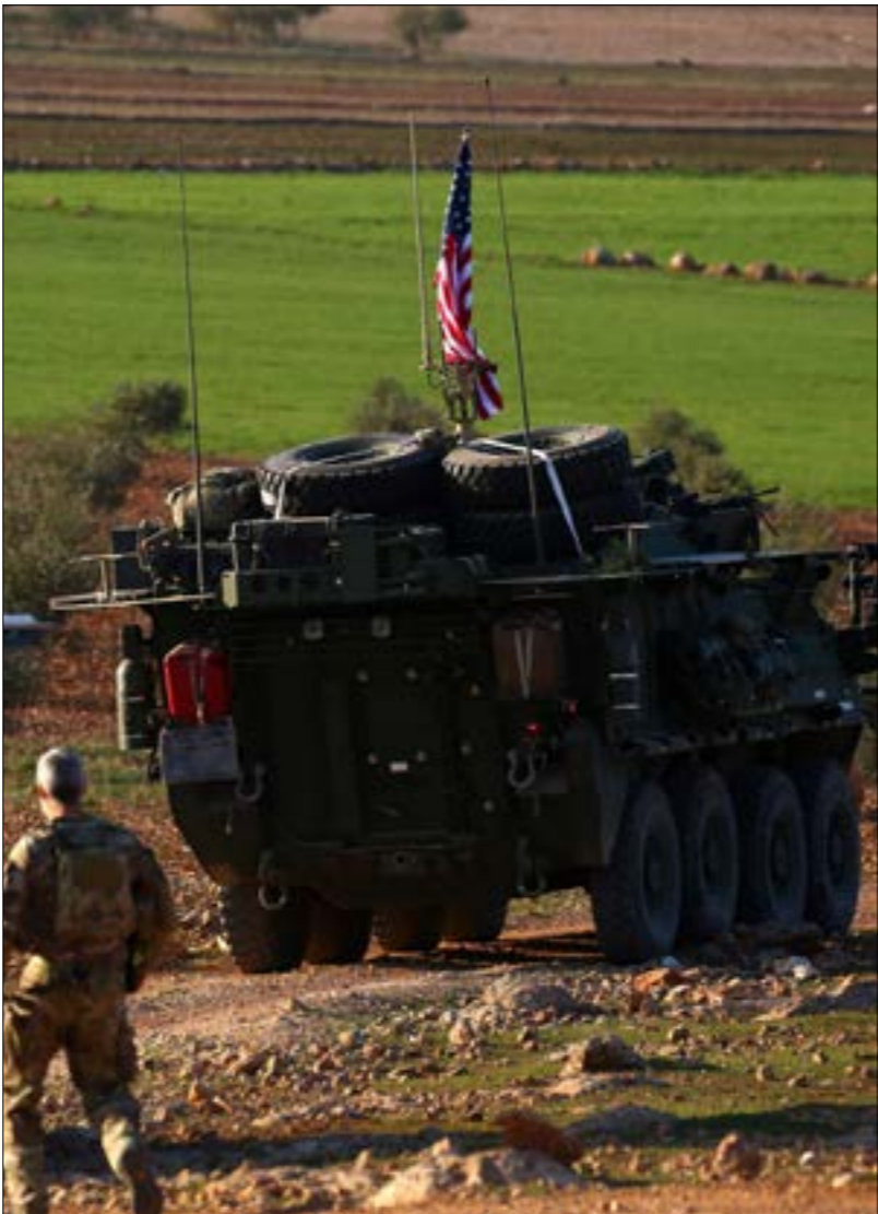
باتي الانسحاب الموعود بملازمة ضربة جديدة لتأقاما، مصاد، في سياق صعوبات غير مغلقة