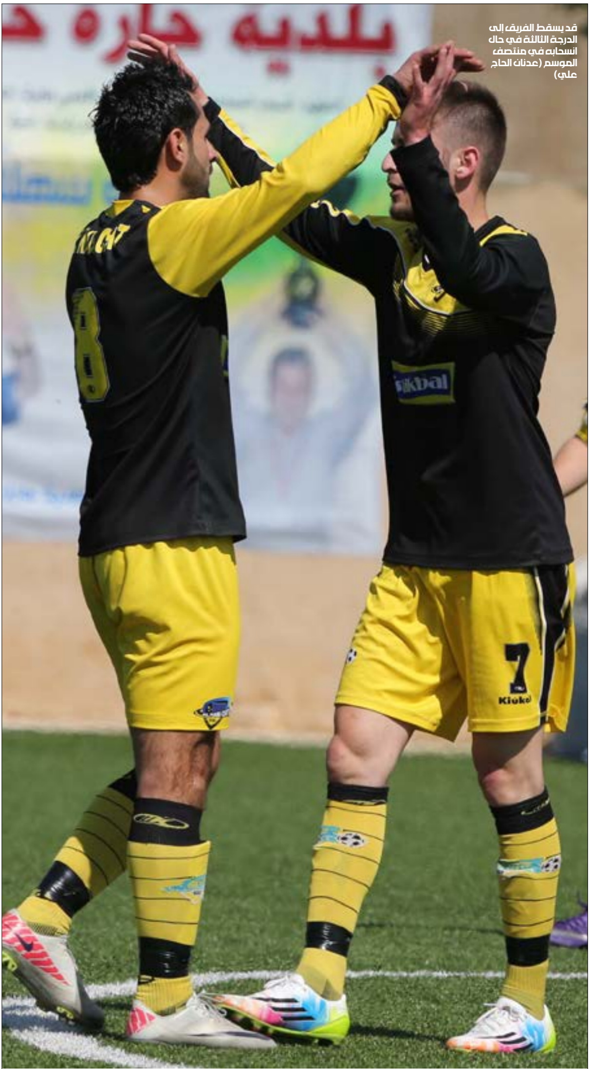
قد يسقط الفريق إلى الدرجة الثالثة في حال انسحابه في منتصف الموسم