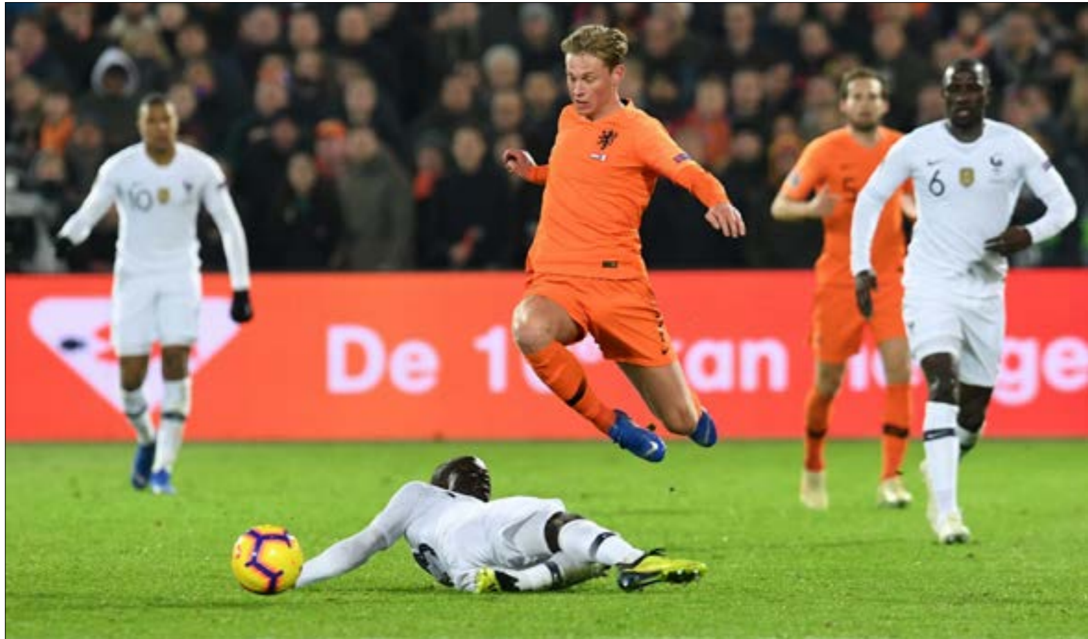
تشكيلة المنتخب (اليمين)