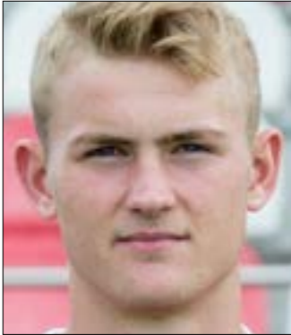
ماتياس ده ليخت