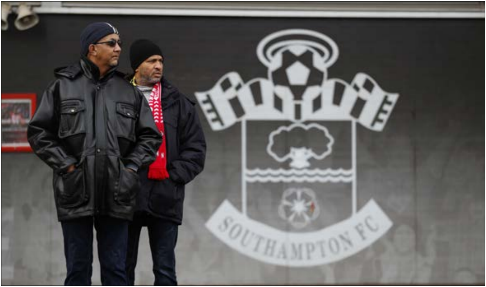
يبحث النادي اليوم عن مدرب يعيد له الروح

بعد غياب سنوات عن المنافسة، تمكّن المدرب الألماني يورغن كلوب في غضون ثلاثة مواسم من إعادة هيكلته نادي ليفربول الإنكليزي، ليصبح أقرب من أي وقت مضى لتحقيق لقب الدوري الإنكليزي الممتاز