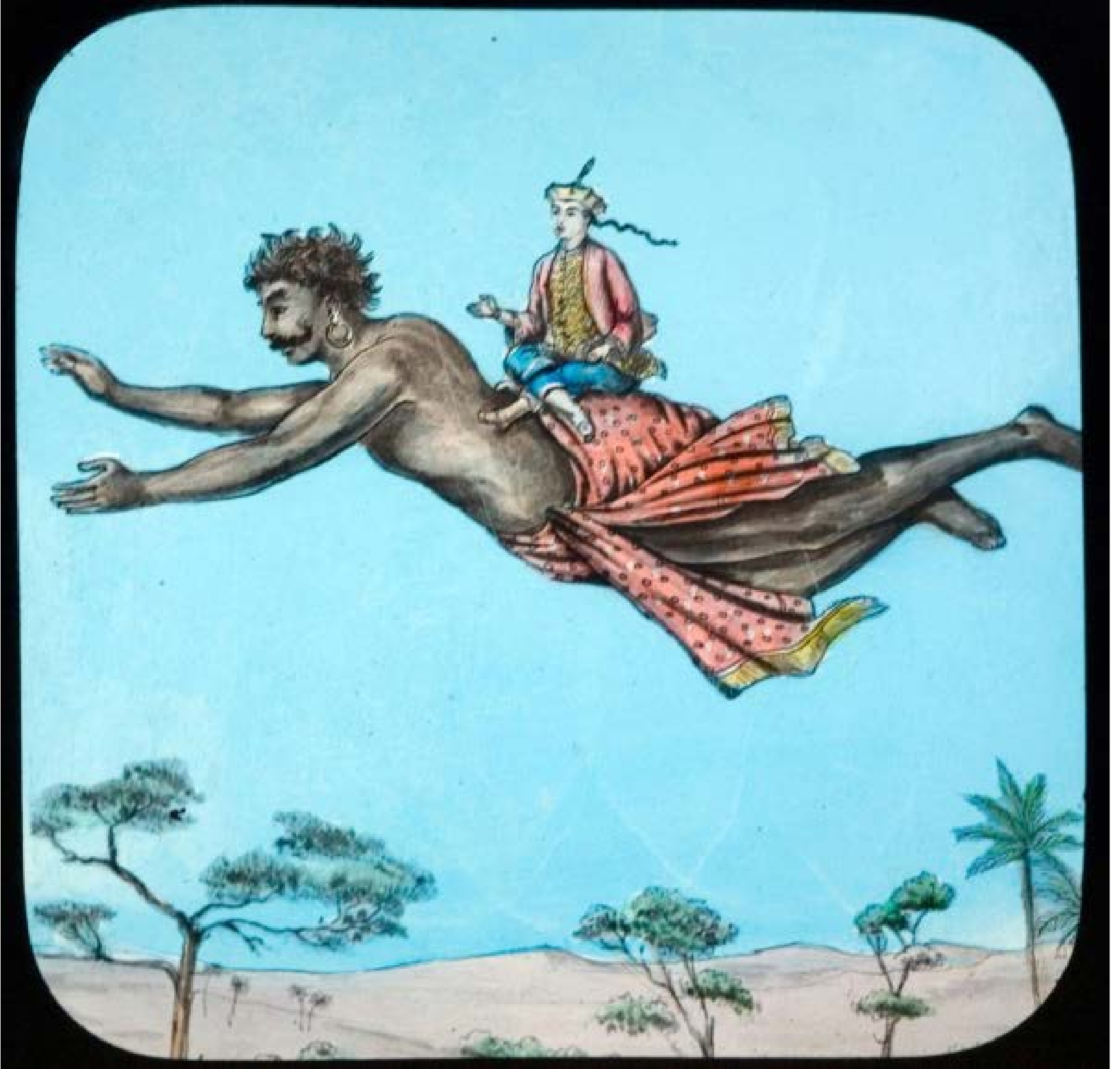
رسم لعلاء الدين على ظهر الجنى من الحكمة الفيكتورية