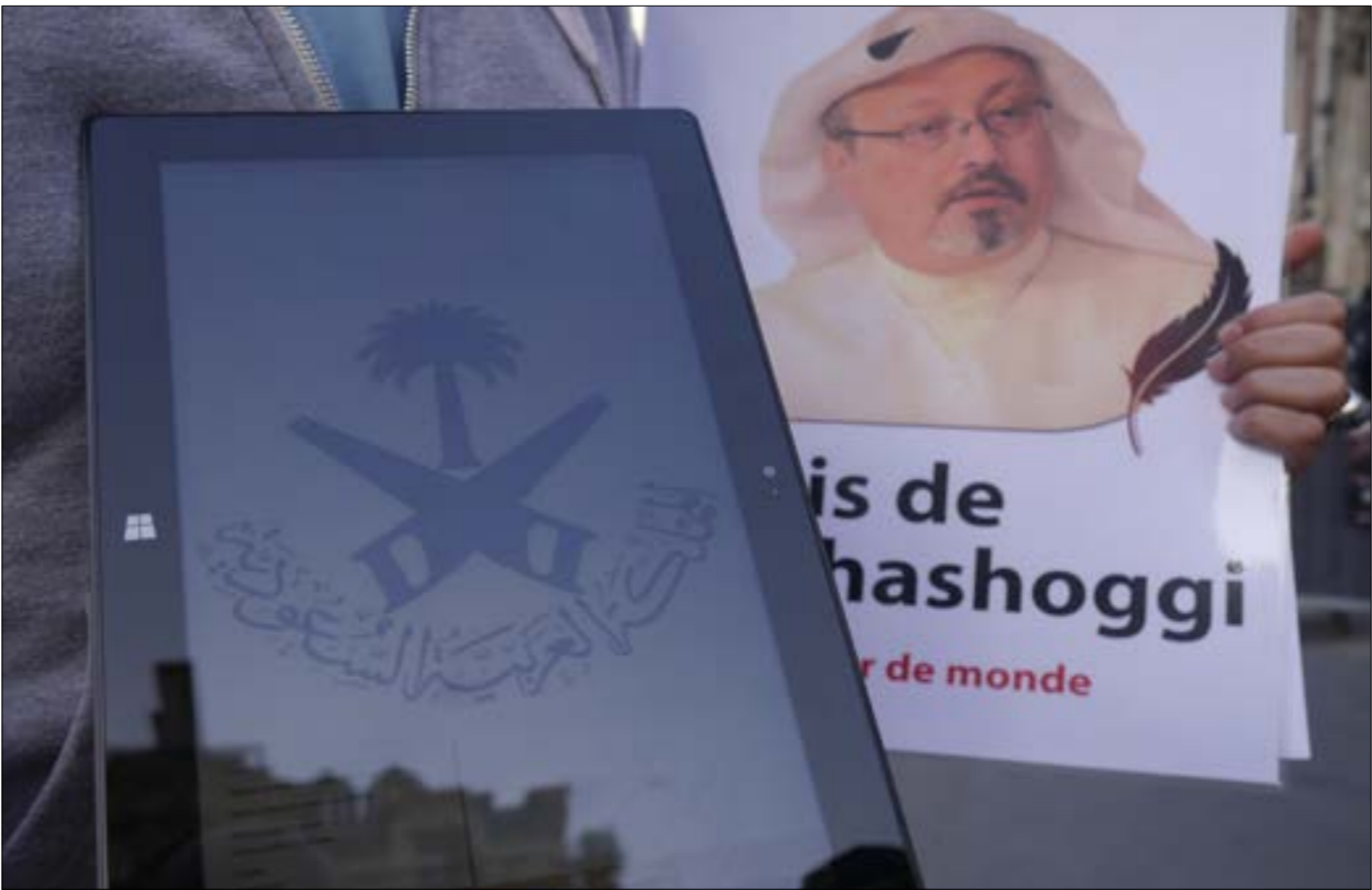
تقاد الحملة الإعلامية الغربية عن جمال خاشقجي، تكوّن فريدة في حدّتها واتساعها وإجماعها (الأنشود)

أن كتاباته نمت عن ثقة مطلقة (وساذجة) باستقلالية الإعلام الغربي ومهنته.لم يتحدّ خاشقجي أياً من فرضيات حكومات وإعلام الغرب عن الشرق الأوسط، وكانت أسطوانته تتراوح بين الأثر على «إصلاح محمد بن سلمان» والمناشدة عن التغريد وإصدار على نسق خطاب المنظمات غير الحكوميّة، من دون الإصرار على شروط وضوابط بل تكون تلك المناشدة الديموقراطية مدخلاً إلى تغيير جذري وليس إلى تسلّل أصحاب الملياتر وأجندات دول الخليج الثرية إلى مراكز السلطة في بلدنا.