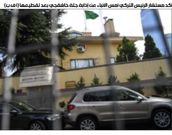
أكد مستشار الرئيس التركي إحص الألبان عن إذابة جلة خاشقجي بعد تقطيعها

أيضاً شخصيات مؤيدة لإسرائيل، من مثل مؤسس جماعة «الصلال» في إدارة ترامب، وحملها على تشذيب نفسه بأنه «زعم صهيوني اميركي». ويُعد استقبال هذا الوفد، الذي التقى أيضاً وزير الخارجية عادل الجبير والسفير السعودي لدى واشنطن خالد بن سلمان والأمين العام لـ«رابطة العالم الإسلامي» محمد العيسى، تلميحاً سعودياً متجدداً خلف لافحة «الحوار بين الأديان»، من أجل إثبات استعداد المملكة - بقيادة ابن سلمان - للمضي إلى أبعد الحدود