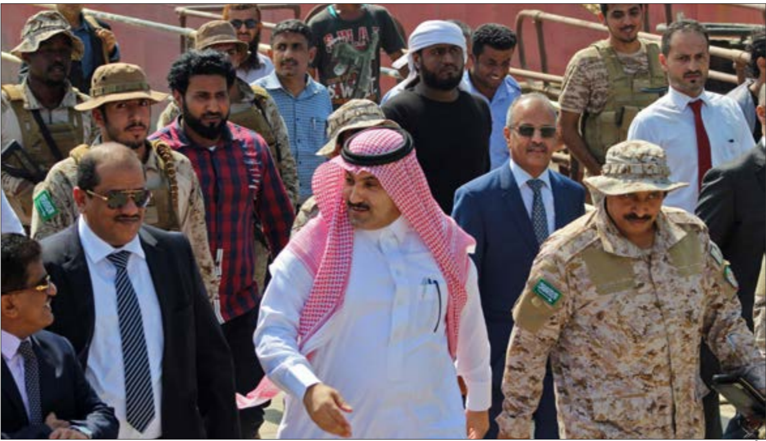
دشّن السفير السعودي أواخر الشهر الماضي في عدن مشروع المحنة النفطية (ف اب)

«الانتقالي»، واعتبروا الأخير الوجه الدولي بوقف الحرب خلال 30 يوماً، وفق ما دعت إليه الولايات المتحدة، وأيدته فرنسا وبريطانيا. في هذا الإطار، تشهد الساحة الجنوبية سباقاً بين مكونات «الحراك الجنوبي» و«المجلس الانتقالي»، لحجز مقعد في قطار المفاوضات. وفي سبيل ذلك، وخلافاً لما تمسك به دائماً من احتكار تمثيل الجنوبيين، بدأ «الانتقالي» أخيراً خطوات على طريق الحوار مع بقية المكونات. وهي خطوات لا يبدو أنها خارج إرادة ولي طلي، خصوصاً أن «المجلس» تراجمت شعبيته لصالح قوى «الحراك» التي ترفض التبعية والإرتهاق للخارج، والظاهر أن «الانتقالي» المضادة من وراء ذلك، الالتفات على منافعها الجنوبية والشرقية منافسها، وتجييز قوتهم لصالحه بهدف تعزيز موقعه وإثبات اهليته للانضمام إلى المفاوضات. لكن معظم أولئك المنافسين رفضوا الحوار مع