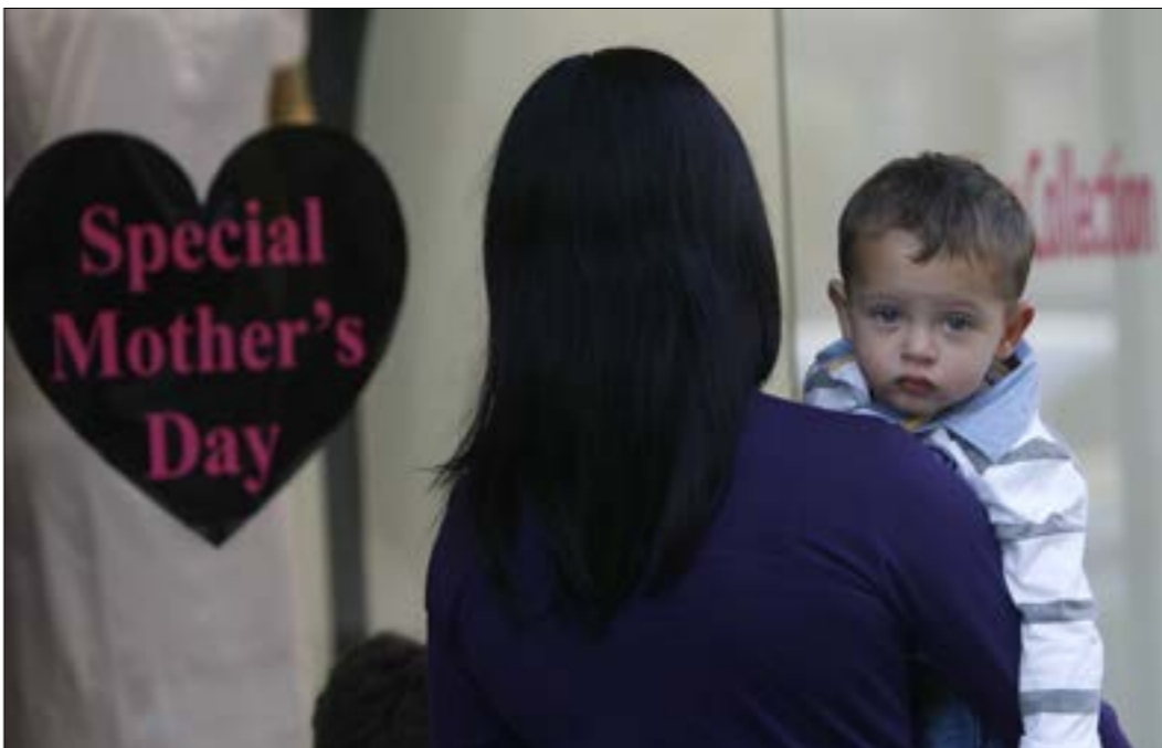
نص القرار على ان واجب الام اتمام طفلها بالذهاب مع والده والا تكون مسؤولة عن الرض (مروان طحطح)

انه لم يتبين ان المنفذ قد الحق الضرر او الاذى بابنه».