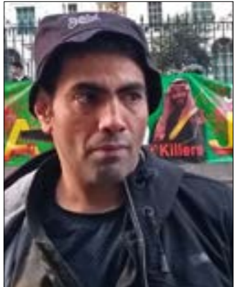
في التسجيل الذي نشره غانم في قناته في «يوتيوب»، غاضباً مما أطلق عليه في حينها «حراك 15 سبتمبر» الذي أطلقه معارضون في الخارج، من بينهم غانم، بعد حملة اعتقالات «برنز كارلتون»، مطالبين بإطلاق المعتقلين ومعالجة الفقر والبطالة وأزمة السكن ورفع الدعم عن المرأة وتحسين مستوى الخدمات، وإرغام قتل الحراك، الخراج، السعوديون بسياراتهم إلى اعتراضهم وصوروا مقاطع وثقوا فيها اعتراضهم على النظام، وخوفهم من التظاهر، أرسلوها إلى غانم الدوسري، الذي نشرها بدوره في «يوتيوب»، ما أظهر حجم تأثير المعارضة في الداخل، وفي ضوء ذلك، أدرج اسم الدوسري في قائمة «سوداء» لمعارض النظام، أعدها وأعلن عنها العام الماضي، الوزير والمستشار السابق في الديوان الملكي، سعود القحطاني، المتهم بتدبير اغتيال جمال خاشقجي.

سلمان، تقدم إلى صديقه الآن بنذر، اثناء وجود الدوسري، الذي كان ينزف من الدم، في سيارة الإسعاف قبل نقله إلى المستشفى، وعرض على بنذر مبلغاً من المال، مقابل الإمتناع عن تقديم شهادته عند فتح تحقيق في الحادثة، إذ تم تحديد هوية ذلك الشخص، بحسب الدوسري، بـ«أنه رجل أعمال سعودي مقرب من محمد بن سلمان»، لا تخفي يد النظام أيضاً في الإعدام شبه الرسمي، الذي صقّ البريطانيين ووصفهم بـ«الإبطال»، كما ذكرت صحيفة «المواطن»، تحت عنوان «المعمل الهارب غانم الدوسري عوى في لندن فلن نرسأ قاسياً لكل من يتناول على السعودية»، قائلة