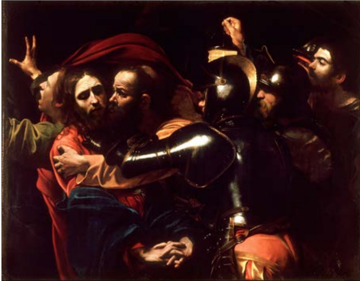
«القبض على المسيح» (زيت على كائناس — 1602) لكارافاجيو

وهكذا استبدل أعمال الرسل تعبير «ثمن الدم» بتعبير «أجرة الظلم». لكن السؤال هو: لم وصفت الدراهم التي حصل عليها يهوذا بأنها «ثمن الدم»؟ لماذا لم يقل مثلاً أنها «ثمن التسليم» أو «ثمن الخيانة»؟ لماذا يدخل الدم هنا في الموضوع؟ وكيف تكون دراهم يهوذا ثمناً لدم المسيح؟ يدفع إلى هذا السؤال أن دية القتل هي التي تمثل في العادة «ثمن الدم». فحين يقتل أحد، يدفع أهل القاتل لأهل القاتل دية هي ثمن دم قريبهم المراق. هذا أولاً. أما ثانياً، فإن اسم الحقل كما ورد في الصيغة اليونانية هو «أكل دماً» akaldama، وليس «حقل دماً» haqeldema. وبالنسبة لكلمة كهذه نقلت من لغة سامية إلى اللغة اليونانية، فإن الكلمة الأصلية ستكون إما بالألف (أكل دماً) أو بالعين (عقل دماً). وقد افترض جون م. ألغرو في «الفطر المقدس والصليب» أنها بالألف (أكل دماً)، وليس «حقل دماً». أي أنه تعبير يشير إلى الطعام والأكل. يقول: «أهم من هذا... هو اسم «الحقل»، Akaldama. فنحن هنا أمام ترجمة... مزيفة، تقرأ الكلمة كما لو أنها الكلمة الآرامية في الحقيقة الكلمة الآرامية akal dame «طعام القيمة، أو التعويض» (John M. Allegro, The Sacred Mushroom and 1973, the Cross, ABACUS, London 205 page). لذا فقد رأى ألغرو أن في النص «لعب كلمات بين الآرامية «دم» و «ثمن، قيمة»، وبين akal «طعام» و khaqoul «حقل» في حين أن المعنى الحقيقي لـ Akeldama هو «طعام التعويض» أو «الكفارة» (John M. Allegro, The Sacred Mushroom and 1973, the Cross, ABACUS, London 160 page) توضيح ألغرو شديد الأهمية بشأن «أكل دماً»، وربما فتح لنا الباب كي نفهم النص فهماً سليماً. لكن يبدو أن علينا أن نصلحه قليلاً. إذ من المحتمل