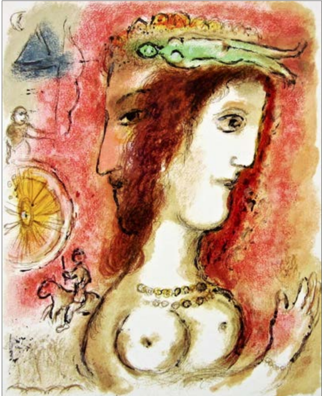
مارك شافال، «بوليسوس وبنيلوب»، (محفورة _ 1975)