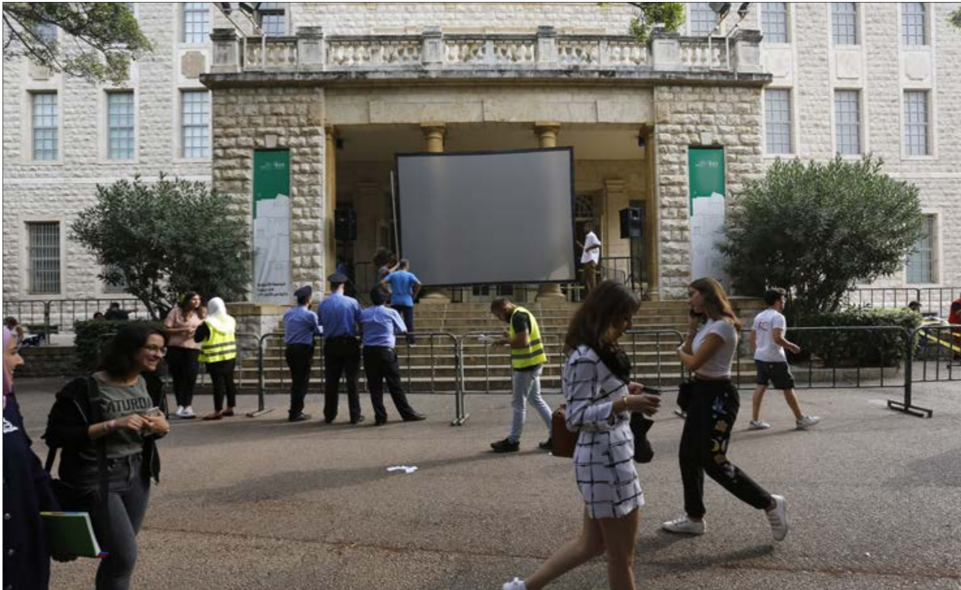
باتت الجامعة أكثر تسامحاً في استضافة أساتذة وفلاديمير بجاھرون بتأييدهم لإسرائيل (مروان طحطح)

إجراءات «تذهب بعيداً في التمادي» في تطبيق هذه السياسة، لافتة الى أن هذه الإجراءات، في إطار مصادر في «الأميركية» التي تطلعت للمساعدات المالية التي تمنحتها