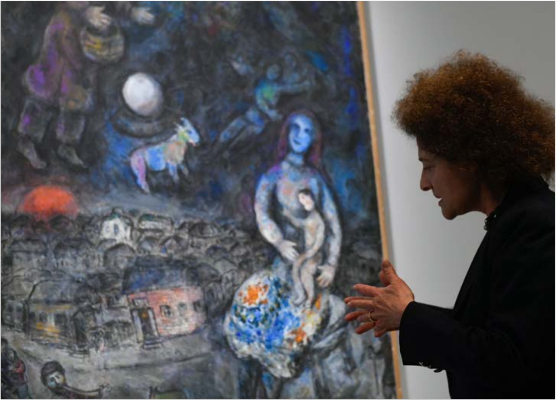
«شغال، من الاسود والابيض الى الالوان»، هو عنوان المعرض الذي يحتضنه متحف Hôtel de Caumont في أكس آن بروفانس، جنوب فرنسا، لغاية 24 آذار (مارس) 2019. يضم المعرض أكثر من 130 قطعة (لوحات ورسومات واعمال كولاج وتماثيل...) للاحدرواد التجديد مارك شغال (1887 - 1985). اعماله تسلط الضوء على تجربته الفنية المتنوعة، ومراحل حياته الإبداعية من عام 1948 حتى وفاته في 1985.