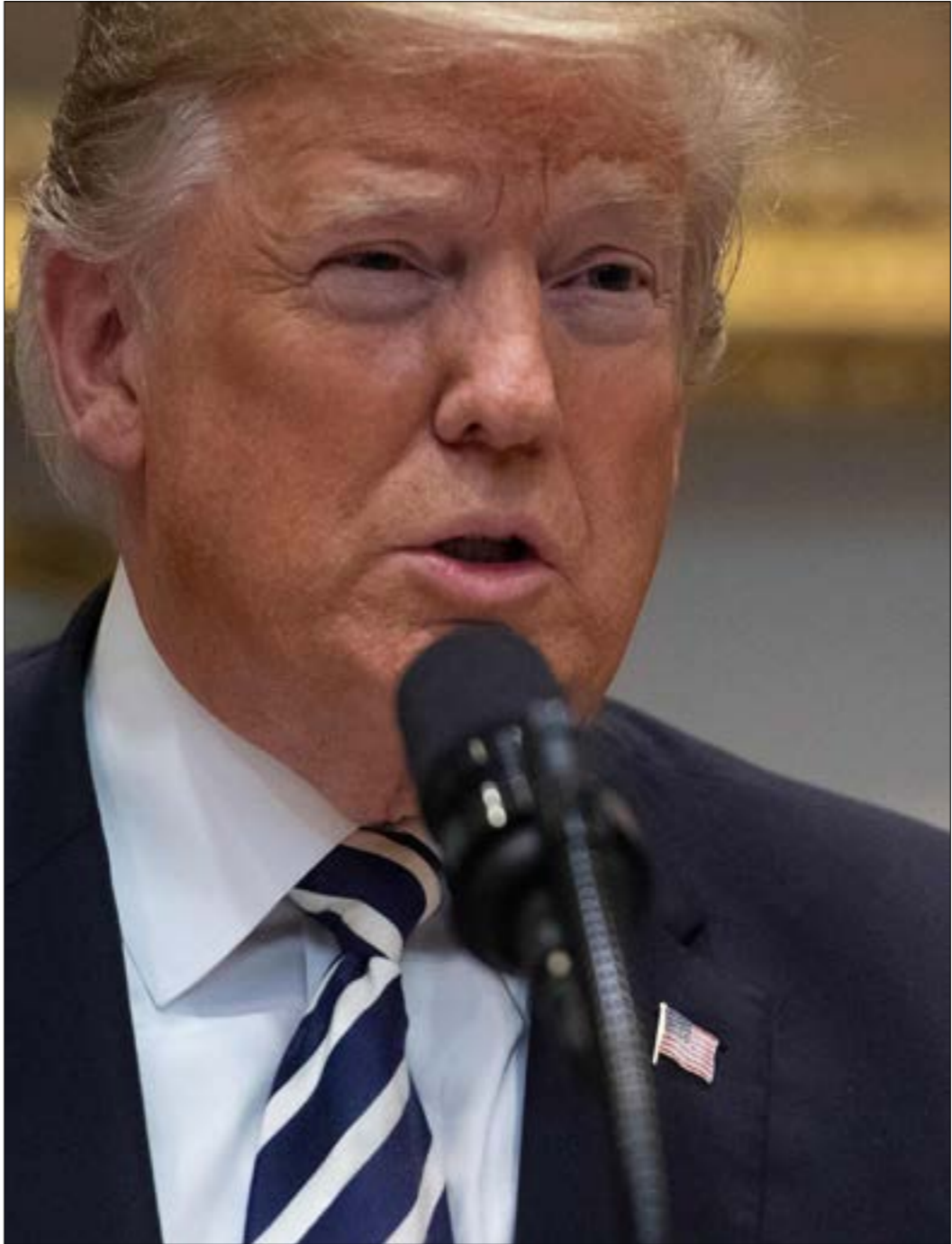
تراجم لراهب عن هدفه، «تصدير النفط»، عبر إقرار استثناءات كان شدد على رفضها

من إجراءات الحظر. تلك الثقة عبرت عنها الخارجية الإيرانية، أمس، بالتأكيد أن لا «مخاوف» تراود طهران من العقوبات، قبل ساعات من بدء الحظر. وكان النائب الأول للرئيس الإيراني إسحاق جهانغيري، شدد على أن بلاده تتحمل أن تهبط صادراتها إلى مليون برميل، مقرأً بأن الحظر تسبب بالتراجع عن معدل مليونين ونصف المليون برميل في اليوم، لكن الأسعار عوضت العائدات،