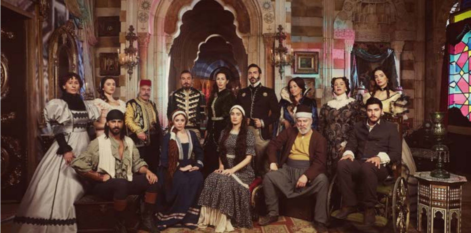
مشهد من «ثورة الفلاحين»

إذاً، يتصدر «ثورة الفلاحين» اليوم المشهد الإحصائي، يليه «كارما»، ثم الأعمال الدرامية التي تعرضها «الجديد». يتصدر المسلسل التاريخي المشهد رغم خفوت الحديث عنه، أو حدثائه أي ضجة بعد أكثر من شهر على عرضه، أقله افتراضياً. ويبدو أنّ هذا الأمر انعكس على Ibei، التي تعيش ارتباكاً واضحاً، إذ قررت عرض «حبيبي اللدود» هذا الأسبوع، قبل انتهاء «ثورة الفلاحين»، واقتسام أيام الأسبوع بين عمليّن مختلفين في