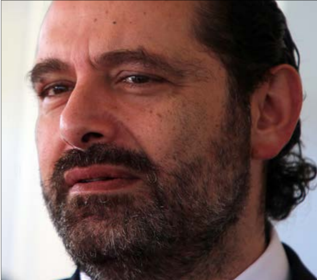
جلوس الحريري الى طاولة واحدة مع سنّة 8 آذار يعني اعترافه بتجديله (هيلم الموسوي)

لا تشبه مقاربة الحزب اليوم للحكومة الحالية ما جرى قبل