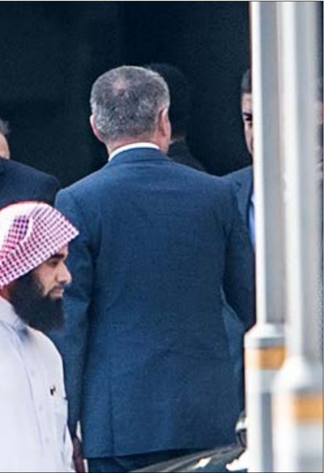
حاول المدعي العام السعود استكشاف ما لده أنقرة من معلومات

أنقرة، خصوصاً في ما يتصل بجثة خاشقجي، لكن محاولاته تلك باءت بالفشل والظاهر، في ضوء ذلك، أن السعودية أرادوا استكشاف الأسلحة التي يهددهم بها الأتراك قبل أن يلقوا أوقافهم، لكنهم مع تمنع الاعاء التركي اضطروا إلى تسليع الشهادات التي في حوزتهم، والتي لا يتوقع في حال من الأحوال