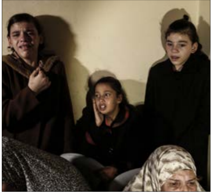
ومد الوفد هذه المرة بتجاوز عقبات السلطة وإسرائيل خلاه وقت قريب

امر عباس بتشكيل لجنة من مهماتها إقرار عقوبات جديدة على غزة