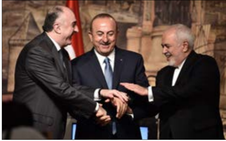
ندع الية التعاون الجديدة مهمة البراك في مواجهة العقوبات

تصاعدت حدة التصريحات بين الولايات المتحدة وإيران، قبل أيام من دخول الدفعة الثانية من العقوبات الأميركية حيز التنفيذ، في 5 تشرين الثاني/نوفمبر المقبل. وكتب وزير الخارجية الأميركي مايك بومبيو، على حسابه في «تويتر» محقياً بأضعاف بلاده للاقتصاد الإيراني بفضل العقوبات، وفي الوقت نفسه، وفي محاولة لتبرير الموقف الأميركي، أضاف: «هذا ما يحدث عندما يسرق النظام الحاكم من شعبه ويستثمر في الرئيس السوري بشار الأسد بدلاً من توفير الوظائف للإيرانيين، إنهم يدمرون الاقتصاد». تصريحات بومبيو ردت عليها وزارة الخارجية الإيرانية بوضعها في إطار «الحرب النفسية». وقال الناطق باسمها بهرام قاسمي، إن هذه التعليقات تقوم على الشعبية والمغالطة... الاقتصاد الإيراني أظهر نمواً طوال السنوات الماضية عندما كانت إيران تقاتل الإرهابيين». مستكراً «العقوبات غير الإنسانية والعادية» التي تفرضها واشنطن للأضرار بالاقتصاد الإيراني.