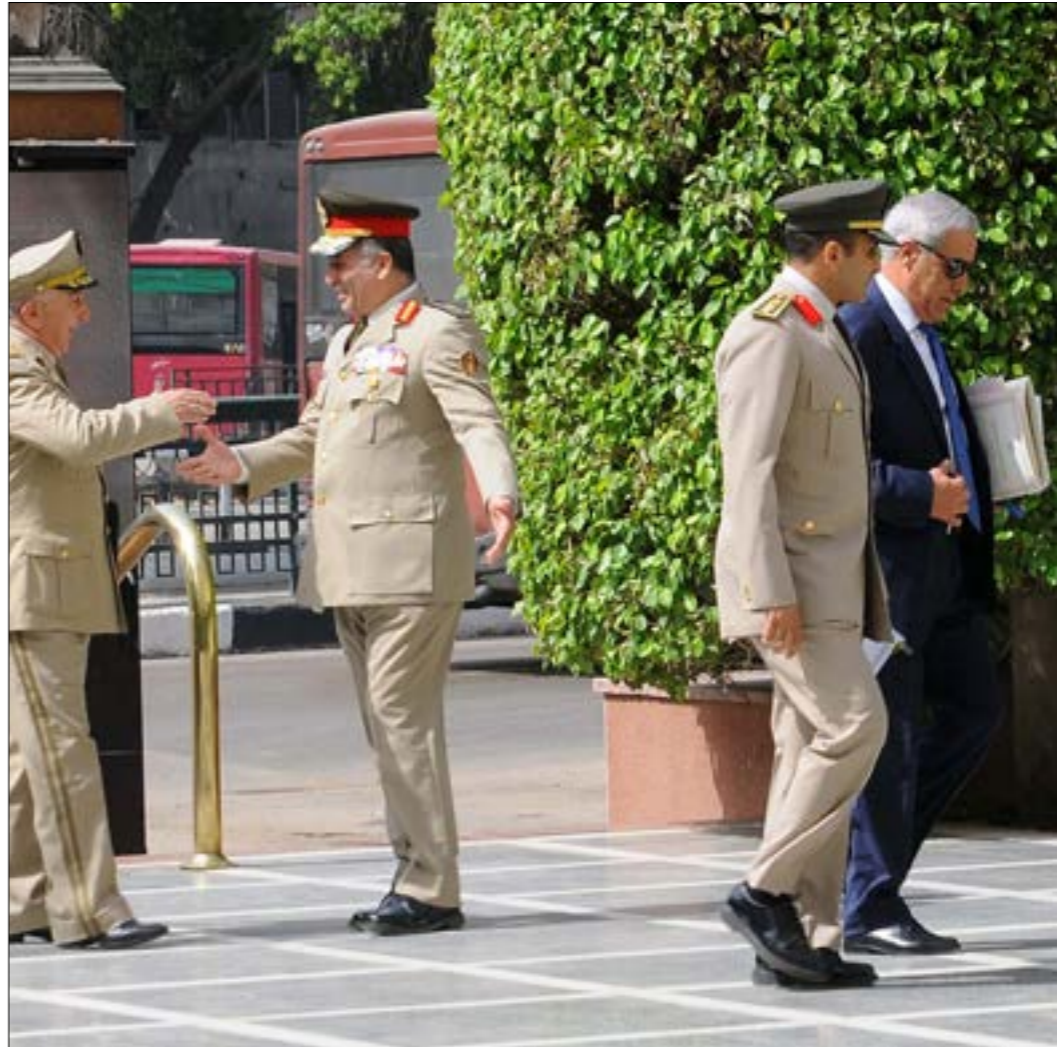
مصر عسكريون شاركوا في «حرب أكتوبر» من الحديث عن شعادتهم (أ ب ف ربه)

عدداً من قيادات تلك الحرب الذين لا يزالون على قيد الحياة من الظهور، على رغم أن أدوارهم لم يعرف عنها الكثير، وذلك كما يبدو لتجنب خلق أبطال جدد حتى إن كان هؤلاء يريدون أن يقولوا شهادة للتاريخ فقط في المقابل، اكتفت بإظهار الخبراء المتقاعدين الذين تقدمهم بوصفهم «خبراء استراتيجيين»