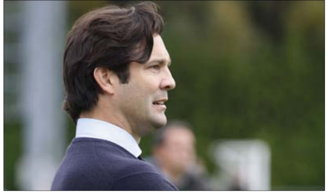
تموهذ جهور سولاري الى روزاريو وهي مسقط رأس ليونيل ميسي

بعد تردّي الفُتّاح أخيراً، أودت خماسيّة برشلونة في شبّاك الميرينغي بمنصب المدير الفني لريال مدريد جوليان لوبيتيجي، وذلك بعد عشر جولات من مداية الدوري الإسباني. في ظلّ التّرشّحات المتأددة عن تولّي المدير السابق لتشيبي انطونيو كونتي تدريب ريال، يبدو أنّ الأخير لم يتفق مع إدارة «الميرينغي»، فجاء سانتياغو سولاري ليصير على رأس الدفّة الفنيّة لريال مدريد، في محاولة لإصلاح مسار الفريق فيما تبقى من مباريات الموسم. ويتّفق «إينديكتو» إلى عاتلة كرويّة عربيّة. وبالفعل، كسب اللاعب لقبه من عمه، الذي يعني «الهندي الصغير» باللغة الإسبانيّة. لعبَ ارتبط بسولاري طوال مسيرته الكرويّة، على الرغم من كونه أرجنطينيّاً، يعدّ سولاري ابن إسبانيا، حيث لعب 7 سنوات بين أندية العاصمة. في 1998، انضمّ سولاري إلى صفوف أتليتيكو مدريد قانماً من فريق ريفر بلايت، وبعد عامين، انتقل اللاعب الأرجنطيني إلى الغريم الإسباني ريال مدريد حيث قضى معه 5 سنوات، لعب