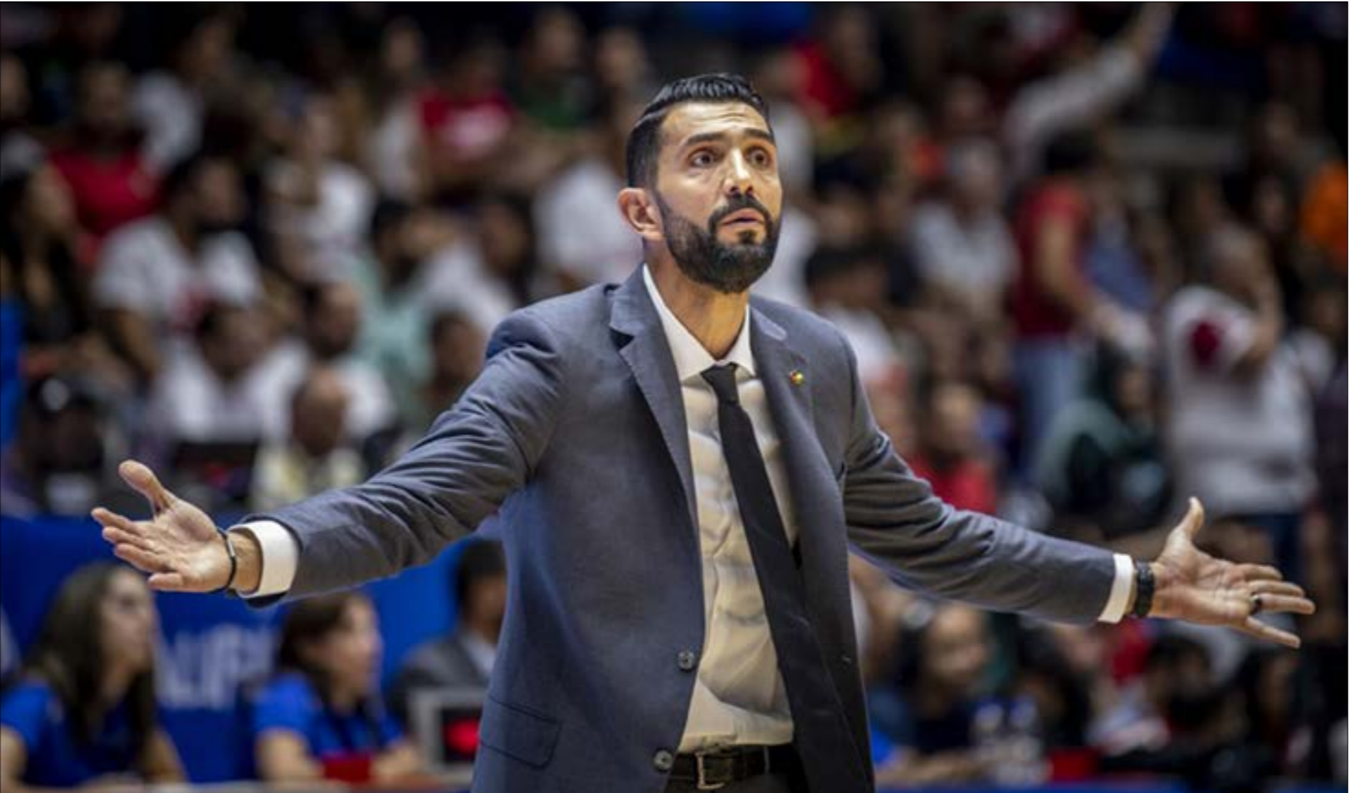
انهم دغلاس اتحاد السلة بالتقصير