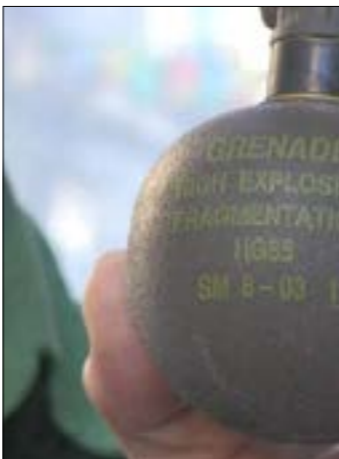
اظهرت وثائق قيام تاجر سلاح لبني بطرح فبايك سويسرا لبليمر عبر «فايسبوك»

مناطق سيطرة الفصائل المسلحة، على حد سواء. والافتات أن الوثيقة لا تتضمن أي