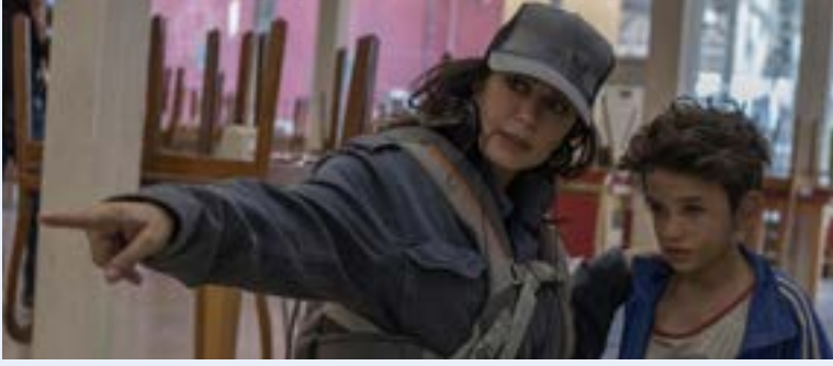
الافتتاح مع فيلم ناديت ليكي «كفرناحوم»

والهوية الجنسية والأسئلة الوجودية. وإلى جانب العروض السينمائية التي ستتوزع داخل المسابقات (جوائز أفضل فيلم روائي، وأفضل وثائقي، وأفضل فيلم تجريبي، وأفضل باكورة) وخارجها، ستقام أنشطة عدة تشمل برنامج Carte Blanche في «سينماتيك» المعهد الفرنسي في لبنان (طريق الشام)، حيث سيعرض فيلم الراحل يوسف شاهين «اليوم السادس» الذي خضع للترميم داخل المعهد. إضافة إلى برنامج خاص بالجمهور الأصغر. وهذا العام، يطلق المهرجان تعاوناً مع Films Femmes Fran-cophones Méditerranée هو عبارة عن إقامة فنية لتعلم كتابة السيناريو تتوجه حصراً إلى النساء الفرنكوفونيات اللواتي يعشن في حوض المتوسط. تهدف المبادرة إلى مواكبة المواهب، والترويج لمنطقة الشوف التي ستستضيف تصوير الأفلام الناتجة من المشروع خلال أسبوع كامل بدعم من المعهد الفرنسي في دير القمر. يذكر أن المهرجان - المعروف سابقاً باسم «Né à Beyrouth» الذي تنظمه شركة Bande à Part Productions منذ عام 2012 - يهدف إلى منح صنّاع الأفلام اللبنانيين منصة تمكنهم من عرض إنتاجاتهم، وتقديم الدعم المالي لتطوير مشاريعهم، إلى جانب توفير فرصة التفاعل مع الجمهور والتواصل مع الفاعلين والمبتدئين السينمائيين.