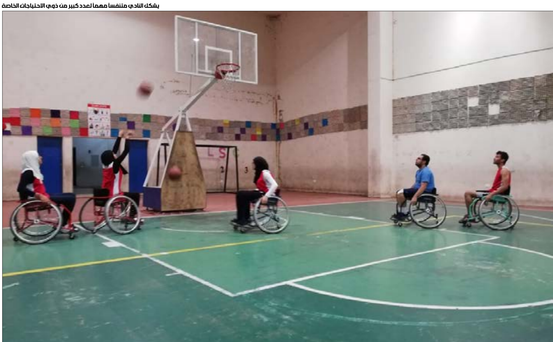
يشكل النادي متنفسا مهما لعدد كبير من ذوي الاحتياجات الخاصة

الجنوب، ولا نواصي ولا اهتمامات، بل أن هناك العديد من العراقيل أمام هذه المشاريع، تؤكد صباغ بأسف. يأمل المشرفون بأن يدفع هذا المشروع رياضة ذوي الاحتياجات الخاصة إلى آفاق جديدة، وهذا واقع أكثر صعوبة في الثانية.