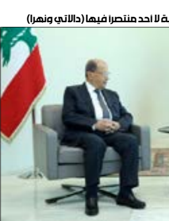
الحريري، قدمت لرئيس الجمهورية صيغة مبدئية لاحد منصفرا فيها (الداني ونهار)

حاجة إلى المزيد من الجهد والحدية في تقديم التنازلات للوصول إلى تشكيلة حكومية تحترم وحدة المعيار»، على حد تعبير مصادر متابعه، وقالت مصادر في القوات اللبنانية إنّ الرئيس المكلف سيلتقي في الساعات المقبلة وتفتح باب الإعلام ملحم رياشي مؤقداً من رئيس حزب «القوات» سمير ججع، لإطاعة على نتائج إجتماعه بكل من عون وباسيل، وأضافت أن الصيغة التي حملها الحريري إلى بعيدا «مهمورة بتوقيع بيت الوسط وعين التينة، وإذا تم التراجع عنها، لن تقبل القوات بأقل من حقيبة سيادية حتى تفتح باب التفاوض مجدداً»، وخصت بان من يراهن على أنّ «القوات» ستقبل في نهاية المطاف بشروط الآخرين «وأهم»، وحذرت من أنّ التعامل الحالي مع ملف التاليف المكلفي هدفه «إخراج رئيس الحكومة المكلف وصولاً إلى إخراجها». وأكد الحريري لدى مغادرته بعداء أن الصيغة «مبدئية ولا أحد منتصراً فيها على أحد». مشدداً على أنّ الصيغة لم تناقش مع أحد «ولا يملكها أحد إلا الرئيس عون وأنا».