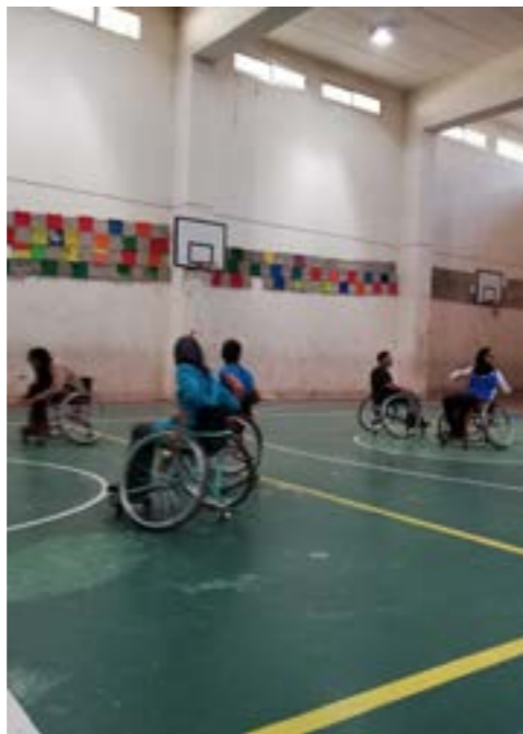
فريق ذوي الاحتياجات الخاصة يلعب كرة السلة في صيدا.

الجنوب، ولا نواصي ولا اهتمامات، بل أن هناك العديد من العراقيل أمام هذه المشاريع، تؤكد صباغ بأسف. يأمل المشرفون بأن يدفع هذا المشروع رياضة ذوي الاحتياجات الخاصة إلى آفاق جديدة، وهذا واقع أكثر صعوبة في الثانية.