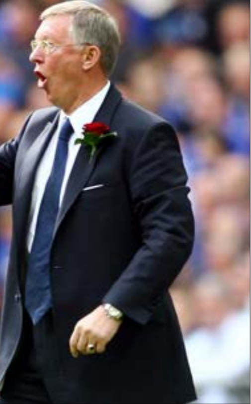
تنحسر جماهير مانشستر على أيام السير اليكس فيرغسون

حقة اليونايثد مع المدرب دايفيد مويس كان عنوانها الفشل. غيّن مويس مدرباً لمانشستر يونايتد