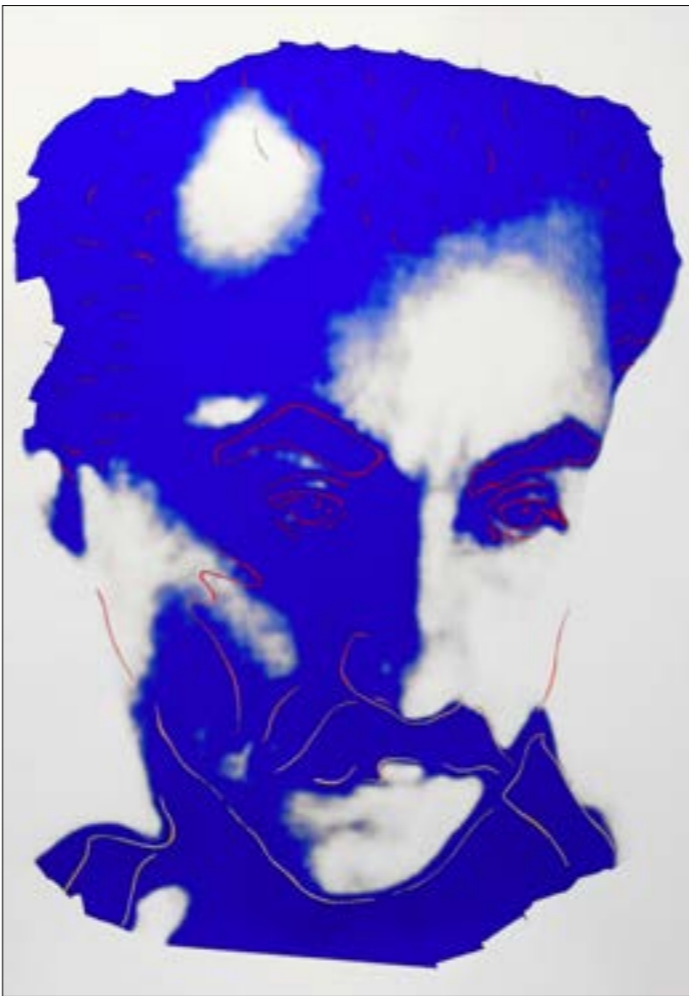
«جبران، للوديع ابي اللم (صباح واكريليك على ورق - 2012)

اللوم - يقع على عاتق الفنانين العرب الذين شاركوا في المعرض بأعمال لا شك في أن معظمها على الأقل محترف من ناحية لغة الفن البصريّة، لكنها افتقدت الشجاعة لتطرح أسئلة لجبران تخرجها من سجنه الرمادي الذي توافق صناع الثقافة البرجوازية على إيداعه فيه منذ ما يقرب من ثمانين عاماً، لم نر عملاً واحداً في المعرض، يحكي جبران الفقير نتاج المجتمع العربي المعثمن المائس في نهاية القرن التاسع عشر، أو جبران اليتيم الذي فقد أماً عنيدة مناضلة صارعت الذكورية والغفر والجغرافيا في قلب جبران الإنسان والرجل المعثمن المائس في نهاية القرن التاسع عشر، أو جبران اليتيم الذي كان يقلته هم نهضة الأثة السورية قبل أن يكون هناك لبنان كما نعرفه اليوم -، أو جبران المنغمس في ملذات المشروبات وتعدد العلاقات الغرامية، أو جبران العاشق للعبوب الذي أحرق قلب مّي زيادة، أو جبران المسافر الرحالة الذي تنقل بين