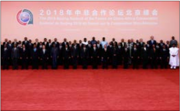
افتتح الرئيس الصيني القمة بحضور عمليتيان و53 رئيسا أفريقيا

انطلقت امس القمة الصينية - الأفريقية السابعة، في ظل اهتمام صيني بالمر بتعزيز حضور بكين في القارة السمراء، وهو ما بات يثير قلقاً متزايداً لدى الغرب