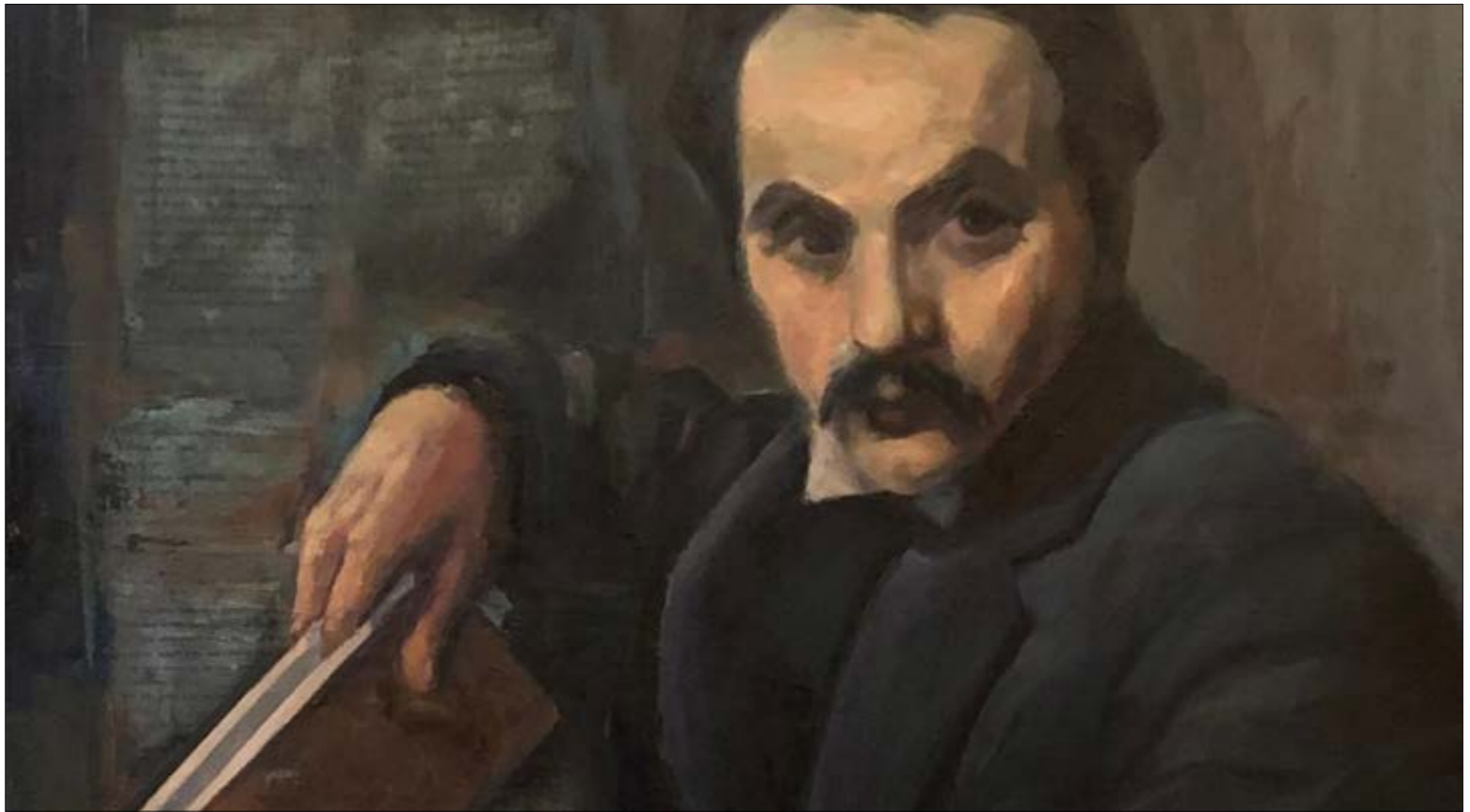
«جبران» لبييم فتحي (زينت على كانفاس - 2018 . تصفيح)

معرض لندني في صالة نخوية للمتاجرة بالفنون، يعرض للبييم أعمالاً تشكيلية عربية تنتمي إلى مدارس وتيارات شتى، لكن جها يستلهم شخصية الأديب اللبناني كما عرضها في الخرافة المتداولة