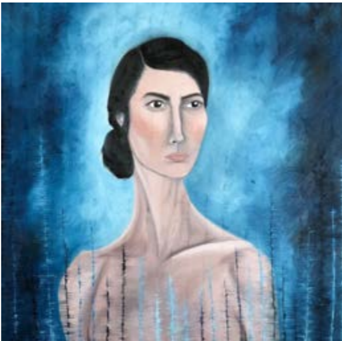
«بعثت أصعب، للولوة الك خليفه (زينت على كانفاس - 2018)