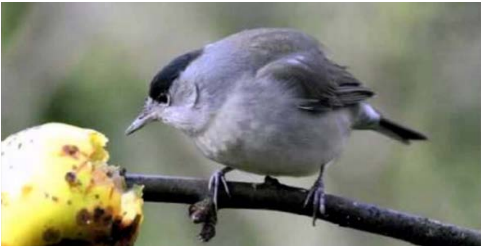
في بلدة 32 نوعاً من التبان بعضها نادر وجميعها تتغذى على الحشرات