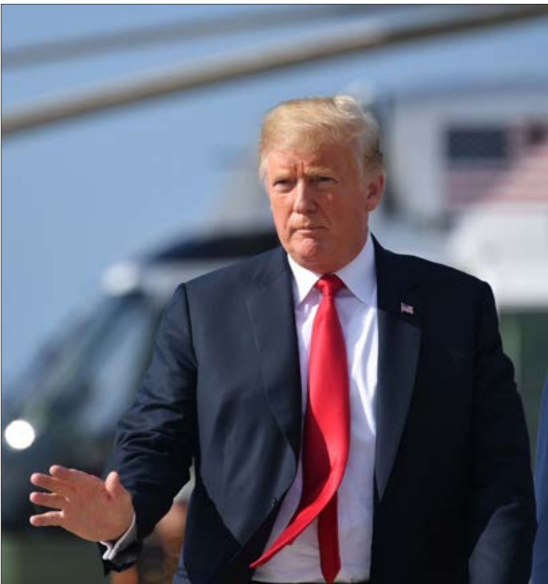
مراكز صنم الفرار في واشنطن لا تزال مصرة على إعادة بسط سيطرتها على منطقتنا

يُقدِّم تقرير ارسله البنتاغون للكونغرس الأميركي في شهر تموز/ يوليو الماضي إيضاحات إضافية لطبيعة الاستراتيجية الأميركية المعتمدة ضد إيران. إدارة الرئيس الأميركي دونالد ترامب، التي رضعت العداء لطهران إلى مصافح الأيديولوجيا، وباتت سياساتها ترجمة عملية لذلك، فانسحبت من الانتظار النووي، ووضعت في تشديد العقوبات على إيران وفي اتباع عقوبات جديدة على الدول والجهات المستعدة لشراء متجاراتها النفطية، في خطوة لا سابق لها في تاريخ العلاقات الدولية المعاصرة، فزرت رضع مستويها المواجهة إلى درجة اعلمه