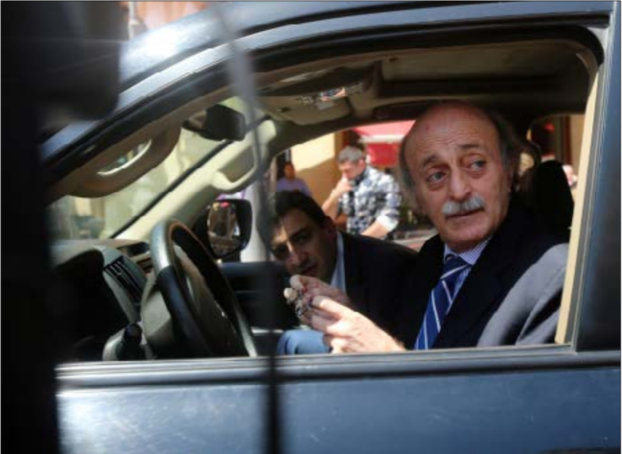
تلتق جنبلاط معيار الحريري وباسيل في الوزرير بجمله يصر على المقاعد الثلاثة (مروان بوخدر)

التأفذين الفكرة على أن الزعيم الدرزي - الذي لا يزال بمسك بزمام قرار الطائفة فيما لا يعود خلفه نجله رئيس الكتلة النيابية فحسب - يقدم بنفسه حلّاً لعقدته: مقايضة المقعد الدرزي الثالث من دون دهايه حتماً إلى النائب طلال