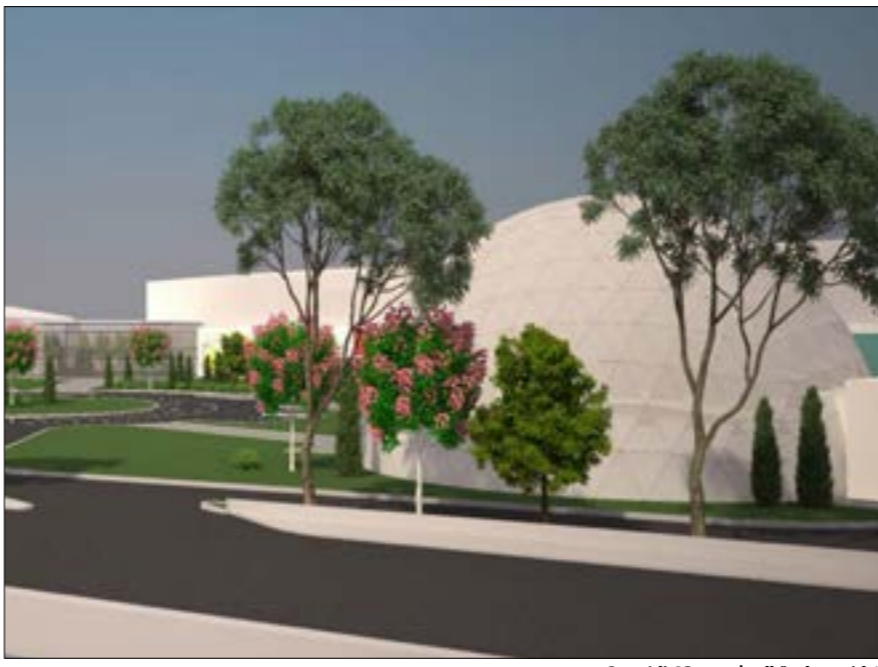
تبلغ مساحة المشورم 43 ألف م2

يعرف بالكلاستر إضافة إلى ملاعب ومركز ترفيه للأطفال يحوي العالياً وأحدث التقنيات، والمرحلة الثالثة والأخيرة ستشمل بناء مبنى مؤلف من 10 طوابق مخصّص للمكاتب والأعمال ويفترض أن تنتهي خلال سنتين إلى 3 سنوات.