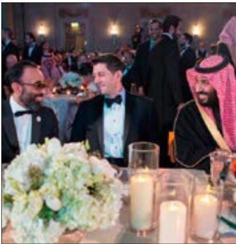
ابن سلمان أثناء حضوره حفلا غاليا في واشنطن

«الوهابية»، ويردّ عليه بجواب يستخطن اعترافاً بأن الوهابية «تهمنة»، المواقف السعودية، طوال العقود الماضية، بما فيها تصريحات الملك سلمان، لم تحد عن تعجيب «الشيخ المجدد» محمد بن عبد الوهاب، والتفاخر بأفكاره التي ترعاها المملكة، والتوعد بصونها والتشهير بها، فضلاً عن أن المناهج التعليمية، الأكاديمية منها والدينية، تكزّر الطريقة التكفيرية لابن عبد الوهاب كعقيدة تقوم عليها «مملكة التوحيد».