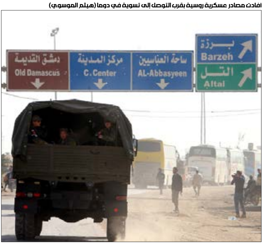
اغادته معادار عسكرية روسية قرب المنطقة التي تسوية في دوما

بوتين، وبحثا تطورات الوضع في سوريا، وصل وزير الخارجية السوري وليد المعلم إلى سلطنة عمان، حيث التقى هناك نظيره