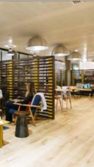
توفر هذه المكاتب كل الخدمات من كهرباء وسرعة إنترنت هم إمكان الاستعانة بالمساعدة الإدارية

فازت شركة أربيا بجائزة Best Advancement in Migration to Contactless خلال الدورة الثانية من ملتقى ماستركارد للريادة في منطقة الشرق الأوسط وشمال أفريقيا الذي أجرى في باريس، فرنسا من 4 إلى 7 آذار 2018 والذي استضافته شركة ماستركارد العالمية، بحضور عدد كبير من مديري المصارف الرائدة في المنطقة. مُنحت أربيا هذه الجائزة تقديراً لجهودها في تطوير وتشغيل مجموعة واسعة من حلول الدفع بدون لمس، بما فيها البطاقات