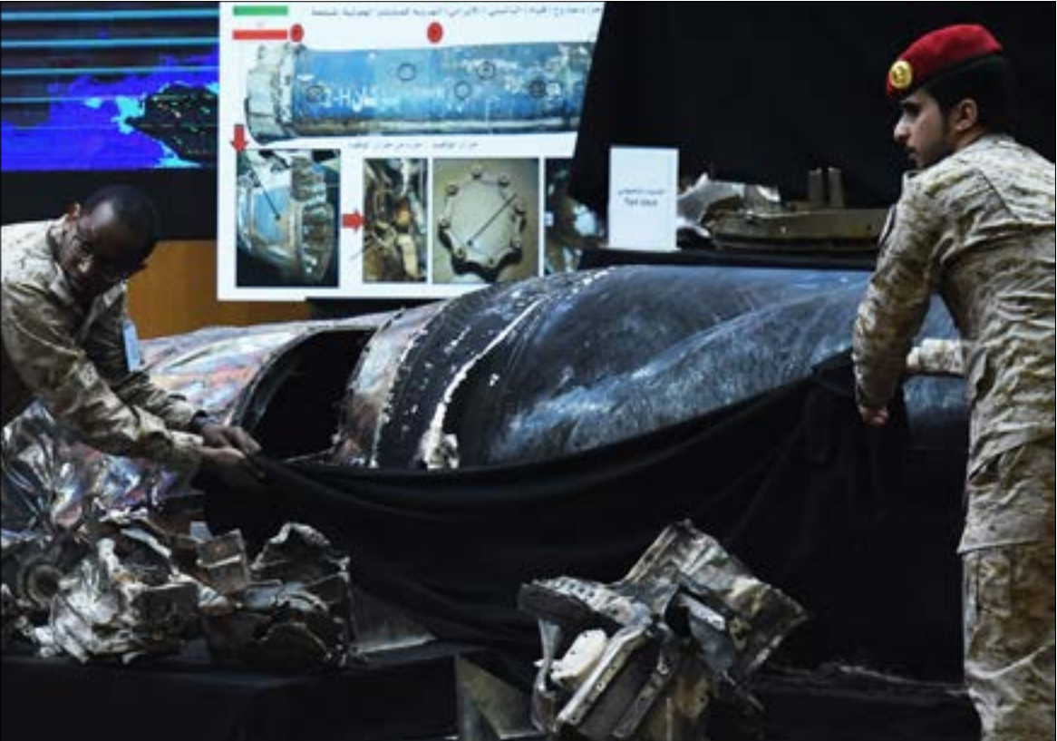
عرض المالكي بقايا مها سقاهما صواريخ إيرانية، (أ ف ب)

سكربيون اميركيون وغيرهم في أن يكون «باتريوت» السعودية قد أفح في اعتراض صواريخ «أنصار الله» وتدميرها، منتهين سلطات الملطة بالكذب في هذا الشأن، تُعزِّز الاحتمال الأول. وما يقوّي الرواية المناقبة لادعاءات السلطات السعودية، كذلك، المرة على الشكل التالي: اعتراض 3 صواريخ شمال شرقي الرياض، وصاروخ أطلق باتجاه خميس مشيط، وآخر باتجاه نجران، واثنين باتجاه جيزان، وتدميرها، وفق ما