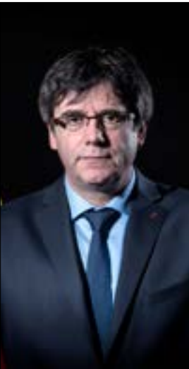
(أ ف ب)

سيفي رئيس كاتالونيا المقال كارليس بوتشيمون (الصورة)، في الحجز الاحترازي في ألمانيا للمدة التي تحتاجها المحكمة لتقرر بشأن تسليمه لإسبانيا التي تتهمه بـ«التمرد»، وفق ما أكدت المحكمة المختصة أمس. وقالت «محكمة كيبيل» في شمال ألمانيا حيث أوقف أول من أمس، إنّه سيبقى موقوفاً إلى حين اتخاذ قرار بشأن إجراء التسليم، موضحة أن القرار غير قابل للاستئناف. وأدى توقيف بوتشيمون المفاجئ إلى حصول صدامات بين ناشطين كاتالونيين يطالبون بالاستقلال والشرطة الأحد في برشلونه، ولكن لم يسجل تحرك يذكر أمس.