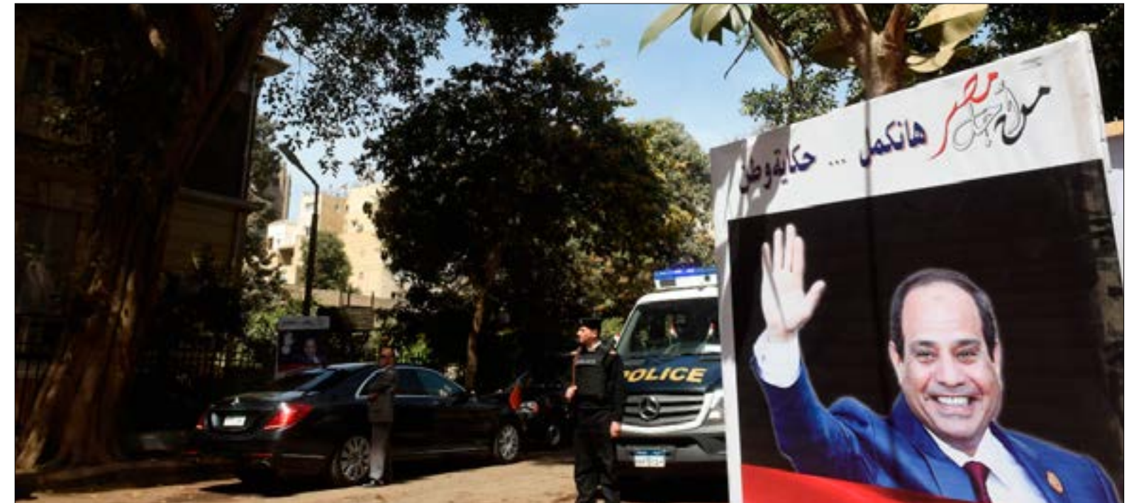
تبدو القاهرة مشغولة بحدث آخر غير «الانتخابات» (إف ب) |