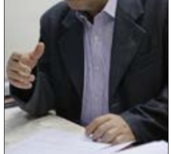
يتفهم أبو جعفر الجو الاعتراضي في البقاع الغربي (مروان بو حيدر)

محمد نصرالله في الحركة، ولا يزال متفرغاً حتى يومنا هذا. باختصار، كانت «أمل» وظيفته الوحيدة طوال حياته المهنية - الحزبية. تنقل في مناصب عدة، كان أولها مسؤول منطقة بئر العبد، قبل أن يرأس إقليم بيروت لعشر سنوات. بعدها تسلم مسؤولية المكتب التربوي المركزي، ثم المكتب الثقافي المركزي، وصولاً إلى رئاسة الهيئة التنفيذية، في عام 2006، وهو المنصب الذي لا يزال يشغله حتى اليوم، فضلاً عن عضويته في المكتب السياسي للحركة منذ عام 1983، ولاحقاً هيئة الرئاسة.