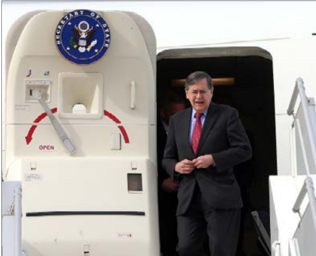
ساترفيلد لخبراء لبنانيين: البلوك رقم 9 ليس ملك لبنان

مع عودته إلى بيروت، التقى مساعد وزير الخارجية الأميركية ديفيد ساترفيلد، أمس، كلاً من رئيس الحكومة سعد الحريري ووزير الخارجية جبران باسيل وقائد الجيش جوزف عون، على أن يلتقي، اليوم، الرئيس نبيه بري قبل أن يقرر ما إذا كان سيعود مجدداً إلى فلسطين المحتلة. ولوحظ أن المدير العام للأمن العام، اللواء عباس إبراهيم، الذي شارك في لقاء ساترفيلد، قائد الجيش، انتقل من وزارة الدفاع إلى عين التينة، حيث وضع بري في أجواء اللقاء مع الموقف الأميركي.