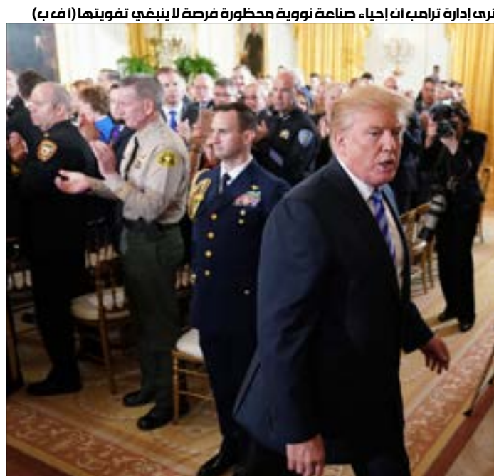
ترى إدارة ترامب أن إحياء صناعة نووية محظورة فرصة لا ينبغي تفويتها

«المعيار الذهبي» غير أن توسع انتشار التكنولوجيا النووية في المنطقة قد بدأ بالتحقق فعلاً؛ إذ إن دولة الإمارات بدأت عملياً بناء أول مفاعل نووي من المقرر تشغيله هذا العام، فيما وقعت شركة