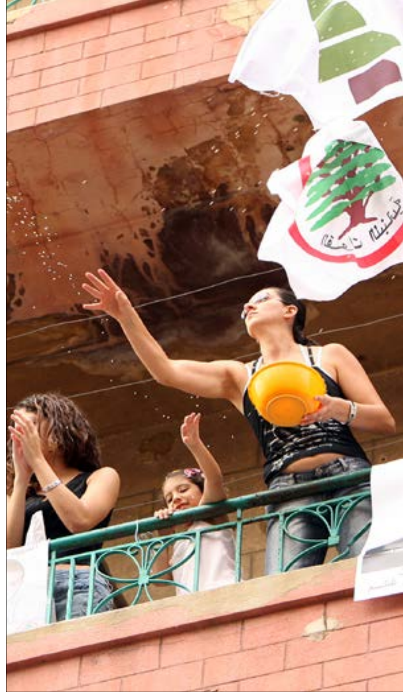
ماذا لو نجحت المفاوضات الجارية حالياً بين القوات والكتائب لخوض الانتخابات بلوائح مشتركة؟ (أرشيف)

على كل مرشح، ولا سيما النواب الحاليين منهم، بذل جهود مضاعفة لا تشبه تلك التي سادت زمن النظام الاكثري واللوائح الحزبية الصافية. لكل نائب ومرشح اليوم استحقاقه الخاص، وهذه ليست مهمة سهلة، لا سيما أن عناصر القوة الأساسية تبدو محصورة في كيفية تأمين المال الانتخابي، ووجود ممولين كبار على اللوائح، لتغطية كلفة الحملات الاعلامية والاعلانية المرتفعة الثمن، وباتت مطروحة في التداول، بعدما حجزت قوى سياسية مكاناً لها في هذه الحملات.