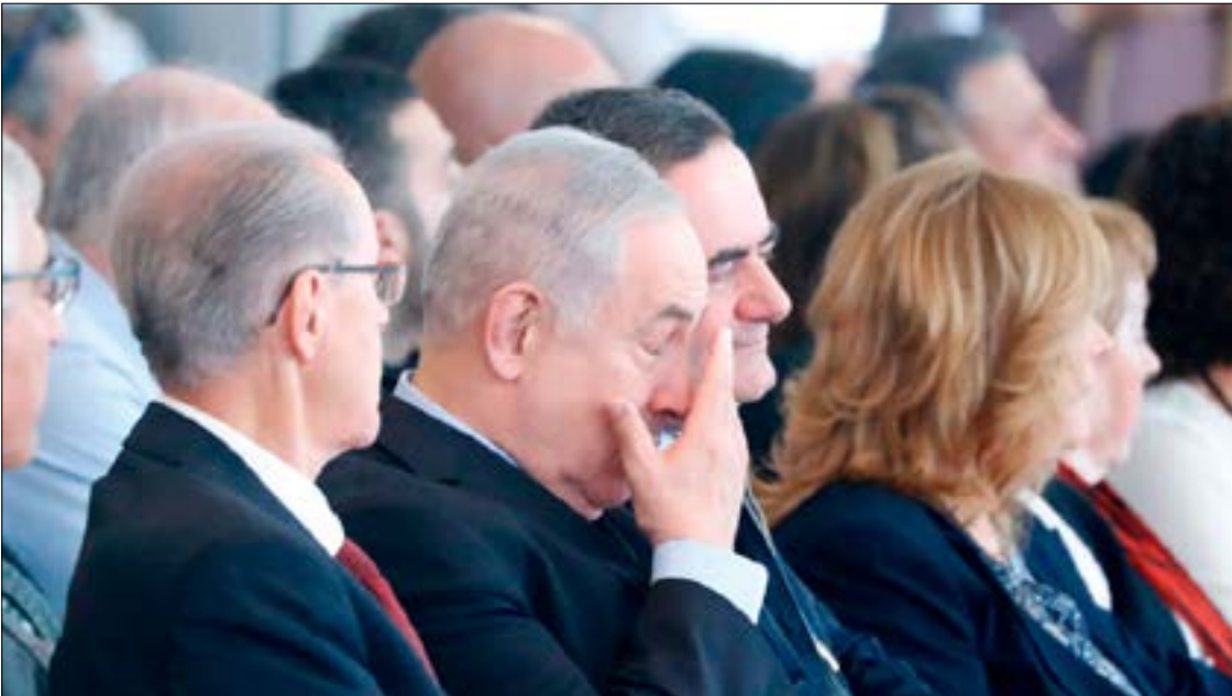
بمجرد توقيع حافظ اسرار ننتياهو اتفاق «شاهد ملك» تدرجت كرة الثلج في حياته

الخارجية الأميركية قد ركز انتقاداته على روسيا، مطالباً إياها بـ«أن تنهي دعمها لنظام الأسد وحلفائه». غير أن الكرملن اعتبر تحميل بلاده مسؤولية مقتل مدنيين في الغوطة «اتهامات لا أساس لها من الصحة». أما في الشمال، فقد دخلت دفعة جديدة من «القوات الشعبية»