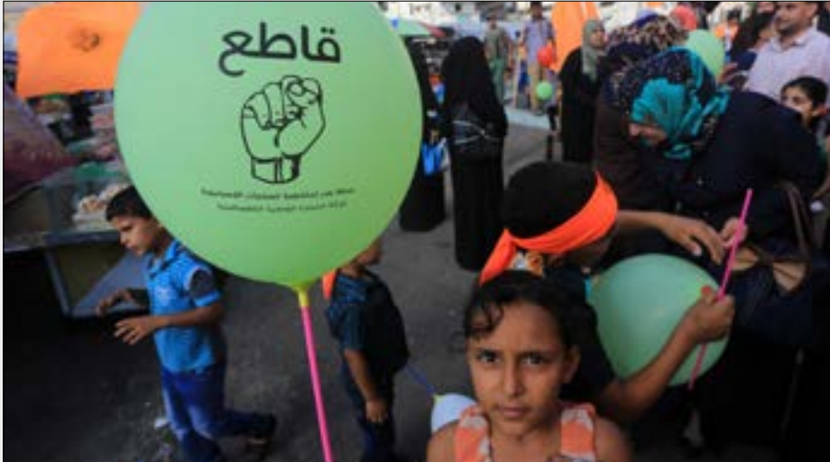
حققت حركة المقاطعة إنجازات مهمة على الصعيد الرسمي والمجتمع المدني الدولي

تأسيساً على ما عرضناه، نشير إلى أن ضمان الأكراد حقوقهم السياسية والثقافية والمدنية يستوجب وضعها في سياق وطني ديموقراطي، ما يعني التنسيق مع القوى السياسية السورية ومكونات المجتمع السوري لتشكيل رؤية سياسية وطنية ديموقراطية تقود إلى تمكين دولة المواطنة، وتؤسس لنموذج حكم برلماني لا مركزي يعزز تداول السلطة والتشاركية السياسية والفصل بين السلطات، ويحافظ على تماسك كيانية الدولة السورية والاستقرار والتماسك المجتمعي، أي تخطي إشكالية تسييس التمثيل الأقليوي الإثني الطائفي والمذهبي في سياق بناء هوية سورية جامعة، وإلا فستكون جميعاً أمام مخاطر كارثية لن تنحصر في موجات التدخلات والاحتلالات الخارجية.