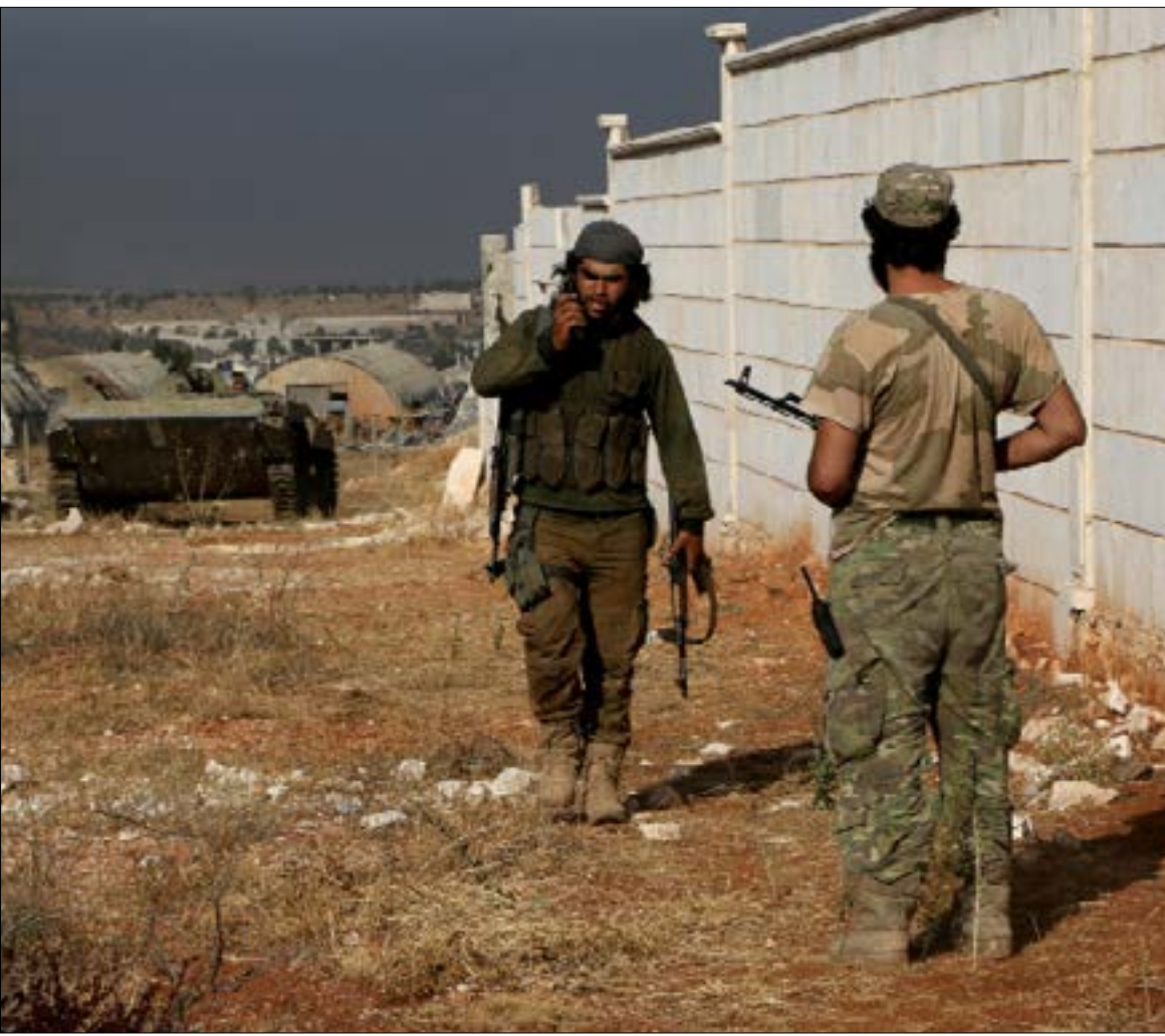
اندلعت امس اشتباكات عنيفة بين «تحرير سوريا» و«النصرة» في عدد من مناطق إدلب

الأميركية. وعلى امتداد ثلاثة أعوام نشط التعاون في مجال التسلح بين «النصرة» و«الزنكي»، لتلعب الأخيرة دوراً أساسياً في نقل السلاح الأميركي إلى جماعة أبو محمد الجولاني عبر صفقات بيع منكرة. في مطلع العام 2017 حققت العلاقة بين الطرفين قفزة إلى الأمام مع الإعلان عن تشكيل «هيئة تحرير الشام» بالشراكة بينهما وبين مجموعات أخرى على رأسها «حركة أحرار الشام الإسلامية». لكنّ الخلاف الذي تجدد بين «الأحرار» و«النصرة» في تموز من العام نفسه دفع «الزنكي» إلى الانشقاق عن «الهيئة»، وفتح أبواب التنسيق بينها وبين «الأحرار» خلف الكواليس. بدورها، خرجت «حركة أحرار الشام» من آخر معاركها مع «النصرة» مستنزفة وخاسرة لكثير من مناطق نفوذها و«ماء وجهها». وثمة مؤشرات كثيرة تدلّ على أن تشكيل «جبهة تحرير سوريا» إنما جاء في الدرجة الأولى بهدف وضع حدّ لهيمنة «النصرة» و«تنمّرها». وإذا كان دافع «الأحرار» الأوّل هو الثأر من الجولاني وجماعته، فإنّ الأمر مرتبط في حسابات «الزنكي» باقتناص الفرصة لفرض نفسها رقماً صعباً جديداً في خارطة المجموعات المسلحة. وعُرفت «الزنكي» منذ نشأتها عام