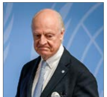
المجتمعون أعطوا أنفسهم مهلة عام لتنفيذ الخطة الأميركية

الاجتماع الأول لمجموعة العمل الأميركية المصغرة حول سوريا بعد مباركة الرئيس دونالد ترامب لوجود مدير القوات الأميركية في هذا البلد. اتفق على توفير دعم فوري لسيفان دي ميستورا لموازنة الجهود الروسية، وإعادة تفعيل مسار جنيف بنيويا، بإعادة التفاوض في القضايا الإنسانية، والسجناء... ستقدم المجموعة المصغرة اقتراحات بشأن الدستور السوري والانتخابات، وإفهام روسيا ما هو منتظر من التزامات من قبل (الرئيس بشار) الأسد في الجولة المقبلة للمفاوضات التي ستعقد في فيينا في السادس والعشرين من كانون الثاني. سيلتقي الوزراء على الاجتماع في باريس في الثالث والعشرين من شهر كانون الثاني، للاتفاق على هذه المقاربة ورمي القفاز في وجه الروس. وسيلقي تيلرسون خطاباً أساسياً حول سوريا الأسبوع المقبل.