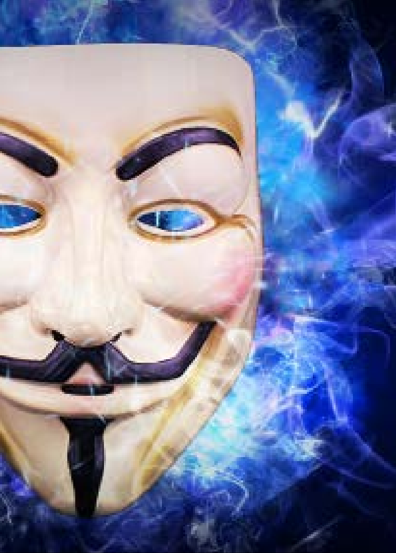
ابرز مجتمعات الهاكتيفيزم المعروفة منظمة «أنونيموس» «ويكيبيديا»