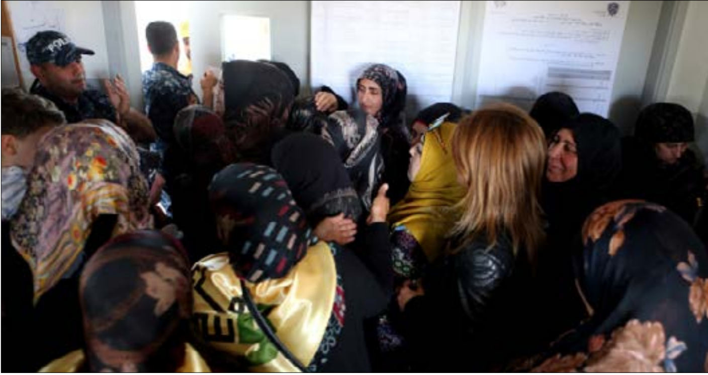
على حزب الله أن يزيت بميزات الذهب توزيم الأصوات التفضيلية بين مرشحيه ومرشحي الحلفاء (هيلم الموسوي)

بينما يستعد حزب الله لإطلاق ماكينته الانتخابية يوم غد الجمعة، في احتفال يقيم في بعليكَ، لا تزال صورة التحالفات في البقاع الشمالي ضبابية، وكذلك أسماء المرشحين المناهضين للأحقة ثنائي حزب الله - حركة أمل، التي لم تحسم بعد