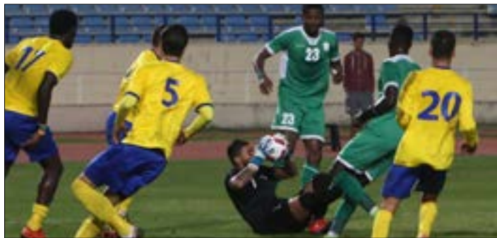
فاز الصفاء على الأناصار ذهاباً 3-1 (مروان طحطم)

يُستكمل اليوم الأسبوع الثامن عشر من الدوري اللبناني لكرة القدم بلقاء وحيد يجمع الصفاء مع ضيفه الأناصار عند الساعة 14,40 على ملعب بحمدون. لقاء يأتي مبكراً لارتباط الأناصاريين بمباراة صعبة في مسابقة كأس الاتحاد الآسيوي الثلاثاء المقبل مع فريق الفيصلي الأردني ضمن المجموعة الثالثة على ملعب المدينة الرياضية عند الساعة 15,00.