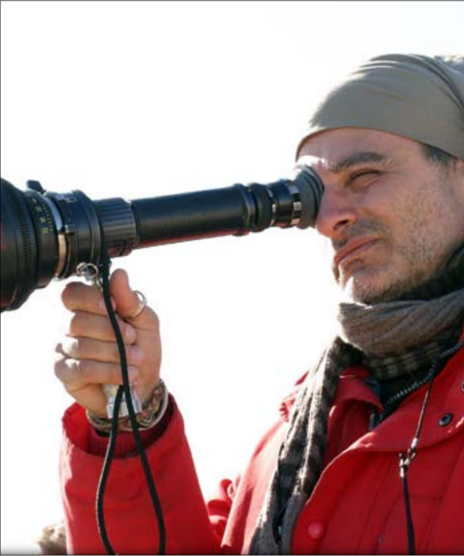
ذروة الفيلم وما أراد دوبري إبرازه تحميل الفلسطينيين المسؤولية عن الحرب الأهلية

التوطين، وكلها أسباب مختلفة لنشر الخوف بين جماهير القوى الفاشية وتبرير الحل العسكري. والواقع غير ذلك؛ فهدف الثورة الفلسطينية الوحيد كان تحرير فلسطين ولا ترضى بالملق باي وطن بديل. وكانت الاستراتيجية المعلنة أن الثورة ضرورية وبحاجة إلى قاعدة آمنة. فالكيان الصهيوني يهدد كافة الدول العربية وخاصة دول الطوق، وتحرير فلسطين واجب قومي، وعلينا رفض نتائج معاهدة سايكس، بيكو الهادفة إلى ترسيخ الوجود الاستعماري في المنطقة وسلب سيادتها وثروتها.