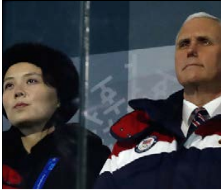
مايك بنس وكيم جونج أون خلال افتتاح الأولمبياد

أعلن مسؤولون أميركيون أنه كان من المقرر خلال وجود مايك بنس في حفل افتتاح الأولمبياد في كوريا الجنوبية أن يجتمع مع مسؤولين من كوريا الشمالية بينهم شقيقة الزعيم كيم جونج أون. لكن الكوريين الشماليين ألغوا الاجتماع في اللحظة الأخيرة