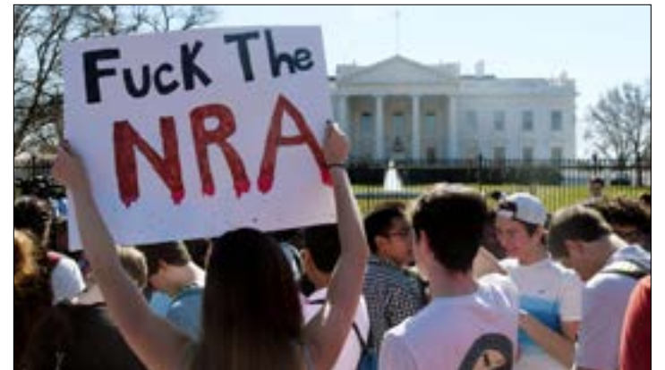
طلاب مدرسة فلوريدا امام البيت الأبيض امس