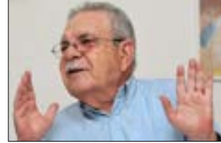
الثقافة والفنون في زمن عبد الناصر