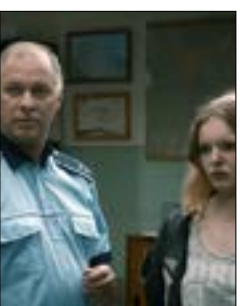
«بكالوريا»، لكريستيان مونغيو 19:30، س: 1/30