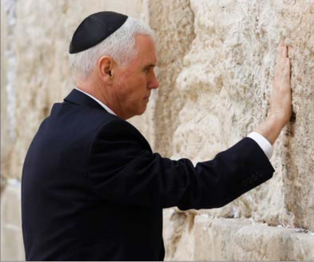
أتم بنس البروتوكول نفسه الذي يتبعه الرؤساء والمسؤولون الأميركيون خلال زيارة البراف

الحديث معه عن سوريا وغزة، وفق الإعلام الإسرائيلي. كذلك أعاد نائب ترامب تكرار أن «إعلان القدس عاصمة لإسرائيل سيساهم بلا شك في التأسيس لمرحلة جديدة وسيساعد في بلورة اتفاقية سلام قابل للحياة». خلال زيارة بنس، تحولت مدينة القدس المحتلة إلى أشبه بـ«ثكنة عسكرية»، بعد نشر العدو الآلاف من عناصر الشرطة والقوات الخاصة و«حرس الحدود»، في أنحاء المدينة، ونصب الحواجز العسكرية، وسير الدوريات الراجلة والمحمولة. كذلك كثفت شرطة الاحتلال انتشارها في محيط القدس القديمة، وتحديدًا في المنطقة الممتدة من باب العمود، مروراً بشوارع السلطان سليمان وباب الساهرة وشارع صلاح الدين، وصولاً إلى شارع الرشيد والزهراف قبالة سور القدس التاريخي. في المقابل، شهدت القدس، ومدن فلسطينية أخرى، إضراباً شمل مناحي الحياة التجارية والتعليمية والنقل العام. كذلك، اندلعت مواجهات بين عشرات الشبان وقوات الاحتلال على المدخل الشمالي لمدينة البيرة، وأيضاً في بلدة سعير في الخليل، جنوبي الضفة المحتلة. وجاءت المواجهات في البيرة عقب مسيرة نظمها حركة «فتح» رفضاً لزيارة بنس.