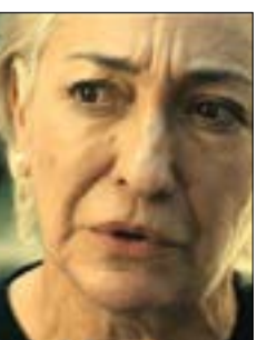
«العروس»، لباولا أورتيز 22:15، س: 2/3 و 20:00، س: 1/29

يوجه المهرجان تحية إلى المخرج اللبناني الراحل جان شمعون عبر استعادة «طيف المدينة» (105 د. 2000). بعد مجموعة من الأفلام التسجيلية، بعضها بالتعاون مع رفيقة دربه مي المصري، لم يتعد فيلمه الروائي عن مناخات الحرب الأهلية اللبنانية. يدور العمل حول الطفل رامي الذي ينزح مع عائلته من الجنوب اللبناني إلى بيروت هرباً من العدوان الإسرائيلي. ليكون شاهداً على انهيار أحلام فريدة وجماعية في العاصمة اللبنانية.