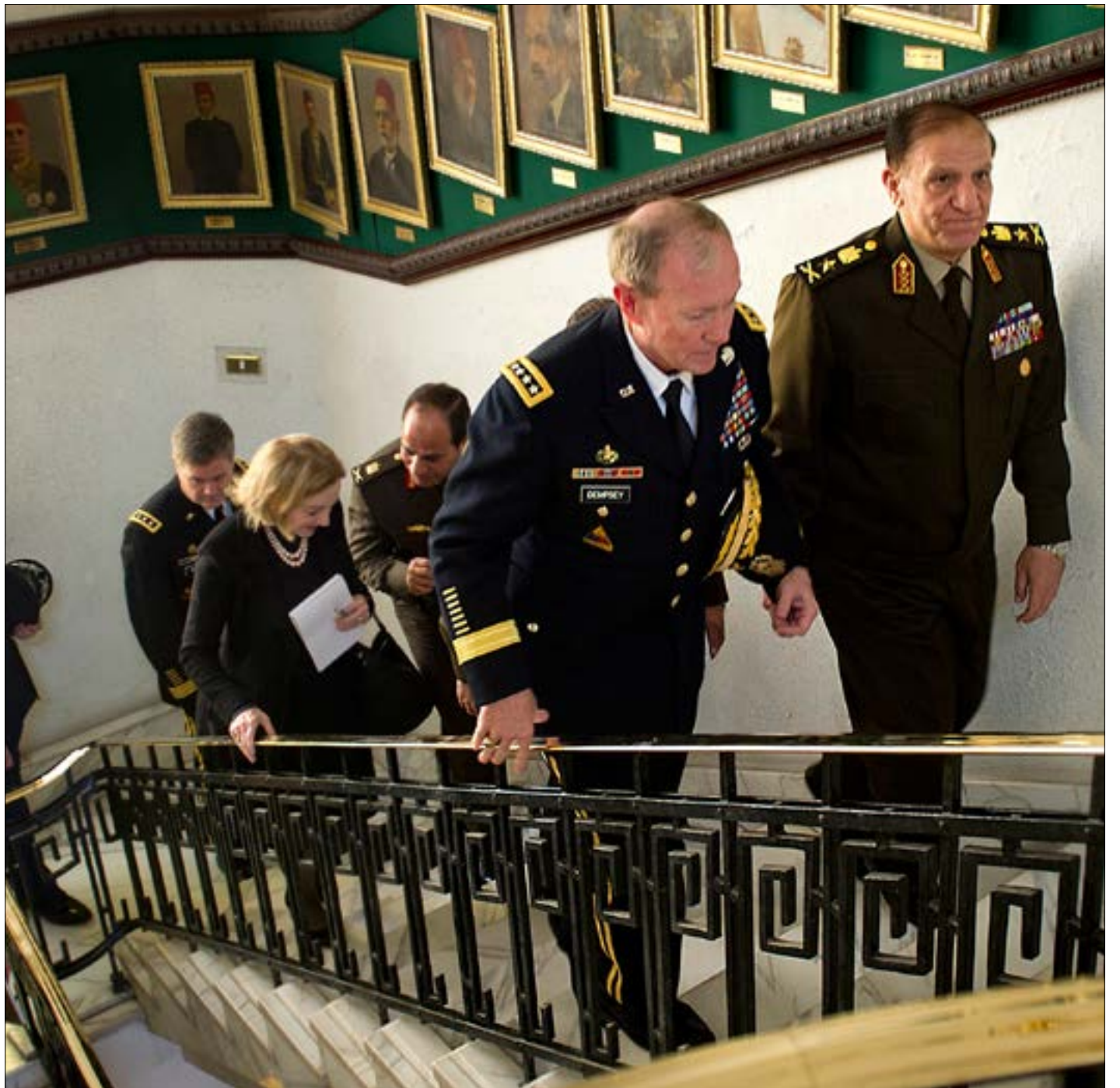
تولاه عنان منصب رئيس الأركان لعدة سيم سنوات

وبينما كانت الشاشات التلفزيونية في مصر تنقل بيان القيادة العامة، توجهت قوة من الشرطة العسكرية إلى منزل رئيس الأركان الأسبق لإلقاء القبض عليه، ونقله للتحقيق معه أمام القضاء العسكري الذي أصدر قراراً بحظر النشر في تفاصيل القضية المنظورة أمامه، مع الاكتفاء بما يصدر من بيانات رسمية حول هذا الشأن، وهي خطوة كانت متوقعة في ظل توقعات بصدور قرارات حبس على ذمة التحقيقات حتى إشعار آخر. ووضِع عنان قيد التحفظ لعدة ساعات في منزله، قبل اصطحابه إلى إحدى جهات التحقيق، فيما أُلقي القبض على عدد من مؤيديه، من دون