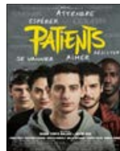
«مرضى» لفايان مارسو ومهدي إدير 20.00، س. 1/30 و 22.15، س. 1/26