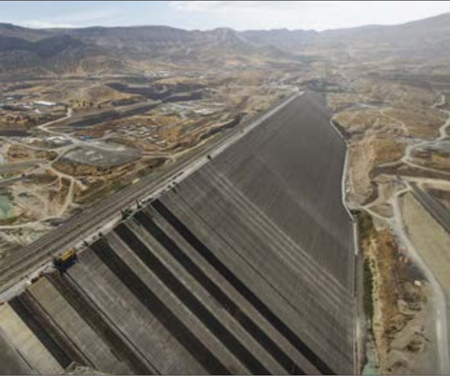
اقتراب موعد ملء، أنقرة سدھا الجديد العملاق «اليسو»

5- قال الوزير: «قدّم الرئيس التركي رجب طيب إردوغان تأكيدات لرئيس الوزراء العراقي الدكتور حيدر عبادي، خلال زيارته إلى أنقرة في تشرين الأول/ أكتوبر 2017، بأن أي ضرر لن يلحق بالعراق عندما تبدأ تركيا بملء السد في آذار/ مارس 2018. وهذا التزام كبير، ونحن نعتقد أن أفضل طريقة لترجمتها إلى واقع هي إعادة جدولة ملء السد ليبدأ في حزيران/ يونيو 2018، مما يسمح للعراق بتخزين ما يكفي من المياه في خلال موسم الصيف القادم، والذي عادة ما يكون فترة من الحد الأقصى للمطلب في