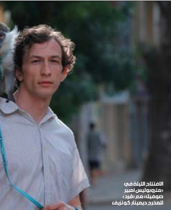
الافتتاح الليلة في «مهرجانبوليس امبير صوفيك» هم «فرد» للمخرج ديميتار كوزيف