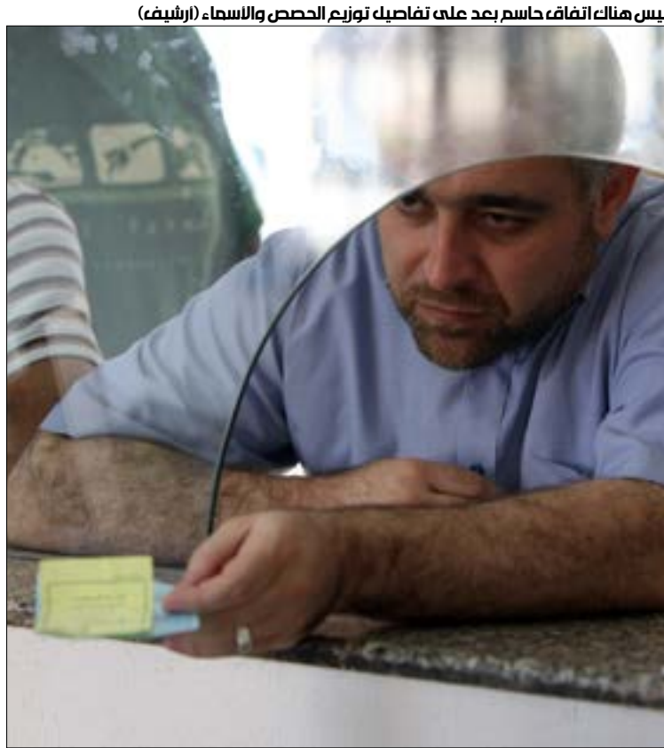
ليس هناك اتفاق حاسم بعد على تفاصيله الحصى والأسماء