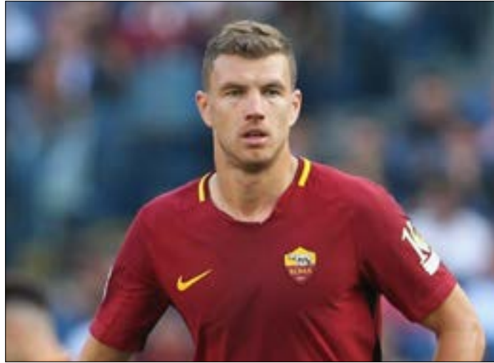
يريد تشلسي تعزيز هجومه بضم دزيكو من روما (اليسيف)

بعد روس باركلي في بداية سوق الانتقالات الشتوية الحالية، يستعد تشلسي الإنجليزي لإنجاز تعاقدين جديدين من روما الإيطالي تحديداً مقابل 60 مليون يورو، بحسب صحيفة "ذا دايلي ميرور" الإنكليزية، التي ذكرت أن "البلوز" يريد إعادة الجوسني إيدين دزيكو إلى إنكلترا بعدما لعب في مانشستر سيتي وذلك لتعزيز خط هجومه.