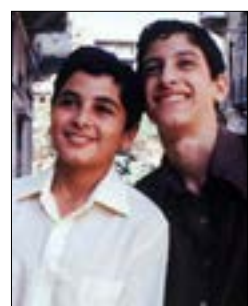
«طيف المدينة»، لجان شمعون 20:00، س: 1/26

«كارل ماركس شاباً»: 27/1 - س: 22:15 و 29/1 - س: 20:00