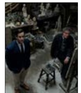
«البورتريه الأخير» لستانلي توتشي 22.15، س. 2/2 و 20.00، س. 1/25

«الحديقة» (151 د) للسويدي روبن أوستلوند الذي حصد السعفة الذهبية في مهرجان «كان» العام الفائت، يروي قصة مدير متحف للفنون المعاصرة في استوكهولم، يحضر معرضاً دفاعاً عن البيئة. قصة المعرض لن تكون إلا مدخلاً لتنهك سوربالي على الوسط الفني وتعريفه، عبر الإضاءة على الهم والتفاوت الطبقي وغيرها من الظواهر المعاصرة في العالم.