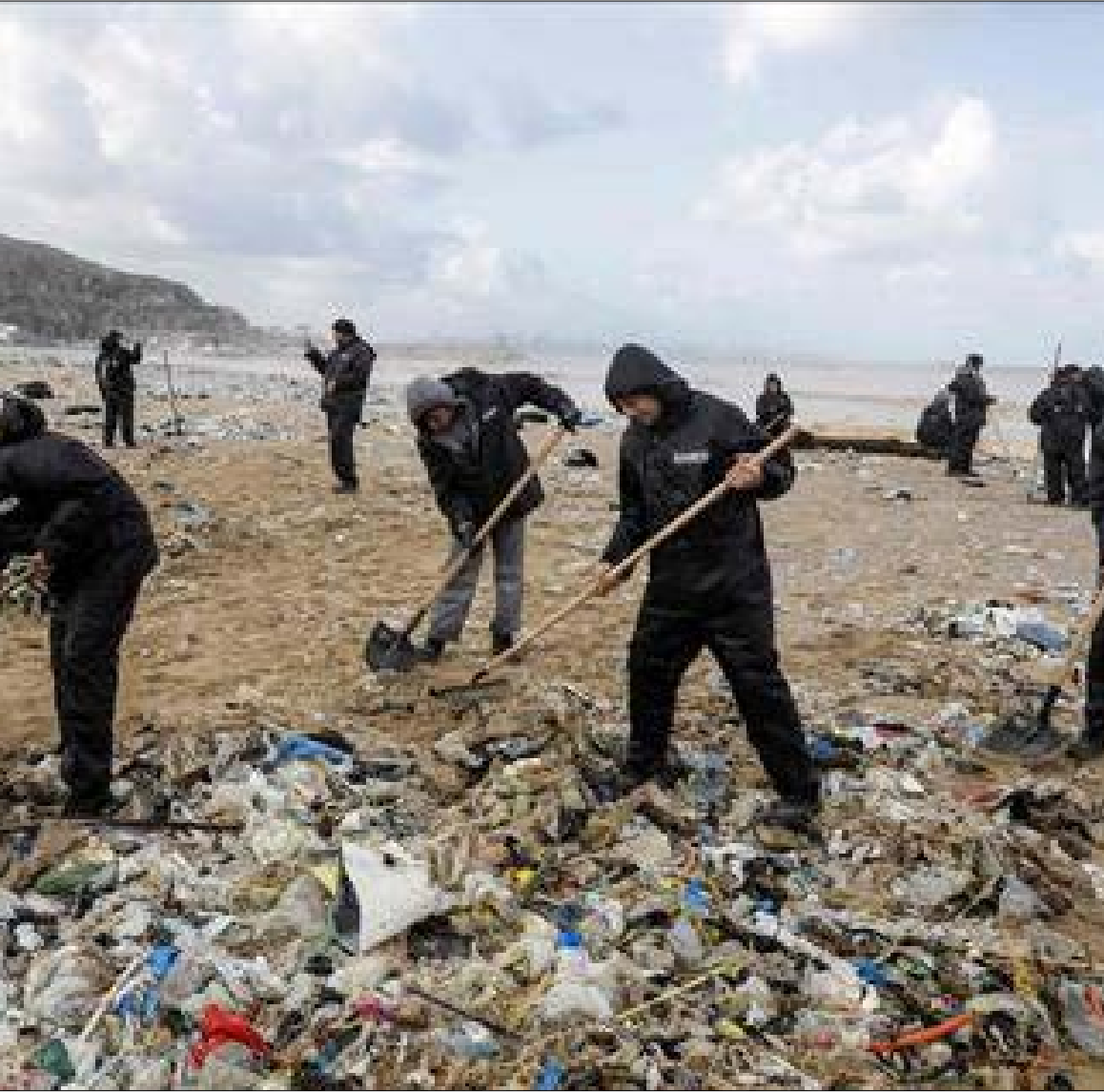
رفع النفايات امس عن شاطئ الذوق