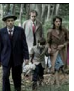
«Across the Waters»، لنيكولو دوناتو 20:00، س: 2/3 و 22:15، س: 1/29