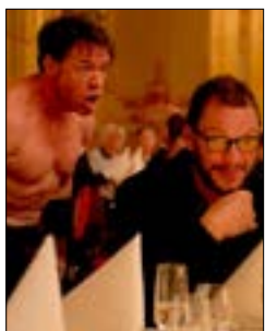
«الحديقة» لروبن أوستلوند 19.30، س. 1/28