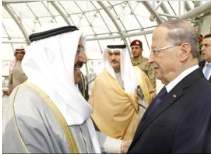
طلب أمير الكويت عدم مفاصلته بموضوع سفير لبنان معنا لإحراجه