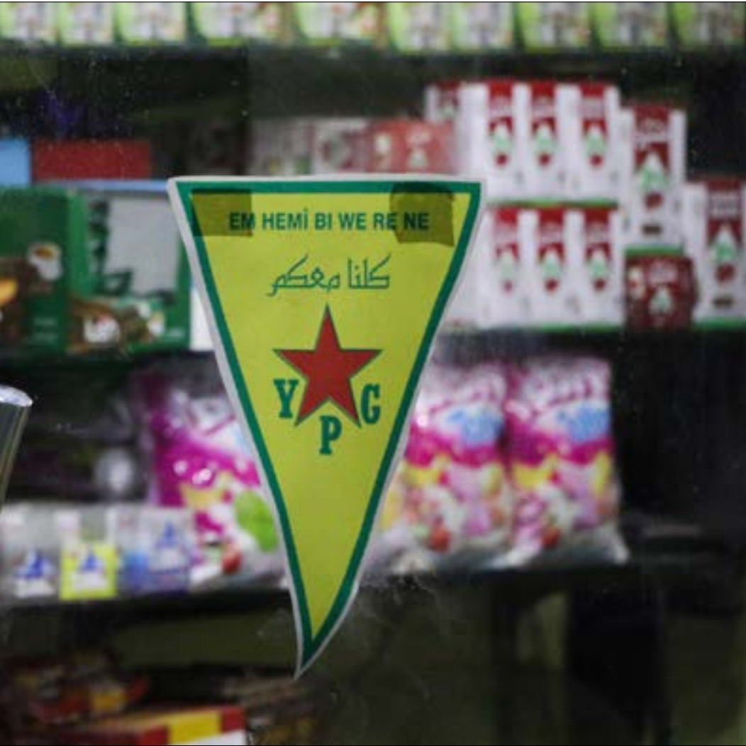
لم يقبل الأكراد بطرح دمشق حول عفرين لأغبتهم في «حل شامل» (أ ف ب)

• الروس متواطئون مع الهجوم التركي على عفرين