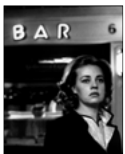
«مصعد كهربائي نحو المشقة»، لوي جاك 22:15، س: 1/28