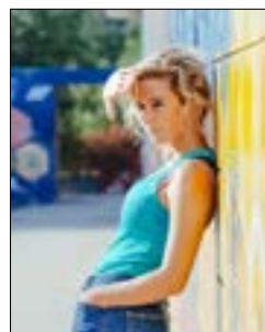
«محظوظة» لسيرجيو كاستيليتو 22.15، س. 2/2 و 17.30، س. 1/27