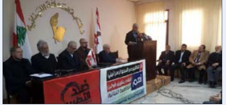
من لقاء الامس