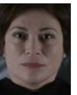
«سما»، لإلياس ديميتريو 22:15، س: 1/29