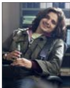
«طونيو» لياولا فات در أوست 22.15، س. 2/1 و 20.00، س. 1/27