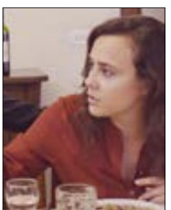
«غداة العيد»، للوسيان بو رجيلي 20:00، س: 2/4