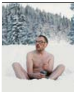
«فأر وحشي» لجوزيف هادر 17.30، س. 2/3 و 20.00، س. 1/27