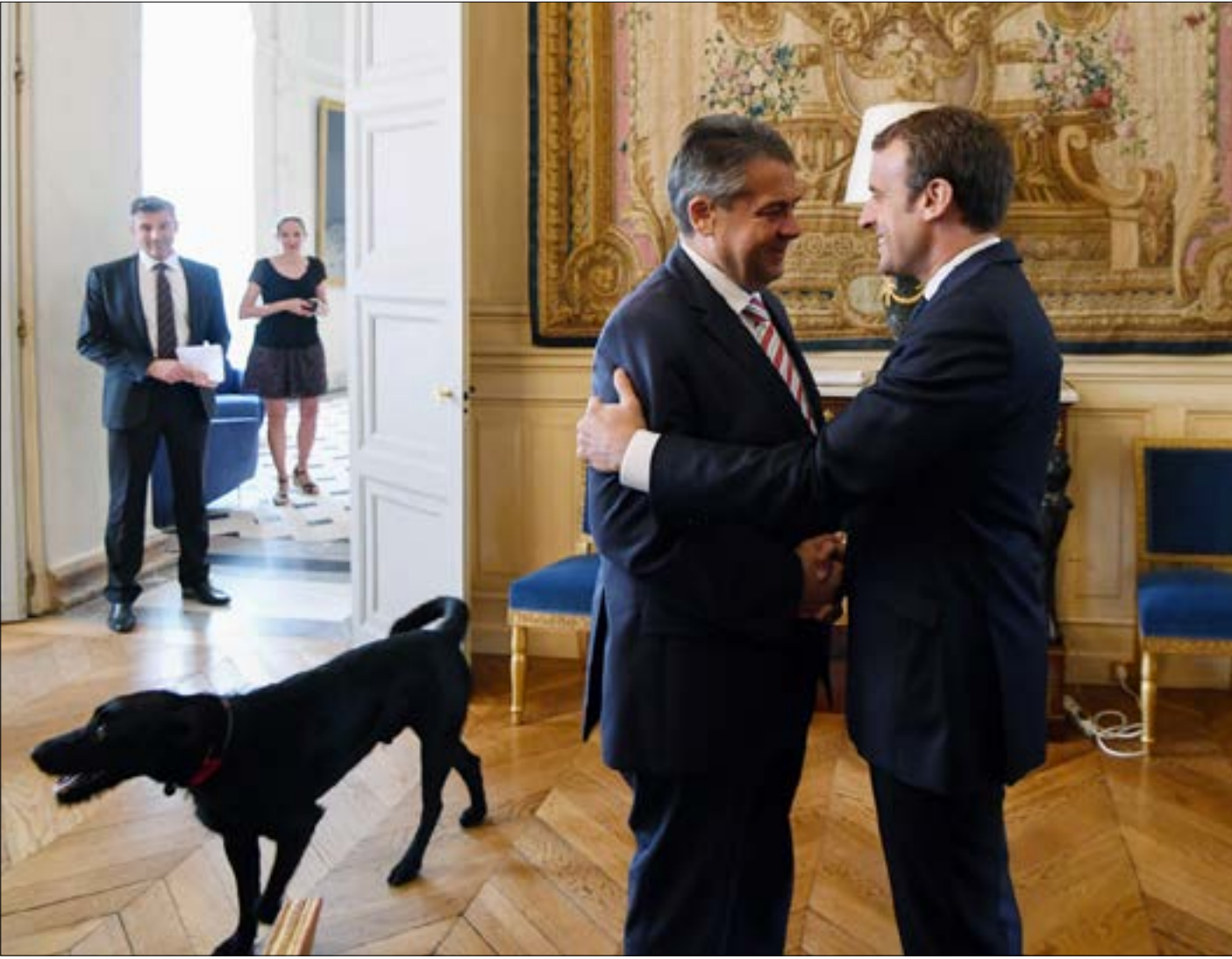
ماكرون: أهم الفرنسيين يجب أن يكون أساس الدبلوماسية وغايتها الوجودية