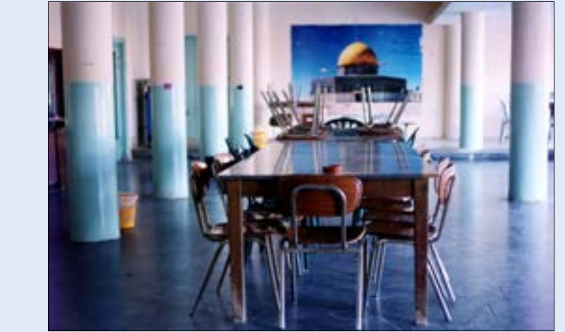
بيت الخليبي - النظر في المسافة، المشهد 140 x 140 سنتيمتر - طباعة كروموجينيك - 2010

في المحصلة، دخل وخرج الحضور من المتحف على فكرة إعادة خلق التواصل مع مدينة القدس التي تجاوزت الحدود الجغرافية لفلسطين الانتدابية، بل تعادها إلى ما قبل ذلك مع بيروت، دمشق، الأردن وغيرها... ليجبر للحضور بشكل مباشر أو غير مباشر، أن حاجة القدس بل فلسطين إلى العودة والارتباط بسائر المدن السورية هي ضرورة ملحة لتحقيق نهضتها المرتبطة بحريتها!