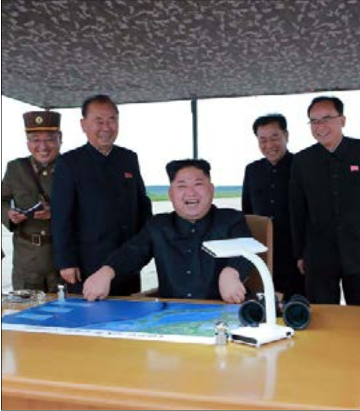
نشرت صحيفة كورية شمالية امس صورا لعملية إطلاق الصاروخ

بعدها ارتفع حتى حوالي 550 كلم قبل أن يسقط في المحيط الهادئ. ونقلت الوكالة الرسمية الكورية الجنوبية عن كيم قوله إنه ستكون هناك «تجارب أخرى لصواريخ باليستية في المستقبل، وسيكون المحيط الهادئ هدفاً لها». وقال إن إطلاق الصاروخ كان «مقدمة مهمة لاحتواء غوام، القاعدة المتقدمة للاجتياح» و«فاتحة (...) لتدابير مضادة حازمة» ضد المناورات العسكرية المشتركة التي تقوم بها واشنطن وسيول في كوريا الجنوبية. أميركياً، تباينت المواقف الرسمية وتناقضت بين مناصر للحل الدبلوماسي ومناهض له. وفيما أعلن وزير الدفاع جيمس ماتيس أن الحل الدبلوماسي لا يزال ممكناً لوضع حد لإطلاق كوريا الشمالية صواريخ باليستية، أكد الرئيس دونالد ترامب في تغريدة على موقع «تويتر» أن الحوار مع كوريا الشمالية «ليس الحل».