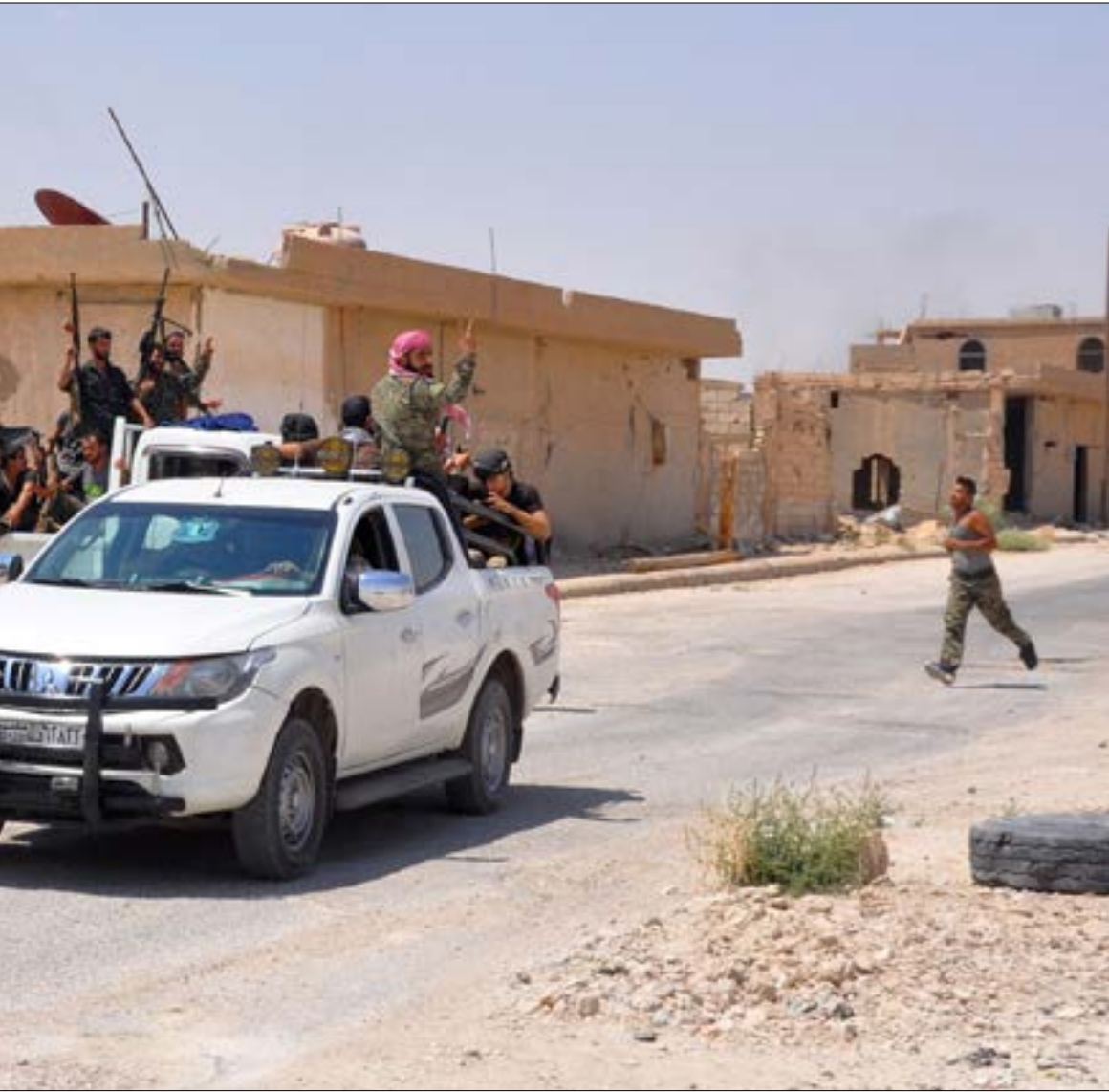
بركز «داعش» هجماته على نقاط الجيش في محيط معدان الغربي

لمنطقة إدلب ومحيطها تحت مظلة «أستانا». وبينما برز النشاط التركي «الحريص» على تجنب أي عمل عسكري في تلك المنطقة، تعمل موسكو على ضمّ لاعبين جدد لدعم مسار المحادثات.