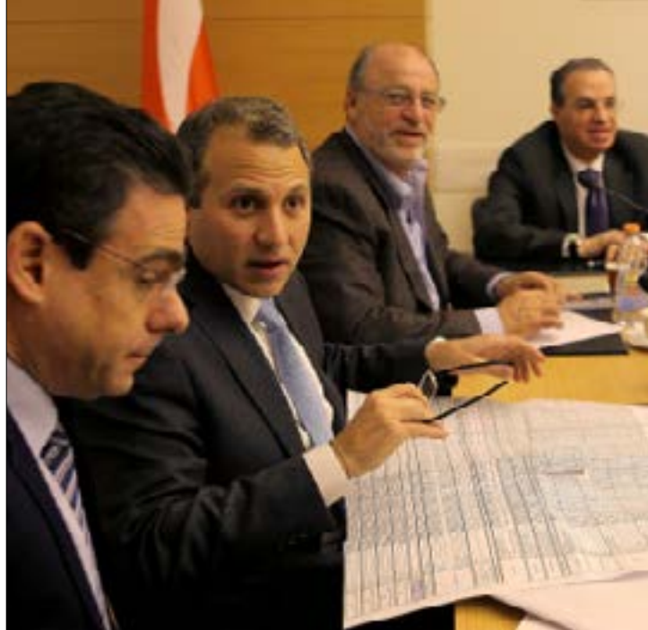
استند باسيل إلى عناصر القوة اللبنانية لرفض أي تعديل لمهمة اليونيفيل (هيلم الموسوي)

مجلس الأمن الدولي، استند باسيل إلى عناصر القوة اللبنانية، لرفض أي تعديل لمهمة اليونيفيل. ومن أوراق القوة، أنّ في مقدور لبنان سحب طلب التجديد لليونيفيل، مع ما يعنيه ذلك من إحراج لواشنطن وإسرائيل، لكونه يحول القوات الدولية إلى قوى غير شرعية في لبنان. كذلك يدرك باسيل حساسية الدول المشاركة في اليونيفيل تجاه أوضاع جنودها في الجنوب، فأجاد استخدام هذه الأوراق، وغيرها، للحفاظ على «تفويض» قوات الطوارئ المحور الثالث، هو الموقف الروسي الراضف لأي تعديل جوهرى لمهمة اليونيفيل. وفيما لوّحت الولايات المتحدة أمس بالامتناع عن التصويت على قرار التجديد لليونيفيل، قبلت فرنسا بإدخال تعديلات شكلية على مشروع القرار، مثل الطلب من الأمين العام للأمم المتحدة أنطونيو غوتيريش النظر في سبل تعزيز جهود اليونيفيل من ضمن «ولايتها وقدراتها الحالية»، والطلب إليه أيضاً تقديم تقارير عن الأماكن التي تمنع اليونيفيل من دخولها وتبيان