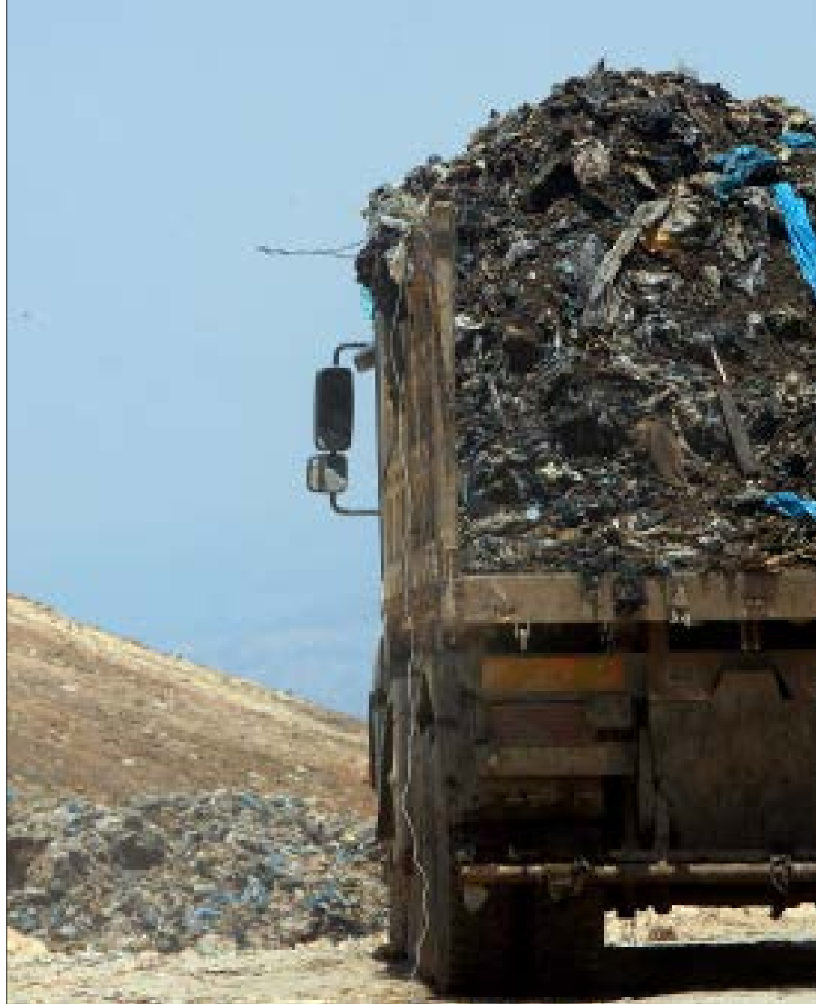
في حال عدم توافر مقال مناسبة لظمر العوادم، يمكن الاعتماد على المطامر الصحية (هيلم الموسوي)

دون دراسات استراتيجية وكافية ومبررة كافية! وكيف يتم اقتراح خطط جديدة مكلفة، ولا سيما لناحية استهلاك أراض جديدة، من دون تقييم كلفة الخطة الطارئة الأخيرة، التي كلفت عقوداً مع شركات التي التزمت مراكز الكوستا برفاً وبرج حمود بما يقارب 180 مليون دولار أميركي