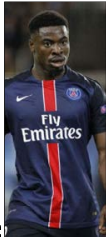
أورييه بدلاً لوهوك في توتنهام (أرشيف)

غير أن الصحيفة اعتبرت أن خيار لومار هو المنطقي أكثر، إذ إن ناديه لن يمانع ببعده وخصوصاً أن