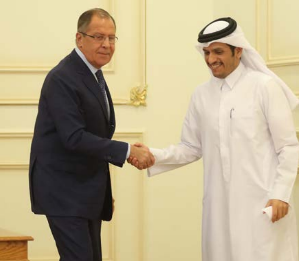
اختتم سيرغي لافروف في قطر، جولة خليجية بدأها بالكويت وقادته إلى الإمارات (أضرب)

الروابط التجارية والاقتصادية والدفاعية مفتاحاً للولوج إليها، خصوصاً أن وزير الخارجية القطري، محمد بن عبد الرحمن آل ثاني، أعلن، مع روسيا، ولن تعتمد بعد الآن على الدول المجاورة لدعم اقتصادها أو ضمان الأمن الغذائي»، فيما أشار لافروف إلى أن بلاده «تولي أهمية كبرى» للتعاون مع الدوحة في مجال الطاقة بشكل خاص. كذلك تباحت الوزير الروسي مع وزير الدفاع القطري، خالد العطية، في سبل «تطوير التعاون في المجالات الدفاعية»، بعدما كان السفير الروسي لدى الدوحة، نور محمد خولوف، قد كشف الخميس الماضي، عن «احتمال إبرام اتفاق في مجال التعاون العسكري التقني بين روسيا وقطر في أقرب وقت»، وجاء تصريح