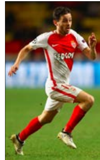
خسر موناكو لاعبت مؤثرين جداً مثل البرتغالي برناردو سيلفا

ويبدأ موناكو حملة الدفاع عن اللقب الذي توج به للمرة الأولى منذ عام 2000، على أرضه بمواجهة تولوز، وهو يطمح إلى البداية المثالية والتركيز كاملاً على ما ينتظره في المسابقات الأربع التي يخوضها، وخصوصاً أنه كان مشغولاً في الأيام الأخيرة بمحاولة الوقوف في وجه الفرق الطامحة إلى الحصول على نجمه كيليان مبابي، وبينها ريال مدريد الإسباني ومانشستر سيتي