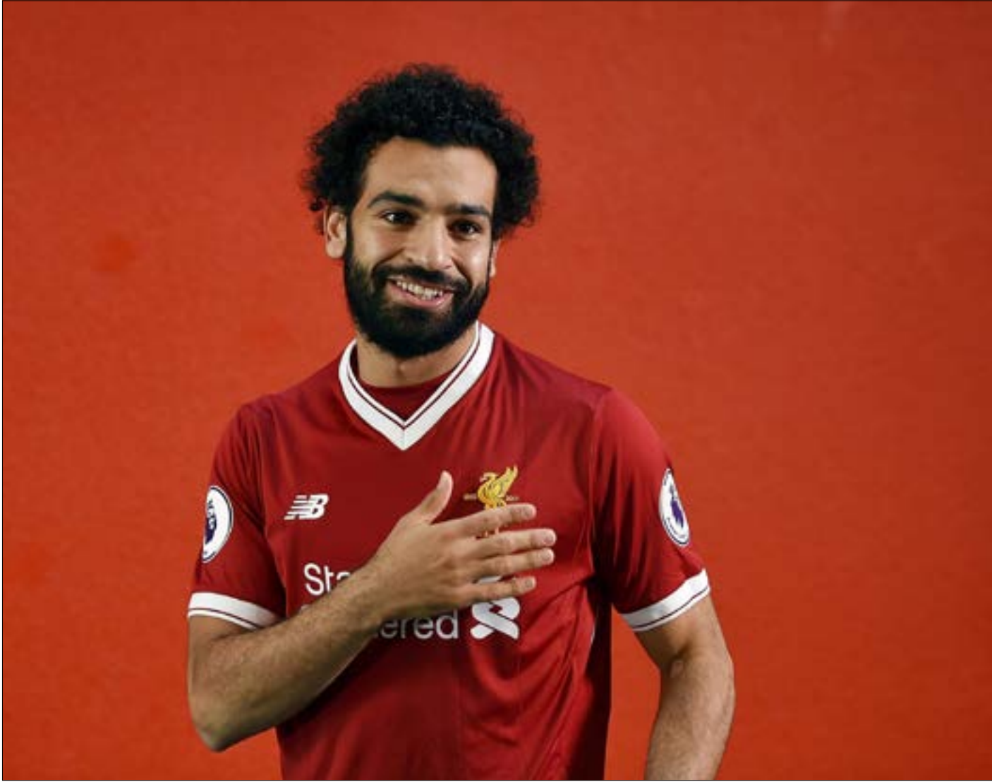
كانت صفقة محمد صلاح ذكية لزيادة سرعة الفريق (أرشيف)

قدّم ليفربول أوراق اعتماده، مُنافساً على لقب الدوري الإنكليزي في الموسم الجديد. قد لا يستطيع فريق المدرب يورغن كلوب أن ينافس الأندية في قدرتها الشرائية في سوق الانتقالات، لكنه لا شك في أنه سينافسهم بعد جذب أفضل المواهب بمبالغ منطقية ومقبولة.