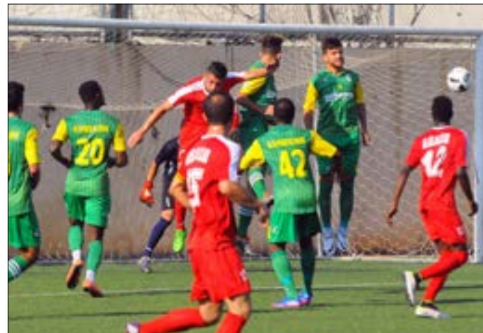
جاء لقاء الشباب العربي والإصلاح البرج الشمالي ضعيفاً (هيلم الموسوي)

اليوم، تنطلق مسابقة كأس النخبة بلقاء ناري بين النجمة والأصنار على ملعب طرابلس عند الساعة 17,00 ضمن المجموعة الثانية التي تضم أيضاً النبي شيت. ويلعب في التوقيت عينه على ملعب بحدون، العهد والسلام زغرنا ضمن المجموعة الأولى التي تضم الصفاء.