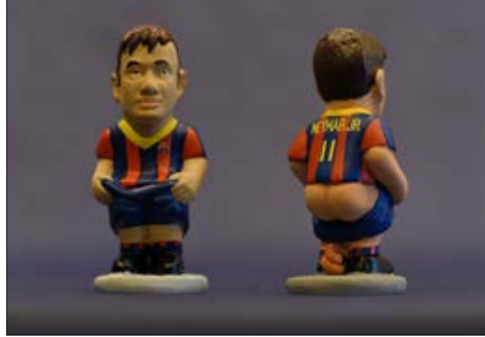
كانت الصفقة قد لاقت اعتراض رئيس رابطة الدوري الإسباني