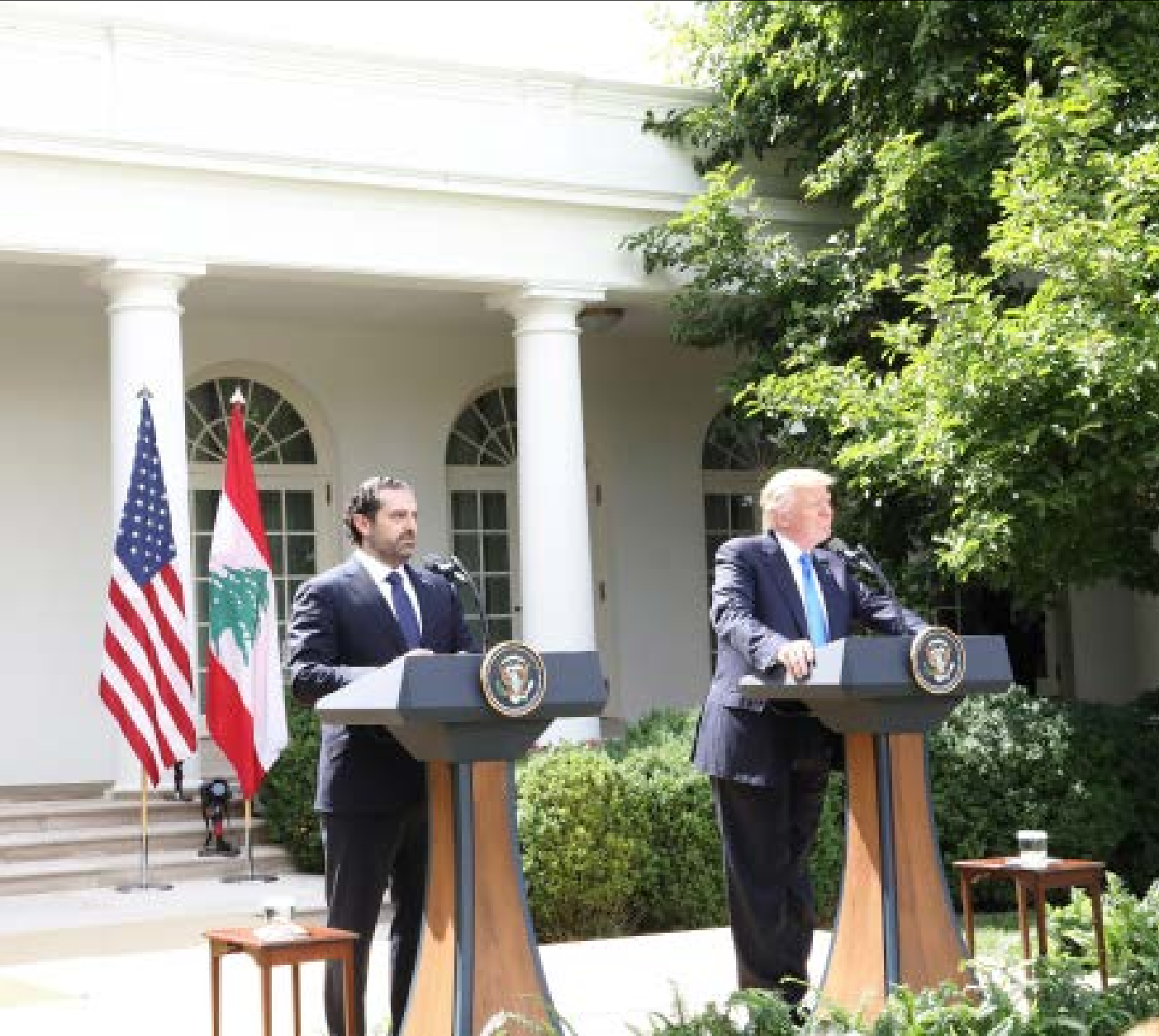
التضييق على دول أميركا اللاتينية والكاريبي بحجة ملاحقة نشاطات حزب الله