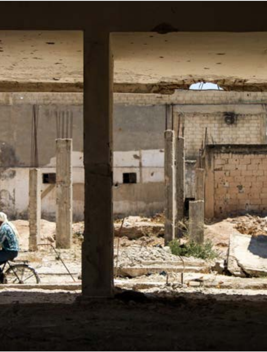
يلبس تأييد محتاج للسلطة عند من كان هو تحت سيطرة «داعش» والنصرة، (أف ب)

انفعالياً مكتفياً عنها، ولكن إن أردنا تكثيف هذه النزعة في صياغة فكرية - سياسية فيمكن وضعها في إطار «نزعة المحافظة السياسية» التي عبرت عن حالة نكوصية ارتدادية عن فشل ثورات أو حركات معارضة، كما في فرنسا إثر هزيمة نابليون بونابرت في معركة «واترلو» عام 1815 وعودة آل بوريون إلى السلطة بعدما اطاحتهم موجات ثورة 1789، حيث رأينا تعبيرات أدبية عند بلزك عن ذلك، فيما ظهر هذا عبر نزعات فكرية عند مفكر سياسي مثل أليكسيس دو توكفيل، وعند مؤرخين سياسيين مثل تيير الذي أصبح رئيساً للوزراء وزعيماً للحزب الملكي، ثم كان هو رئيس الجمهورية عام 1871 عند القمع الدموي لكونمونة باريس. حصلت «نزعة المحافظة السياسية» التي ترى الواقع القائم أفضل وأقل تكلفة وأكثر أمناً من اضطراب دموي غير ناجح المردود، بسبب فشل الثورات والحركات الاجتماعية المعارضة في تحقيق الأهداف المعلنة من قبلها وبسبب حجم الدم والخراب الذي ولدته تلك الثورات والحركات، وأيضاً بسبب حجم الخلافات والانشقاقات والتقاتلات الدموية التي ظهرت في مرحلة ما بعد ثورتي 1789 و1848 الفرنسيين ما بين أطراف المعسكر الثوري. هذا كان يؤدي إلى ميلان الكفة اجتماعياً لمصلحة القوى المحافظة وإلى انفضاض اجتماعي عن القوى المعارضة للسلطات القائمة. في حالة أخرى، أعقبت فشل ثورة 1905 الروسية، لوحظ نشوء نزعات ارتدادية فكرية عند قادة ثوريين، مثل لوناتشارسكي، وعند أديب كان على علاقة مع الحزب البلشفي، مثل مكسيم غوركي، ولكن عند عودة الموجة الثورية أصبح الأول وزيراً للثقافة في أول حكومة ما بعد ثورة أكتوبر 1917، فيما كان غوركي الأيقونة الأدبية عند لينين وستالين. في حالة ثالثة هي ألمانيا ما بعد هزيمة 1918، كانت الهزيمة العسكرية ثم