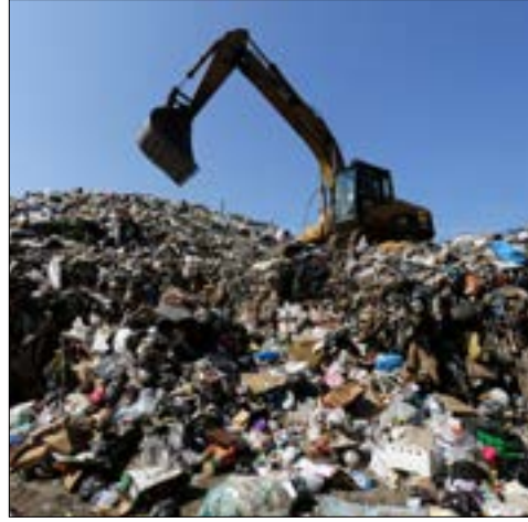
إزالة النفايات القديمة في الكرتينا مؤقتة إلى ما بعد الصيف (مروان طحطح)

يشير المتعهد الملزم أعمال إنشاء المطمرين داني خوري في اتصال مع "الأخبار"، إلى أنه لا يوجد حتى الآن أي قرار بنقل هذه النفايات إلى موقع أحد المطمرين، لافتاً إلى أنها مسؤولية مجلس الإنماء والإعمار. عندما تقرّر الإبقاء على "مكب" الكرتينا ورفع النفايات، لمج مصدر مُطلع إلى الإبقاء على هذه النفايات