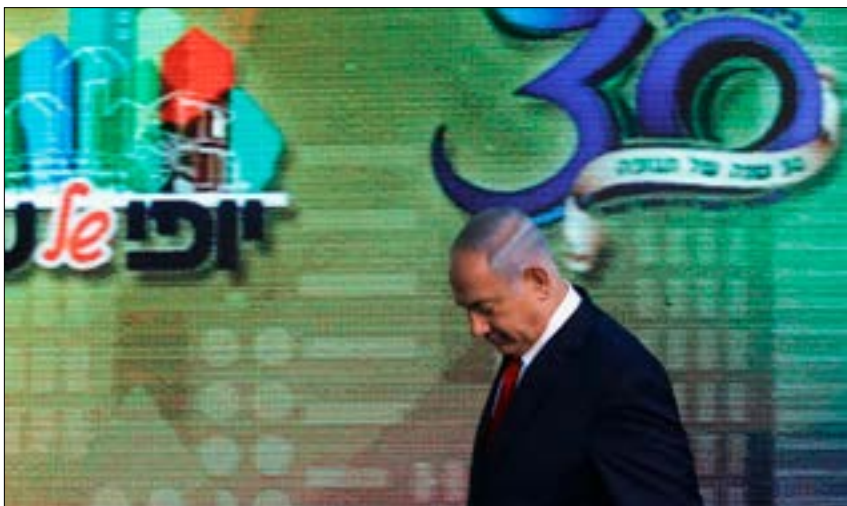
بجوم حول نتنياهو سيناريو شبيه بالذي اصاب سلفه اولمرت (أفب)

القطرية للتحقيق في الاحتيال»، قد اعتقلت هارو في أواخر 2015، بشبهة مواصلة تفعيل شركة خاصة سراً وعن طريق الاحتيال، وذلك أثناء عمله رئيساً لموظفي مكتب رئيس الحكومة، الذي عين فيه عام 2014. وفي الصيف الماضي، ومع بدء تحقيق الشرطة بشأن رئيس الحكومة، واجه محققو الشرطة هارو بمعلومات تم جمعها، وأشارت، على ما يبدو، إلى علاقة جنائية بينه وبين رئيس الحكومة.