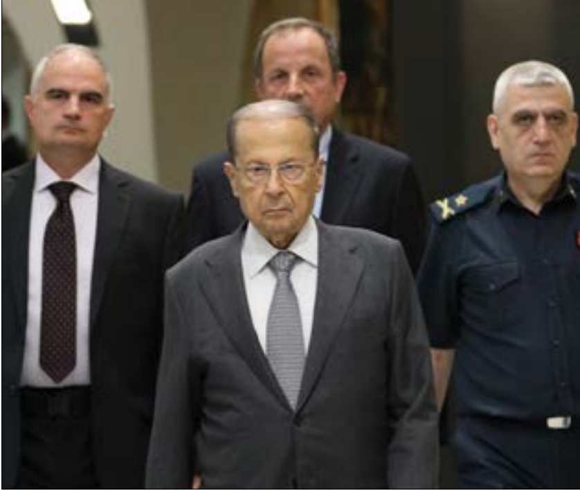
الملف الذي عرض على الوزراء يحذر من تهديد الاستقرار الاقتصادي

على موافقة من هيئة مجلس شوري الدولة، ومن ثم مجلس القضاء الأعلى، قبل صدور المرسوم عن مجلس الوزراء.