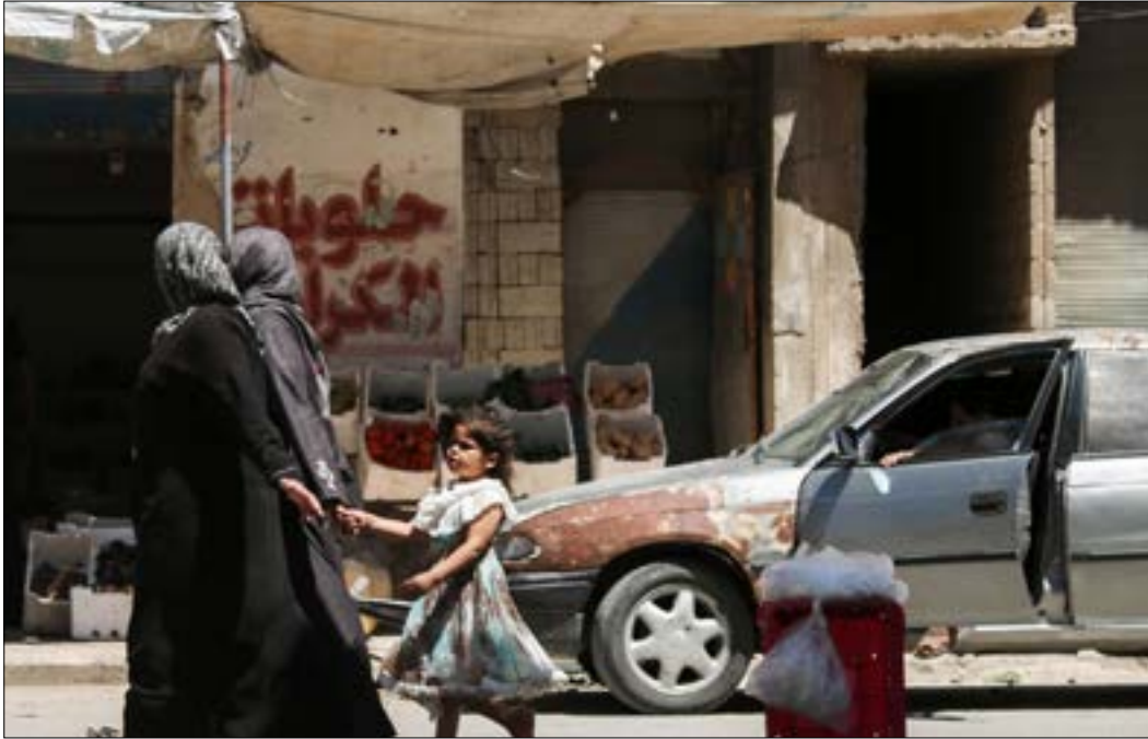
في مدينة تلبسة المنضوية ضمن اتفاق «تخفيف التصعيد» في ريف حمص الشمالي

وتضم تلك المنطقة «84 تجمعاً ماهولاً بأكثر من 147 ألف شخص». وشدد على أن «المعارضة التزمت بطرد جميع تشكيلات (داعش) و(جبهة النصرة) من الأراضي الخاضعة للهدنة في محافظة حمص».