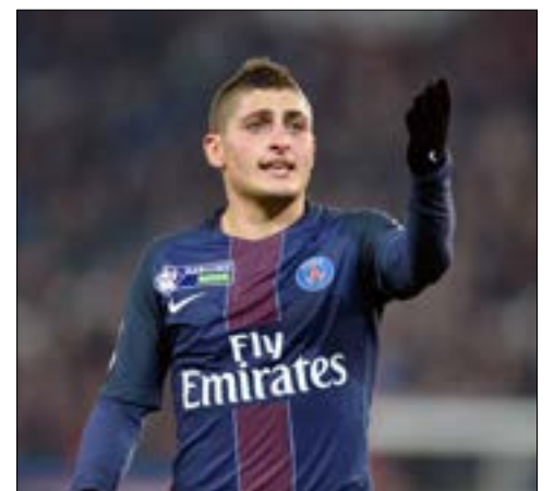
لم يستبعد وكيل أعمال فيراتي انتقاله

وجاء كلام دي كامبلي في حديث إلى صحيفة "لا غازيتا ديللو سبورت" الرياضية الإيطالية، وقال: "الوضع معقد بعض الشيء، على الرغم من العقد الذي يربط اللاعب بالنادي حتى عام 2021"، وأضاف: "يريد