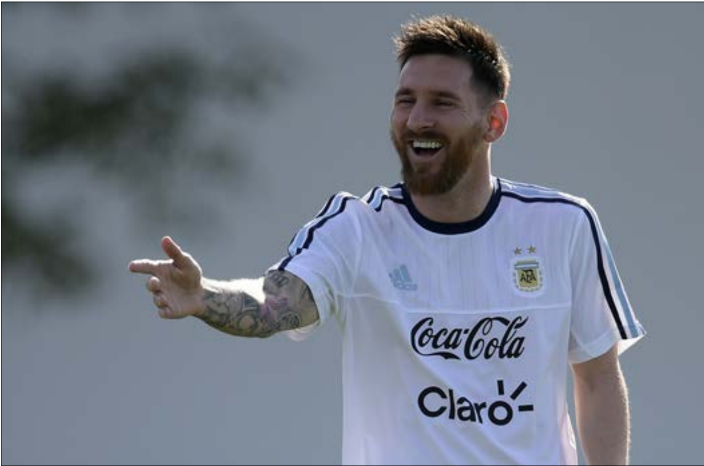
ميسي في الحصة التدريبية استعداداً لمواجهة تشيلي

يستعدّ الأرجنتينيون لجولة جديدة فاصلة في تصفيات أميركا الجنوبية لمونديال روسيا 2018. أمام تشيلي. المنتخبان يصارعان على المقعد المؤهل للنهائيات، لكن الأول يقع تحت ضغوط أكبر تطاول اتحاد كرة بلاده