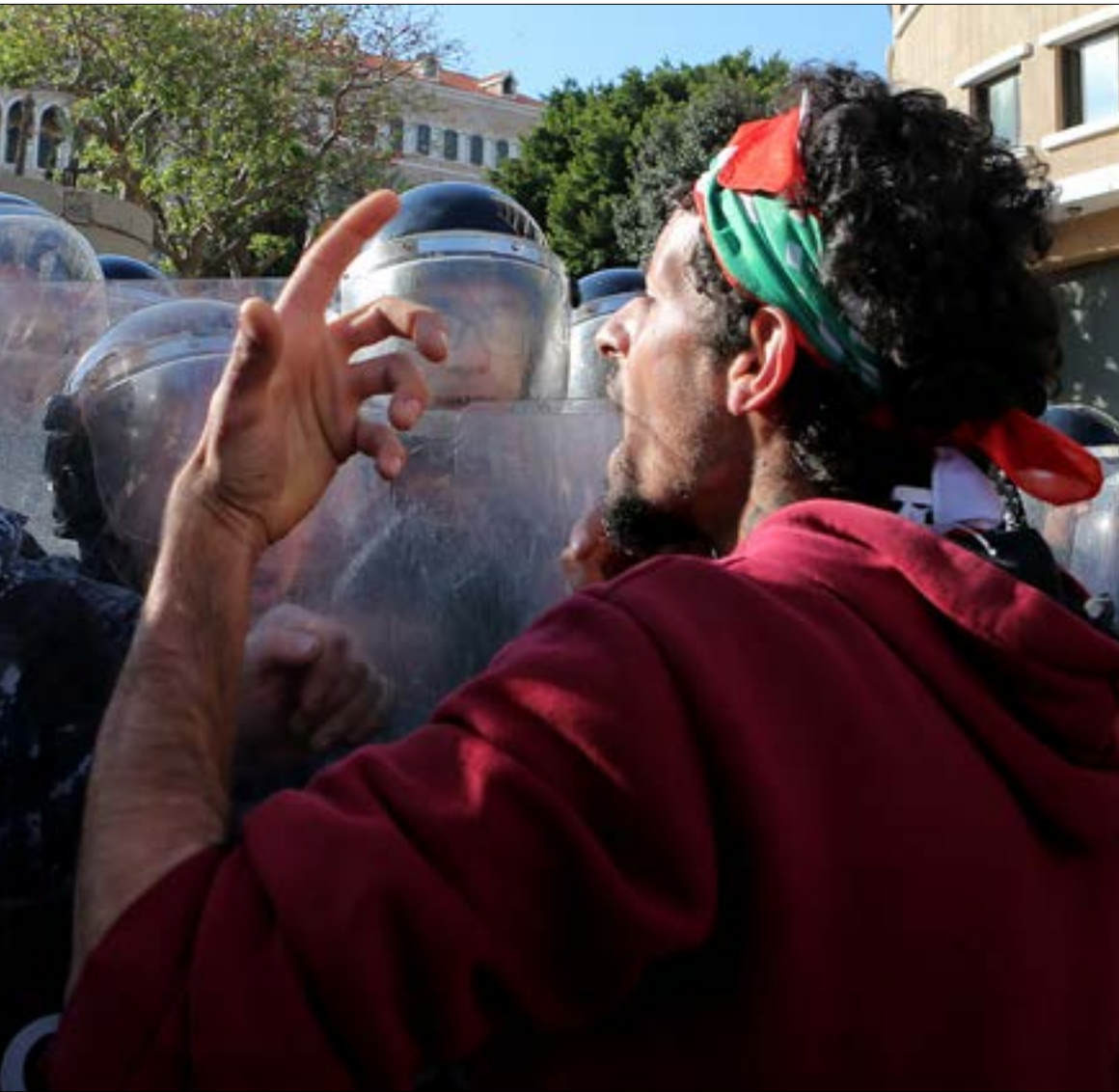
تم رفض عرض تلفزيوني جديد لتنظيم مظاهرة مع الحريري (هيلم الموسوي)