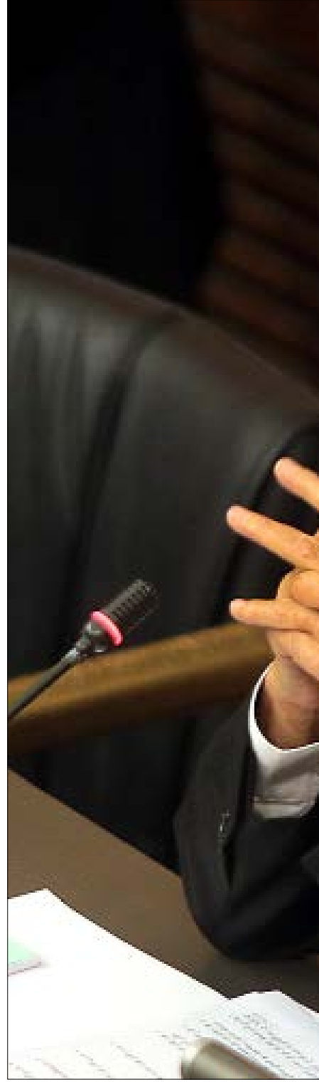
الحريبي اليوم اضعف بكثير مما كان عليه عام 2009 وضاهر ضده مئة في المئة (مروان طحط)

من هو تيمور جنابلاط؟ إنّ ابن وليد جنابلاط. هكذا فقط. لولا ذلك لما «قرأه» أحد. في لسان بلادنا الدارج يُقال، عادة، عن أحدهم، إنّ «ابن عيلة». تُقال هذه في معرض المدح. ذاك المدح الذي يستبطن، وإن بلا وعي، احتقاراً للذات. لم تأت هذه الكلمة من فراغ. إنّها من تاريخنا الاجتماعي الذي لم يُصبح تاريخياً. نحن في بلادنا الحاضر الدائم. ذات يوم كانت العائلة تحكم. كان «ابن العائلة» اقطاعياً، له كلّ شيء، الأرض ومن وما عليها، فيما الآخرون، كلهم،