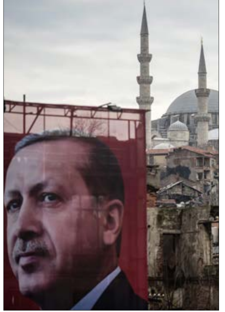
ريليت ترد: لا تعرّضوا للخطر ما بنيتموه