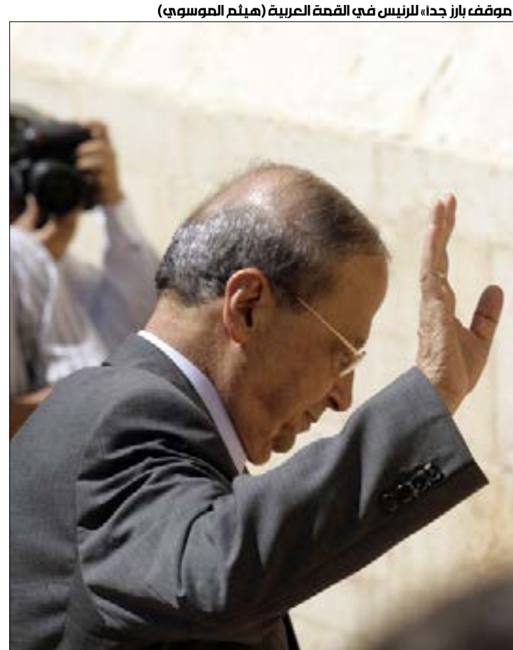
«موقف بارز جدا» للرئيس في القمة العربية

توقيف تاج الدين مقدمة لإجراءات أميركية ضد آخرين على لوائح «أوفاك»