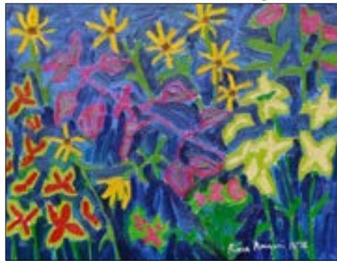
«حديقة سنا» (زيت على كانفاس - 90 × 120 سنتم - 2016 - تفصيل)

تحبه أميوني، لكن تأثرها الأساسي كما تقول «هو بالفنان البريطاني/الأميركي غراهام نيكسون (1946)، والتأثير واضح في الجوهر، هو القائل إن «التحدي هو بنقل الناس إلى النظر إلى صورة رأوها مراراً من قبل، وجعلهم يتقنون أنهم لم يروها قطاً بهذه الطريقة».