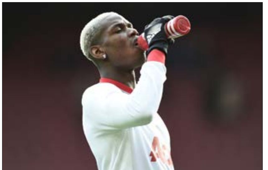
بوغيا في حصة تدريبية

يبدأ مانشستر يونايتد الإنكليزي رحلته نحو نهائي مسابقة «يوروبا ليغ» في سعيه إلى تحقيق اللقب لضمان العودة للمشاركة في دوري أبطال أوروبا الموسم المقبل، عندما يحل ضيفاً اليوم على روستوف الروسي في ذهاب دور الـ 16. ويحتل «الشياطين الحمر» المركز السادس راهناً في الدوري المحلي، ويتنافس لاعبو المدرب البرتغالي جوزيه مورينيو بشراسة مع ليفربول وأرسنال على المركز الرابع، آخر المراكز المؤهلة إلى دوري الأبطال. وأقر مورينيو بأن «يوروبا ليغ» ستكون أولوية بالنسبة إليه في حال بلوغ ربع النهائي، قائلاً: «يوروبا ليغ صعبة جداً، وإذا فزنا على روستوف وبلغنا ربع النهائي، فعلياً التفكير بها جيداً، لأننا لا