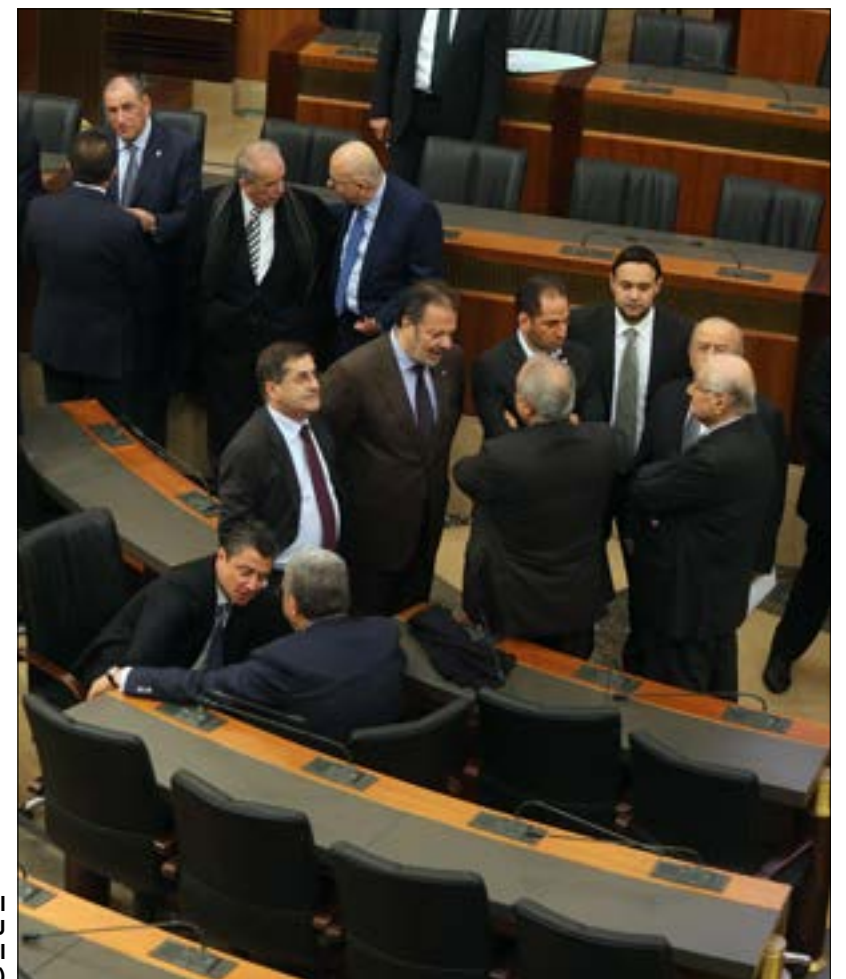
الفساد السياسي جزء لا يتجزأ من ثقافة الناس... كل الناس