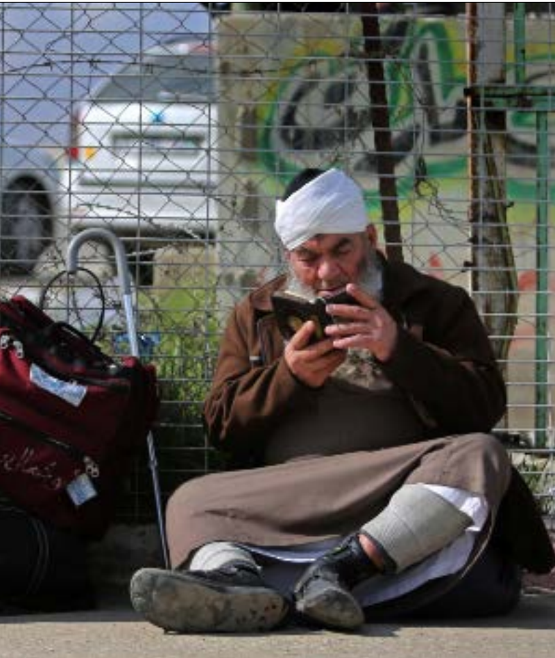
انتهى امس الفتح الجزئي لمصر رفح بعد ثلاثة ايام يتوهم ان تجدد قريبا

فلسطين «خرجت الأمور عن السيطرة واستدعت وضع حدّ لها». هذه العبارة صارت هي قاعدة التعامل الأمنية السائدة في العلاقة بين وزارة الداخلية في غزة والمجموعات السلفية منذ أشهر قليلة. وتيرة الاعتقالات تصاعدت قبل مدة. ولا تساهل في التعاطي مع المعتقلين، بل إن قراراً سياسياً اتخذ برفض الوساطات. وآخر أمناً بإطلاق النار على مطلقي «الصواريخ المشؤومة»