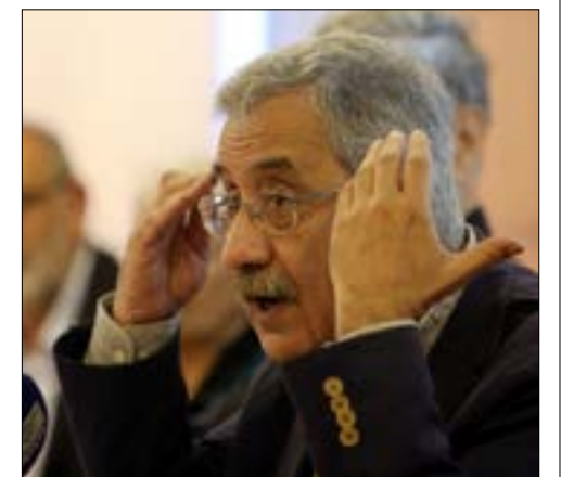
ينح المشروع للمواطنين حرية تصنيف أنفسهم بين مواطن «بالمباشر»، أو بحسب الواسطة الطائفية (مواطن طحطح)

في بداية العام الجاري أرسل الوزير السابق شريك نحاس. ثلاث رسائل إلى رئاسة الجمهورية ورئاسة الحكومة ورئاسة مجلس النواب تتضمن طرحاً انتخابياً مفضلاً يراعي بين حقوق المواطنين «الطائفي» و«اللاتائفي» على حدّ سواء. رئيس الجمهورية ميشال عون، استمع إلى مشروعه. رئيس الحكومة سعد الحريري حدّد له موعداً ثم الغاه. أما الرئاسة الثالثة فلم تتفاعل قط. ولكن في زحمة مشاريع المحاصمة، قد يكون طرح نحاس المرحلة الانتقالية الأنسب نحو الدولة المدنية