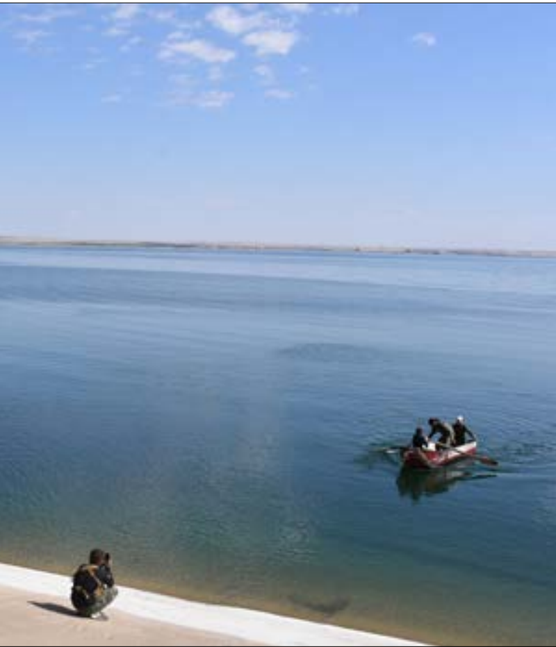
وصل الجيش السوري إلى ضفاف بحيرة الأسد على نهر الفرات بعد غياب أربعة أعوام

وبدت اللهجة الحادة في حديث الموسوي تجاه أنقرة في رد واضح على دعوات الأخيرة المتكررة لإخراج الجماعات الأجنبية العاملة في الميدان إلى جانب القوات الحكومية السورية، والتي ذكرت بينها بشكل صريح «الميليشيات العراقية». ويعد هذا التصعيد الذي خرج في مؤتمر صحافي من طهران، انعكاساً للمشاحنة الدبلوماسية الإيرانية التركية التي جرت أخيراً من جهة، ونجاح الجيش السوري وحلفائه في تحجيم الدور التركي وعزله على الأرض.