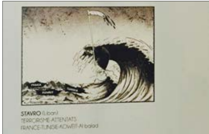
STAVRO JBRANI TERRORISME-ATTENTATS FRANCE-TUNISE-KOUEÏT-Ni baad

يضع بلانتو رجلين يتأرجحان (الفلسطيني والإسرائيلي) في الهواء، ويقومان بتبادل الهلال (الإسلام)، ونجمة داوود، مذيلة بمقولة عربية: «الأراجيح الأكثر صلابة هي المعلقة بين النجوم». أما الطامة الكبرى، فوضع رسوم للبناني ستافرو جبرا الذي ينتمي إلى هذه المنظمة أيضاً. من أعمال ستافرو المعروضة، رسمة لأمين عام «حزب الله» السيد حسن نصرالله، تعود إلى زمن «مؤتمر باريس 3»، وإلى جانبها رسمة أخرى يصوّر فيها جبرا «إرهاب داعش»، وأخرى تتناول «داعش» وهجماته على تونس والكويت وفرنسا. طبعاً، هذا الجمع غير البريء بين جماعة إرهابية دموية، ونصرالله، يحيلنا أكثر إلى التفكير في خطورة ما يلصق على جدران الجامعات، وما يخفيه من رسائل مبطنّة؛ أضف إلى ذلك رسوم تساوي بين الدمار الذي خلفته اعتداءات إسرائيل على لبنان وبين عمليات المقاومة.