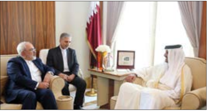
التقى ظريف، بامير قطر وزير خارجيتها