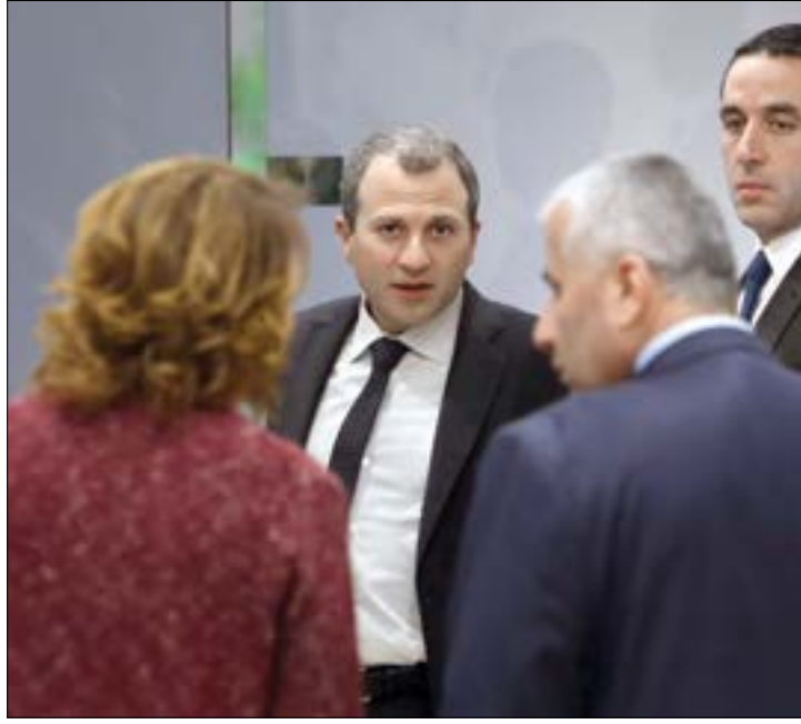
تتهم القوات باسيل بأنه ضرب عرض الحائط بتفاهم معمرات (مروان طحطح)

وذكرت مصادر أمنية أن نقل الأموال إلى التنظيم كان يجري عبر طريقين: حمل أموال نقدية من بيروت إلى جرود عرسال، ثم إلى الداخل السوري. وكان شاب لبناني ينقل الأموال من مكاتب شركات في بيروت إلى الجرود، مشترطاً عدم حمل أكثر من 20 ألف دولار كل مرة. واستمرت هذه العمليات يومياً، قبل عام 2015. ولاحقاً، انخفضت وتيرة العمل عبر عرسال، بما يوحي بأن الأموال باتت تُنقل حصراً لتمويل مسلحي «داعش» في جرود عرسال، لا لنقل الأموال إلى الرقة. أما الطريق الثاني، فيمر بتركيا، إذ تُسَلَّم الأموال في بيروت لـ «كيوسكات» للصيرفة، على أن يقبض الشركاء المال من تركيا، بعد حسم العمولة. ولاحقاً، يتولى أفراد في العصابة تهريب الأموال نقداً إلى تركيا، أو ببيعها، من خلال إرسالها بصورة «قانونية» لتمويل شراء أثاث وثياب بالجملة في تركيا، وإعادة بيعها. وترددت معلومات تفيد بأن المبالغ التي ثبت بالمستندات أنها نُقلت في غضون ثلاث سنوات بلغت أكثر من عشرين مليون دولار. وأكّدت مصادر مطلعة على التحقيقات أن هذه الشبكة المعقدة من الأفراد ومكاتب الصيرفة تضم متعاونين في تركيا وعدد من الدول العربية.