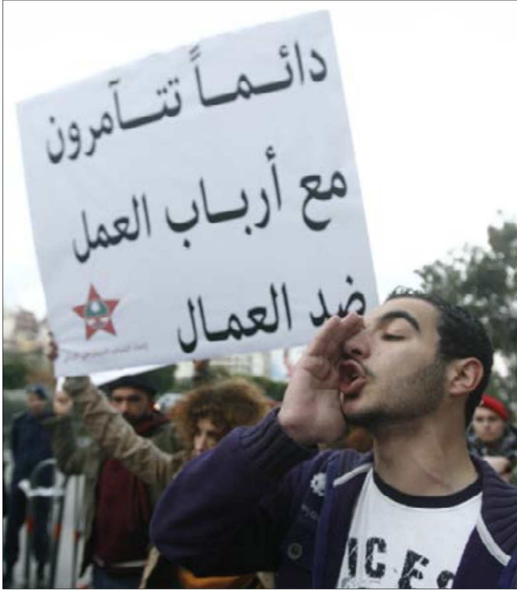
الاتفاق على هيئة مكتب الاتحاد العمالي مجرد «بروفة» للاتفاق على سلّة أخرى من المغنم (مروان بو حيدر)

محدّدون عددياً لكل جمعية، سواء لغرفة بيروت أو جمعية الصناعيين أو الحرفيين أو المصارف أو غيرهم، لكن التعديلات المطلوبة تهدف إلى إلغاء هذا التخصيص ليحل محله اتفاق أصحاب العمل على ممثلين من جمعيات مختارة بهدف «تعزيز حضور أصحاب العمل في مجلس الضمان»، على ما يقول أحد المطلعين.