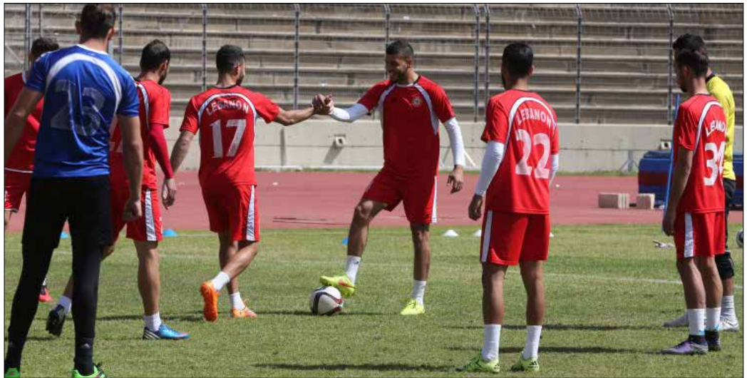
يسمع لاعبو منتخب لبنان للالتزام نقطة من المضيف الكوري الصعب (عدنان الحاج علي)

وصلت بعثة منتخب لبنان لكرة القدم الى العاصمة الكورية سيول، وبدأ لاعبو المنتخب تمارينهم تحضيراً للقاء مع كوريا الجنوبية بعد غد الخميس عند الساعة 13:00 بتوقيت بيروت ضمن المجموعة السابعة لتصفيات كأس العالم 2018 وآسيا 2019. وبعيد وصوله مساء أمس إلى مدينة أنسان التي تبعد نحو 75 دقيقة عن مطار إنشيون الدولي القريب من سيول، توجه منتخب لبنان إلى هواسونغ (20 دقيقة عن مقر إقامته) ليجري ترميناً ليلياً وسط درجة حرارة متدنية.