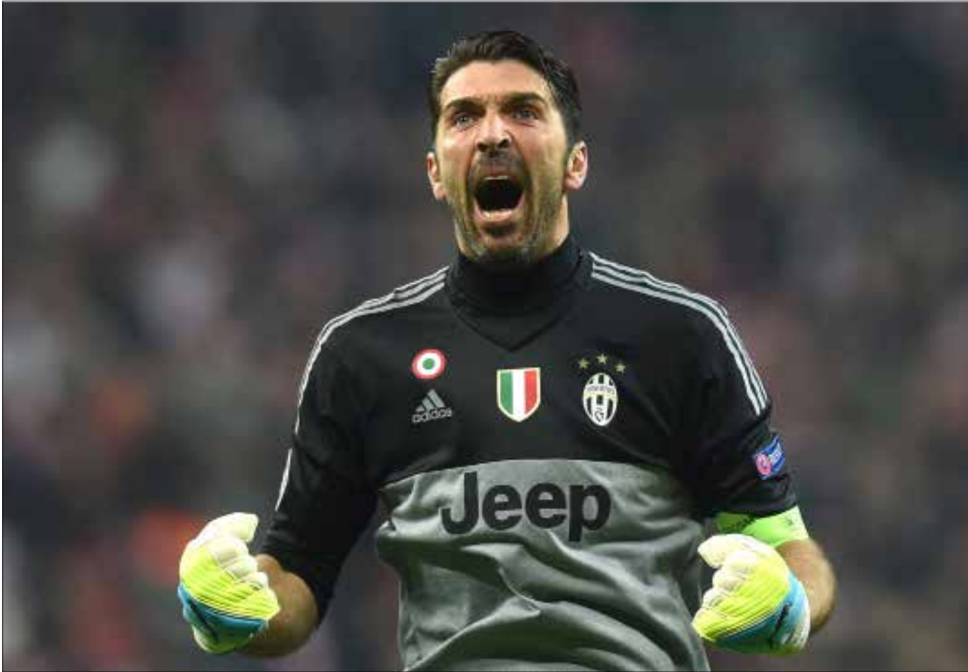
بقي بوفون محافظاً على مستواه حتى سن الثامنة والثلاثين

جيانلويجي بوفون يكتب اسمه مجدداً بأحرف من ذهب في سجلات الكرة الإيطالية بتحقيقه رقماً قياسياً في الحفاظ على نظافة شبكه. ليس بغريب على هذا الحارس هذه المرتبة. هو الذي تتعدد خصاله المميزة وتكثر محطاته المضيئة