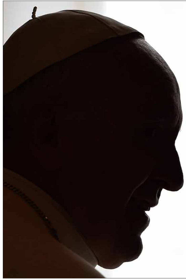
المجمع الشرقي بانم هواء... وهو غالباً هواء غير نظيفاً (أ.ب)

في الجلسة الـ36 في 2 آذار حضر 73 نائباً. وهو الرقم الأعلى للحضور منذ ثانية جلسات الانتخاب في 30 نيسان 2014 عندما حضر 74 نائباً. بعد ذاك راح الرقم يتدهور ويهبط إلى أن وصل إلى 35 نائباً فقط في الجلسة 27 في 12 آب 2015. على أن حضور 73 نائباً، بما يقل عن ثلثي البرلمان بـ3 نائباً، بما فيه الزخم الذي أثاره في الظاهر حضور الرئيس سعد الحريري للمرة الأولى هذا الإستحقاق، لم يكن ليوحي بسذاجة أن انتخاب الرئيس بات وشيكاً، أو أن إحصار النواب الـ13 سيكون من