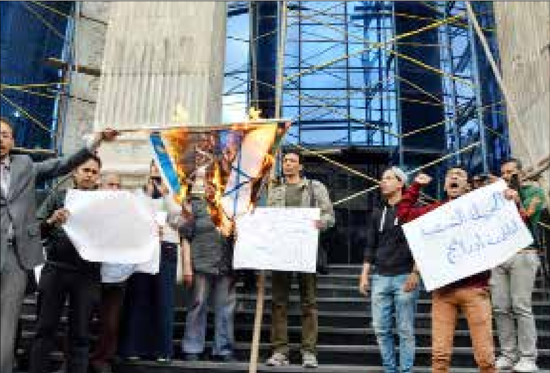
منظرة أمام نقابة الصحفيين احتجاجاً على تشييد شركة «اورانج» في مصر

الأسبوع المقبل أمام مجلس النواب، الحصول على ثقة المجلس الذي يمتلك وفقاً للدستور صلاحية إقالتها وتشكيل حكومة من الأغلبية النيابية. لكن ائتلاف «دعم مصر»، الذي يضم الأغلبية البرلمانية، لا يرغب في تغيير الحكومة حتى الآن. في الإطار، أجرى مركز «بصيرة»