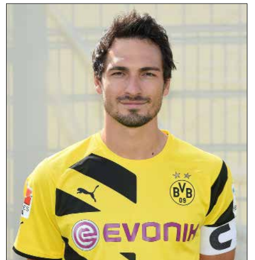
ريد غوارديولا ضم هاملس إلى مانستر سيتي (أرشيف)

من جهته، أضاف الإسباني جوسيب غوارديولا، المدرب الحالي لبائرن ميونيخ الألماني، والآتي لمانشستر سيتي الإنكليزي،