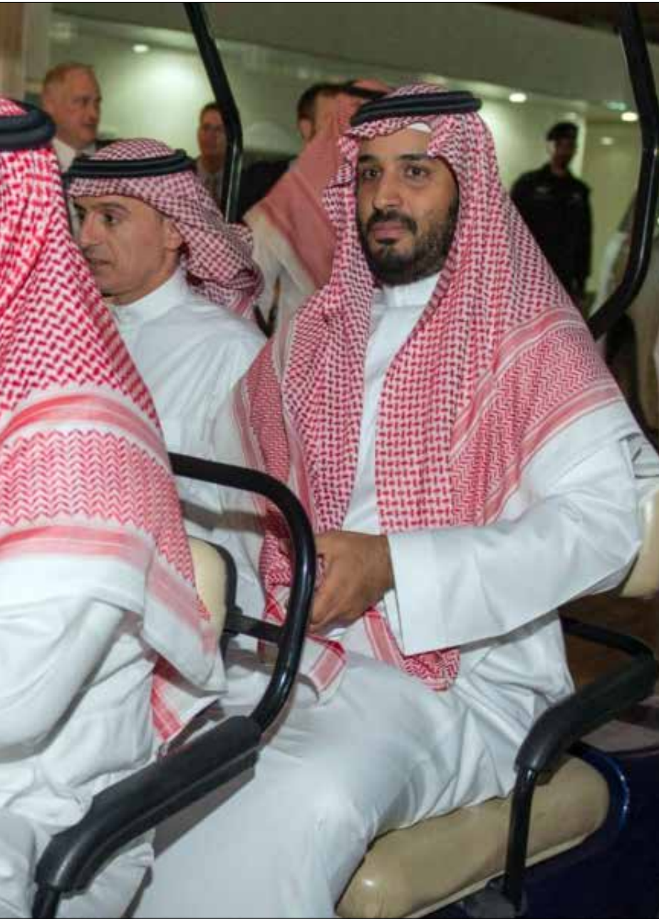
«النكسة»، هي التي استولدت منظومة آل سعود العربية (أ ب)

«بالإجماع»، كما جاء في صحيفة «عكاظ» (العدد 102، 23 أيار 1962). هؤلاء، كما قال الشهيد غسان كنفاني، يحقدون على كل شيء ثوري، «من سبارتاكوس حتى تشي غيفارا». القرار مرتبط أساساً بدور حزب الله في فلسطين، ومن حاول، بالتالي، أن يأخذ موقفاً وسطياً بإعلانه تأييد حزب الله في فلسطين ونقده في سوريا كان جاهلاً بطبيعة القرار وأبعاده، إن كان حسن النية، أو كان متواطئاً سخيفاً في محاولة التذاكي على عقولنا، إن كان سيئ النية. أما من كان موقفه الصمت والسكوت عن القرار من انتهازيين، فسيعرف قريباً أن القرار يطاله أكثر من حزب الله ذاته. حينها لا تلوموا إلا أنفسكم (ستفيدهم كثيراً قراءة كلية ودمنة).