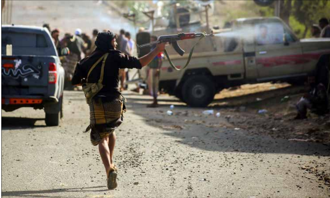
تواصلت المواجهات المسلحة في شبوة بعد هجوم جديد لقوات هادي في بيحان (أف ب)

نفذ «القاعدة» أحكام إعدام في حضرموت بتهم «الشعوذة» و«الفساد في الأرض»