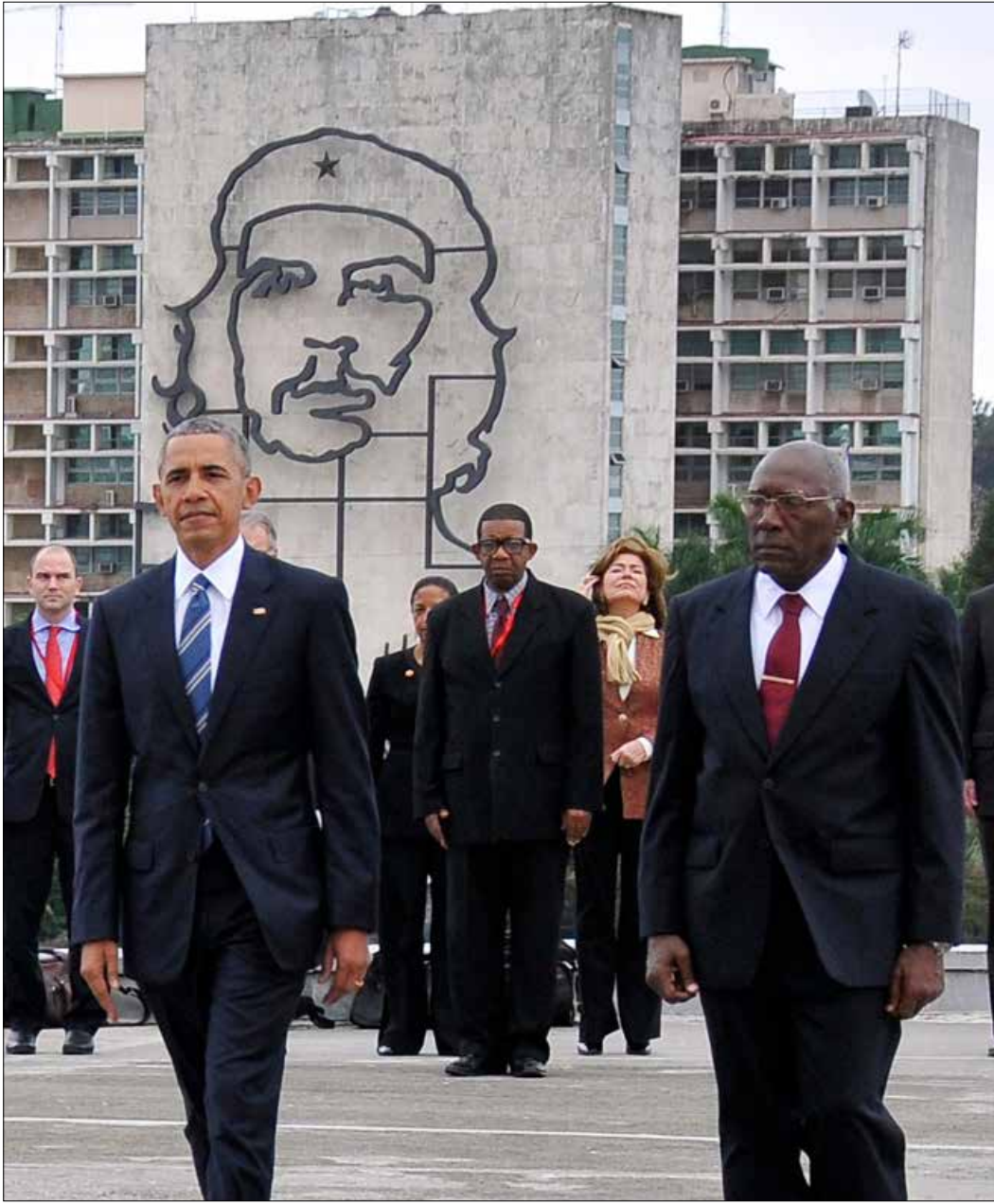
راوول كاسترو، نحت ممتنون لموقف الرئيس أوباما

كذلك، رأت صحيفة «واشنطن بوست» الأميركية في تقرير لها أن الحدث الأكثر تأثيراً على العلاقة بين الولايات المتحدة وأميركا اللاتينية هو زيارة الأرجنتين، إذ إنها تتزامن مع تغييرات سياسية كبيرة في أميركا اللاتينية، وخصوصاً مع تغير المسار السياسي للأنظمة الحاكمة هناك بعد أكثر من عقد من «هيمنة القادة اليساريين الشعبويين المعارضين للولايات المتحدة». وتأتي الزيارة أيضاً في ظل تراجع النمو