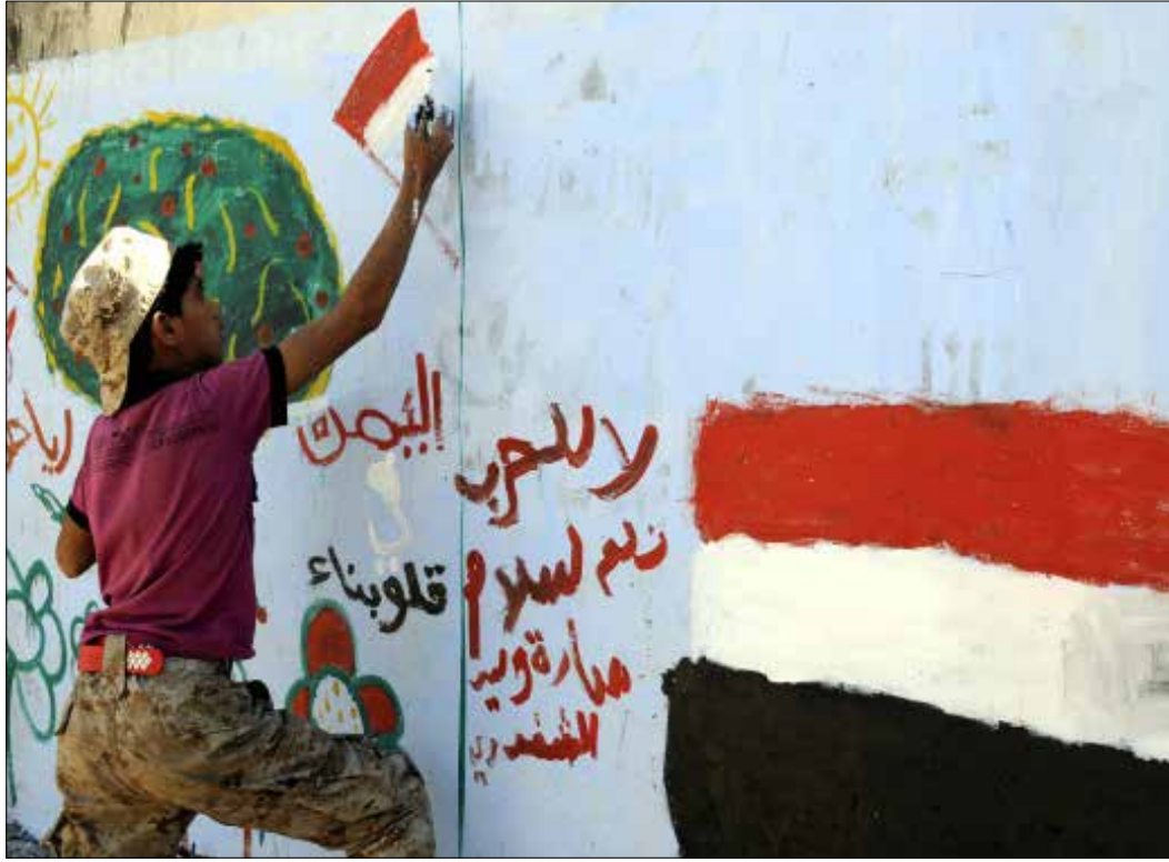
يرى اليمنيون أن تجاربه الهدنة السابقة الفاشلة لا تشجع على التفاوض (الاناضول)

المبعوث الدولي «لم تخرج بأي نتائج إيجابية»، إذ إن حركة «أنصار الله» وحزب «المؤتمر الشعبي العام» تمسكا بوقف تام لإطلاق النار وبرفع الحصار الجوي والبحري قبل التوجه إلى المحادثات، ما قد يقلل من حظوظ التوافق السياسي، ولا سيما مع استمرار المواجهات العسكرية المترافقة مع غارات جوية متقطعة في أنحاء البلاد، في حين أن اتفاق التهدئة شمل الشريط الحدودي بين البلدين فقط.