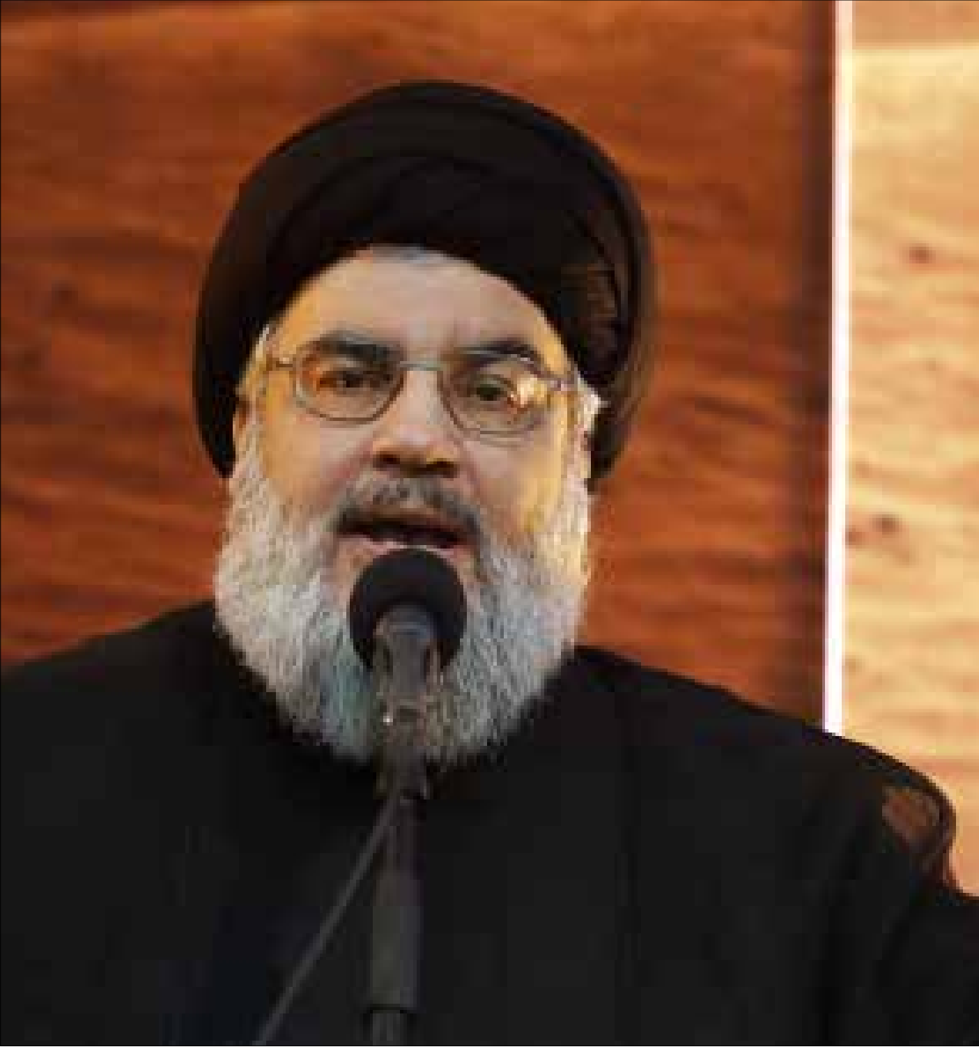
نصرالله: السكوت عن عدوان السعودية على اليمن يعطيها شرعية كي تثنى حرباً في أي بلد عربي (هيلم الموسوي)

بصريح العبارة، قال الأمين العام لحزب الله السيد حسن نصرالله للنظام السعودي: «لن نسكت عن جرائمكم. هشكلتكم معنا، لا مع الحكومة ولا مع الجيش، واجهونا نحن». وكشف نصرالله بأنه يملك أرقام الهواتف التي أدبرت بها، من الرياض، عمليات تفجير السيارات المفخخة في لبنان في السنوات الثلاث الماضية