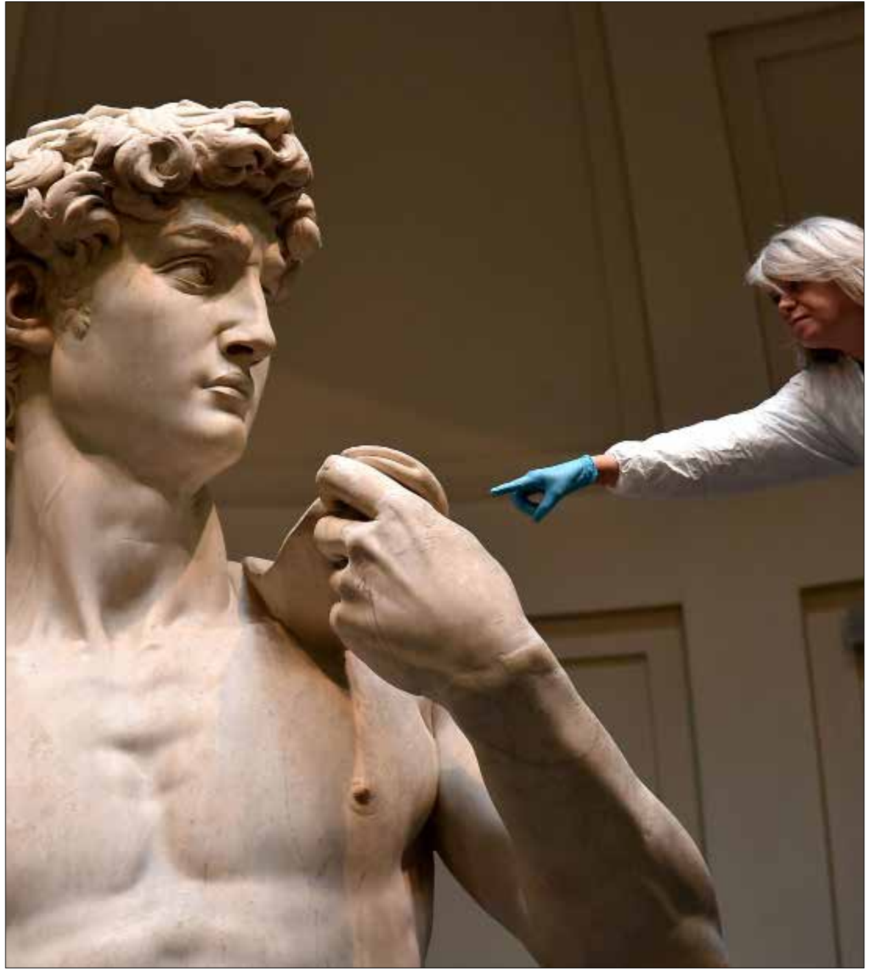
عملت مجموعة من المرفعين الفنيين التابعين لجمعية «اصدقاء فلورنسا» على تنظيف عدد من القطع الفنية الموجودة في «غاليري أكاديميا» في المدينة الإيطالية، بينها «ديفيد» (1501 - 1504) أحد أشهر تماثيل مايكل أنجلو (1475 - 1564).