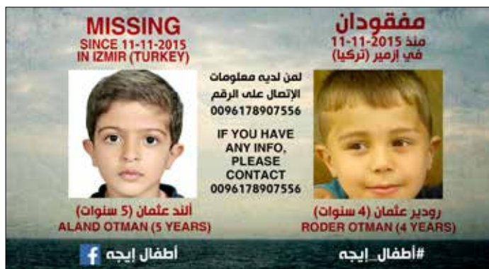
انطلقت «المباين»، حملة «#اطفال إيجه» على منصات التواصل الاجتماعي