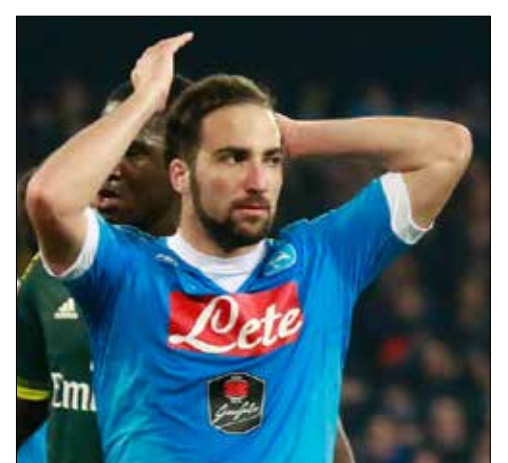
لابريد هيفواين تحديد عقده مع نابولي

لا يزال بقاء النجم الأرجنتيني غونزالو هيفواين من عدمه في صفوف نابولي الإيطالي في الموسم المقبل غير واضح المعالم، لكن الجديد أمس الذي يعطي مؤشراً على عزم مهاجم ريال مدريد الإسباني السابق على الرحيل عن ملعب «سان باولو» لخوض تجربة أوروبية جديدة هو ما ذكرته صحيفة «لا غازيتا ديللو سبورت» المحلية، بأن ممثلي الأرجنتيني طلبوا من إدارة نابولي خفض قيمة فسخ عقده البالغة 90 مليون يورو لعدم رغبة اللاعب في تمديد ارتباطه بناديه الذي ينتهي في صيف 2018. ويدور هيفواين في فلك العديد