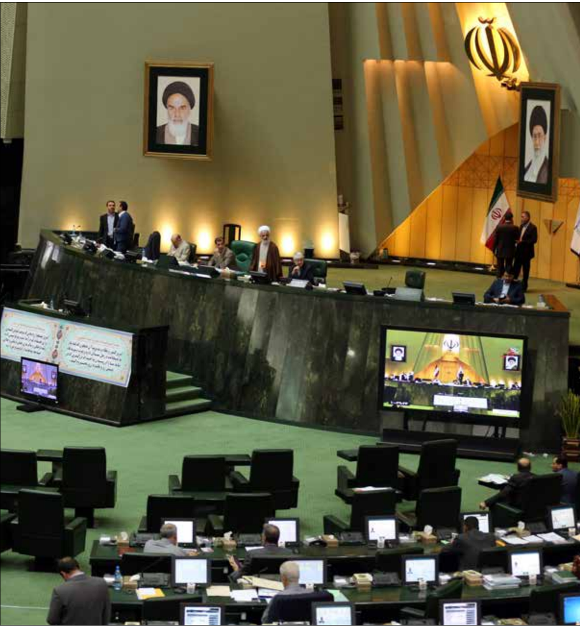
روحاني: في 2013 قال الإيرانيون للعالم بوضوح إنهم يريدون الاعتدال لا التطرف

ورأى أنه «إذا كان هناك أشخاص يعتقدون، حتى الآن، بأن هذا البلد يجب أن يكون في مواجهة مع الآخرين، فلأنهم لم يفهموا رسالة عام 2013»، وقال «في 2013، قال الإيرانيون للعالم بوضوح إنهم يريدون الاعتدال لا التطرف، قالوا بصوت عال نريد التفاهم مع العالم لا المواجهة». أصدر رئيس مجمع تشخيص مصلحة النظام، أكبر هاشمي رفسنجاني، بياناً أعرب فيه عن شكره للشعب الإيراني، وثمن مشاركته