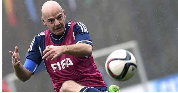
جيانى إنفانتينو خلال مباراة استعراضية مع نجوم سابقين

2018 وفي قطر عام 2022». وتحقق السلطات القضائية السويسرية بظروف منح روسيا وقطر حق استضافة المونديالين وسط ادعاءات بوجود عمليات رشوة.