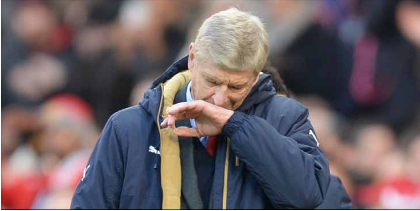
رفض فينغر الانتقادات الموجهة إليه، واصفاً إياها بالمعاطفية جداً

خسر أرسنال أمام برشلونه في ذهاب دور الـ 16 من دوري أبطال أوروبا، ثم خسر أمام مانشستر يونايتد في الدوري المحلي، لتطالب بعض الجماهير برحيل المدرب أرسين فينغر ومجيء مدرب مانشستر سيتي التشيلياني مانويك بيلليغريني خلفاً له