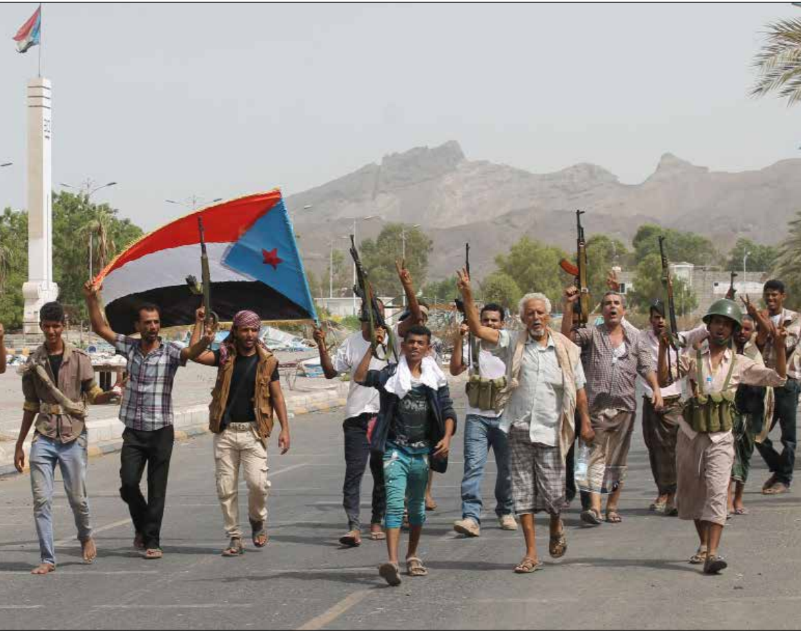
تظنت السعودية خلف مشروم «الأقاليم الستة» بها يبدد أي استجابة لمطالب الجنوبيين

تعالى يوماً بعد يوم الأصوات الجنوبية المنتقدة لاستراتيجية التحالف السعودي في جنوبي اليمن والمطالبة بإجراء مراجعة للمواقف التي اتخذتها قيادات جنوبية منذ بدء العدوان السعودي على هذا البلد. تأتي تلك المطالبات بعدما استشعرت الأجنحة الحراكية التي انخرطت في القتال أنها تقترب من حائط مسدود لا أمل معه في تحقيق أي من الطموحات التي كانت تتطلع إليها، خصوصاً أن للرياض وحلفائها أجندة مهيمنة لا ترى إلى الحراك أكثر من أداة وظيفية