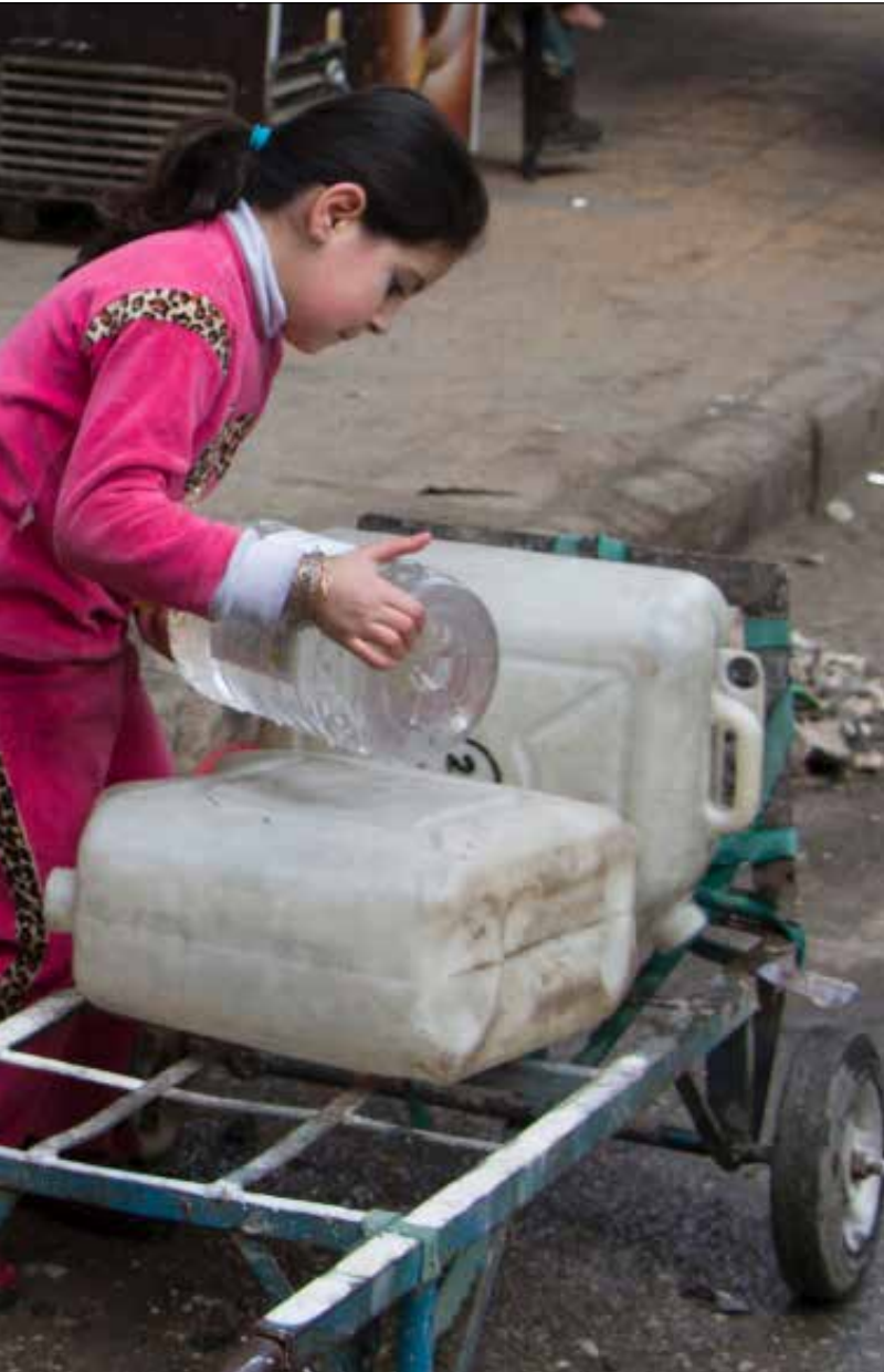
الاقتصاد هو الحامل الأساسي لنجاح الحل السياسي في سوريا

إلى أنّ هزيمة «النصرة» و«داعش» تعدّ شرطاً لا بد منه لضمان حقوق الشعوب المنكوبة في سوريا وشمال أفريقيا بأسرها». وأضاف أن المهمة الأولى في هذا السياق هي منع تدفق الدعم الخارجي إلى الإرهابيين، الأمر الذي يستدعي «إغلاق الحدود السورية مع تركيا التي يجري عبرها تزويد العصابات بالأسلحة». ومساءً أمس، أعلنت وزارة الخارجية الروسية أنّ لافروف ونظيره الأميركي جون كيري جدداً