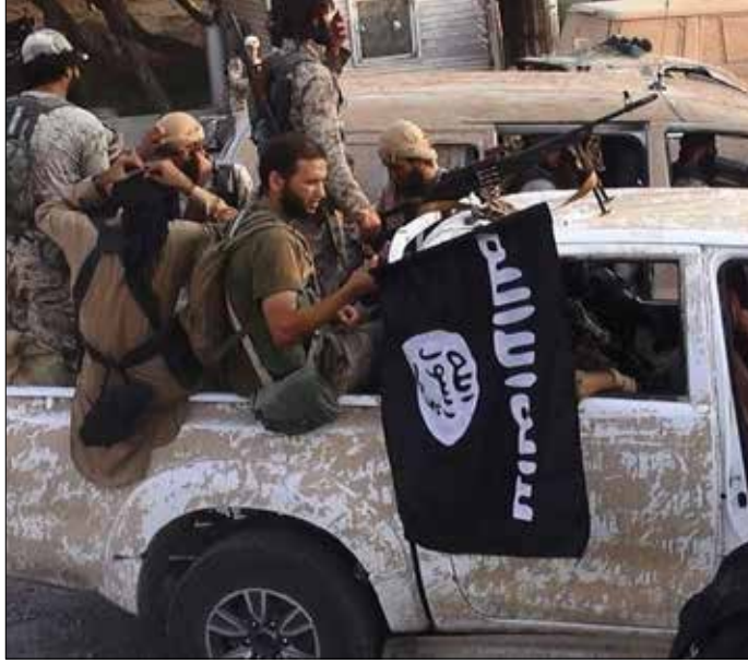
«داعش» استخدم النساء للمرة الأولى في عمليات انتحارية في ليبيا (مت الوب)

رفض مبعوث الأمم المتحدة في ليبيا، مارتن كويلر، أي تدخل عسكري دولي في ليبيا، باعتباره «لن يجلب حلولاً بعيدة المدى»، لافتاً إلى أن العالم رأى ذلك عام 2011. وأكد كويلر أن «مكافحة داعش يجب أن تنطلق من الليبيين أنفسهم»، مضيفاً أن الأمر يتطلب قوات برية، أما الغارات الجوية بمفردها فهي «غير كافية». في المقابل، شدد على «أن ليبيا بحاجة إلى حكومة وحدة وطنية، لأن هذا ما يريده الناس»، داعياً جميع القوى السياسية في البلاد إلى وضع مصالحهم الشخصية وراء مصالح الشعب. ولفت كويلر إلى أن إمكانات دعم الليبيين عديدة، كتدريب القوى الأمنية الليبية، وهو ما تخطط له ألمانيا».