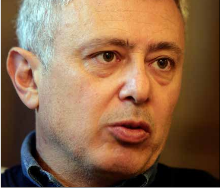
فرنجية لت يشارك في جلسة انتخابات رئاسية إلا بالتنسيق مع الحلفاء (هشام الموسوي)

الأزمة النفايات هو الحل التشاركي، وذلك عبر العودة إلى المطامر الصحية في عدد من المناطق اللبنانية. وعلى أن يكون ذلك بالعدل والتساوي، تمهيداً لتنفيذ الحلول اللازمة على المديين المتوسط والطويل، والتي تحتاج إلى عدة سنوات لإنجازها.