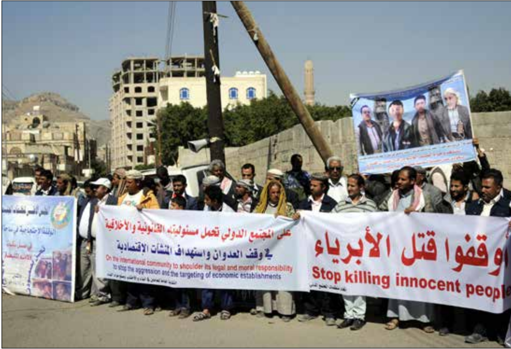
قتل 6000 مدني منذ بدء الحرب في 26 آذار الماضي

مليون نسمة يعانون سوء تغذية شديداً ويحتاجون لمعونات سريعة. وأعرب أوبرايمان عن الأمل في أن يقدم المجتمع الدولي 1,8 مليار دولار لتمويل معونات إنسانية عاجلة. وفي جلسة عقدها مجلس الأمن أمس بطلب من روسيا لبحث الوضع في اليمن، قال أوبرايمان إن نصف القتلى في اليمن تقريباً هم من المدنيين، ووصل عددهم الإجمالي إلى نحو 6000 منذ نشوب الصراع، في وقت جرح فيه 5659 مدنياً، وبلغ عدد الضحايا في صفوف الأطفال 700 وأكثر من ألف جريح.