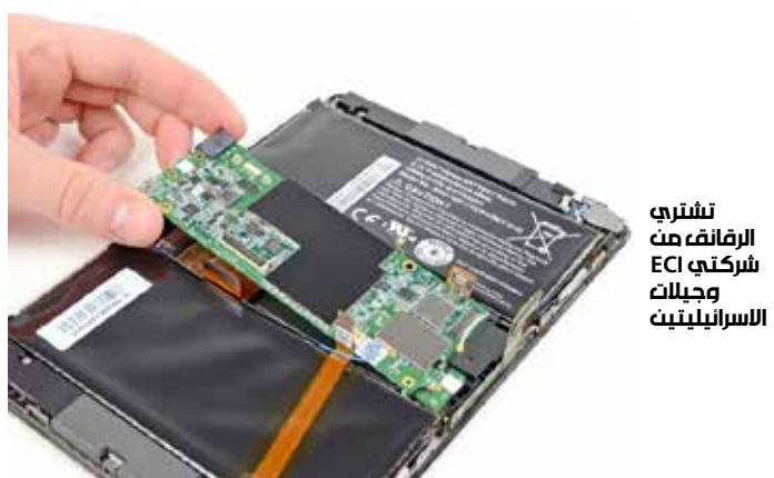
تشيرني الرفائض من شركتي ECI وجيلات الاسرائيليتين

METALINK, PHONET و RADDATEA. في المقابل، ردت خمسة شركات اسرائيلية الزيارة لـ «هواوي» ووقعت معها اتفاقية للتطوير التكنولوجي