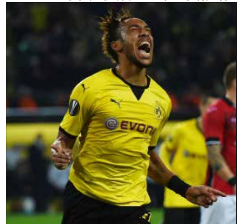
سيرفم يونايتد عرضه لضم أوباميانغ (ارشيف)

كشفت صحيفة "لا غازيتا ديلو سبورت" الإيطالية أن يوفنتوس حاول ضم الأوروغوياني إدينسون كافاني من صفوف باريس سان جيرمان الفرنسي في سوق الانتقالات الشتوية الأخيرة إلا أن عرضه قوبل بالرفض. ووفقاً للصحيفة، فإن "اليوفي" عرض على "بي أس جي" مهاجمه الكرواتي ماريو ماندزوكيتش مضافاً إليه مبلغ 20 مليون يورو مقابل كافاني. وأشارت الصحيفة إلى أن "البيانكونيري" سيعاود المحاولة مجدداً في الصيف المقبل عبر منح اللاعب الأوروغوياني مبلغ 7 ملايين