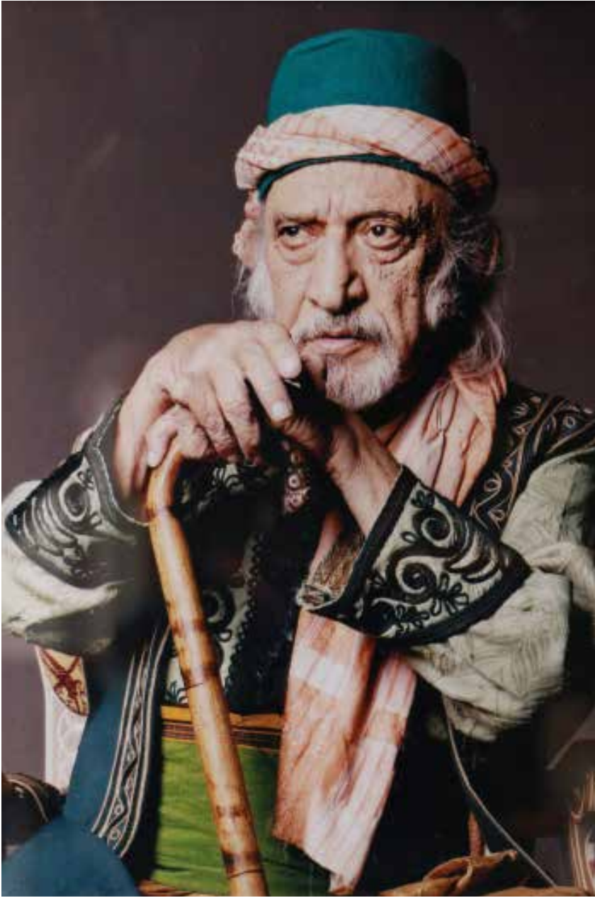
في «أوبرا الضيعة»، لكرلا

مثل الكل (لصباح)، كوكالة أخبار مسرحية، بقلب البقطة الدائمة. يروي الرواة أنه أقام في الفاصلة الكبرى في الحياة الثقافية في لبنان. مسرح الأخوين رحباني. يروي بعضهم أنه مستشارهم. يروي بعضهم أنه أخرج بعض أعمالهم المسرحية. «بياع الخواتم»، «هالة والملك»، «بعيش بعيش» (إخراج صبري الشريف)، «لولو»، «ميس الريم». سواء أو سواء، وجد الجميع شمسهم، في صالات مطارحهم المغلقة. فتحوا الفضاءات المغلقة على العالم، بكل شجاعة. شجاعة فازليان مضاعفة. من بلاد قوية إلى بلاد فتية. اشتغل، بلا أوهام، هنا وهنا. لأن الهناك هنا عنده. وبالعكس. حريص على تعريف الناس بالمسرح، بكل الحالات. سعادته الشاملة في العمل المنتج. بقي الرجل سعيداً، إذا ما قسنا حياته على المعادلة هذه. بهجة وشخصية ونشاط. سوف نُحرم العناصر هذه، بفقدان برج فازليان. رجل الفجر المسرحي. رجل تهذيب المسرح، بقوة لا تُخفق.