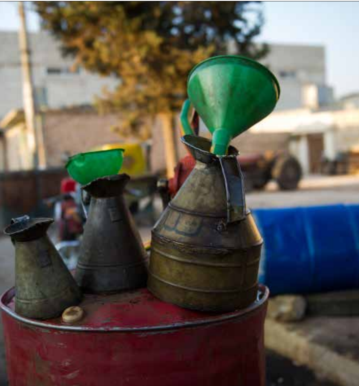
أضحت سيطرة «داعش» على معظم حقول النفط «استقراراً» لتجارة التهريب

بدأ النزف العملي للنفط السوري في عام 2012. بدأ الأمر بخروج الأبار والحقول من الخدمة نتيجة المعارك الدائرة. قبل أن تبدأ مسيرة نهب النفط وتهريبه. «الوية وكتائب» تابعة لـ «الجيش الحر» مهتدة، ثم دخلت على الخط بعض القوى العشائرية قبل أن تلتفت «جبهة النصرة» وحلفاؤها في «الجبهة الإسلامية» إلى الكنز. أخيراً سيطر «داعش» على المشهد بدعم تركي من الألف إلى الياء