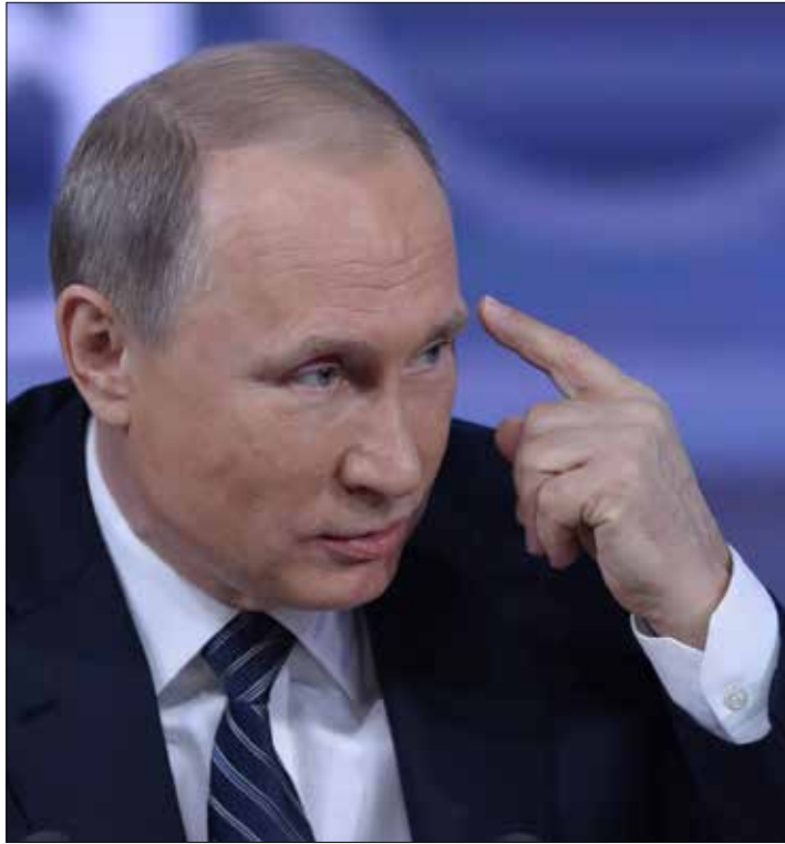
الهجوم على القاذفة الروسية قد يرتبط بمحاولة تركية لإرضاء الأميركيين

من جهة أخرى، اعتبر بوتين أن الهدف الرئيسي وراء قيام تنظيم «داعش» يكمن في حماية الاتجار غير الشرعي بالنفط، من دون أن يستبعد أن تقف وراء ذلك مصالح اقتصادية «لطرف إقليمي ثالث». وفي هذا السياق، أعاد إلى الأذهان أنه، في البداية، نشب في المناطق الغنية بالنفط في سوريا، فراغ السلطة، ومن ثم ظهرت فيها عناصر مرتبطة بالاتجار بالنفط، وتطور هذا الوضع، طوال السنوات الماضية منذ اندلاع الأزمة السورية، حتى جرى استحداث مشروع أعمال لتهديب النفط، بكميات هائلة. وقال «من ثم اتضح أنه من الضروري أن تكون هناك قوة عسكرية تحمي عمليات التهريب هذه، ومن المناسب استغلال العامل الإسلامي وجذب طعام للمدافع إلى هناك تحت شعارات إسلامية، على الرغم من أنها تشكل مجرد الية في لعبة مرتبطة بالمصالح الاقتصادية.. وفي نهاية المطاف تشكل «داعش» (الأخبار)