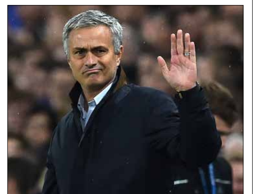
مورينيو هو المدرب الأجنبي في تاريخ تشلسي

كما كان متوقعاً، أقبل البرتغالي جوزيه مورينيو من منصبه مدرباً لتشلسي، إذ ذكر النادي الإنكليزي في بيان له أمس: «تشلسي ومورينيو قررا الاقتراح بالتراضي»، مضيفاً: «كل من في تشلسي يشكر جوزيه على مساهمته الهائلة منذ عودته إلى النادي كمدرب في صيف 2013». وتابع: «إن الألقاب الثلاثة التي حصل عليها في الدوري، إضافة إلى لقب في الكأس وآخر في درع المجتمع وثلاثة في كأس الرابطة خلال المرهلتين اللتين أشرف فيهما على الفريق، تجعله المدرب الأكثر نجاحاً في تاريخ النادي الذي يمتد لـ 110 أعوام».