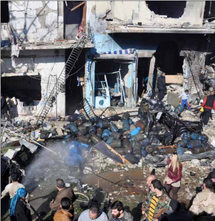
أكثر من 50 تفجيراً ضربت وسط البلاد خلال العامين الماضيين (أ ف ب)

معظم التفجيرات السابقة، منذ حادثة مدرسة عكرمة ترافقت مع صيحات غضب رفعها أهل المدينة عبر اعتصامات ووقفات احتجاجية على تردي الوضع الأمني في حمص، التي دخلت الصراع المسلح مبكراً وغادرت قبل بقية المدن. معظم هذه الانفجالات لم تلق أذاناً صاغية، فالجميع في حمص يدفع ضريبة الحرب المشتعلة على امتداد جبهات البلاد، على ما يقوله أهل المدينة.