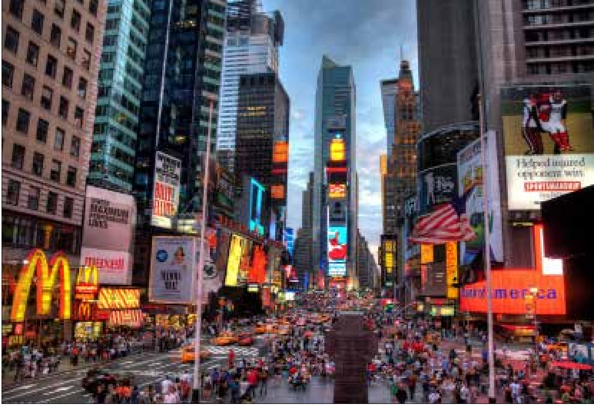
سكان المدن ينفقون أكثر من باقي سكان البلد بنسبة 94,4%

ولفت تقرير آخر صدر عام 2014 عن The Economist Intelligence Unit الى أنه وعلى مستوى منطقة الشرق الأوسط وأفريقيا فإن معدل دخل الفرد في المدن يفوق بـ 20% معدل دخل الفرد على مستوى البلد ككل.