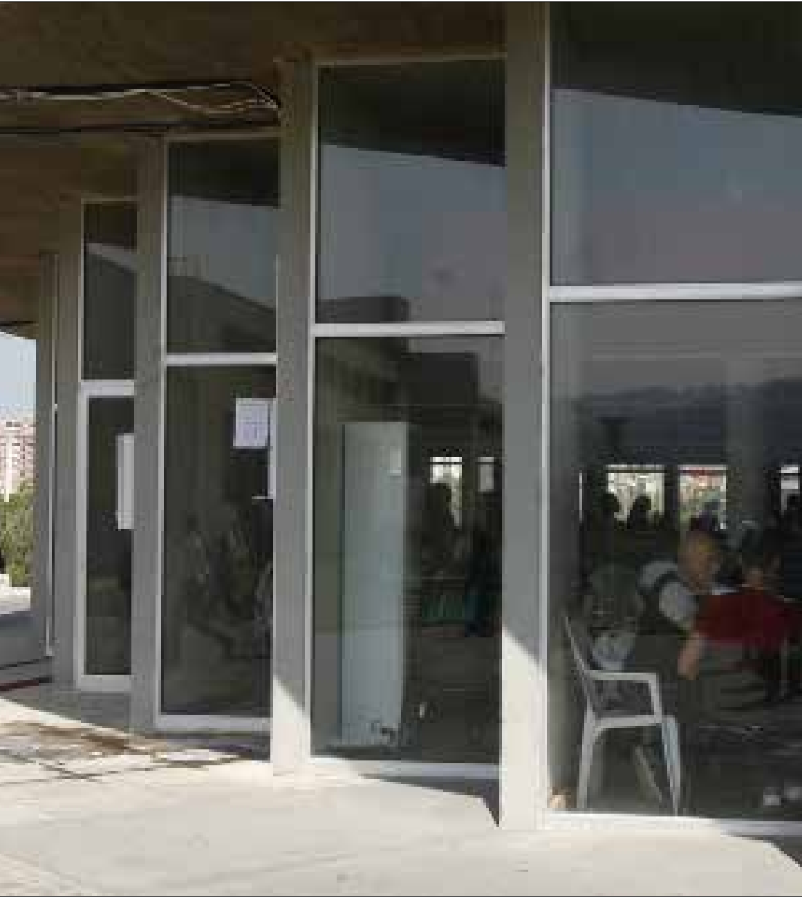
إدارة الجامعة تقول إنها هي التي طلبت من الشركة وقف عملها نتيجة تخلفها عن الدفع

على غرار ما تؤمنه جامعات عريقة أخرى، وهذه المساحة، وفق الخطيب هي التي «كانت تسمح لنا باللقاء بزملائنا داخل الصف، لنكمل ما بدأناه من أحاديث وحوارات بيننا». يذكر أن المكتبة هي المساحة الأخيرة التي تجمع الطلاب خارج الحرم، وهي مخصصة حصراً للدراسة، ولا يمكنها أن تجمع مجموعة من الطلاب لغير ذلك.