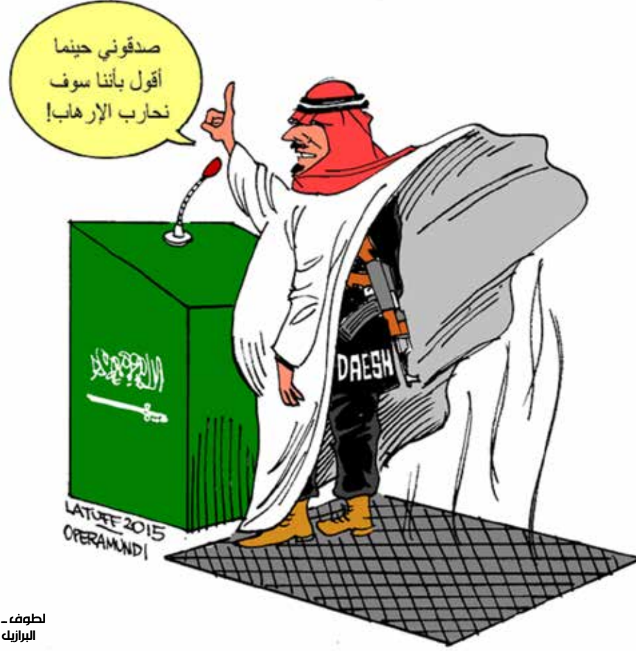
لطوف - البرازيل

كل تلك الجعجة تهدف إلى تكريس الأمير إعلامياً بوصفه المحارب الأول للإرهاب