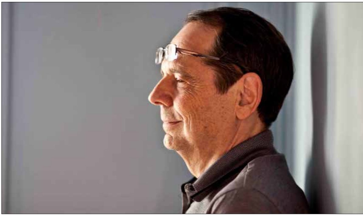
هذا المشروع الذي يقسم العالم بين «نحن» و«هم» هو مشروع مدمر

السياسي الفرنسي حالياً والمرتبطة بما يحدث من أعمال إرهابية في فرنسا. يقول غريش: «كان إعلان حقوق الإنسان عالمياً، ولكن لا يمكن تطبيقه على الشعوب «المختلفة»». ويضيف الكاتب إن تقسيم الإنسانية إلى «حضارية» و«بربرية» الذي استخدمته الإدارة الأميركية في حربها ضد الإرهاب استند إلى «شبه» علم جديد هو الاستشراق الذي حدّد ادوارد سعيد وجهه المزدوج القائم على تمييز وجودي ومعرفي بين الشرق والغرب، بينما العلاقة بين الغرب والشرق هي علاقة سيطرة وعلاقة سلطة وهيمنة.