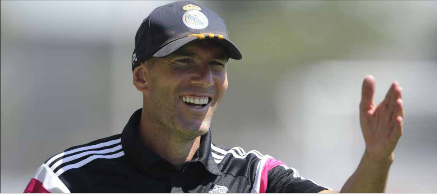
أسباب كثيرة ترشح كفة زيدان لتسلم المنصب (أرشيف)

تصّب معظم الترجمات في خانة إقالة رافايك بينيتيز من تدريب ريال مدريد عاجلاً أو آجلاً. أما الأقرب لخلافته، عاجلاً أم آجلاً أيضاً، فهو نجم الفريق السابق زين الدين زيدان. أسباب كثيرة ترفع من أسهم الفرنسي لتسلم المهمة