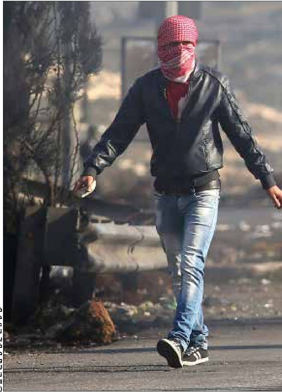
في كل خمسة عشر عاماً تقريباً، يخرج جيك فلسطيني منضم ومستعد لاستعادة تجربة الجيك الذي سبقه (الناضول)

فياض قد نخرت إلى حد كبير العزائم، وأثقلت عموم الفلسطينيين بالديون أو جعلتهم أسرى رواتب الحكومة ومعاشاتها. فإن خطط الاستيطان قد نخرت الأرض، وأثقلت عموم الوطن بواقع مأساوي جديد. ومن الملفت للانتباه أن الانتفاضة الثانية، ورغم العنف الشديد الذي اتسمت به، وبرغم خسائر الإسرائيليين المرتفعة نسبياً، فإنها لم توقف عجلة الاستيطان، ولم تستطع أن تبطل وتيرته. وتشير الإحصائيات الرسمية الفلسطينية إلى تزايد في أعداد المستوطنين بمعدل 15700 مستوطن سنوياً في الفترة الممتدة من عام 1993 إلى عام 2000. وأما في سنوات الانتفاضة الثانية (ما بين عامي 2000 و2005) فقد كان المعدل 14600 مستوطن سنوياً. بينما كانت الأرقام في سنوات ما بعد الانتفاضة الثانية 16400 مستوطن في السنة، وهذه كانت فترة الأمان والرخاء للمستوطنين