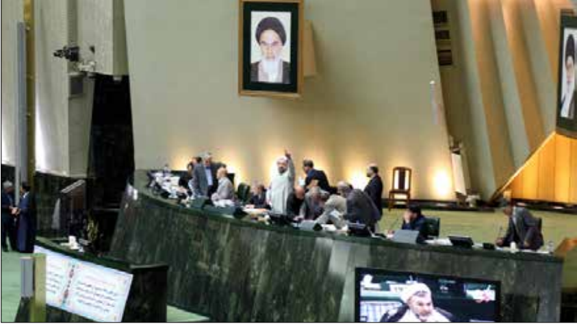
جاء التصويت بغالبية 161 صوتاً ومعارضة 59

ذكر موعد بدء تسليمها. وأوضح ريباكوف أن المفاوضات من أجل إعادة هيكلة المحطة النووية في منطقة «فوردو» الإيرانية من قبل بلاده ستبدأ بعد بضعة أشهر، مؤكداً أن المفاوضات تتطلب مرحلة إعداد حساسة للغاية. (الأخبار)