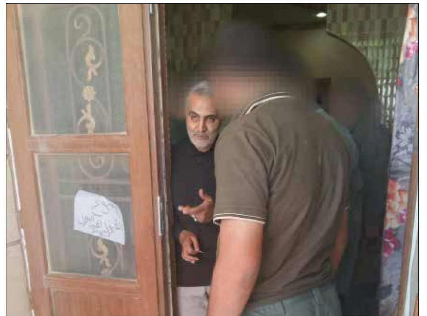
قاسم سليمانبي في بيجي (الأخبار)

وفصائل المقاومة العراقية، في سبيل وضع خطة المعركة وإدارتها. كذلك يبذلون جهداً جهيداً في العمل الاستخباري لجمع المعلومات عن معسكر العدو واستعداداته. يدخل على هذا الخط «المسيرات»، طائرات استطلاع ومراقبة، التي تجوب السماء بيجي، راصدة كل كبيرة وصغيرة. إلى جانب المعلومات المستقاة من الهاربين من مناطق سيطرة «داعش»، ومعطيات تحصل عليها من إفادات الأسرى الذين اعتقلتهم أكثر من جهة، فضلاً عن رصد الاتصالات وتعبئها. وكل هذه المعطيات يسلمها «ضباط المعلومات»، بعد أن «تسجل» على الخرائط على هيئة أهداف وإحداثيات، إلى كتائب الحشد الشعبي.