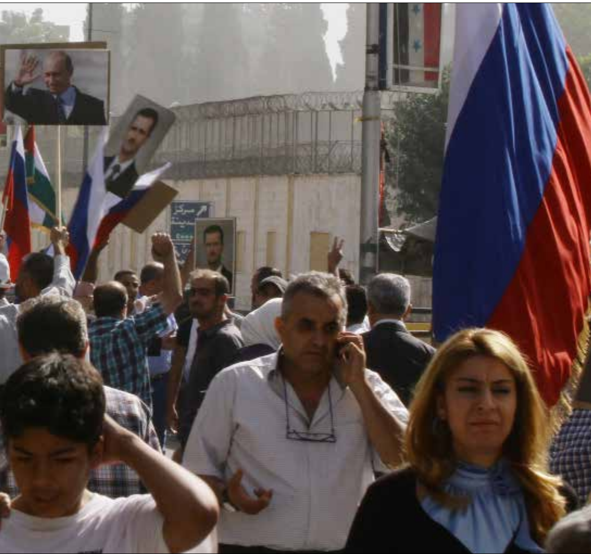
من تظاهرة امام السفارة الروسية في دمشق، امس، لـ «شكر روسيا على دعمها الجوي»