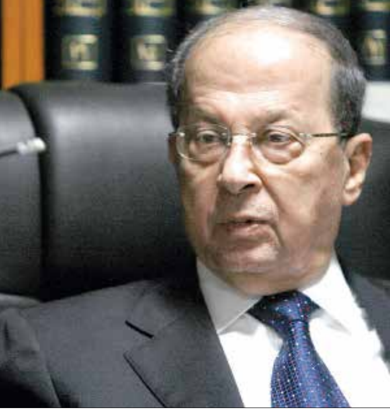
عون: سليمان والجميل واجهة لتعطيل التسوية