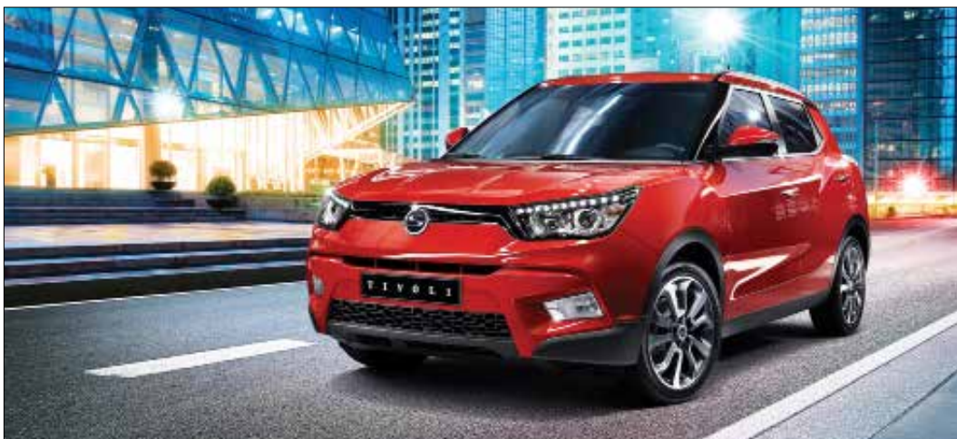
«سانغ يونغ» اليوم رابع أكبر مصنع للسيارات في كوريا الجنوبية

لم تولد «سانغ يونغ» لصناعة السيارات في الأمس القريب، بل ان عمرها يناهز 63 عاماً في عالم السيارات. فالشركة الكورية الأصل اعتادت منذ عام 1954 صناعة المركبات ذات الدفع الرباعي، إضافة إلى الحافلات والشاحنات الكبيرة التي اتسمت بمراعاتها للمعايير الأوروبية منذ ذلك الوقت. قد يجهل كثيرون تاريخ شركة «سانغ يونغ» التي تعد رابع أكبر مصنعي السيارات في كوريا الجنوبية، والتي برزت عام 1955 كأعظم صانع سيارات كوري متخصص في إنتاج السيارات العملية ذات الدفع الرباعي