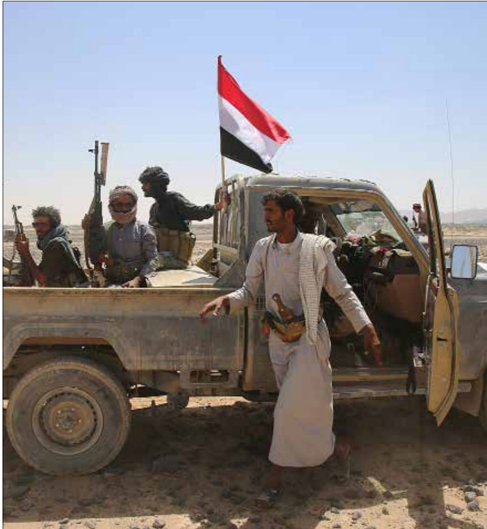
أطلق الجيش و«اللجان الشعبية» أربعة صواريخ كاتيوشا على معسكر كوفل في مارب (أ ف ب)

بستمرّ التعنّت السعودي تجاه التقدم في أي مسعى لبلورة حلّ للأزمة اليمنية، حيث أكد وزير الخارجية السعودي عادل الجبير، أمس، أن وقف القتال في اليمن «بيد الحوثيين والرئيس السابق علي عبدالله صالح» في تأكيد على مضي السعودية في تجاهل نتائج المحادثات السابقة والمبادرة الأخيرة لحركة «أنصار الله» وحزب «المؤتمر» في العاصمة العمانية مسقط. وقد حذّر المبعوث الدولي إلى اليمن، اسماعيل ولد الشيخ، أمس، من «خطورة الأوضاع في اليمن»، داعياً إلى العودة إلى محادثات السلام.