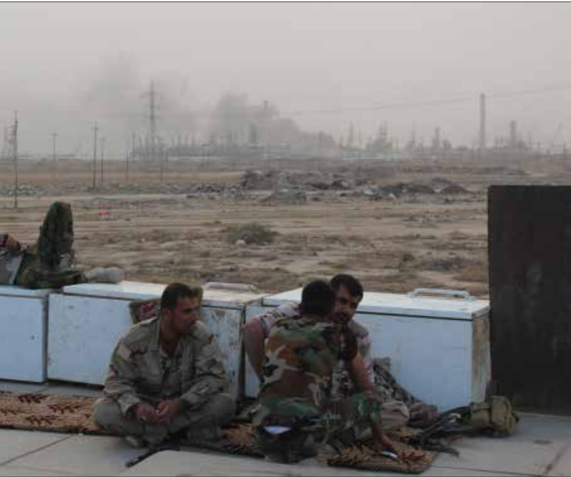
الانظار متجهة إلى بيجي، العقدة التي تتوسط الطريق المؤدي إلى أرض «الخلف» (الأخبار)

وصل قائد فيلق القدس في الحرس الثوري الإيراني قاسم سليمانبي إلى بيجي قبل يومين ثم انتقل إلى سوريا. استراح في الغرضة التي أعدت مسبقاً لاستقباله، داخل معسكر يشكك غرضة عمليات أمنية واستخبارية بقيادة عراقية. تضم خبراء من الحرس الثوري وحزب الله. أما المعلومات الميدانية، فتكشف أن المعركة ستستمر خلال الساعات القليلة المقبلة لاستعادة بيجي كاملة