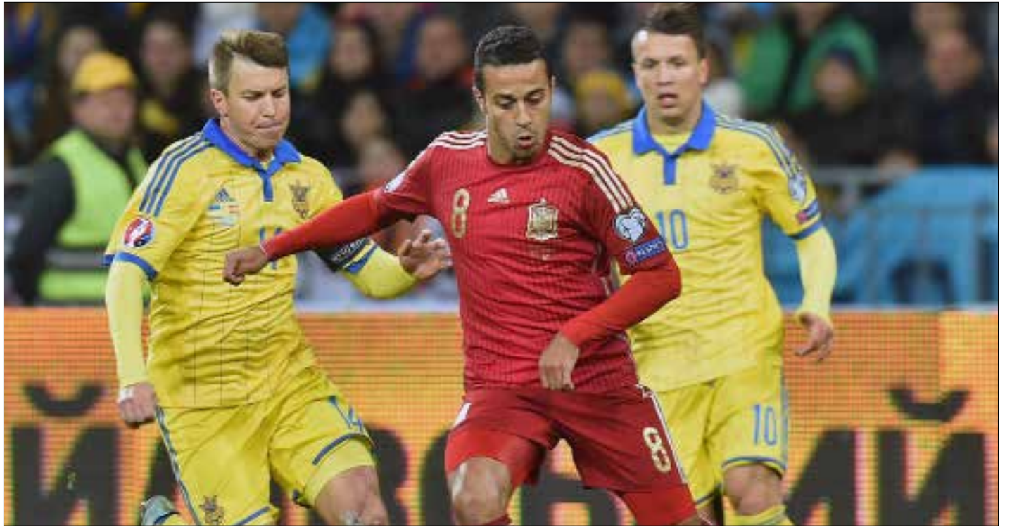
الكاتارا خلك المباراة ضد اوكرانيا