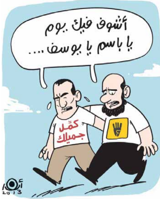
أندك - مصر

وسط زيادة السقطات التي يسجلها إعلاميون في المحروسة، يعود إلى الواجهة سؤال أساسي حول إذا ما كان وجود «جون ستيفارت العرب» على الهواء مفيداً للحد من مستواه الانحدار؟