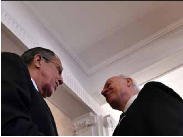
لافروف: هدف عمليات التحالف الدولي إضعاف الجيش السوري

للأزمة مستقبلاً». كلام الجبير أتى في المؤتمر الصحفي الذي عقده مع نظيره الفرنسي، وقال خلاله إن حل الأزمة السورية يتم من خلال خيارين: سياسي عبر «التوصل إلى حل بتشكيل مجلس لفترة انتقالية لإدارة شؤون البلاد»، والحل الثاني عسكري «من خلال دعم المعارضة السورية المعتدلة»... وفي الحالتين: «لا وجود للأسد».