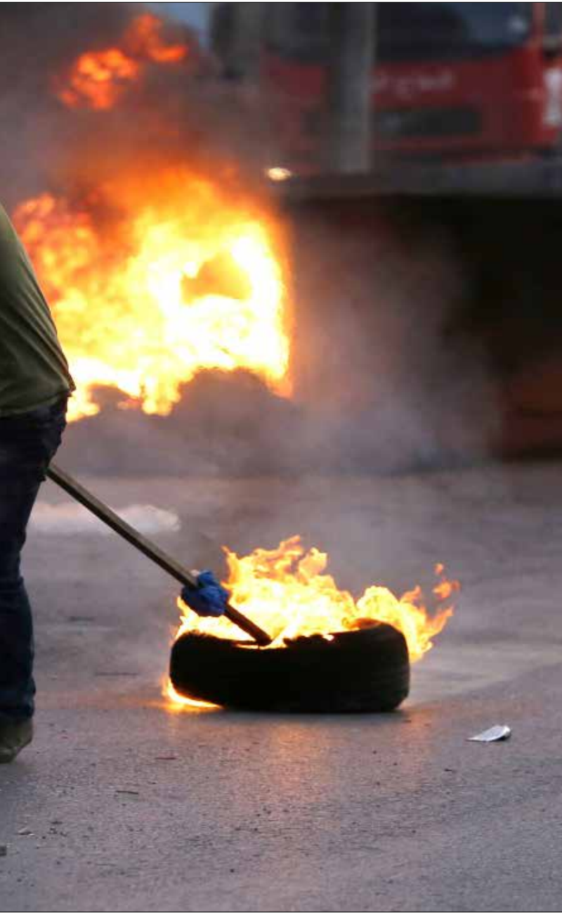
الغطاء الذي توفره إسرائيل للمعتدين ليس إلا عقاباً لفلسطيني الـ 48 على تلاحمهم مع إخوتهم

الحدث تبدّل كل شيء في الأراضي المحتلة عام 48. مشهد عام 2000 يعود إلى الواجهة. شبان لم يجدوا حزبا ينظمهم انطلقوا إلى الشوارع بدلاءً مليئة بالحجارة يرشقون بها عدوهم. منتقلين من خط مواجهة إلى آخر