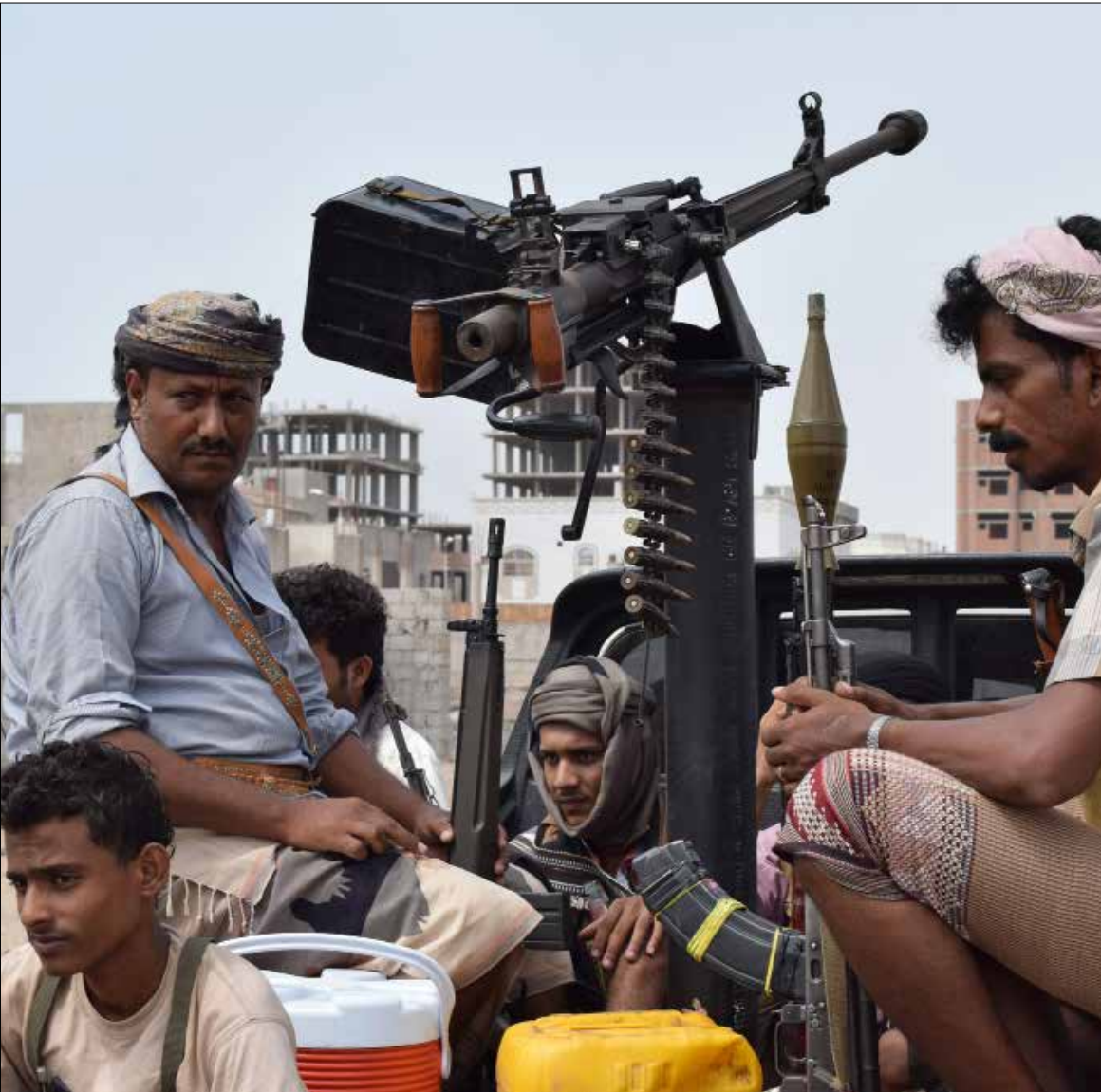
اتهمت المجموعات المسلحة في نزح السعودية بالتخلي عنهم وبيعهم

استجمع التحالف السعودي قوته لمحاولة تطويق صنعاء من مأرب شرقاً حيث شنت قواته عملية برية واسعة أمس. تمهيداً لـ «فتح الطريق» إلى العاصمة. أما «انصار الله» فتؤكد امتلاكها مام المبادرة في مأرب إلى جانب سيطرتها على المدينة. وأن معركة السعودية هناك «لن تكون سهلة»