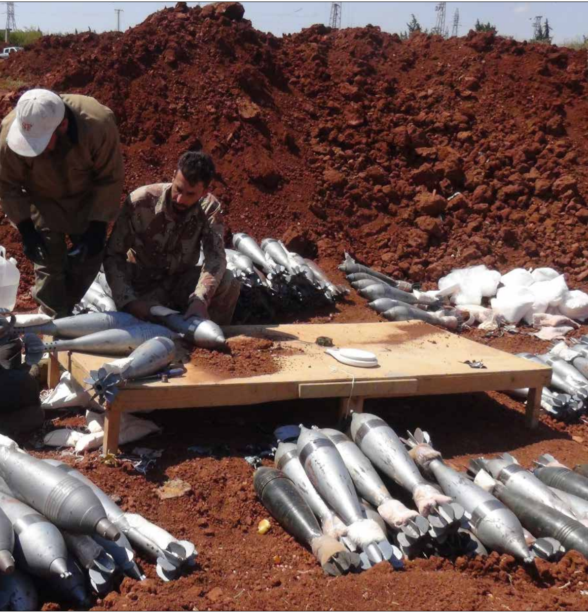
تحضيراً لقصف كفريا والفوعة ببنات القذافي

مشهد ميداني بعد فشل ربط «تسوية الزبداني» بكفريا والفوعة، ووصول الجيش إلى المراحل الأخيرة لتحرير المدينة الدمشقية، كثف مسلحو «جيش الفتح» من استهدافهم للبلدتين الإقليميتين المحاصرتين. تزامناً مع محاولات حديثة لإحداث خرق بري