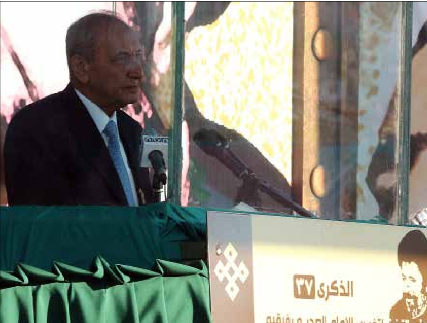
تستند دعوة بري للحوار إلى معلومات عن حوار سعودي - إيراني جذبي

تشكك دعوة الحوار التي وجهها الرئيس نبيه بري، مخرجاً للقوى السياسية في ظلّ حالة العجز التي وصل إليها النظام السياسي برمته. لا آمال كثيرة تعلّقها القوى السياسية على النتائج، سوى الحفاظ على التهدئة بانتظار المسارات الإقليمية