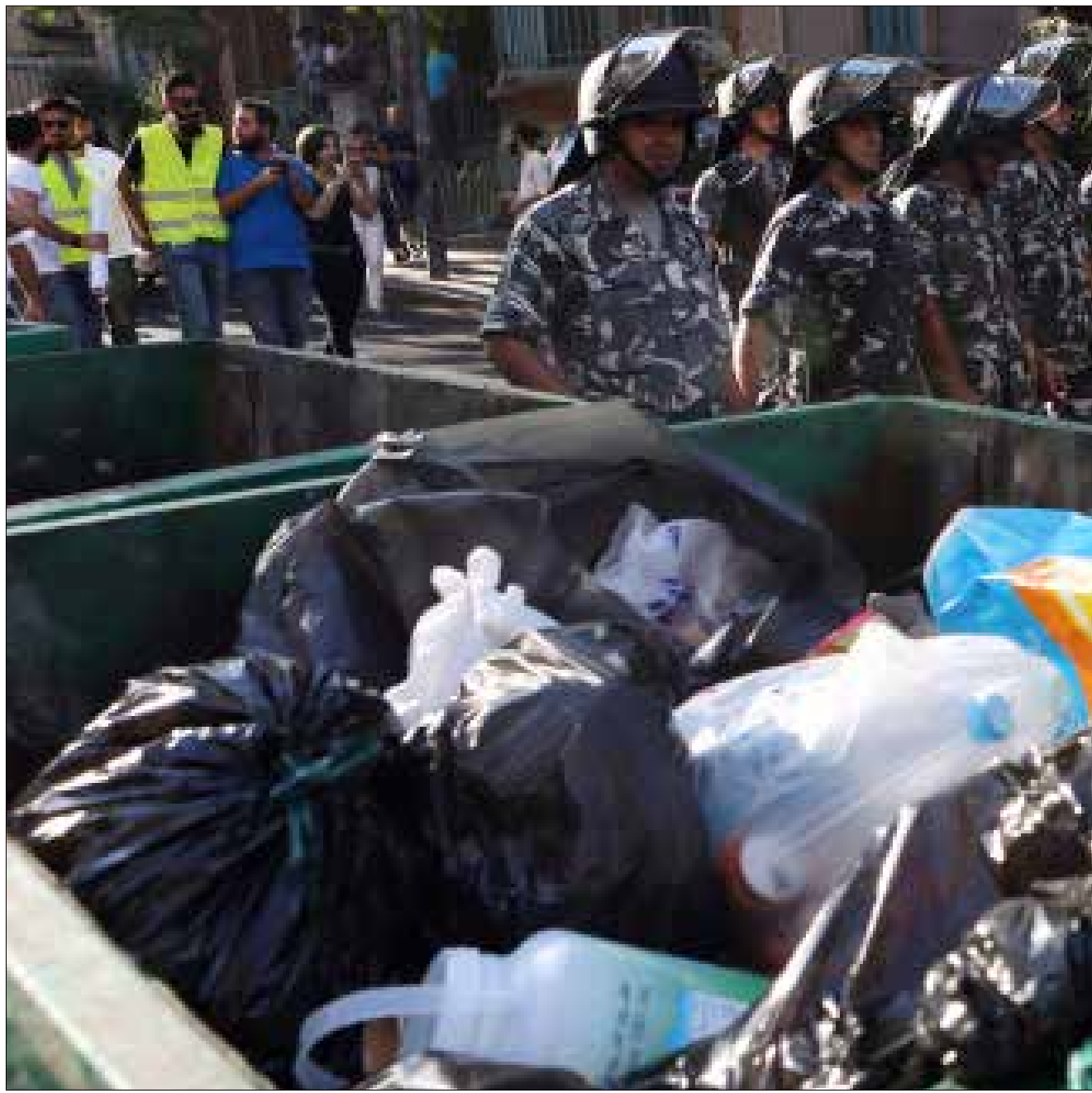
تقترح وزارة البيئة التفاوض مع الشركات التي فازت لخفض اسعارها قدر الامكان (مروان بو حيدر)

يتقاطع اقتراح وزارة البيئة بتحرير اموال البلديات من الصندوق البلدي المستقل، مع مطالب المتظاهرين، لكن مجلس الوزراء الذي قارب هذه المسألة على نحو عابر في جلسته الماضية، لن يستطيع اقناع اي جهة بأنه جاد في هذه المسألة طالما لم تقترح وزارتها المالية والداخلية بصورة عاجلة مشروع مرسوم بتوزيع هذه الاموال للموافقة عليه في اقرب جلسة. والاهم، ان هذا المرسوم الذي يفترض ان يوزع قرابة 2300 مليار ليرة على البلديات، يجب الا يتضمن عملية مقاصة