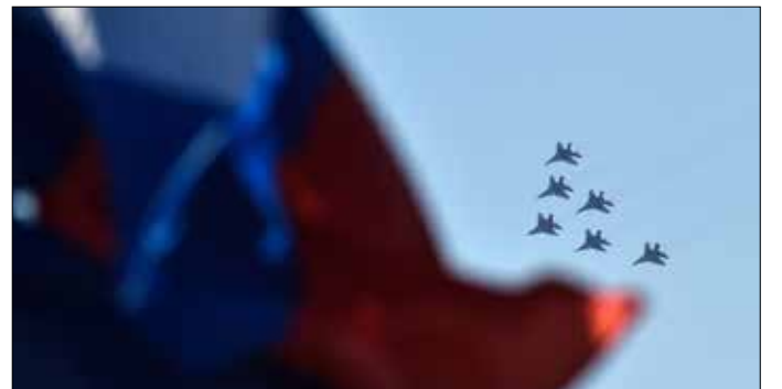
طيارون روس سيطرون في الأيام القليلة المقبلة إلى سوريا

للمدينة، باتجاه وسطها، وسيطروا على حي الجسر ومدرسة الشريف الإدريسي، وكامل الشارع الرئيسي للحارة الغربية، وسط حالة من «الضياع والتشتت» في صفوف المسلحين، بحسب مصدر ميداني. وأضاف أن التقدم جاء بعد اشتباكات ضد المسلحين، حيث تقدّمت القوات على محورين، من دوار الكهرباء ودوار شارع بردى، ناحية مبنى الكنيسة وسط المدينة،