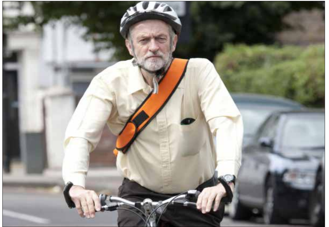
تبلورت مظاهر قيادة كوربن لحزب «العمال» بالتوازي مع إظهار استطلاعات الرأي فوزه