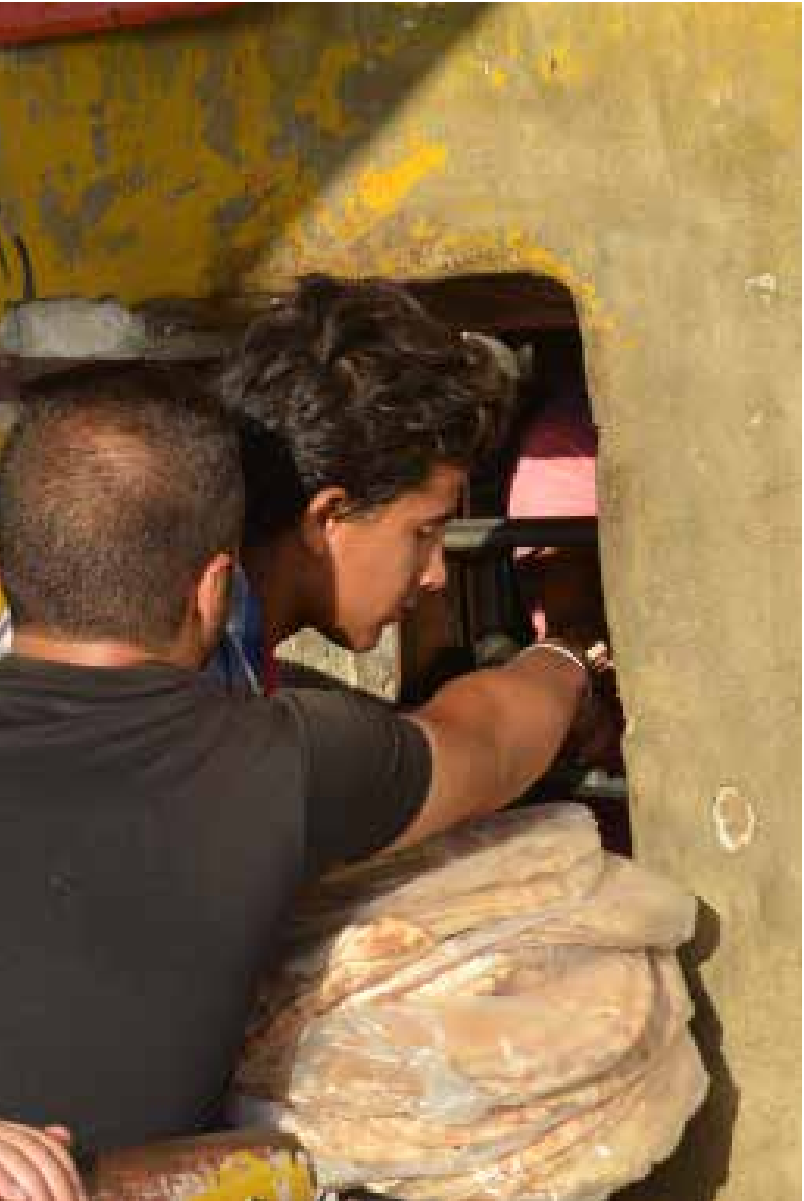
بعض البيوت في القرية التي تقع تحت سيطرة المسلحين لا يتركها أهلها خوفاً من سرقتها

إلا أن تقرير المعركة يكشف عن أن «المسلحين قصفوا العقول في قذائف الهاون»، إضافة إلى «حشو قذائف بالكبريت»، ما سبّب حالات اختناق في صفوف عدد من الجنود.