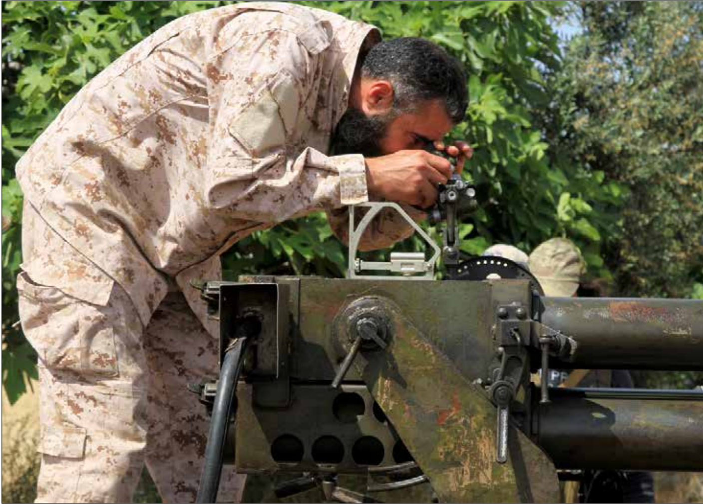
فئك المسوول الميداني في «الجهة الشامية» أثناء المواجهات في حي جمعية الزهراء غربي حلب