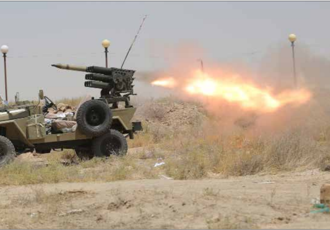
شهدت المناطق الغربية لمدينة الرمادي تقدماً ميدانياً تمكنه بتحرير عدد من المناطق

العراق - أطلقت الحكومة العراقية أمس عمليات تحرير محافظة الأنبار من سيطرة «داعش» بعد نحو عام ونصف من اجتياح التنظيم. عقب فض ما سمي ساحات الاعتصام، لتكون بذلك آخر المعارك التي تخوضها القوات العراقية لتأمين محيط العاصمة وحزامها. فيما يجري الحديث عن صفقات تقضي بإخراج عناصر «داعش» من المحافظة وفق سيناريو تحرير تكريت