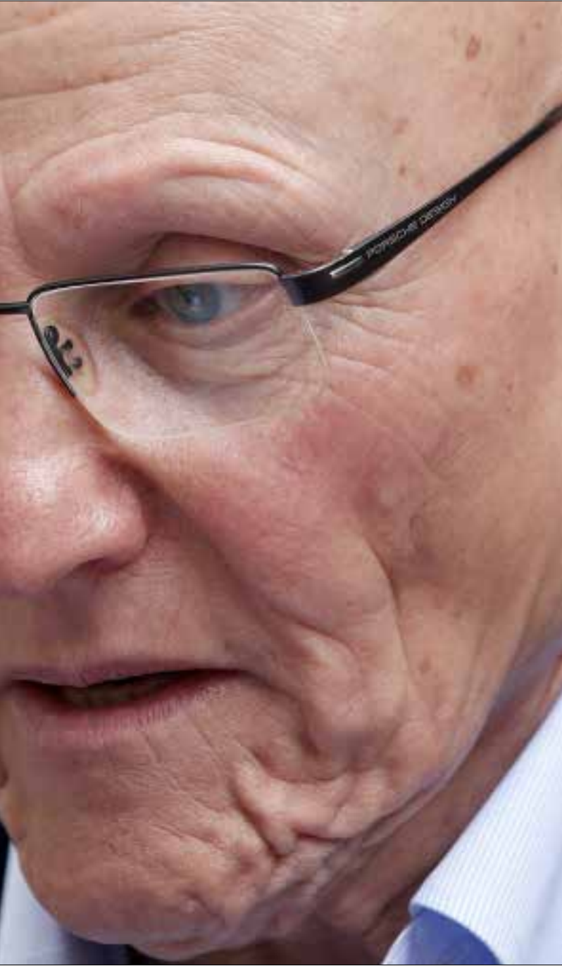
اطاحت النفايات الآلية الأولى، والتعيينات العسكرية والأمنية الثانية، ثم ماذا؟ (هيثم الموسوي)

جنسلاط. ما لبثت ان تسببت الآلية الثانية بمعارضة وزراء لها اخصهم المستقلين، بأن تجمعوا في ما دُعي «اللقاء التشاوري» تحت مظلتها الرئيسيين امين الجميل وميشال سليمان كي يقول الوزراء الثمانية انهم هم أيضا يملكون حق الفيتو، ويرفضون معاملتهم على هامش مجلس الوزراء.