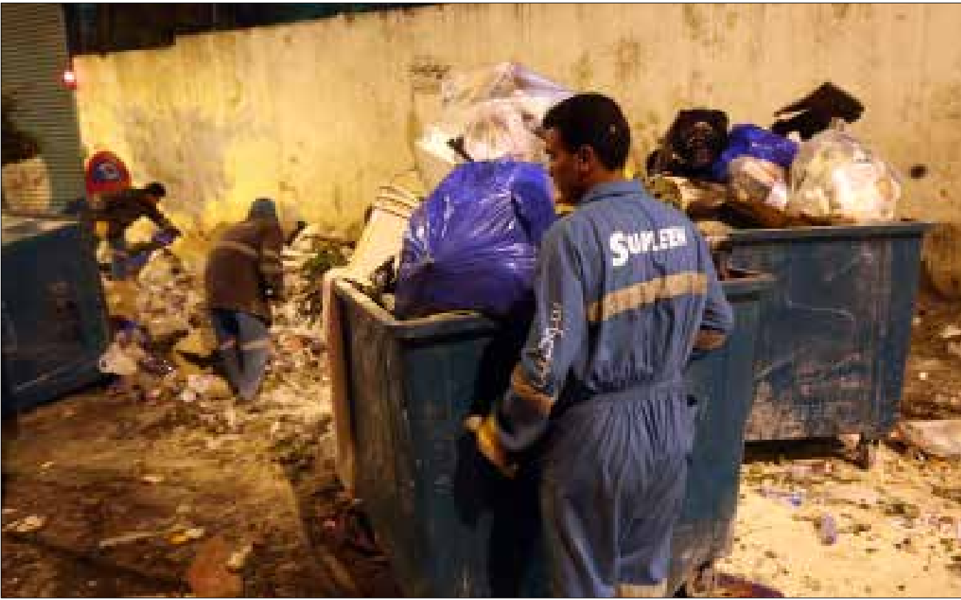
11 شركة تقدمت بعروض لمعالجة النفايات في 5 مناطق خدماتية