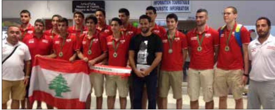
لاعب المنتخب الناشئ في المطار بعد وصولهم الى بيروت