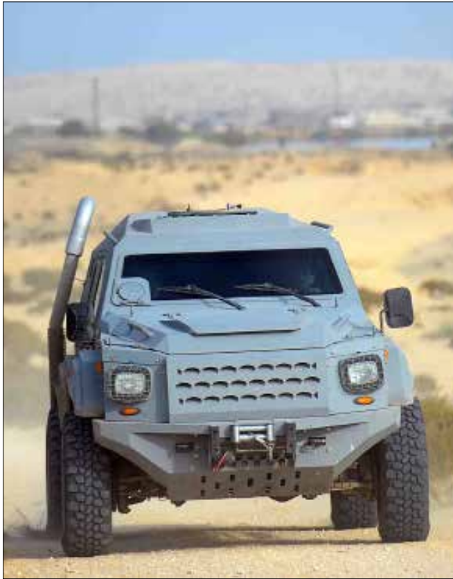
أثار قرار حظر سير مركبات الدفع الرباعي في بعض مناطق سيناء غضبا شديدا

ويستخدم مسلحو تنظيم «ولاية سيناء» لتنفيذ عملياتهم ضد قوات الجيش والشرطة سيارات دفع رباعي من طراز «كروز»، وهو النوع الوحيد الذي يستخدمونه في مناطق العمليات شرق العريش وجنوب الشيخ زويد ورفح، لكن قرار رئيس مجلس الوزراء المصري من شأنه إلحاق الضرر بمصالح المواطنين، لتكمن خطورة القرار في احتمال زيادة الغضب الشعبي لدى الأهالي. غضب قد يؤدي إلى مزيد من العمليات ضد قوات الجيش. الجدير بالذكر أنه سبق أن صدر قرار من الرئيس، عبد الفتاح السيسي، بحظر التجوال بمناطق