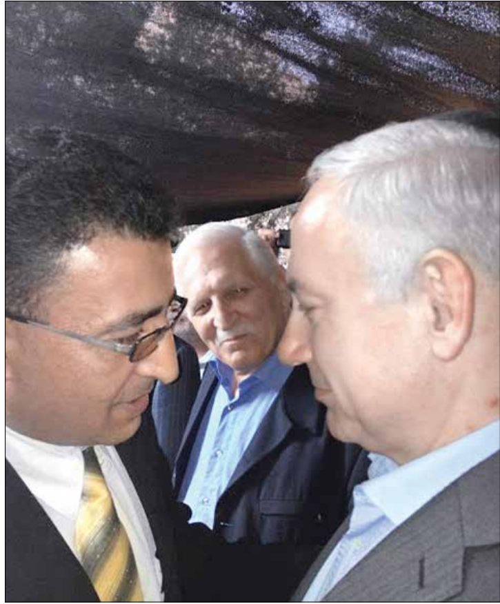
صفدي يتهم حزب الله وسوريا بقرصنة ملفاته

أيد نحو 60% من عينة الاستطلاع الذي أجراه «مركز بيروت للأبحاث والمعلومات» قتال حزب الله ضد الجماعات التكفيرية على الحدود الشرقية. ورداً على سؤال: هل ترى أن ما يقوم به حزب الله في القلمون والسلسلة الشرقية يساهم في حماية المناطق اللبنانية، أجاب 57% من المستطلعين بـ «نعم»، و27,5% بـ «كلا»، فيما لم يعط 15,5 في المئة جواباً عن السؤال.